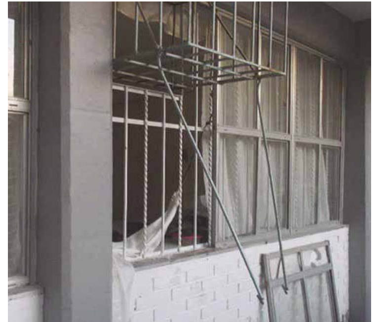
Los presuntos ladrones se llevaron tres minisplit y otros aparatos.

Posteriormente se encargaron de trasladar el cadáver del Hospital General al anfiteatro del Centro Integral de Procuración de Justicia del Estado para la autopsia de ley.