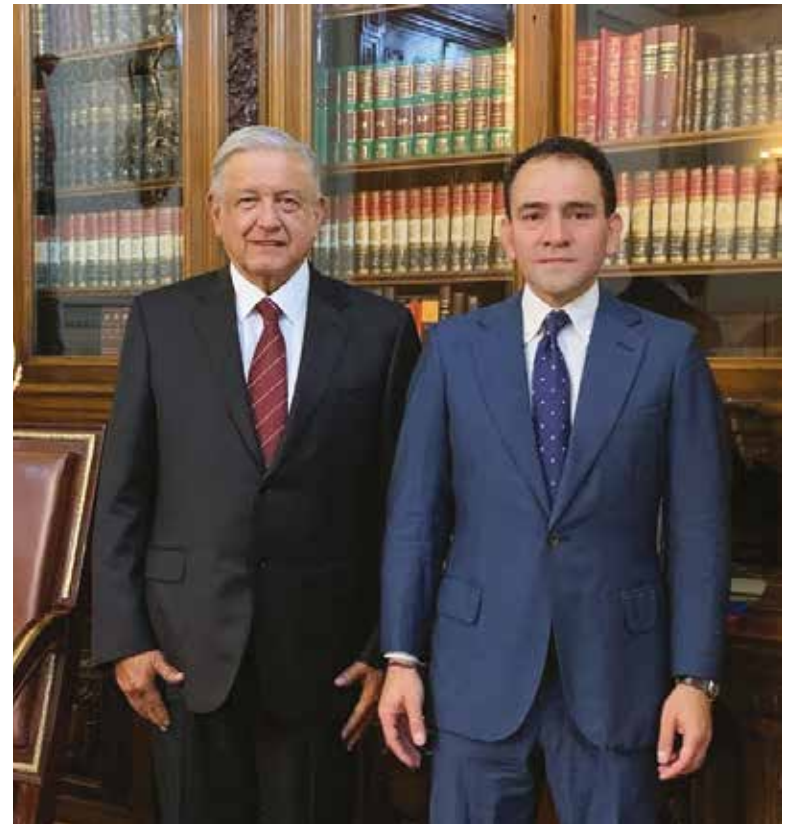
En julio Arturo Herrera fue nominado ante el Senado por López Obrador, para que encabezara Banxico.

Luego de la cancelación de la propuesta de Arturo Herrera, los