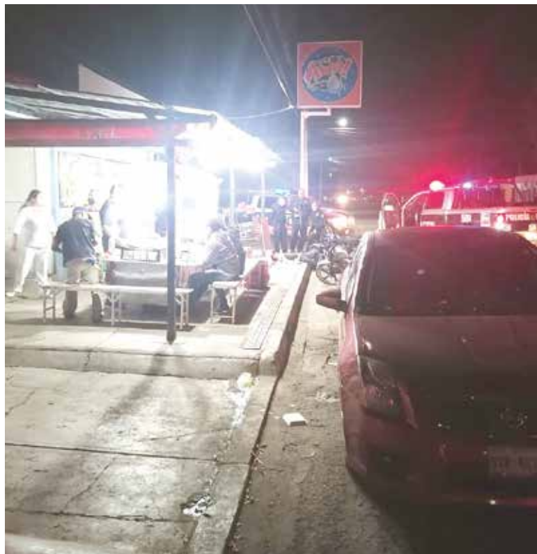
De manera urgente el joven fue trasladado a un nosocomio de la localidad.

El motociclista, expresó ante elementos de la Policía Municipal y Estatal de Seguridad Públi-