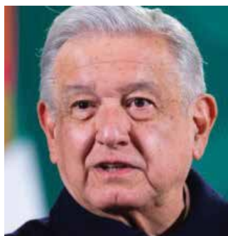
Andrés Manuel López Obrador