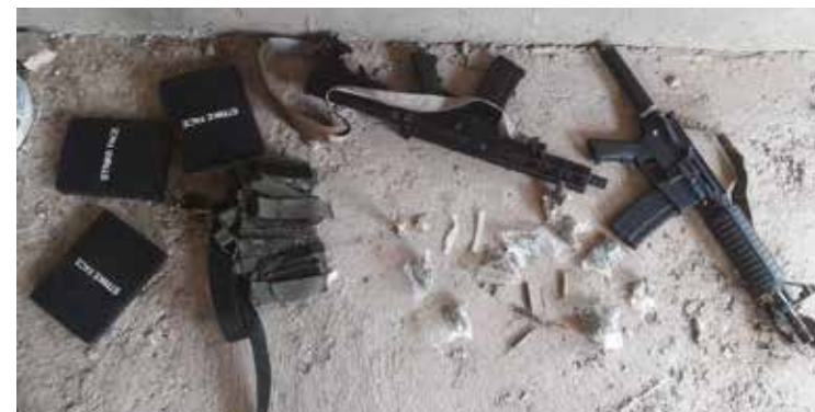
Las armas, chalecos y cargadores quedaron a disposición de las autoridades correspondientes.

De esta forma, fue llevado a un centro hospitalario donde quedó bajo observación médica.