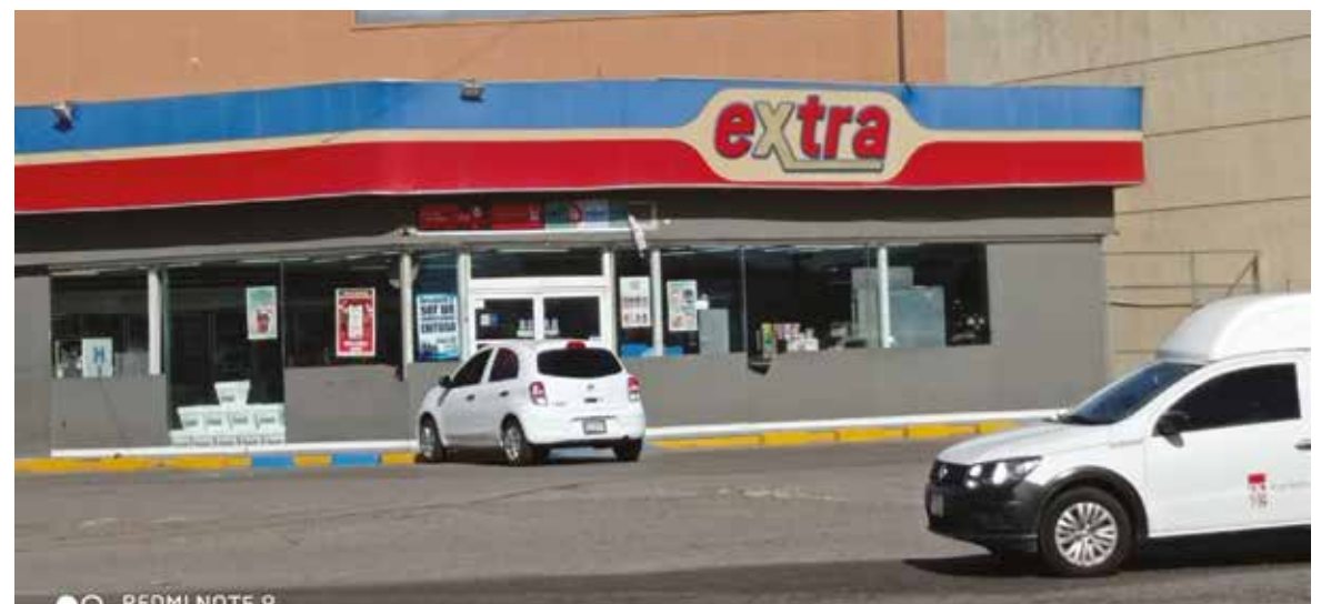
El ladrón se llevó la suma de dos mil 500 pesos.

chocolates, botellas de vino, una bocina pequeña y cajas con preservativos.