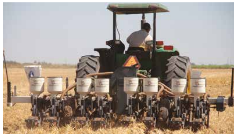
La fecha óptima del cártamo va del 15 de diciembre al 15 de febrero en caso del suelo de Aluvión.

der a las zonas preferenciales para el desarrollo de los territorios”, destacó la funcionaria estatal.