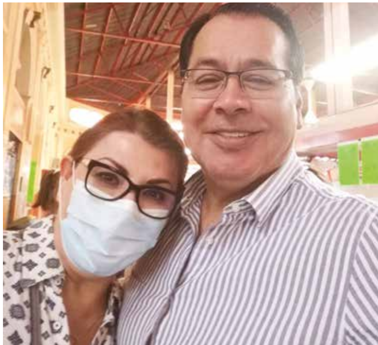
La cita del exalcalde de Cajeme estaba pactada a las 10:00 de la mañana, por lo que se le esperó durante 10 minutos, mismos en el cual se clausuró la primera comparecencia del día.