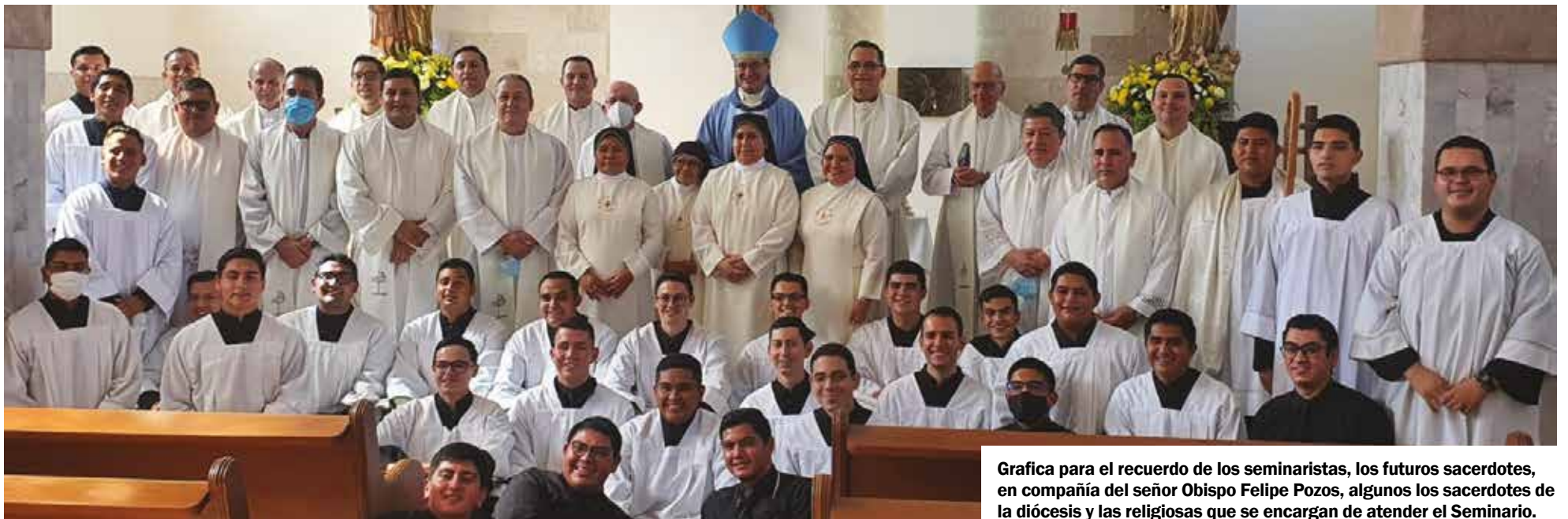
Grafica para el recuerdo de los seminaristas, los futuros sacerdotes, en compañía del señor Obispo Felipe Pozos, algunos los sacerdotes de la diócesis y las religiosas que se encargan de atender el Seminario.