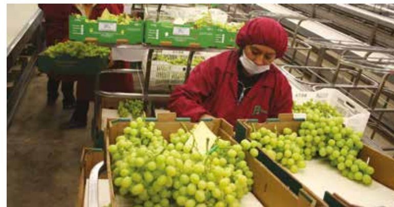
la balanza comercial agroalimentaria de México con Emiratos Árabes Unidos registró un superávit de 42 millones de dólares.

El funcionario federal señaló la importancia de avanzar en protocolos sanitarios, áreas de inver-