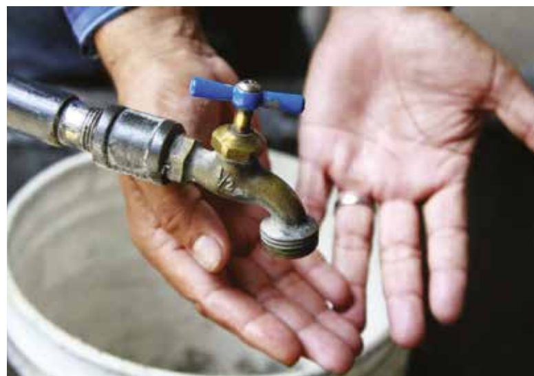
Se registrarán bajas presiones en el servicio de agua potable.