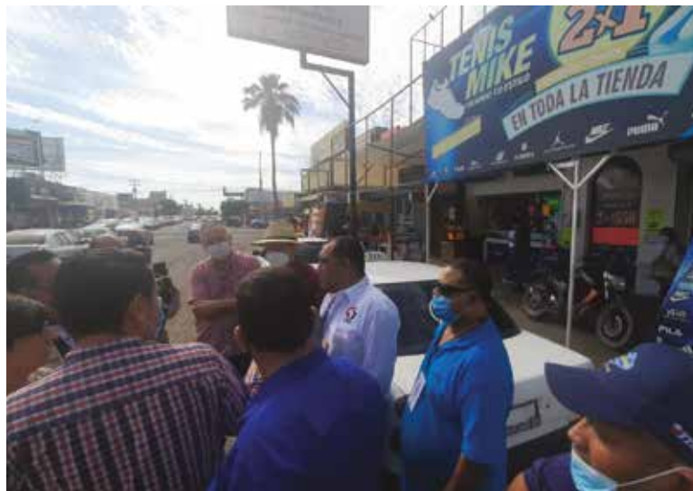
Se han detenido o infracciones a vehículos colectivos, aun cuando el acuerdo era que seguirían trabajando por la No Reección y Sinaloa.

"Hace escasos dos meses tuvimos una reunión en Seguridad Pública, con el Capitán Taragon y el coman-