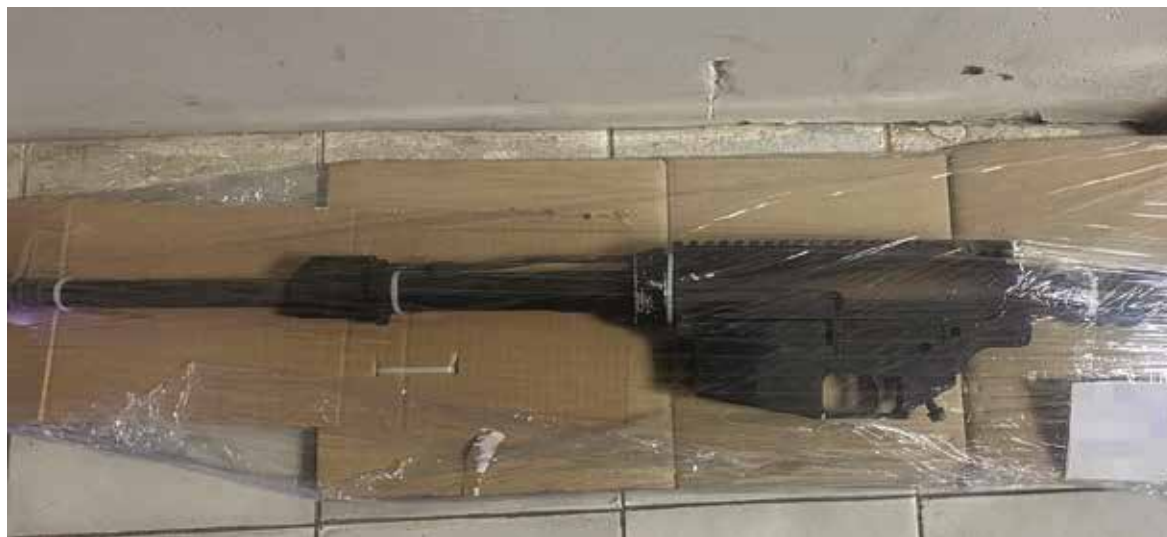
Un vehículo fue localizado cargado con armas de fuego, cartuchos y ropa táctica.