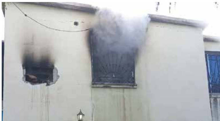
Madre e hijo lograron ponerse a salvo del fuego en el fraccionamiento Los Algodones.

No se detallaron los daños que dejó el fuego que puso en jaque a los vecinos del módulo habitacional.