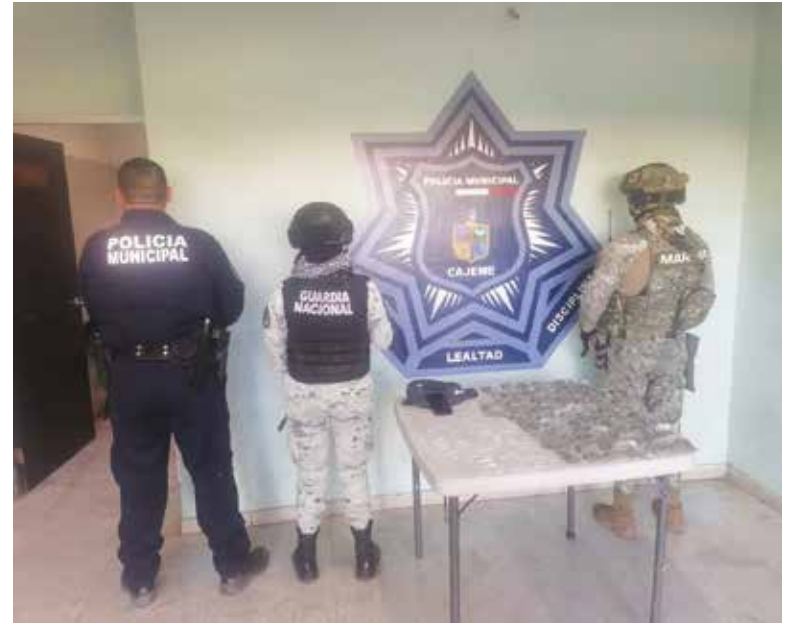
Se aseguraron 51 envoltorios con 'crystal' y 79 conteniendo marihuana.

busto, moreno, de unos 25 años, quien vestía playera blanca, pantalón de mezclilla y cachucha negra.