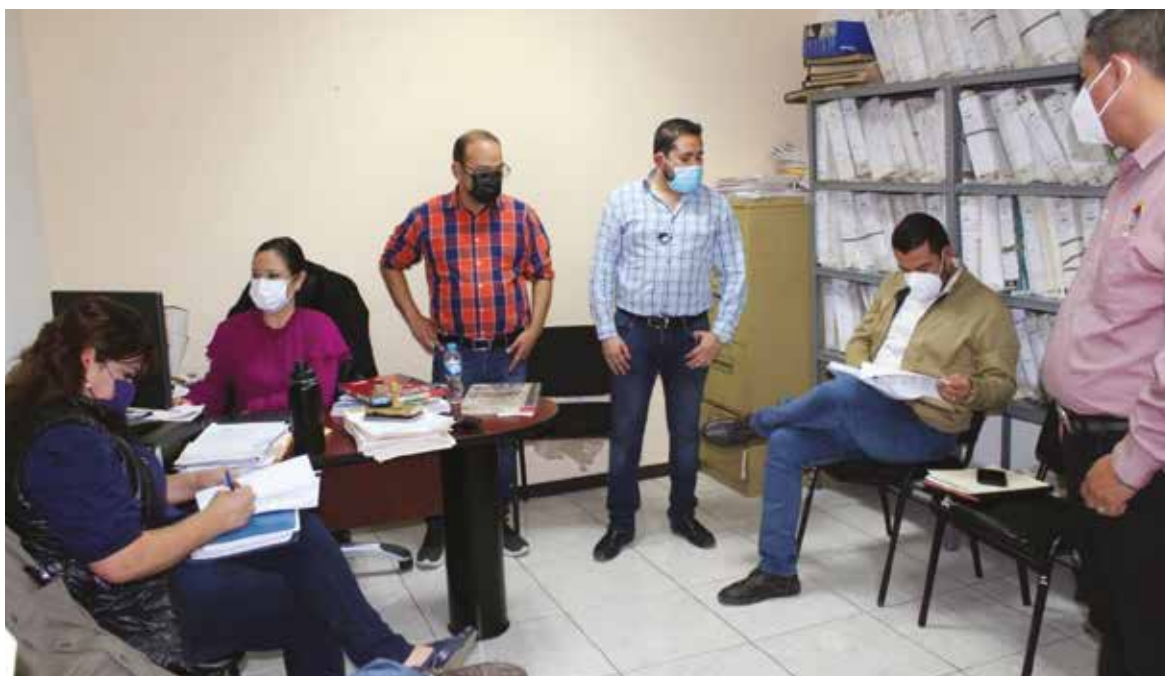
Después de más de tres días se llegó a un acuerdo entre el sindicato y el Organismo.

El aumento conseguido fue del 6% al salario para los que ganan menos de 13 mil pesos mensuales y un 2.5% para los que ganan más de dicha cantidad; además, un bono por 3.3% de sueldo durante todo el 2022 para integrarse al sueldo en el 2023 un 2.5%