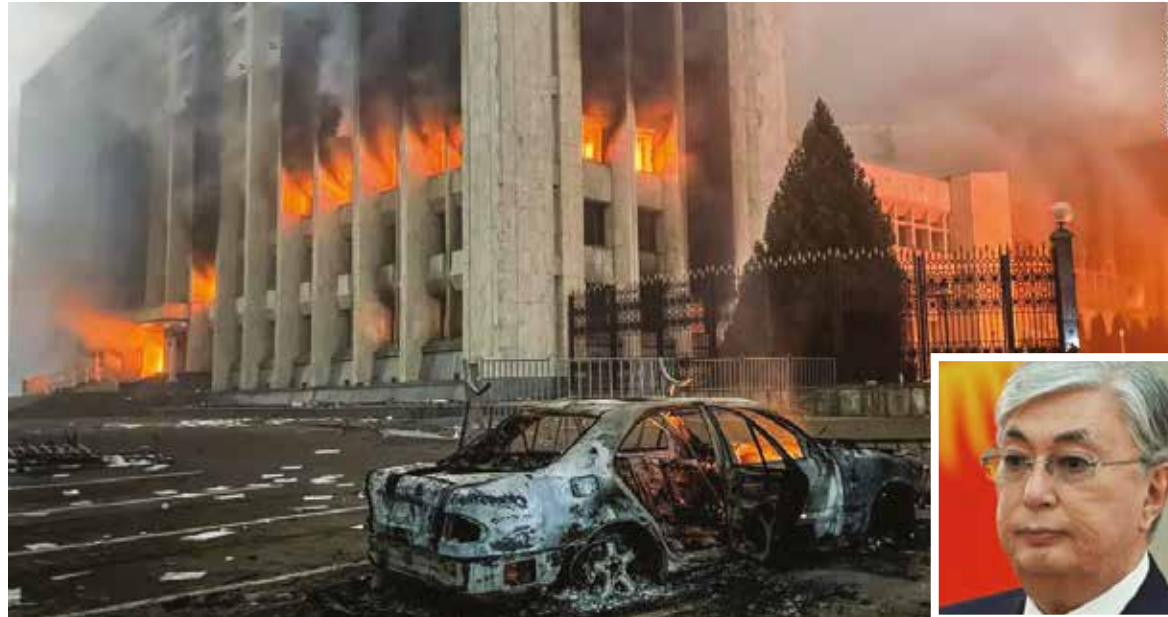
El presidente de Kazajistán, Kasim Jomart Tokayev, tildó de "estupidez" los llamamientos "desde el extranjero" para un diálogo y rechaza "negociar con criminales". El Ministerio del Interior informó de 26 manifestantes muertos y casi cuatro mil detenidos en relación con los disturbios.

"He ordenado a los cuerpos de seguridad y al Ejército que disparen a matar sin advertencia", manifestó el mandatario durante un discurso a la nación, en el que descartó negociar con los manifestantes, recogió el portal kazajo