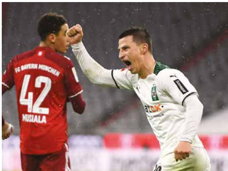
Borussia Mönchengladbach aprovechó las bajas del Bayern Múnich para llevarse la victoria.

El polaco Robert Lewandowski adelantó al Bayern Múnich en el minuto 18 pero los visitantes remontaron poco después, con goles de Florian Neuhaus (27) y Stefan Lainer (31).