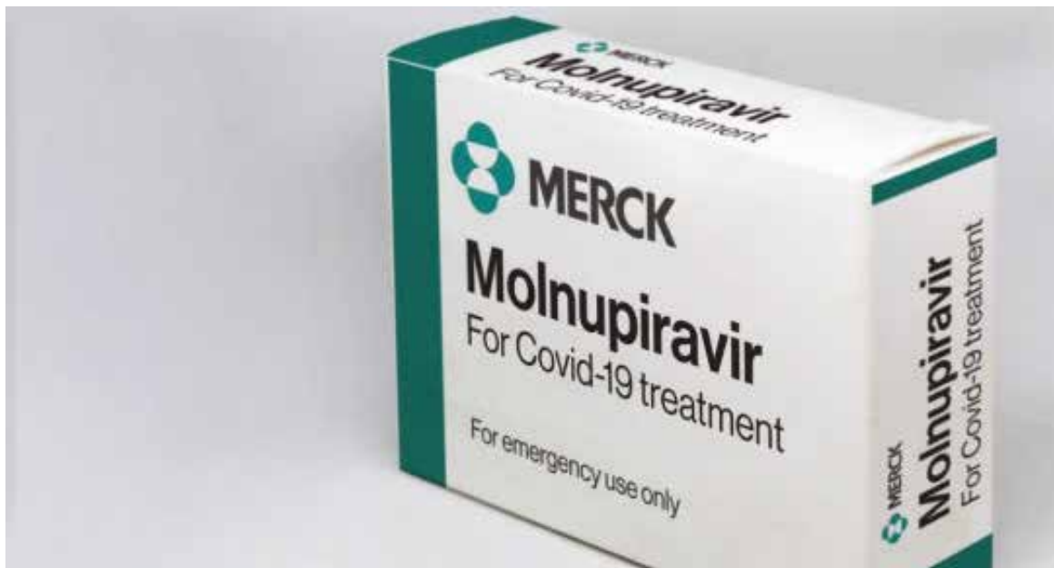
La Cofepris autorizó para su uso de emergencia la píldora molnupiravir, la cual está indicada para pacientes con Covid-19.

El proceso de aprobación comenzó la semana del 23 de diciembre de 2021, cuando se tuvo