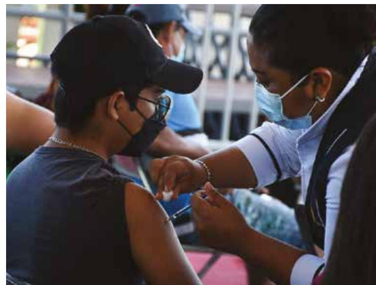
Se modifica fecha de aplicación de segunda dosis Covid-19 a menores de 15 a 17 años en Hermosillo.