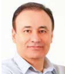
Alfonso Durazo Montañón