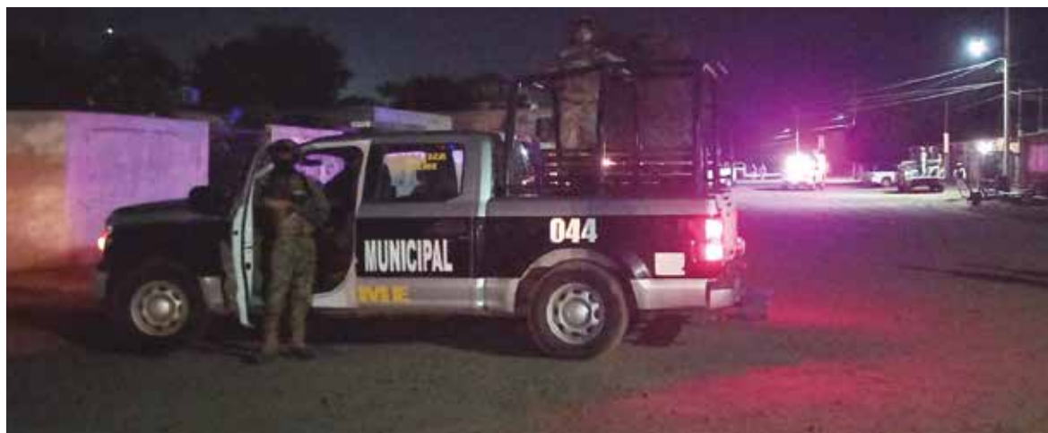
Elementos policiacos se movilizaron al sitio para tomar nota del violento episodio.

Inmediatamente después, se retiró a toda carrera por la Ejército Nacional al poniente donde se perdió de vista. De momento, no se estableció el monto del dinero robado, ya que para ello requerían hacer un arqueo.