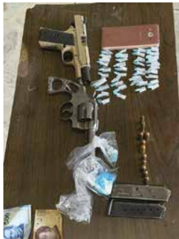
Se aseguraron una pistola revólver calibre 357 magnum, con cartuchos útiles; una pistola escuadra calibre 45 con dos cargadores y varios envoltorios con droga.