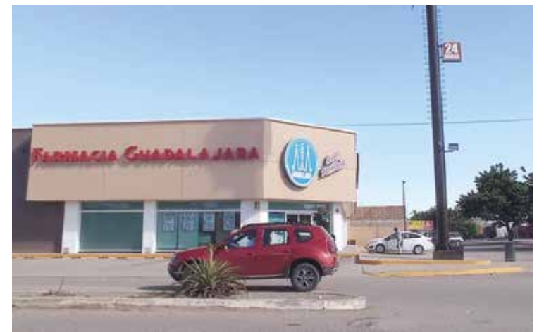
El delictivo episodio se produjo poco antes de la 1:00 de la mañana, en calles Ejército Nacional y Topacio.

De esta forma, se movilizaron elementos policiacos para atender su denuncia y elaborar el respectivo Informe Policial Homologado.