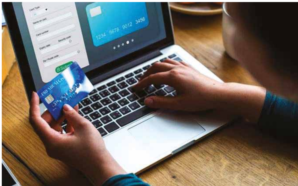
El comercio electrónico en el país ha presentado un crecimiento.

Por último, la titular de la Condusef en Sonora, explicó que en cuanto al importe o monto promedio de los pagos por compras en comercio electrónico, debe decirse que los cubiertos con Tarjeta de Crédito son mayores que los pagados con Tarjeta de Débito, que el monto promedio para la TC fue $976 pesos y el promedio de la TD de $408 pesos.