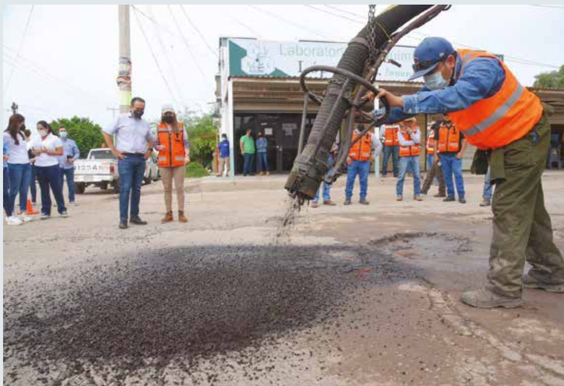
Más de 90 mil baches del 1 millón que se tienen estimados en Hermosillo han logrado ser reparados.

Astiazarán Gutiérrez espera que los fallos de las primeras licitaciones de este programa con paquetes de 50 millones de pesos cada uno de ellos para arrancar con las obras.