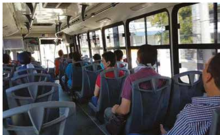
Espera prolongadas y falta de capacitación a operadores, entre las deficiencias en el transporte urbano.