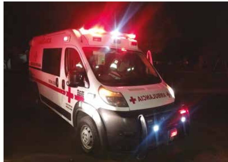
Luego de la agresión el lesionado fue auxiliado y trasladado por sus familiares en un vehículo particular, al área de urgencias del Hospital General.