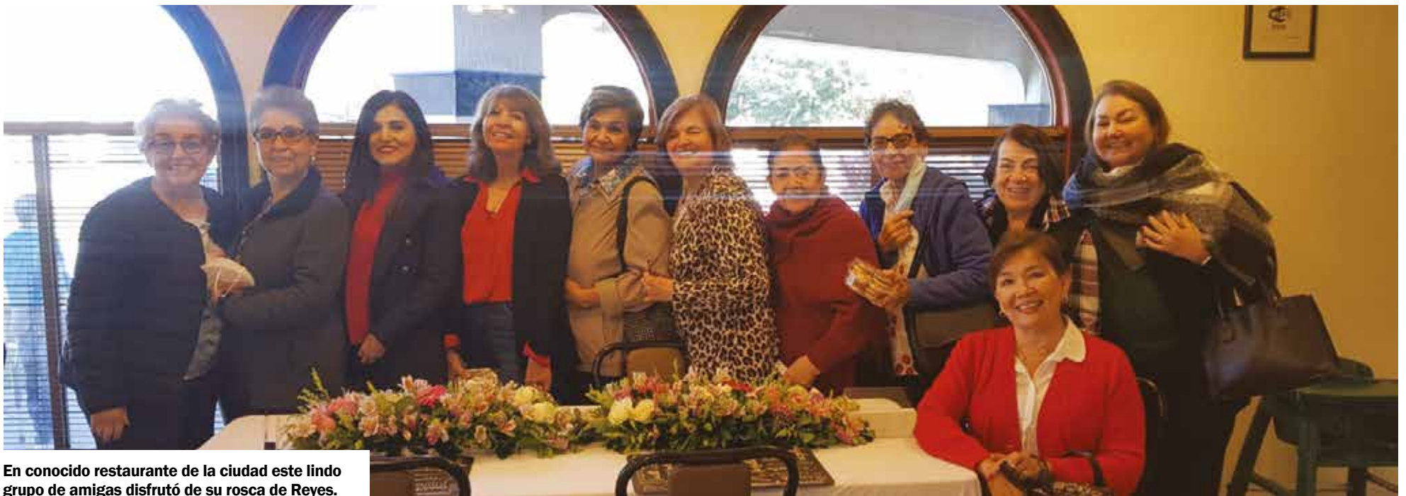
En conocido restaurante de la ciudad este lindo grupo de amigas disfrutó de su rosca de Reyes.