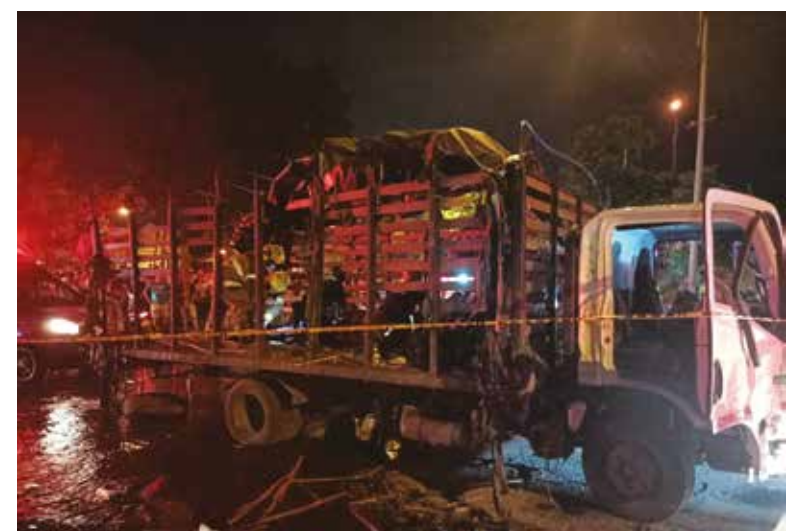
A través de videos, habitantes del sector mostraron que el hecho dejó varios uniformados con heridas de consideración. Ya se ofreció una recompensa para dar con los responsables del suceso.

Dos de los heridos tienen heridas de gravedad, según detalló el