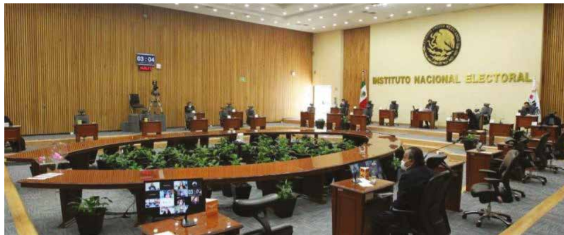
El secretario Adán Augusto López presentó el plan de austeridad para que el INE pueda realizar con cabalidad el ejercicio, al margen de si obtiene o no una ampliación en su presupuesto.

‘Hay que evidenciar que, por ejemplo, quien hace estas pro-