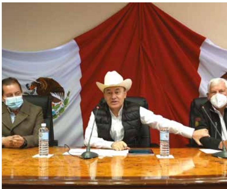
Con la construcción de un rastro Tipo TIF en Agua Prieta, Sonora contará con una instalación única a nivel nacional dio a conocer el gobernador Alfonso Durazo Montaño.

“El objetivo es que nos sirva este rastro para impulsar el beneficio económico en toda esta región ganadera, que vamos a de-