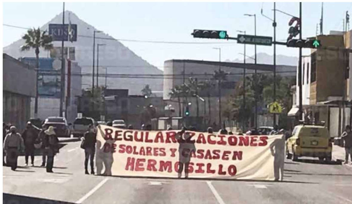
Cerca de 40 personas se plantaron la mañana del jueves en el cruce de la avenida Hidalgo, quienes piden la regularización de terrenos ejidales en Hermosillo y Bahía de Kino.

El propósito de esta manifestación es poder escriturar los terrenos para poder contratar servicios, como drenaje, agua potable, energía eléctrica, pues en algunos de ellos no los tienen.