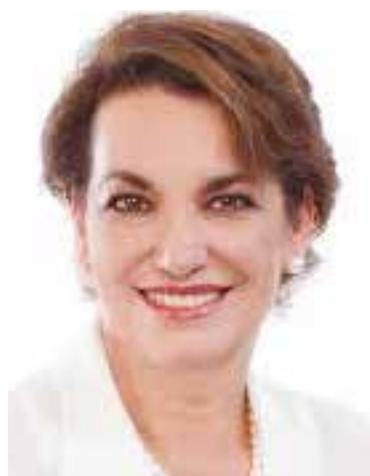
María Dolores del Río Sánchez