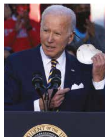
Biden buscaba que los empleados de todas las compañías que tengan 100 trabajadores o más se vacunarán.

El revés a Biden contó con el apoyo de los seis jueces de la mayoría conservadora en la corte de más alto nivel de EU, mientras que los tres progresistas emitieron una opinión contraria a la decisión. El argumento usado por el tribunal para tumbear la medida fue que el Gobierno federal no dispone de suficiente autoridad como para emitir una orden de estas características, tal y como apuntaban los grupos empresariales y los estados demandantes. "(El mandato) es una invasión