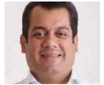
Sergio Gutiérrez Luna