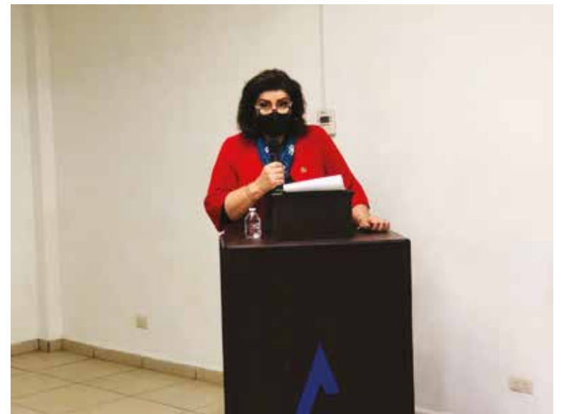
Llamas Ascencio indicó que su estrategia estará basada en el impulso y mejora de los servicios que presta la cámara a sus integrantes.