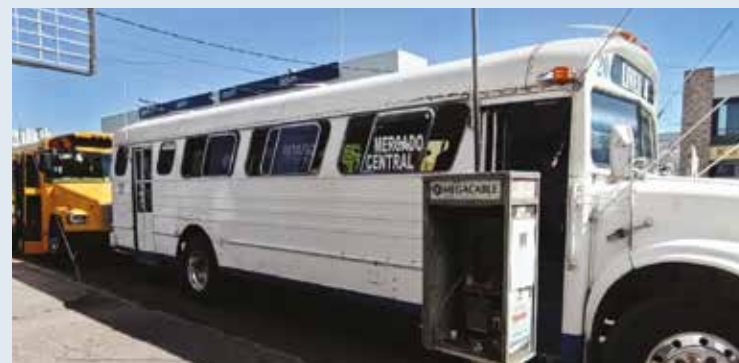
En la actualidad están enfrentando una situación difícil, ya que alrededor de 90 camiones son emergentes.

El dirigente obrero insistió que ante esta situación es complicado para ellos tener un