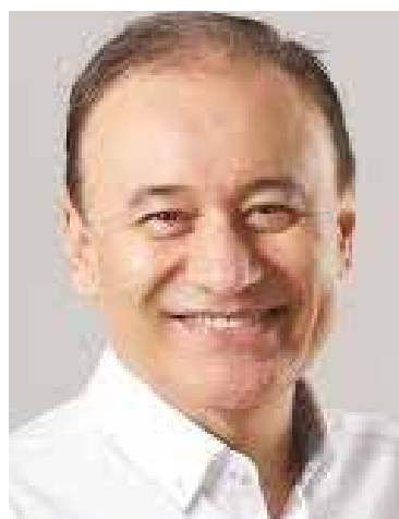
Alfonso Durazo Montaño