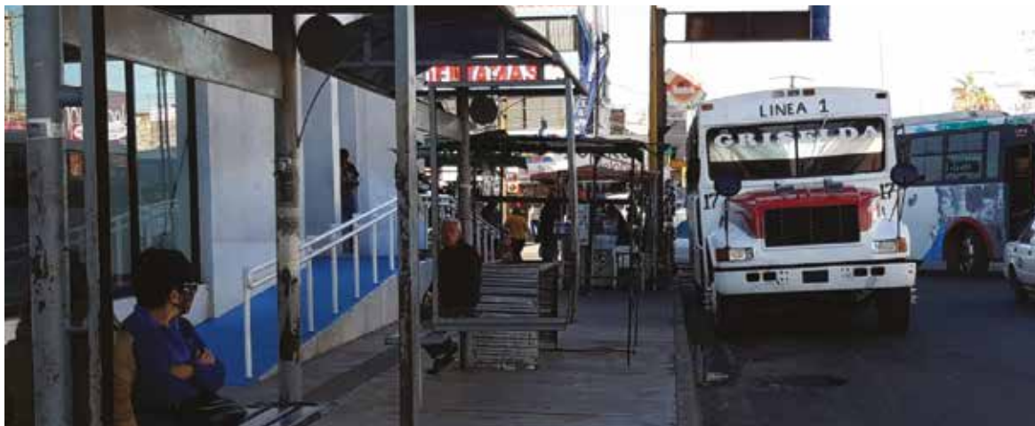
Pese al incremento de casos, cada vez es más común ver a la gente relajando las medidas sanitarias.

Mientras que los casos de Covid-19 se disparan en el municipio de Cajeme, los conductores del transporte urbano están incumpliendo con los protocolos que el Comité Municipal Anticovid ha anunciado, en el sentido de que se deben de tomar medidas preventivas para evitar la propagación de la epidemia.