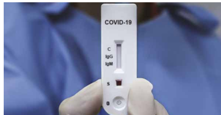
Escases de pruebas rápidas y otros productos es la que reportan diferentes tiendas Covid.