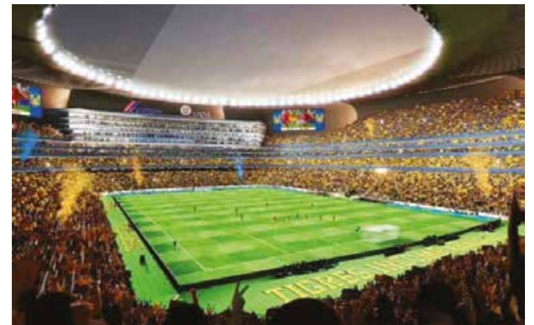
El estadio costará aproximadamente 320 mdd.

Athletic intentará conquistar por primera vez la Supercopa en ediciones consecutivas. La anterior ocasión que la ganó antes del año pasado fue en 2015, cuando también se impuso a Barcelona en la final.