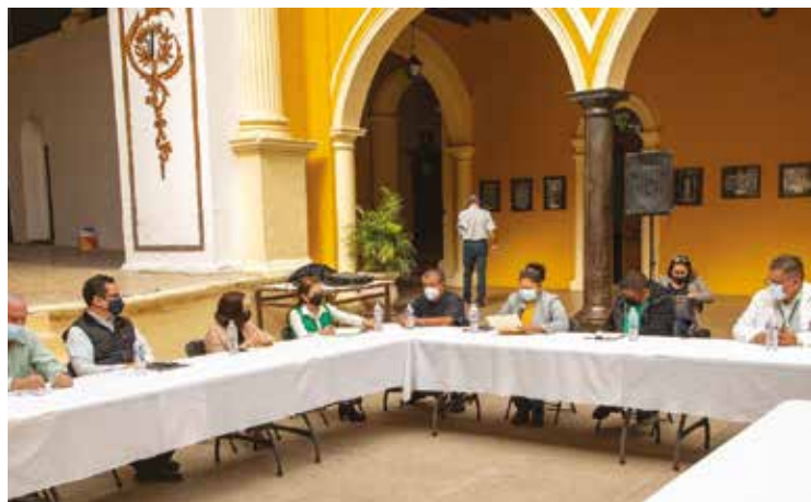
Activó la Secretaría de Salud un operativo especial en el municipio de Álamos para monitorear comportamiento de contagios.

Los interesados en registrar sus automóviles ante el Repuve pueden agendar cita al teléfono 662 289 91 20 o visitar los módulos en Hermosillo (ubicados en las agencias fiscales en el CUM y Parque Industrial), Cajeme y Navjoa (al interior de las Agencias Fiscales), de lunes a viernes de 8:00 a 15:00 horas y sábados de 9:00 a 13:00 horas.