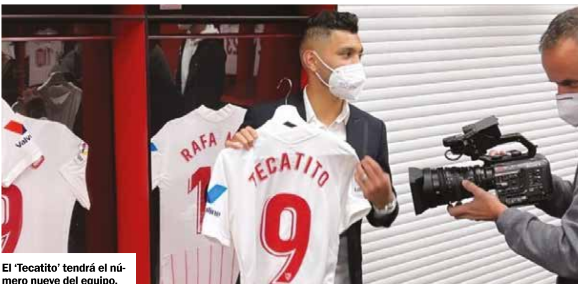
El 'Tecatito' tendrá el número nueve del equipo.

Este será el tercer equipo europeo en el que milita el regio, pues ya pasó por Twente y Porto.