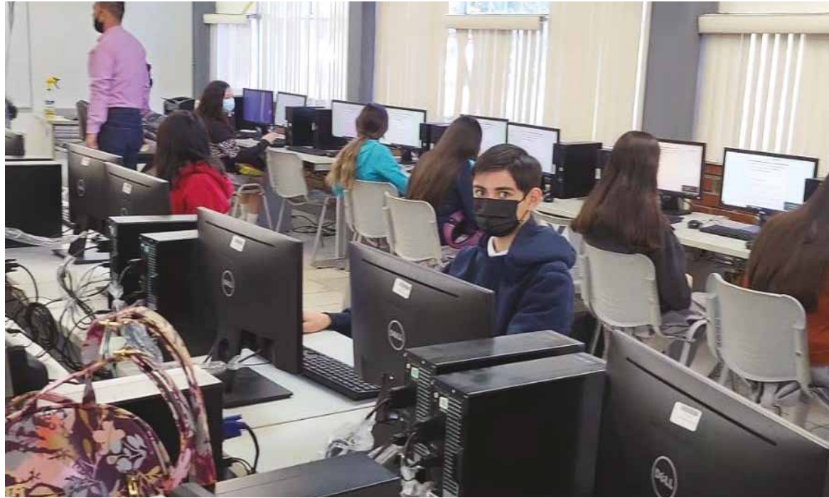
En el examen interno Planea 2021, Sonora obtuvo la calificación más alta, por arriba de las instituciones participantes de 27 entidades federativas del país.

Esta evaluación, explicó, es con la intención de que las y los docentes en colegiado diseñen