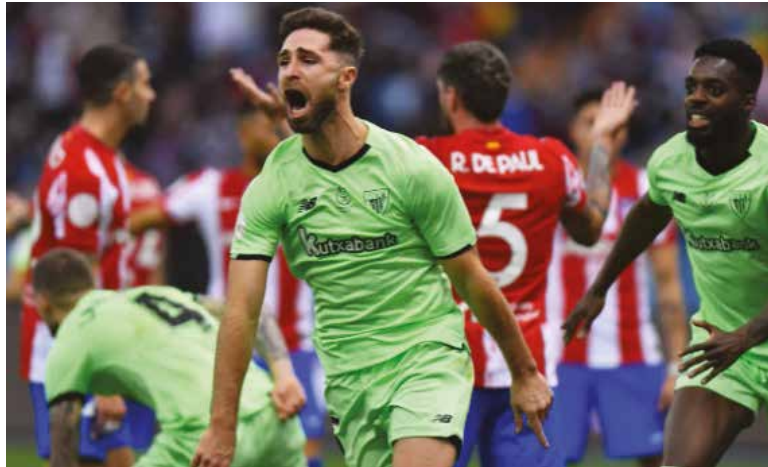
En un gran partido el Athletic logró remontar para ganar 2-1 al Atlético de Madrid.

El Athletic se medirá en la final al Real Madrid, que el miércoles