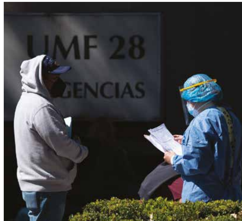
Empleadores deben reconocer Permiso Covid como incapacidad laboral: Secretaría del Trabajo e IMSS.

Indicó que desde el lunes 10 de enero se puede realizar el