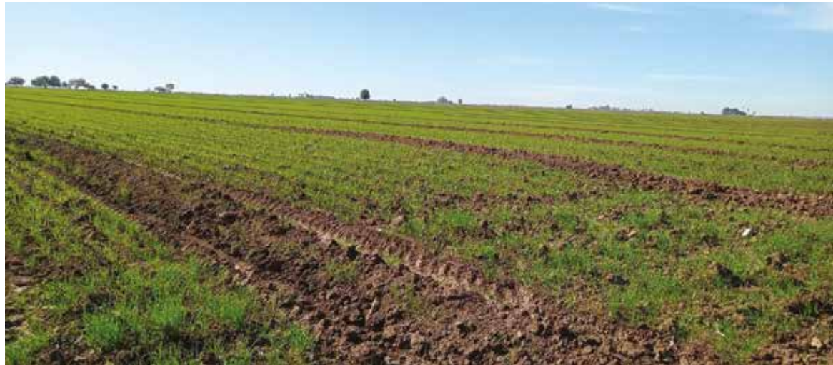
En lo que se refiere al número de beneficiarios con crédito, se registraron más de 6,856.

“El año pasado lo cerramos con 6,409 millones de pesos de saldos de cartera, pero la derrama real de flujo de recursos fue de más de