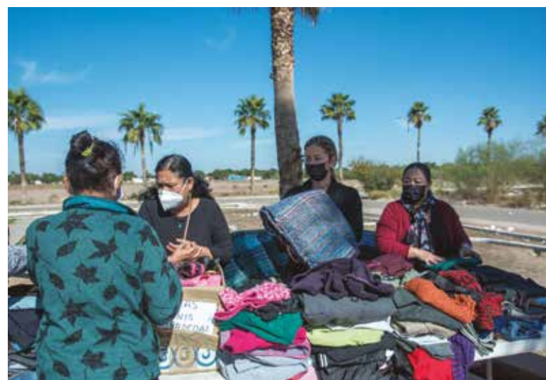
El equipo DIF llevó a cabo un recorrido a través de distintas colonias del municipio, como son colonia Urbi Villas del Real, Rodeo 1, Rodeo 3 y las Malvinas.

creada para servir, ayudar y ver por el bienestar de la comunidad. Y dentro existe el voluntariado, para que cuando ustedes sepan del caso de una niña o niño que está en calle y necesita ayuda, o sepan de un adulto mayor desamparado, nos lo hagan saber para darle la atención