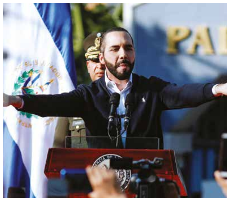
Nayib Bukele tiene un 81 por ciento de aprobación.

A mediados del pasado 2021, el presidente mexicano presumió en una de sus habituales conferencias matutinas que encabezaba el listado de Morning Consult como el presidente con mayor aceptación en todo el mundo. Pero para este inicio de año, su homólogo de la India ocupa el primer puesto del mismo ranking. Además, en esa ocasión, en