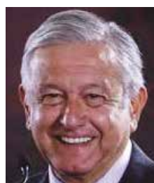
Andrés López Obrador