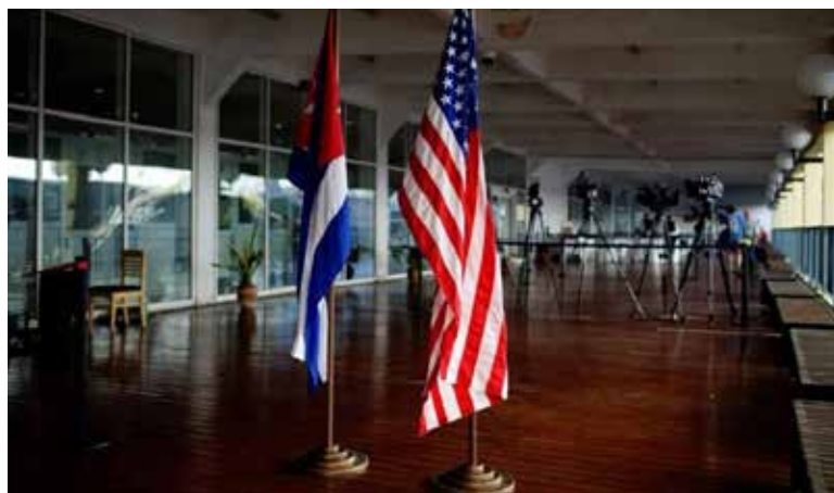
El gobierno de Estados Unidos anunció que levantará el tope para las remesas familiares, previamente establecido en 1,000 dólares por trimestre, además de aumentar drásticamente el procesamiento de visas estadounidenses para cubanos.

Durante una entrevista con Aristegui en Vivo, señaló que la idea de aquel acuerdo era relajar las sanciones y restablecer los vínculos diplomáticos. Sin embargo, la entrada al poder de Donald Trump hizo que éstos se suspendieran casi totalmente, luego de las sanciones impuestas tras el llamado síndrome de La Habana, sobre supuestos ataques acústi-