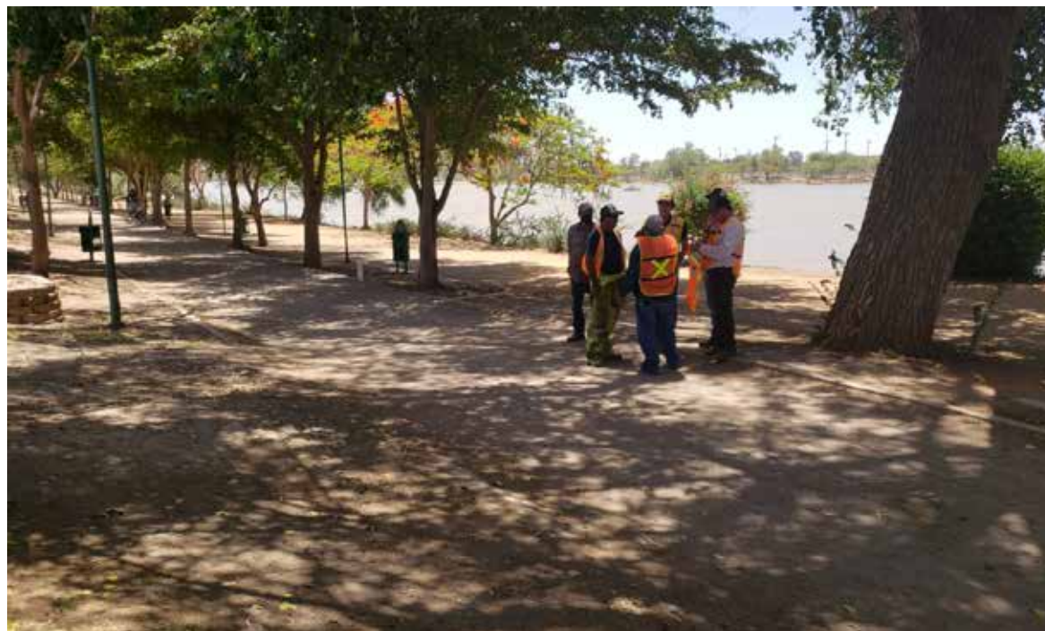
El alcalde de Cajeme dio el banderazo para la reconstrucción de pavimento y construcción de drenaje pluvial.

'Hay que respetar los señalamientos y los estamos poniendo