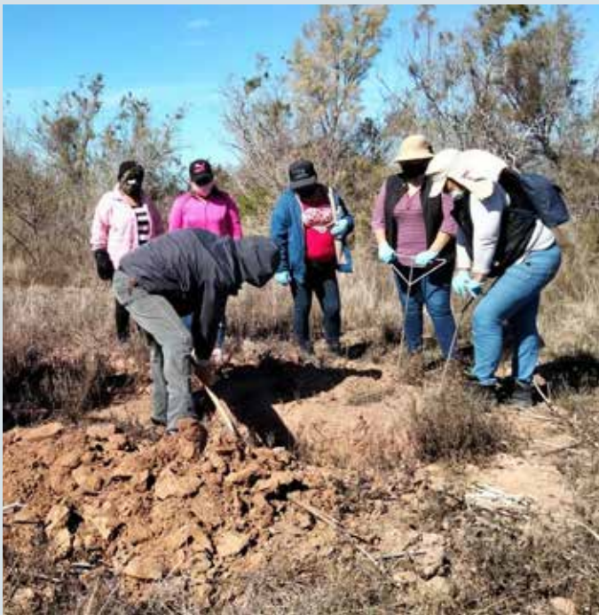
El Colectivo de Madres Buscadoras de Sonora, sigue con sus acciones de rastreo hasta lograr localizar a sus seres queridos.