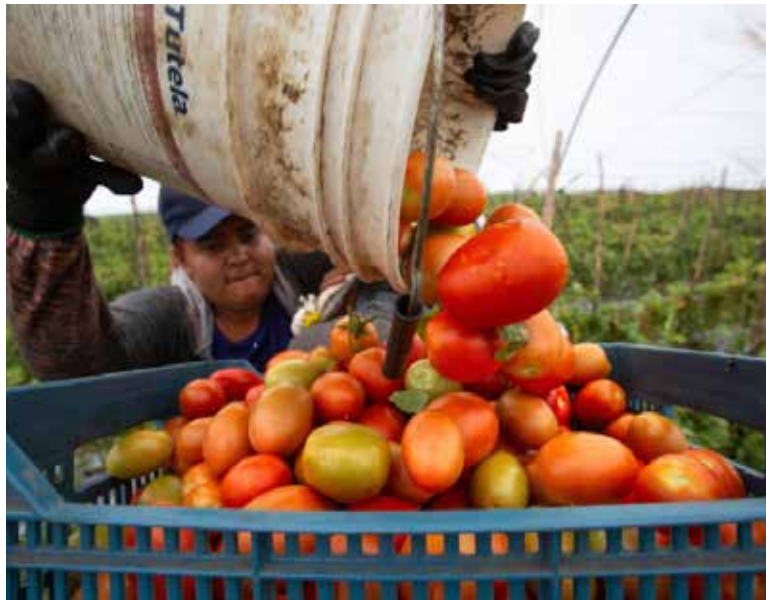
Los altos costos de producción es una situación que está ‘golpeando’ a los productores de tomate en la entidad.

das previstas en el decreto no releva a los importadores de la obligación de cumplir con todas las regulaciones y restricciones no arancelarias de las mercancías, así como con las características de calidad y eficacia necesarias para proteger la vida y la seguridad de las personas, particularmente, las aplicables en el ámbito fitosanitario y zoonosanitario.