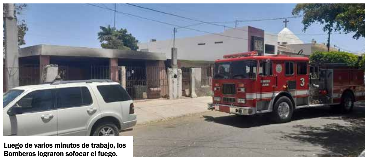
Luego de varios minutos de trabajo, los Bomberos lograron sofocar el fuego.

Se informó que las pérdidas materiales ascendieron aproximadamente a unos 15 mil pesos.