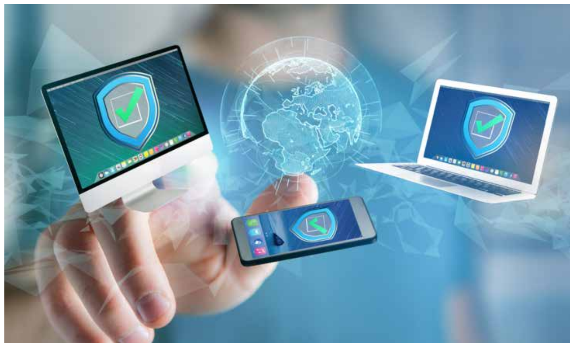
en el marco del Día Mundial del Internet, través de la Unidad Cibernética, realiza acciones permanentes mediante las cuales busca prevenir que los sonorenses sean víctimas de delitos.

Para asesorías, la Unidad tiene disponible para las y los ciudadanos la línea 800-77-CIBER (24237) y el correo electrónico ciberssp@sonora.gob.mx.