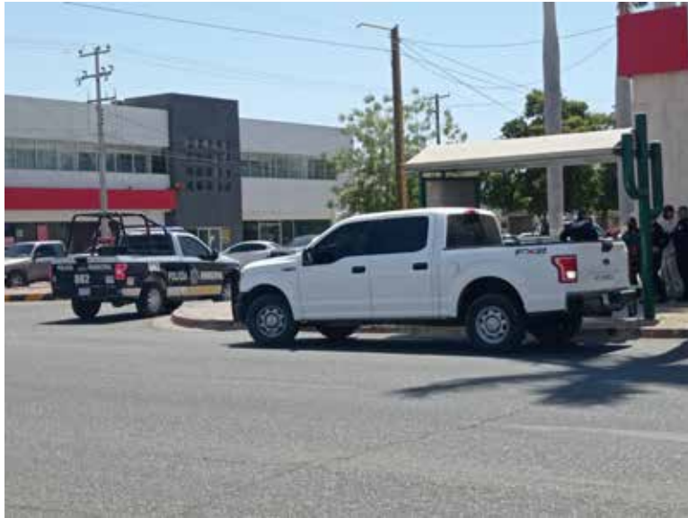
Elementos policiacos ya iniciaron con las investigaciones del atraco.

De acuerdo al encargado de la estación de servicios, momentos después de arribar frente a la sucursal bancaria sobre la Yaqui acera sur a bordo de un automóvil, marca Honda, color gris, modelo 2012, le cerró el paso un pick up Dodge Ram, gris, cuatro puer-