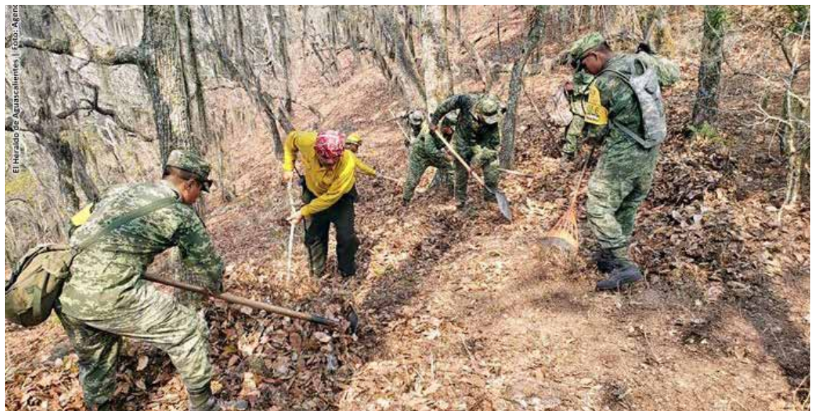
Elementos adscritos a la Cuarta Zona Militar seguirán con las acciones de combate en los incendios forestales con la aplicación del Plan DN-III-E.

Morán González, recordó que durante esta época de estiaje es importante que los ciudadanos cuiden sus prácticas, al momento de estar realizando algún tipo de actividad en las áreas boscosas, para evitar riesgos de incendios.