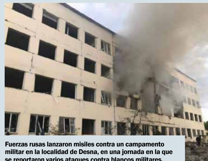
Fuerzas rusas lanzaron misiles contra un campamento militar en la localidad de Desna, en una jornada en la que se reportaron varios ataques contra blancos militares.

Por su parte, el ministerio de Defensa ruso informó que misiles superficie-superficie Kalibr habían atacado la estación de Starytshi, cerca de esta base en el distrito de Iavoriv, "eliminando reservistas en formación, armas extranjeras y equipos militares de Estados Unidos y de países europeos que iban a ser enviados a Donbás".