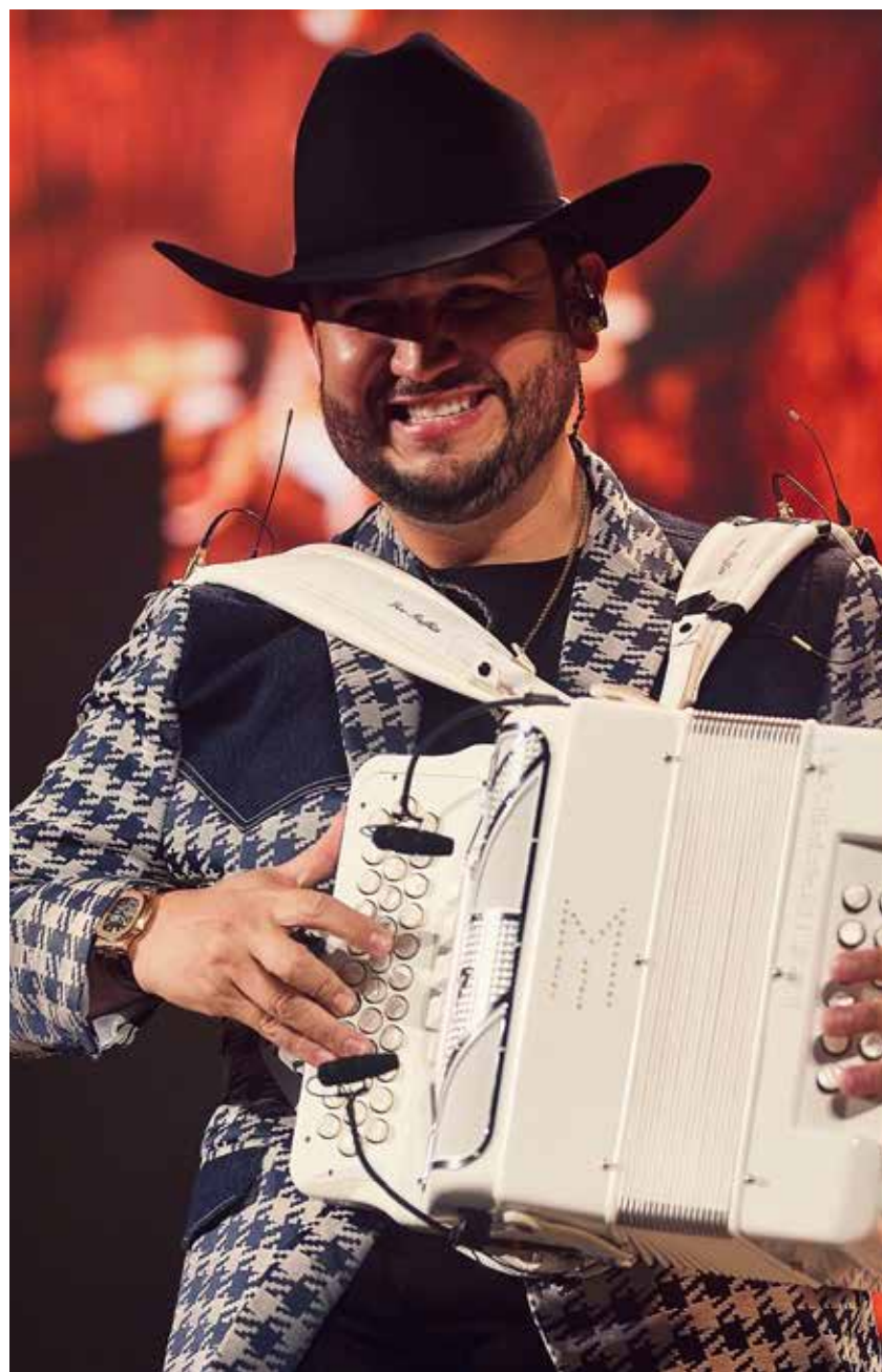
Pese a ser presa de un ataque de nervios antes de debutar como solista, el cantante y compositor Edén Muñoz supo ganarse el respeto y la admiración de quienes el 11 de mayo abarrotaron el palenque de Puebla.

Pese a contar con una larga trayectoria y bastante experiencia arriba del escenario, Edén Muñoz se preparó para su debut en solitario participando en algunas presentaciones que la banda 'MS' ofreció en algunas ciudades de Estados Unidos, con quienes compartió micrófonos, recibiendo en todo momento el apoyo de sus admiradores, por lo que su primera presentación como solista fue muy bien recibido por todos ellos, razón por la que el cantante y