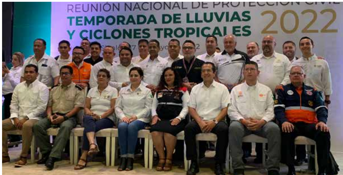
Se celebró en Mazatlán la Reunión Nacional de Protección Civil, Temporada de Lluvias y Ciclones Tropicales 2022.