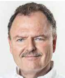
Ernesto Gándara Camou