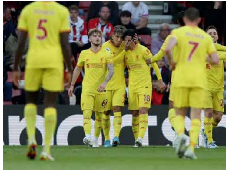
Liverpool evitó que el Manchester City se coronara en Inglaterra este martes.

Los 'Reds' no podían perder si no querían que los 'Citizens' se proclamaran campeones este mismo martes, en el cierre de la 37ª fecha, pero comenzaron perdiendo en Southampton tras el tanto inicial para los locales de Nathan Redmond (13).