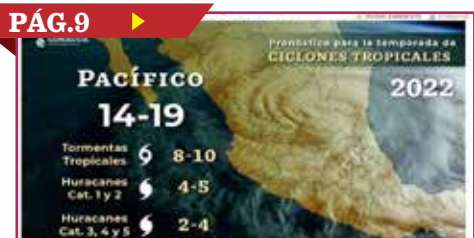
LISTO SONORA PARA LA TEMPORADA DE LLUVIAS