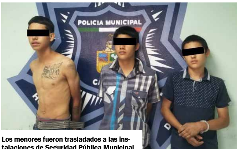
Los menores fueron trasladados a las instalaciones de Seguridad Pública Municipal.

De esta forma, quedó al descubierto que se trataba de polvo de ladrillo rojizo y esto originó que despidiera el color rojizo como si se tratara de sangre lo que por momentos provocó un ambiente de tensión. Ello debido a que se temía que se tratara de algún cuerpo o restos humanos por eso se produjo la movilización.