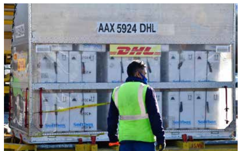
La Presidencia de la República argumentó seguridad nacional al considerar que liberar los contratos afectaba al gobierno.

Mientras tanto, al presunto agresor abatido se le aseguró un fusil de asalto AK-47, de los llamados 'cuerno de chivo' de calibre, 7.62 X 39 mm.