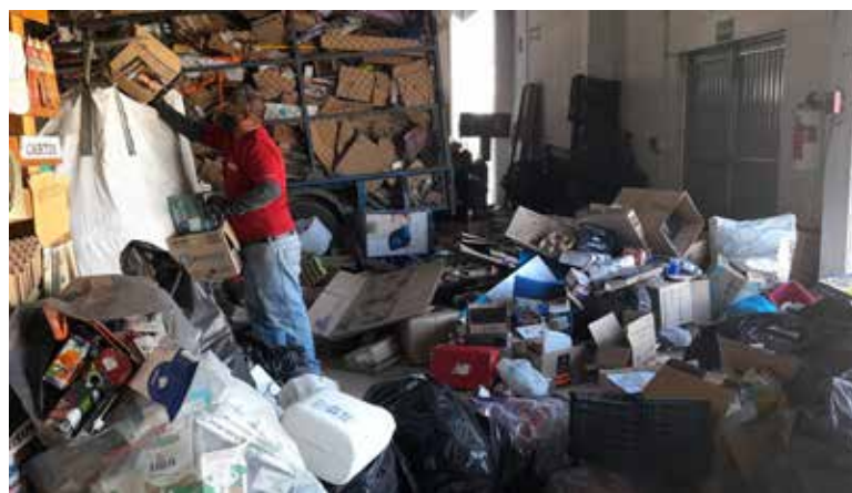
Se calcula que en Cajeme se generan alrededor de 450 a 500 toneladas de basura en un día.

Hizo el llamado a la ciudadanía a fomentar la cultura del reciclaje entre la ciudadanía, ‘que se motiven a hacer algo por su comunidad... que empiecen a fomentar esta cultura y esta educar hacia sus familiares, hijos y amigos, de lo que se debe de hacer’.