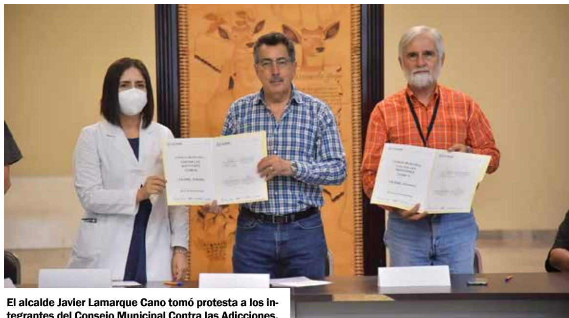
El alcalde Javier Lamarque Cano tomó protesta a los integrantes del Consejo Municipal Contra las Adicciones.

Al pronunciarse por un trabajo coordinado con los tres órdenes de gobierno, y organismos de la sociedad civil, el Presidente Municipal señaló que al ser las adicciones un tema prioritario de salud pública, en Cajeme prevalece la voluntad implementar acciones transversales y coordinadas