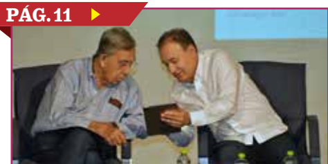
CUAUHTÉMOC CÁRDENAS PRESENTA LIBRO EN CAJEME