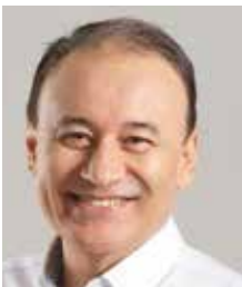
Alfonso Durazo Montañón