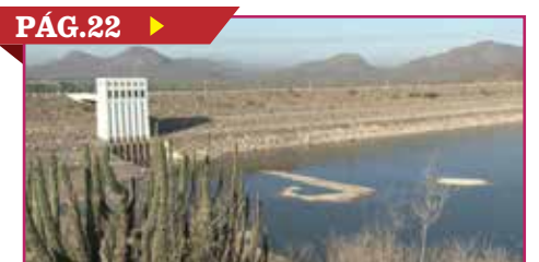
EJECUTAN A UNO EN LA PRIMERO DE MAYO