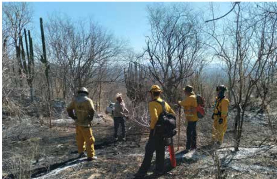
El incendio forestal en la comunidad de El Realito, en Cajeme, se encuentra prácticamente controlado, mientras que el de Agua Blanca, en Yécora, fue totalmente liquidado.

de El Realito, una de las más alejadas a la cabecera de ese municipio, ya presenta un control del 90 por ciento y una liquidación del 85 por ciento, y en ella se mantiene el trabajo de ocho brigadistas para su total mitigación.