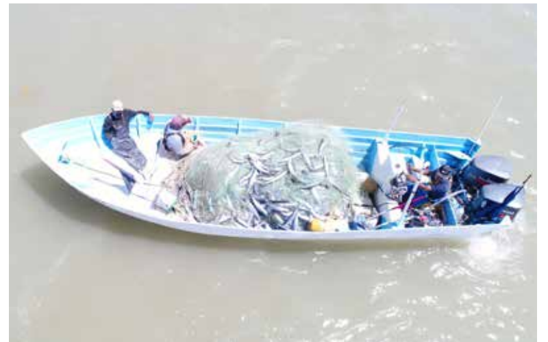
En el 2021 se logró una pesca de 3,081 toneladas de sierra.

Este pez llega a medir entre 35 y 40 centímetros al alcanzar su madurez y pesar alrededor de 2 kilos, lo que permite aprovechar su carne, que es portadora de nutrientes como minerales, vitaminas A y B, así como proteínas y grasas naturales que permiten contribuir al desarrollo del cuerpo.