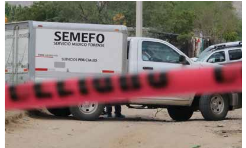
El ahora occiso se convirtió en el ejecutado número 27 de mayo.

Los elementos balísticos fueron asegurados por peritos en cri-