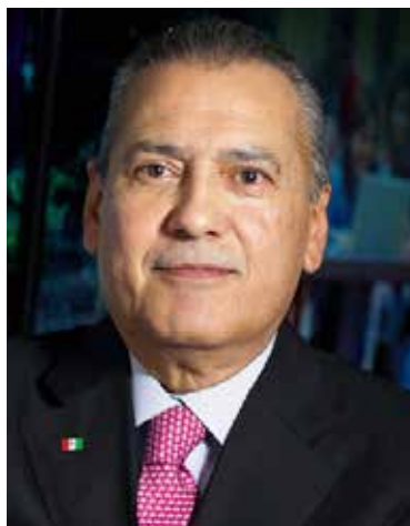
Manlio Fabio Beltrones