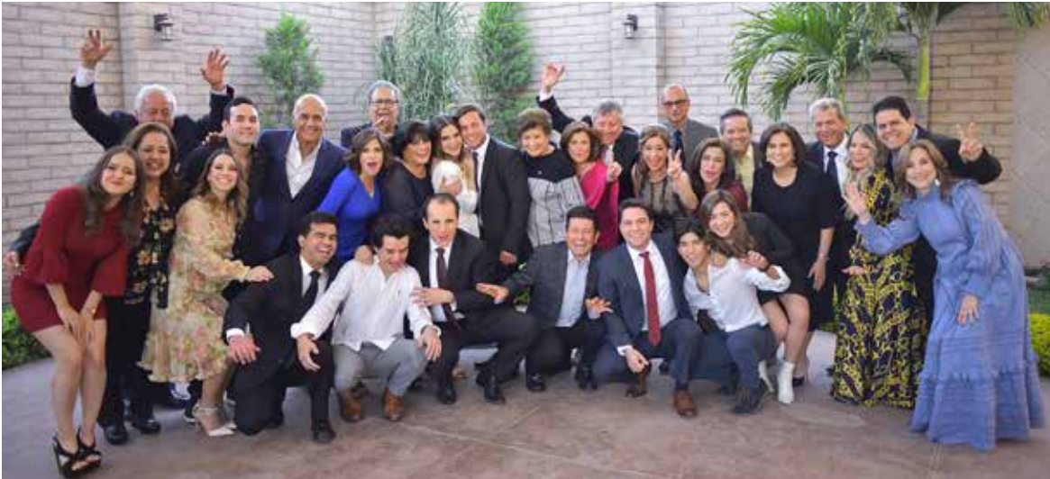
La familia Feuchter fue testigo del enlace matrimonial.