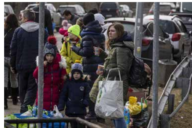
Un nuevo informe de la ONU indica que más de 6 millones de personas han huido de la guerra en Ucrania.

Perú se ubica en la zona denominada Cinturón de Fuego del Pacífico, donde se registra aproximadamente el 85 % de la actividad sísmica mundial.