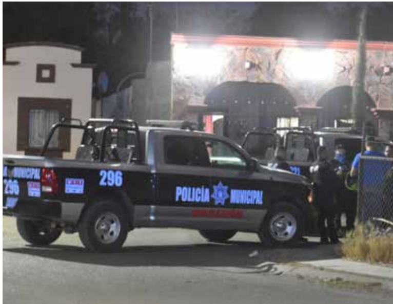
Fue la víctima número 3 de este jueves.

Fue encontrada tirada en el piso, vestía playera tirahueso de