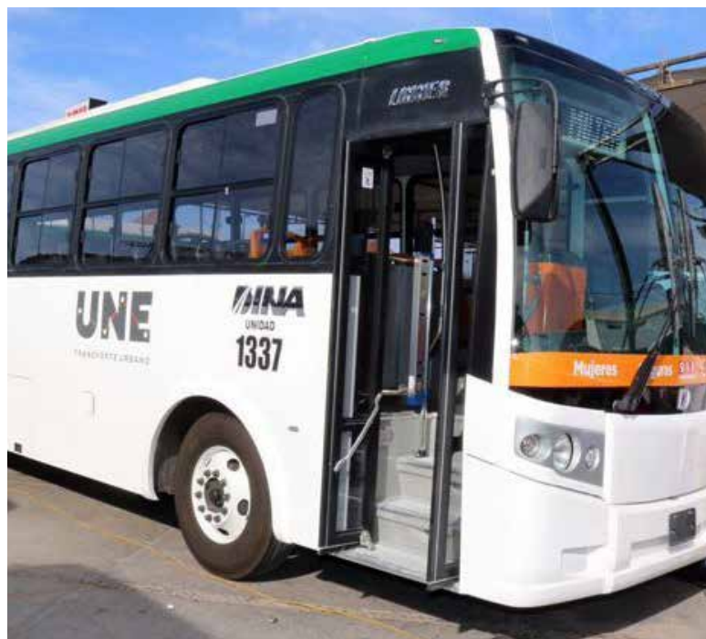
La Unión de Usuarios recordó que existen botones de pánico instalados al interior de las unidades del transporte público.