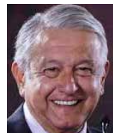
Andrés López Obrador

Muy a mal le ha sido tomada al presidente de la república Andrés Manuel López Obrador, la decisión de contratar a 500 médicos cubanos y el primero en poner el grito en el cielo fue el senador Jorge Carlos Ramírez Marín, quien fue claro y reprochó que México recurra a ese tipo de medidas. Nos dicen que Ramírez Marín reclamó que el gobierno de López Obrador decidiera la contratación de más de 500 médicos cubanos para distribuirlos en las comunidades marginadas. "No puedo aceptar y rectifico que se diga aquí que sí tienen los médicos cubanos principios de solidaridad y los mexicanos no". Dijo que les invita a sacar cuentas de cuantos médicos mexicanos murieron por falta de equipo. Y claro que hay médicos mexicanos que pueden hacer ese trabajo, indicó Ramírez Marín en la sesión de la Comisión Permanente. Y es que el pasado lunes AMLO confirmó que durante su visita a Cuba se acordó la contratación de 500 médicos y justificó diciendo que en México hay un déficit por culpa del periodo neoliberal. Esta decisión se tomó porque no tenemos los médicos que necesitamos en el país. No hay que olvidar que en el periodo neoliberal se dejó sin apoyo a la educación pública.