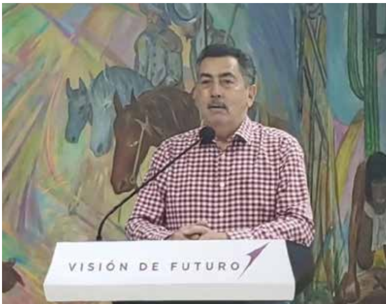
Se puso en marcha el programa municipal denominado 'Jornadas por Servicios de la Paz y Seguridad Social'.

El edil agregó que dicho plan de trabajo fue decidido en la mesa de seguridad: 'Aquí es en Cajeme van a participar Sedena, Guardia Nacional, Marina, Policía Estatal, AMIC, y la Policía Municipal junto