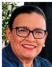
Rosa Icela Rodríguez