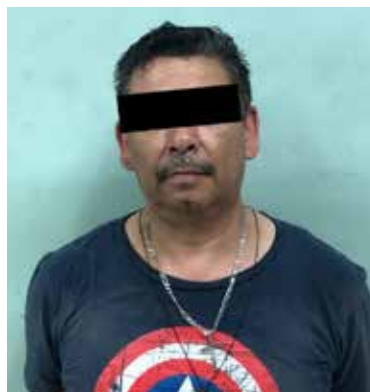
Fueron detenidos en flagrancia como parte de los barridos y filtros en la colonia Cortinas.

la parte trasera de una vivienda, donde los elementos aprehendieron a tres sujetos más por la probable comisión del delito de portación de armas de uso exclusivo del ejército y delincuencia organizada.