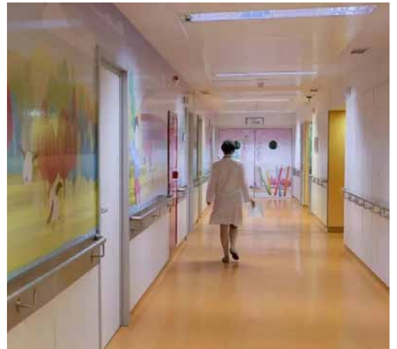
Actualmente se estima que existen alrededor de 300 casos reportados a nivel mundial.

Sin embargo, la secretaria de Salud subrayó que aún no se determina científicamente que el adenovirus -que provocan infecciones respiratorias- cause la inflamación del hígado.