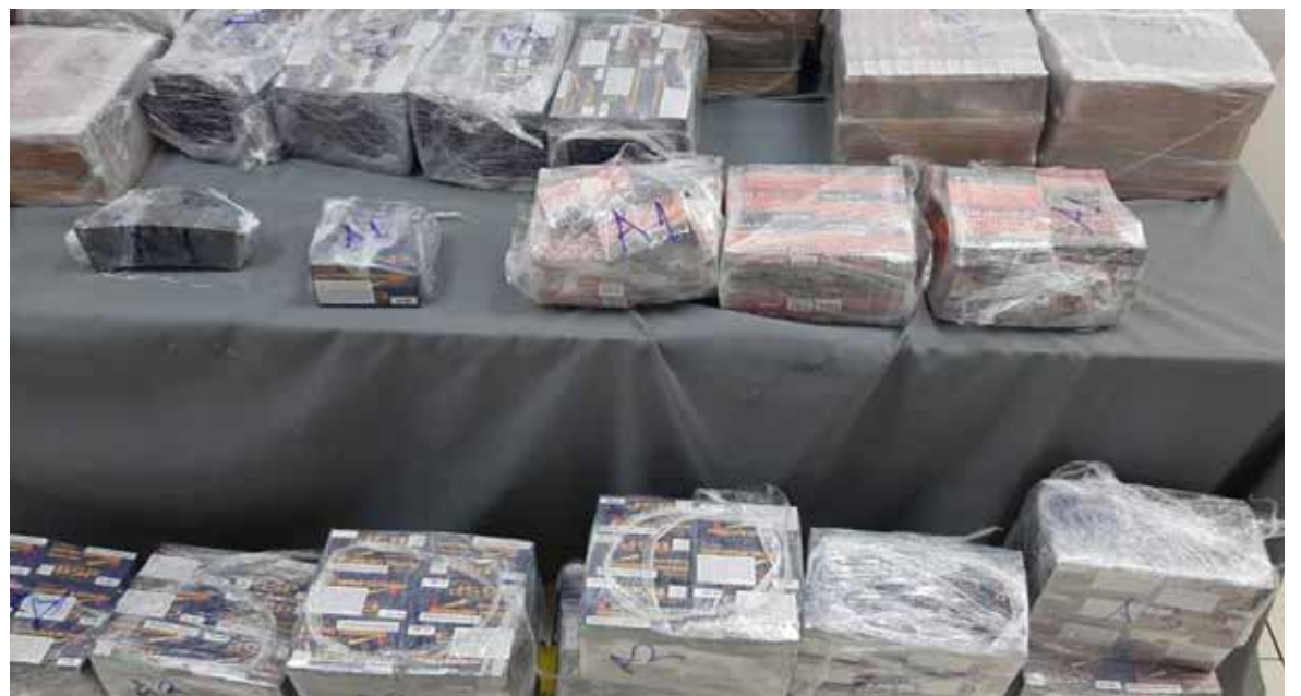
Los hechos, en lo que se detuvo a dos personas, tuvieron lugar en la carretera Monterrey-Reynosa a la altura del kilómetro 175, del municipio General Bravo.

Los detenidos y lo asegurado fueron puestos a disposición del Ministerio Público Federal que continúa con la integración de la carpeta de investigación.