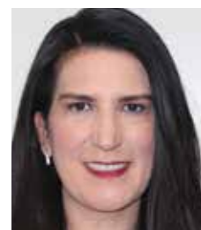
Kenia López Rabadán

Tan aguerrida una como la otra defendiendo la camiseta blanquiazul, pero esta vez las senadoras Kenia López Rabadán y Xóchitl Gálvez, no salieron de acuerdo porque ambas pretenden la jefatura de gobierno de la Ciudad de México, en relevo de Claudia Sehina Baum Pardo, en lo que serán las próximas elecciones donde se darán el relevo en metrópoli más grande del país. Por un lado, dicen que Gálvez en busca de sus propósitos muy legítimos, ha estado amarrando apo-