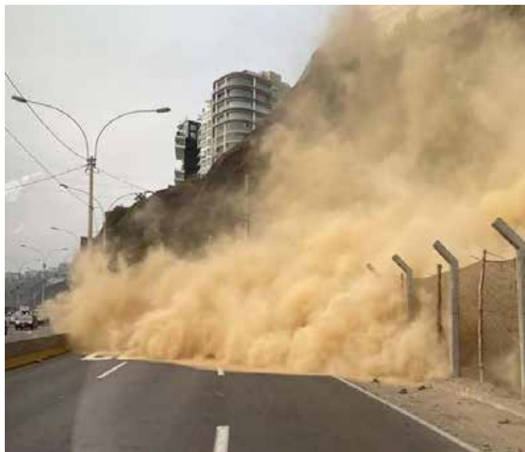
Un sismo de magnitud 5.5 golpeó la capital de Perú y provocó un deslizamiento de tierra.

En diversos sectores de la capital peruana la gente salió a las calles como medida de precaución, incluidos los parlamentarios que participaban en sesión en el Congreso, mostraron canales de televisión.