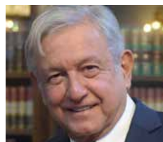
Andrés Manuel López Obrador