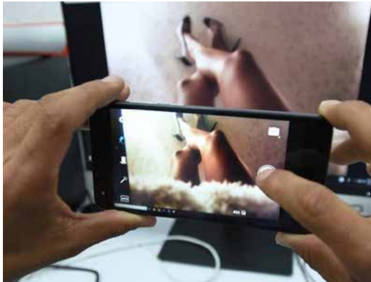
Se hizo posible la detención de una persona que compartió imágenes íntimas de mujeres por plataformas digitales.

Detalló que el 17 de marzo se integró el Informe Policial Homologado (IPH), con toda la in-