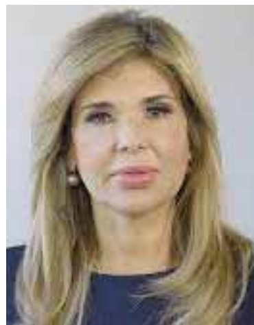
Claudia Pavlovich Arellano