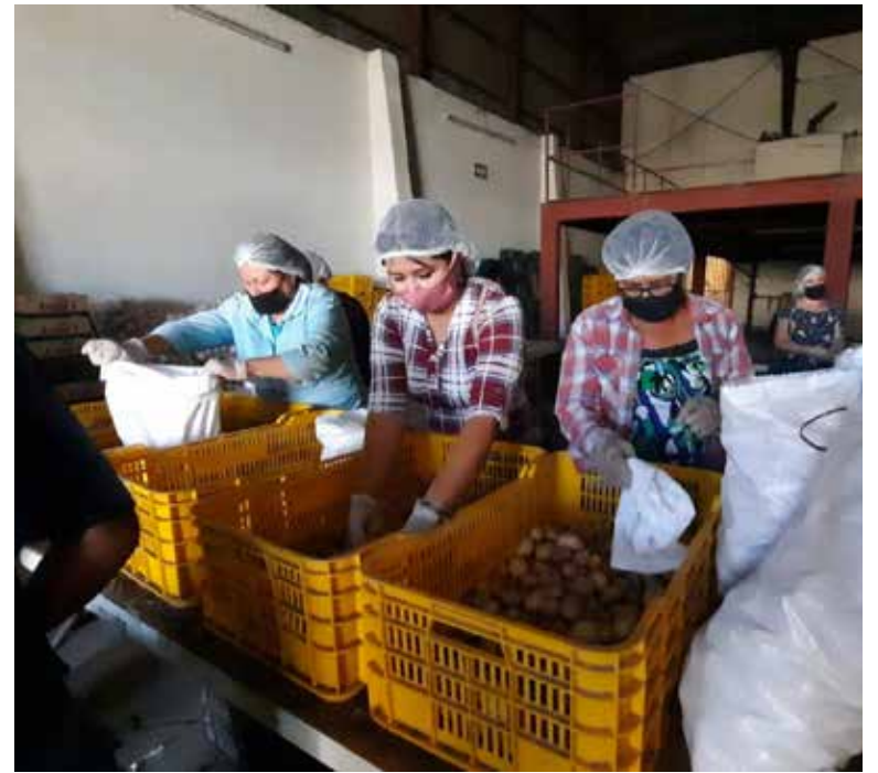
La APHYM realizó la entrega de despensas a familias vulnerables del sur del estado.

‘Esta iniciativa nació precisamente cuando inició la pandemia en 2020, en marzo, y nuestro gremio resultó ser esencial y pudimos seguir operando y nos sentimos con la responsabilidad de apoyar’, expresó.