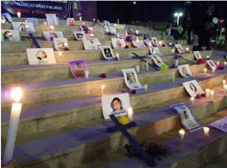
El feminicidio se ha incrementado en el estado de Sonora en un 41 por ciento.