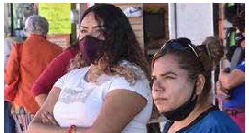
Los comercios establecidos del primer cuadro de la ciudad de Hermosillo dejarán de solicitar el uso del cubrebocas.

Cabe señalar que, este gremio fue uno de los más afectados con el inicio de la pandemia, pues muchos de los negocios, ubicados en este sector se vieron en la necesidad de cerrar sus puertas de manera definitiva.