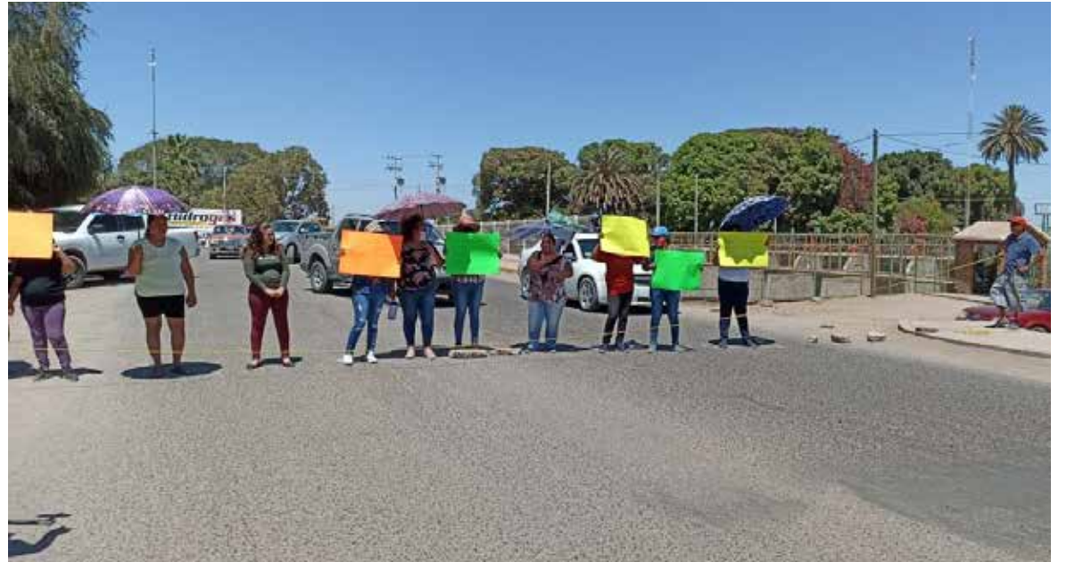
A manera de protesta, padres de familia bloquearon la calle 200, en el puente que cruza en Canal Bajo.

Por su parte, Fausto Flores Guerrero, delegado de la Secretaría de Educación, dijo que el lapso que piden los padres de familia, de que el lunes se diera solución es muy poco, ante lo