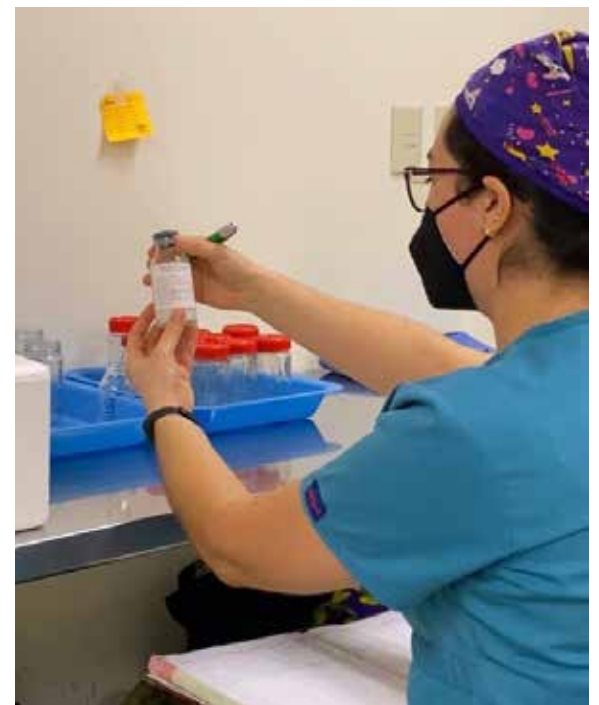
Las madres pueden acudir a amamantar a sus bebés o extraerse leche para que se la brinden con posterioridad.

ner el apego que solían tener con sus hijas e hijos.