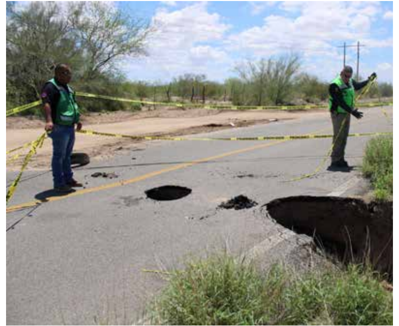
Un socavón fue provocado por la filtración del agua acumulada alrededor de la calle por las recientes lluvias en una parte de la carretera Cero Sur.

Se delimitó la zona con cintas de precaución alrededor de un socavón que afectó la cinta asfáltica, por lo que se abrió el paso por una ligera desviación, al lado de la carretera, para evitar el blo-