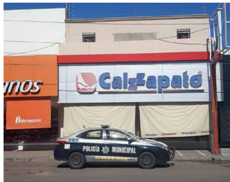
La mercancía robada arrojó un total de cerca de 25 mil pesos.

tor estaba dañado, así como su respectiva malla, deduciéndose que por ahí ingresaron los delincuentes.