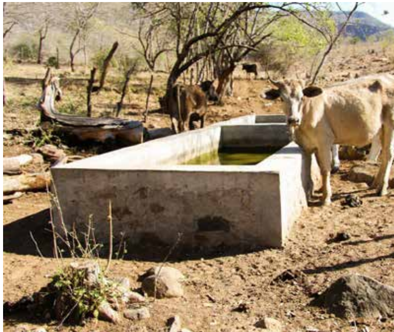
La sequía en Sonora pasó de afectar el 100% del territorio del Estado a un 97.2% en un mes.

Recordemos que, en 2021, este municipio estaba en la categoría D3, es decir, Sequía Extrema.