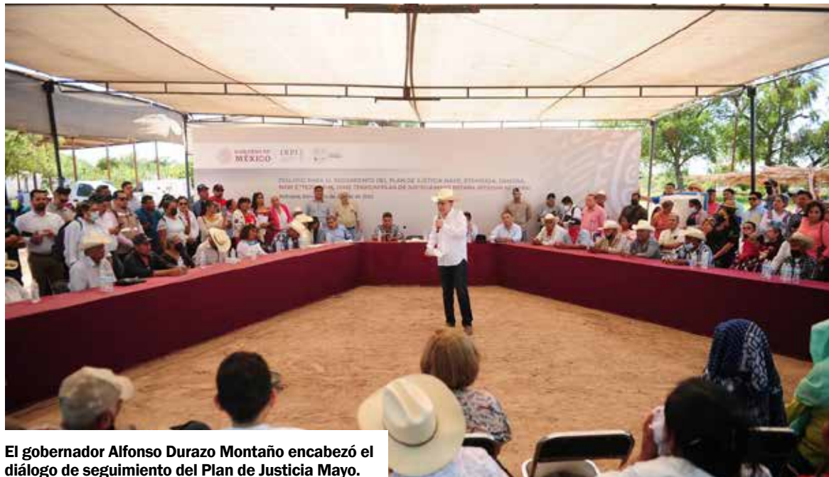
El gobernador Alfonso Durazo Montaño encabezó el diálogo de seguimiento del Plan de Justicia Mayo.

“Acabamos de terminar una evaluación autoridades federales y estatales sobre el Plan de Justicia para el Pueblo Mayo, y la verdad es que hay muchos avances. El propósito de esta evaluación tiene que ver con prepararnos para la visita del presidente, viene en un par de semanas, y ni modo que