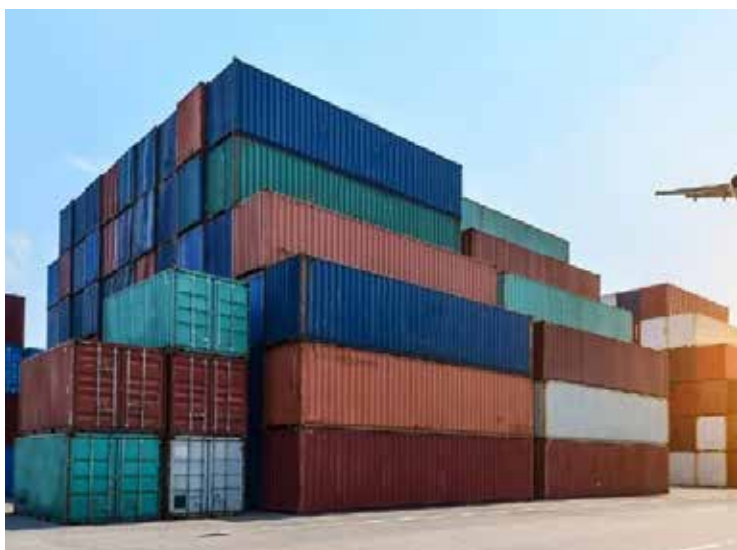
Entre enero y junio de este año las importaciones y exportaciones entre México y EU sumaron 384 mil millones de dólares.

Comparada con julio de 2022 y en términos desestacionalizados, la confianza del consumidor retrocedió tres puntos, es el retroceso anual más alto desde febrero de 2021.