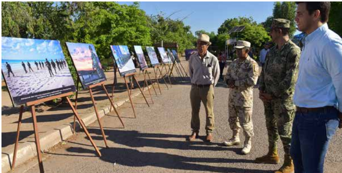
La exposición permanecerá en exhibición en el área comercial de la Laguna del Náinari hasta el próximo lunes 15 de agosto.

Durante la declaratoria inaugural, el Comandante del