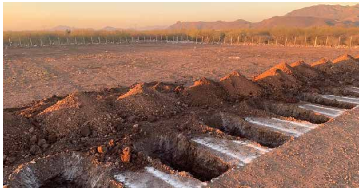
Integrantes de diferentes colectivos y familiares de personas en calidad de desaparecidas, piden que se apliquen protocolos o mecanismos que permitan la fácil identificación de los cuerpos.

Dicha sugerencia surge a raíz de que consideran que no hay una organización, razón por la