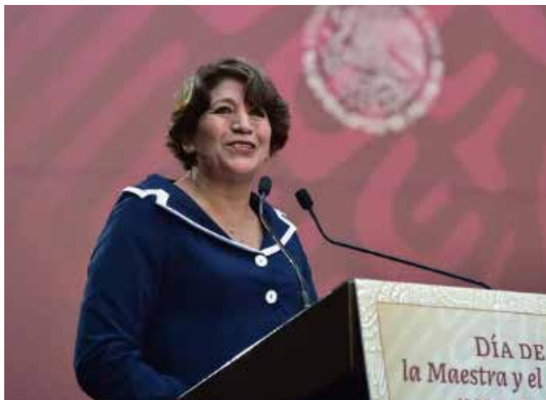
Delfina Gómez buscará terminar con la hegemonía del PRI en el Estado de México, una de las pocas entidades en el país que no ha tenido alternancia.

La titular de Educación Pública dejará su puesto con el objetivo de participar en las votaciones del 2023 de la mano de Morena