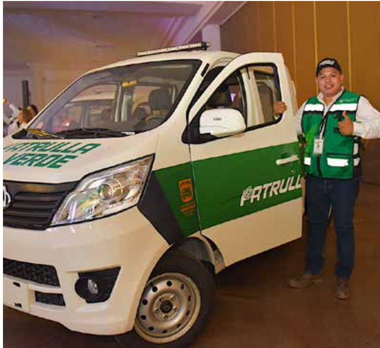
Las Patrullas Verdes son híbridas, funcionan con gasolina y gas, en ellas circularán por todo el municipio 30 inspectores equipados con lo último en tecnología

H ERMOSILLO. Con la presentación de las Patrullas Verdes y la firme convicción de llegar a ser la ciudad más limpia de México, el presidente municipal, Antonio Astiazarán cumplió una promesa de campaña al anunciar el programa Hermosillo CRECE Limpio, que involucra la participación de varias dependencias del Ayuntamiento, la colaboración de la sociedad ci-