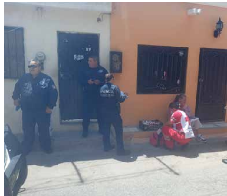
A la agresión acudieron paramédicos de Cruz Roja para prestarle los primeros auxilios.

Ante la negativa de la afectada los uniformados de limitaron a tomar nota de la agresión y retirarse del lugar.