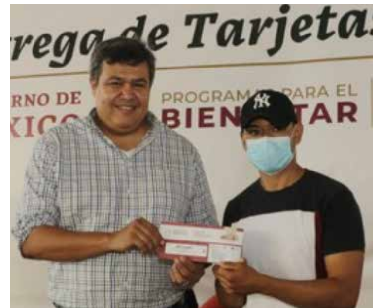
El titular de Conapesca, Octavio Almada Palafox, realiza una gira de trabajo, que comprenderá 11 estados de los litorales de océano Pacífico, entre ellos Sonora.