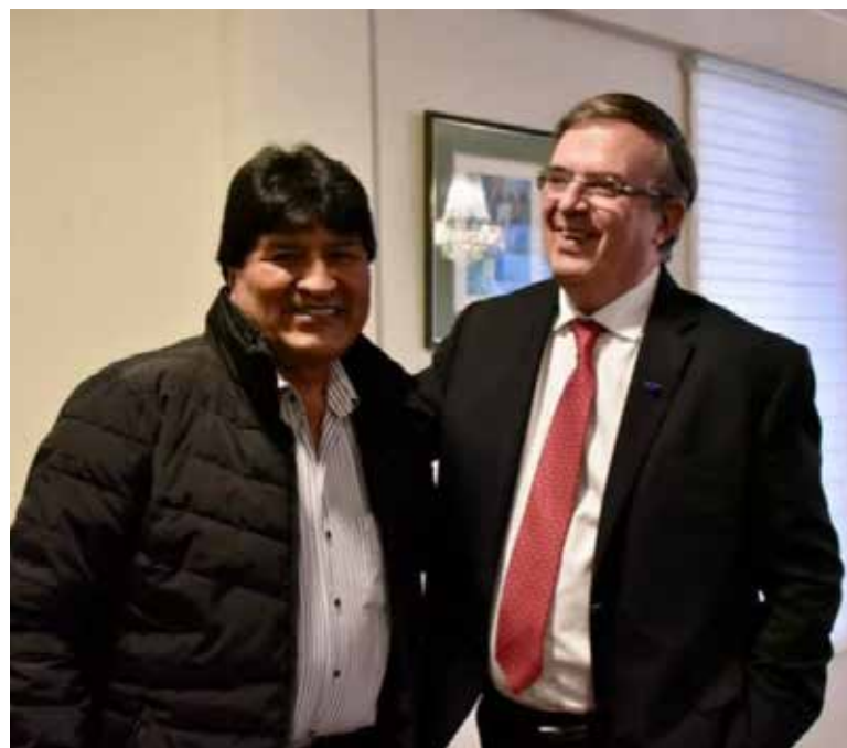
El secretario de Relaciones Exteriores, Marcelo Ebrard, también se reunió con el presidente de Bolivia, Luis Alberto Arce Catacora.

"Tengo muchos recuerdos de México, nunca olvidaré, mi pueblo por salvarnos la vida. Gracias a México, a otros ex presidentes y presidentes, recuperamos la democracia en corto tiempo y gracias a usted canciller".