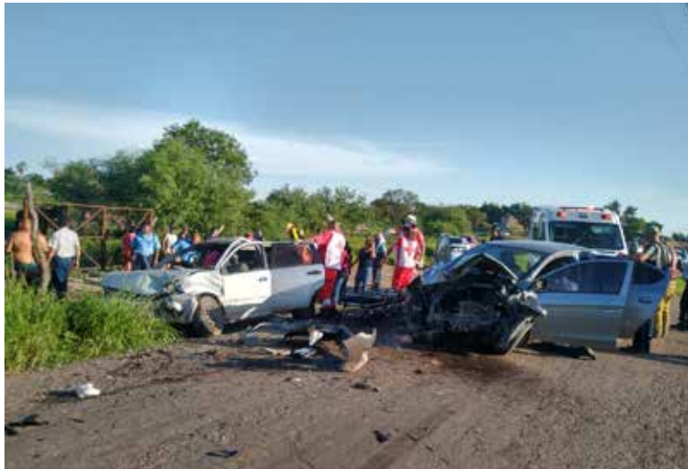
Bomberos y paramédicos auxiliaron a los lesionados.

En determinado momento uno de los conductores pierde el control del volante y termina invadiendo carril, impactando