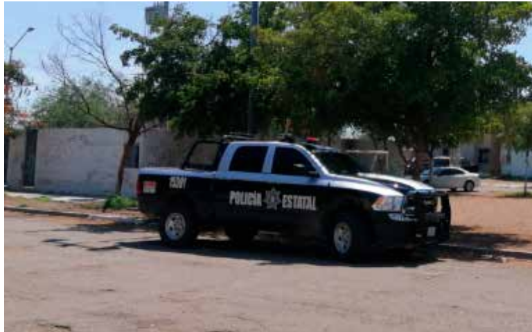
En el municipio de Cajeme se mantiene el operativo de seguridad.

Durante las primeras horas del miércoles, agentes de la PESP rea-