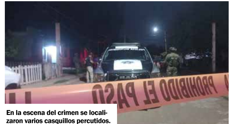
En la escena del crimen se localizaron varios casquillos percutidos.

Con este nuevo homicidio sube ya a ocho los asesinatos en apenas cuatro días transcurridos del mes de agosto.