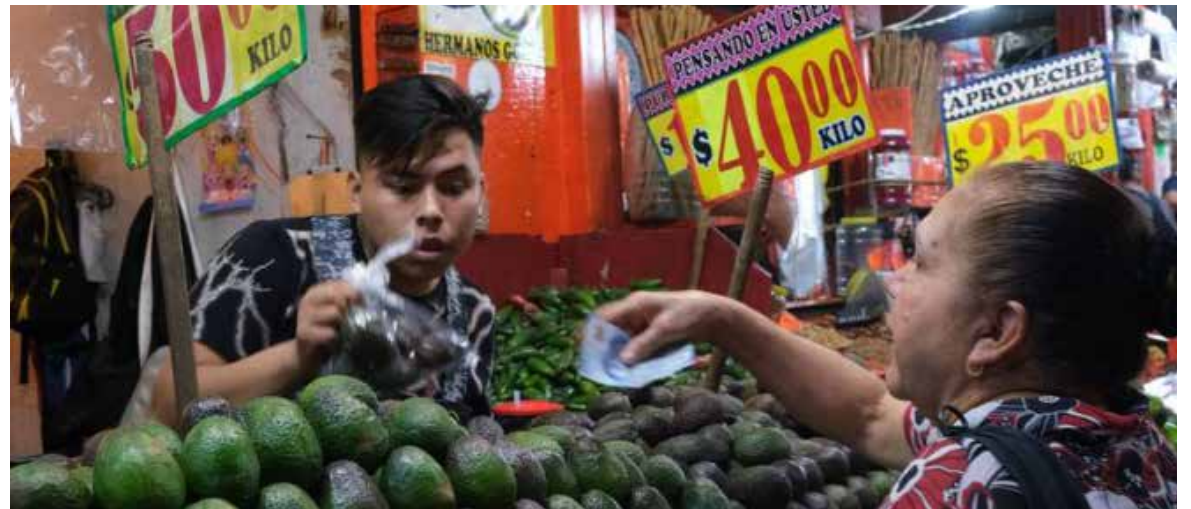
La confianza del consumidor en México presentó una disminución en julio del 2022, su tercer registró consecutivo con bajas.

De acuerdo con la oficina del Censo de EU, en el primer semestre de 2021 la relación comercial entre México y ese país sumó 320 mil millones de dólares.