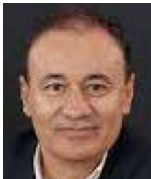
Alfonso Durazo Montaño