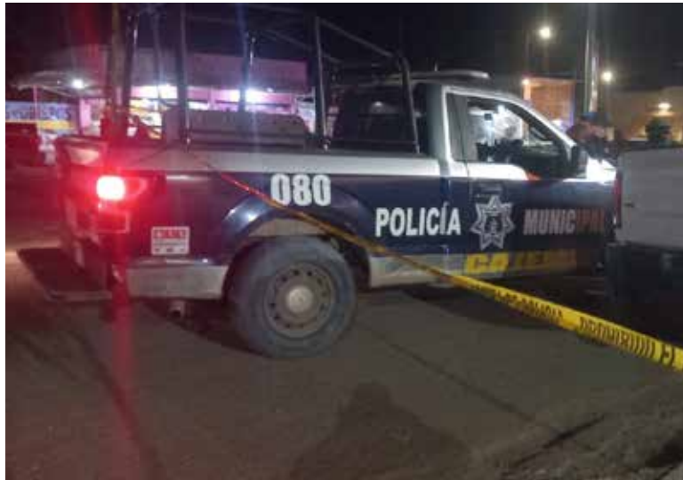
El hecho generó intensa movilización de los elementos policiacos.

Sin embargo, trascendió que al parecer se trata de un conductor de plataforma Uber que era buscado por sus familiares desde la mañana.