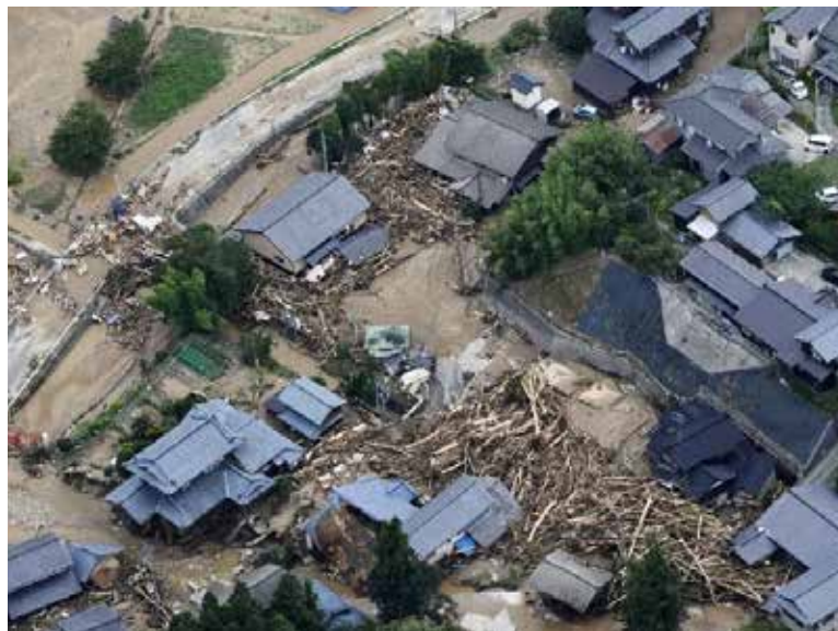
Miles de ciudadanos fueron evacuados por las fuertes depresiones.

De acuerdo con imágenes difundidas en la televisión pública, la lluvia provocó el colapso de carreteras y la obstrucción de puentes. Además, se suspendió el