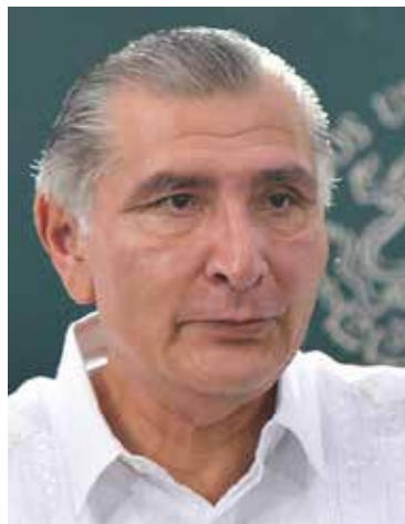
Adán Augusto López