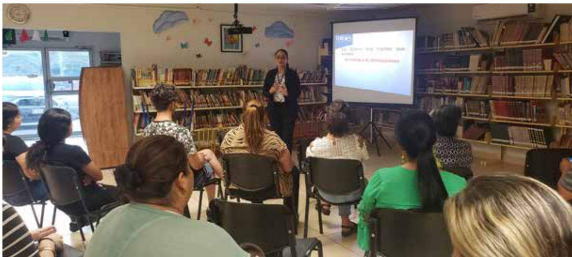
La Unidad de Duelo de Robles Funerales celebró su noveno aniversario.

“Pueden acercarse con nosotros, no es necesario que cuenten con un recurso económico destinado para eso, somos perfectas profesionales, somos psicólogas tanatólogas enfocadas específicamente a la atención de los duelos. Los duelos no tienen por qué vivirse en soledad, en muchos de los casos se requiere un acompañamiento profesional para evitar futuras complicaciones de la salud física o mental”, puntualizó.