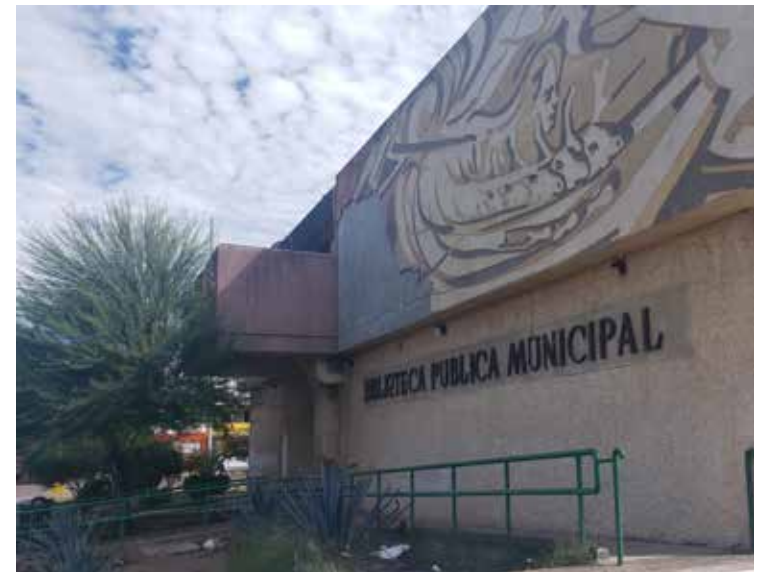
Respecto a los daños en los murales del exterior, se desconoce cuándo podrían repararse.