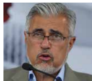
José Narro Céspedes