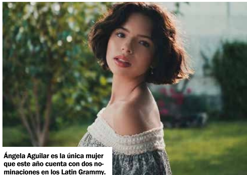
Ángela Aguilar es la única mujer que este año cuenta con dos nominaciones en los Latin Grammy.

Entre las agrupaciones del regional mexicano que figuran en este listado se encuentran 'Los Tigres del Norte', quienes gracias al disco llamado 'La Reunión' (Deluxe) compiten en la terna de 'Mejor álbum de música nortea', mientras que banda 'El Recodo' buscará llevarse hasta Mazatlán el galardón de 'Mejor álbum de música banda', ello gracias al disco 'Esta vida es muy bonita', una vez más Ángela Aguilar hace historia al convertirse en la única mujer mexicana en competir en esta premiación con dos nominaciones, ella buscará alzarse ganadora de las categorías