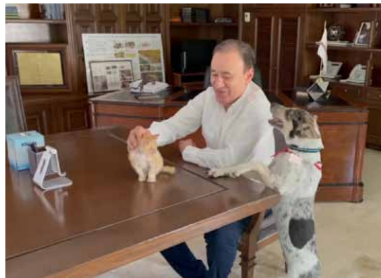
El gobernador Alfonso Durazo presentó a un gato y un perro que rescató y ahora les busca hogar.

En su video, el gobernador recordó que recientemente se de-