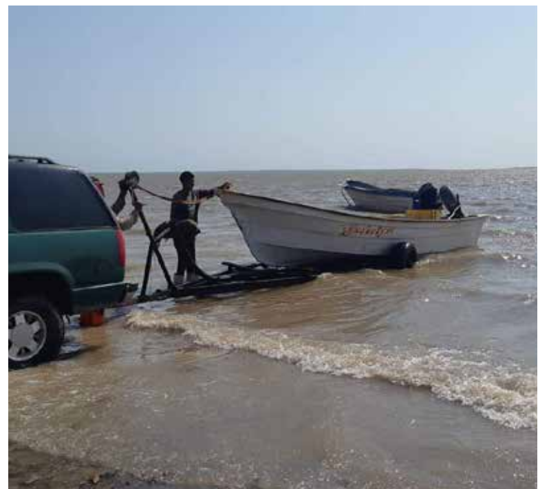
Los pescadores solamente están obteniendo entre 10 a 15 kilos por salida.

Agregó que el producto que se logra sacar son de talla baja, ya que las condiciones que se presentaron con el clima desfavorece la pesca y la cual se comercializó con compradores de Obregón, Huatabampo y de Guaymas.