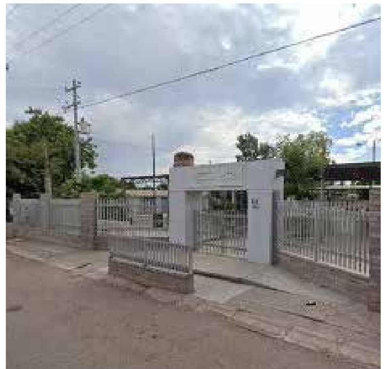
El día martes, padres de familia tomaron las instalaciones en busca de respuestas.

falta de profesores obedeció a un trámite pre jubilatorio y unas incapacidades, espacios que ya fueron cubiertos, mientras que el tercer espacio se generó debido a que una profesora se fue asumió la dirección de otro plantel.