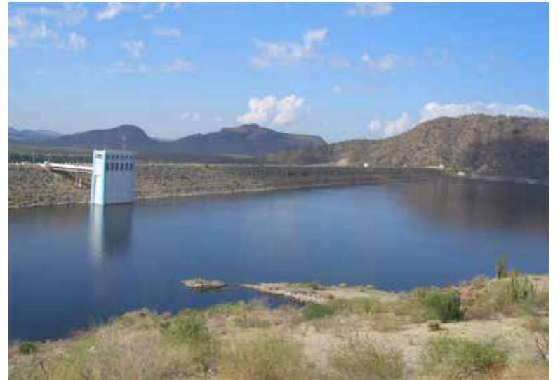
La presa el Oviáchic se encuentra al 36.4 por ciento con 1,174.1 millones.

Ante esto, la medición del ciclo de aportaciones en las presas, el cual empezó desde octubre del