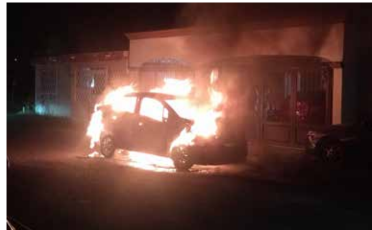
La unidad automotriz incendiada es un sedán marca Chevrolet, línea Beat, modelo 2019 y con placas de circulación del Estado de Sonora.

Con este hallazgo incrementó a 41 las muertes violentas en el mes de septiembre.