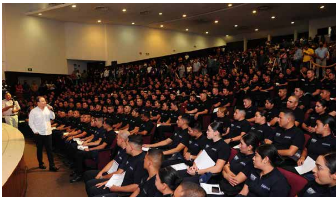
El gobernador Alfonso Durazo Montaña, encabezó la ceremonia de graduación de 300 mujeres y hombres de la generación Delta de la Policía Estatal.

juntos. Y quiero hacer de la Policía Estatal de Seguridad Pública un cuerpo de élite, de lo mejor. No solo de Sonora, de lo mejor del país. Y para eso necesito de su acompañamiento, de su esfuerzo. En reciprocidad, les garantizo que el gobierno del estado va a estar invariablemente a su lado, tratan-