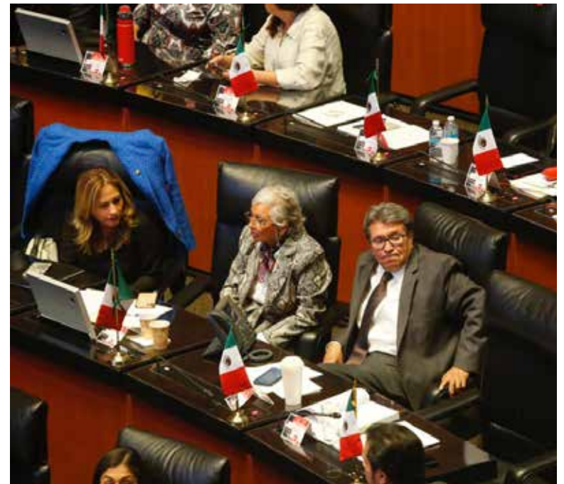
Con el asunto en comisiones se abre un nuevo periodo de debate para buscar votos, con la posibilidad de cambiar el dictamen que llegó sin cambios de la Cámara de Diputados.

El proyecto que se discutía es sobre el Artículo Quinto Transitorio del decreto por el que se reforman, adicionan y derogan diversas disposiciones de la Constitución Política, en materia