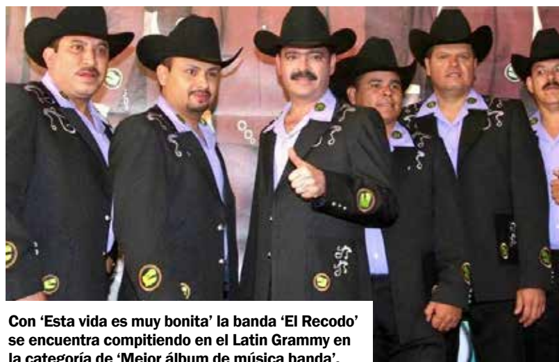
Con 'Esta vida es muy bonita' la banda 'El Recodo' se encuentra compitiendo en el Latin Grammy en la categoría de 'Mejor álbum de música banda'.

'Mejor álbum de música ranchera/mariachi' y 'Mejor canción del año', ello gracias a su canción llamada 'Ahí donde me ven'.