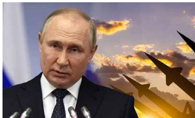
Biden criticó al presidente ruso Vladimir Putin por iniciar una guerra no provocada. Unos 40 miembros de la ONU están ayudando a Ucrania con financiación y armas.

“Este nuevo anuncio de 2,900 millones de dólares salvará vidas a través de intervenciones de emergencia e invertirá en asistencia de seguridad alimentaria a mediano y largo plazo para proteger a las poblaciones más vulnerables del mundo de la creciente crisis de seguridad alimentaria mundial”, dijo la Casa Blanca.