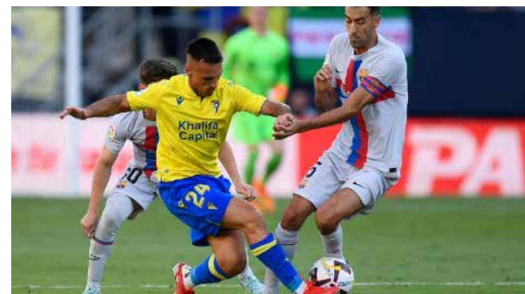
El mediocampista español dejará la institución y todo indica que seguirá su carrera en Miami.

Con el cuadrangular conectado al lanzador Will Crowe, 'el Juez' está en rango de solamente un vuela cercas más del récord de Roger Maris en la Liga Americana para jonrones en una sola temporada, el cual está vigente desde hace 61 años.