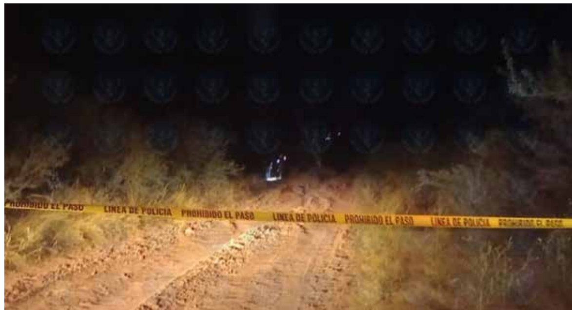
El par de cadáveres estaba junto a una torre de alta tensión.

Los daños materiales aunque resultaron de elevada cuantía no se estableció el monto, pero se presume que ascendieron a más de 150 mil pesos.