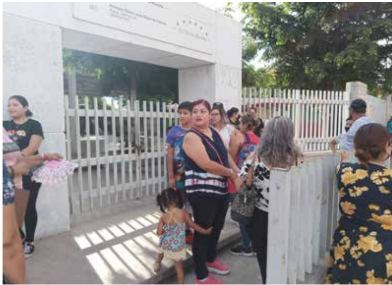
Padres de familia de la primaria Josefina Viuda de Gálvez, cerraron las instalaciones debido al desabasto de agua.