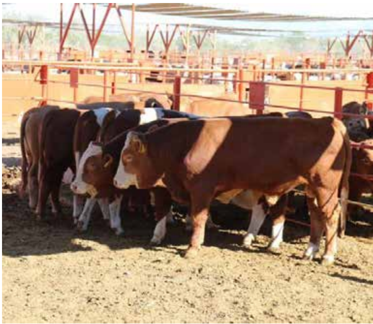
La subasta se realiza todos los lunes en los corrales de la Aglvy.