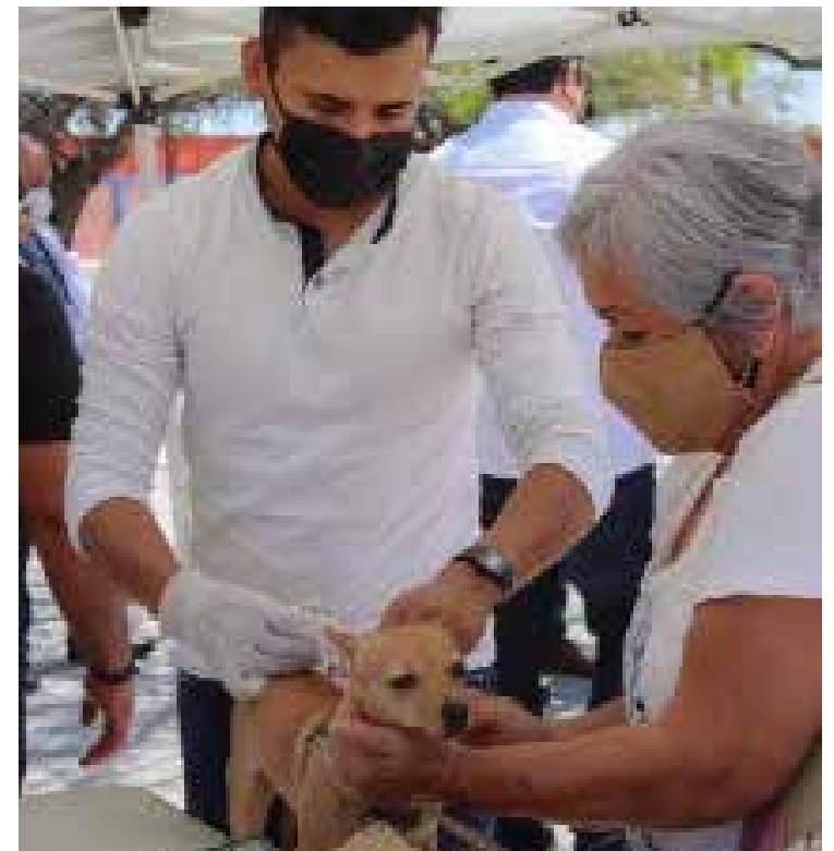
Desde hace 30 años que en Sonora no se presentan casos de rabia humana.

Para mayor información de los lugares donde está disponible la vacuna antirrábica, comunicarse a las redes sociales de la Secretaría de Salud, o bien, acudir esté sábado 26 y domingo 27 de noviembre al Gimnasio Municipal del municipio de Cananea, el cual se ubica entre la avenida Onceava y Benito Juárez, en la colonia Los Pinos, donde se estarán realizando diversos servicios para las mascotas.