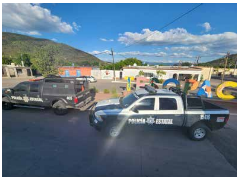
Dos de las víctimas estaban 'encobijadas' en la caja de una camioneta.

Trascendió que el cadáver tenía severas lesiones en la cabeza, al