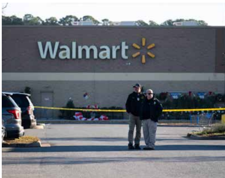
El presidente de Estados Unidos calificó el acto como “terrible” y que muchas familias se quedarán sin celebrar el Día de Acción de Gracias.

Asimismo, ha expresado sus condolencias a las familias de los afectados y la comunidad de Chesapeake, donde ha tenido