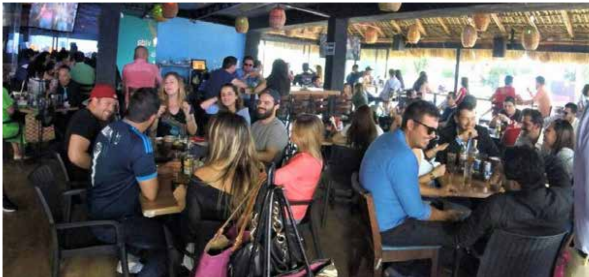
La Cámara Nacional de la Industria Restaurantera y Alimentos Condimentados en Sonora, confió que, para este fin del 2022, esperan una reactivación importante del sector gastronómico.

El representante de los restauranteros organizados en Sonora, añadió que también esperan el apoyo de las autoridades municipales en materia de atención a ciertos puntos que le harán ver próximamente en reuniones que llevarán a cabo.