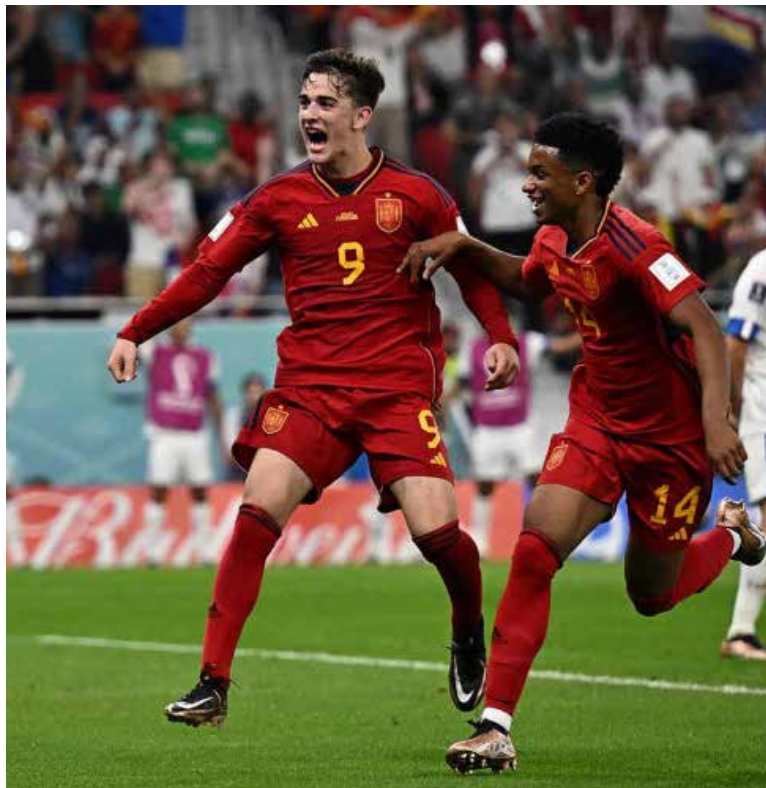
España exhibi6 el talento de su joven generaci6n de futbolistas.

Los hombres de Luis Enrique acabaron con una maldici6n de tres Mundiales sin ganar en su partido inaugural de la cita pla-