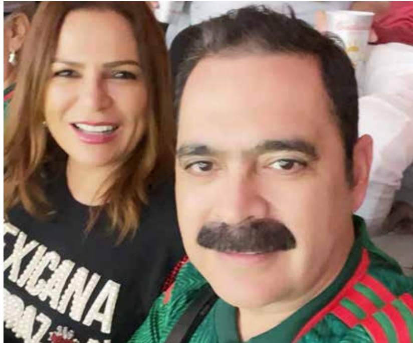
Mario Quintero acudió al partido de México vs Polonia en compañía de su esposa, en donde convivió con los aficionados mexicanos, quienes bailaron con 'La Chona', canción que se ha hecho famosa en el Mundial.

"Un día soñé con bailar 'La Chona' en un mundial, pero nunca pensé que sería con el vocalista de Los Tucanes De Tijuana", fue la descripción que Osberto Vera puso en el video que posteo en su red social, clip que hasta el momento ha sido compartido en más de 800 ocasiones, acumulando cerca de 8 millones de 'me gusta' y 'me encanta', además de más de 150 comentarios, mientras que Mario Quintero ha aprovechado su estadía en Qatar para compartir a través de su cuenta de Instagram todo lo que en el país islámico le ha tocado conocer, tomándose fotogra-