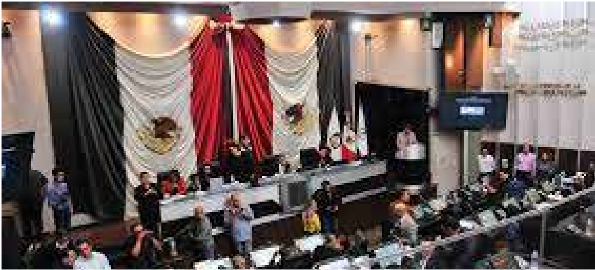
Diputados del Congreso de Sonora aprobaron sesionar en lugares alternativos al recinto oficial del Poder Legislativo del Estado.