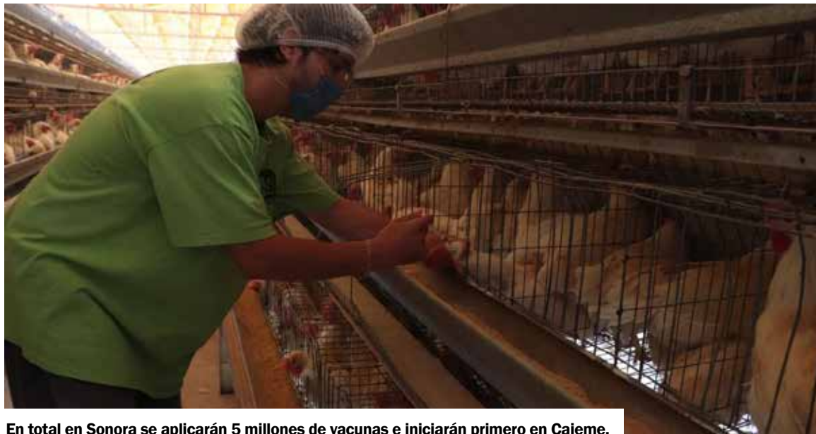
En total en Sonora se aplicarán 5 millones de vacunas e iniciarán primero en Cajeme.

Cabe resaltar que, debido a esta problemática, se tuvo que sacrificar más de 400 mil aves que presentaron esta enfermedad con el fin de proteger al res-