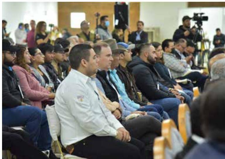
Aglutinó el Centro de Usos Múltiples a 250 personas de Latinoamérica y América del Norte en forma presencial

"Amigas, amigos, creo que esto es fundamental, el intercambio de conocimientos, de experiencias, de tecnología nos permite avanzar en la recuperación, la preservación y el mejoramiento de suelo y aguas y, por supuesto, la conservación del medio ambiente para hacer un uso eficiente de nuestros recursos en el marco de una actividad sustentable",