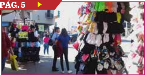
PROYECTAN AMBULANTES INCREMENTO EN VENTAS