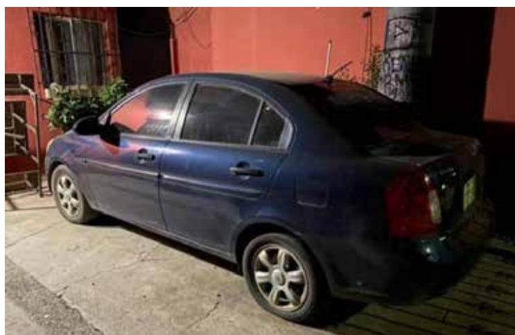
El vehículo robado es un sedán de la marca Hyundai, línea Attitude, modelo 2006, color azul marino.

Posteriormente, los cuerpos fueron levantados junto con toda evidencia y trasladar al anfiteatro para las diligencias correspondientes.