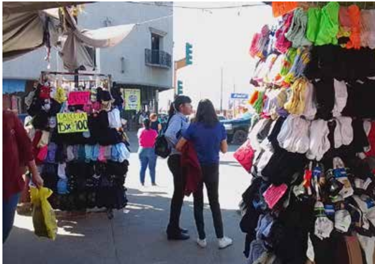
Son aproximadamente 80 los puestos ambulantes que operan en el centro de la ciudad.