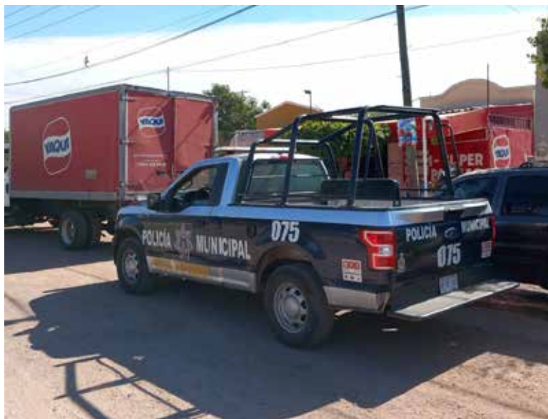
Este nuevo atraco ocurrió en el negocio denominado Súper Las Palmas, ubicado en calle del mismo nombre y Turquesa.

Ante el consabido temor de sufrir un ataque decidió entregarle la suma de la mil 500 pesos en di-