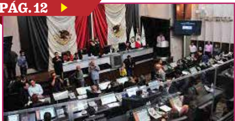
SESIONARÁ CONGRESO EN LUGARES ALTERNOS