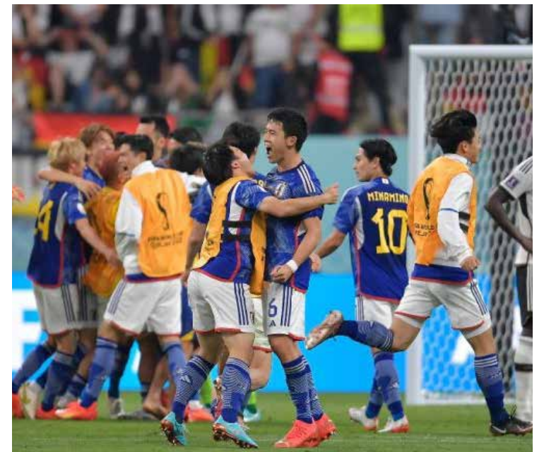
El marcador cerr6 1-2 con goles de Gundogan para las 6guilas, y Doan y Asano para los nipones.

Liderados por Keylor Navas, la escuadra costarricense fue incapaz de competir contra la intensidad del juego espa6ol.