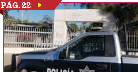
SAQUEAN PRIMARIA EN LA BENITO JUÁREZ