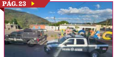
HALLAN EN TESOPACO A TRES EJECUTADOS