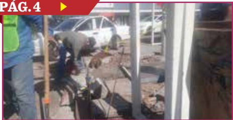
REHABILITAN RAMPAS PARA DISCAPACITADOS