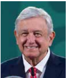
Andrés Manuel López

Dicen que el que hizo otro berrinche de esos que acostumbra cuando no le salen bien las cosas, fue el presidente Andrés Manuel López Obrador, luego de conocer la noticia de la junta de gobernadores del Banco Interamericano de Desarrollo, rechazó como presidente a su candidato Gerardo Esquivel, dado que los tentáculos de sus operadores políticos no le alcanzaron para tanto. Y dicen que ahora se enfrenta al dilema de tener que ratificar en el Banco de México, de donde había indicios de que pretendía deshacerse de él para colocar a uno de sus incondicionales, pero a como están las cosas tendrá que ratificarlo, toda vez que de no hacerlo, la decisión le pondría ocasionar turbulencia.