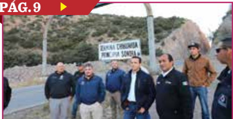
ARRANCA EL PLAN PUERTO SAN LUIS