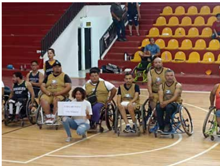
Aún faltan ultimar detalles para la óptima realización de la justa deportiva.

Recientemente se cambió la fecha del evento, la Liga de Baloncesto sobre Silla de Ruedas del Estado de Sonora y Obregón va a participar en la Cuarta Sede de la