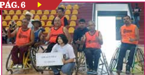
URGE APOYO PARA EL DEPORTE ADAPTADO