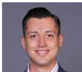
Luis Donaldo Colosio