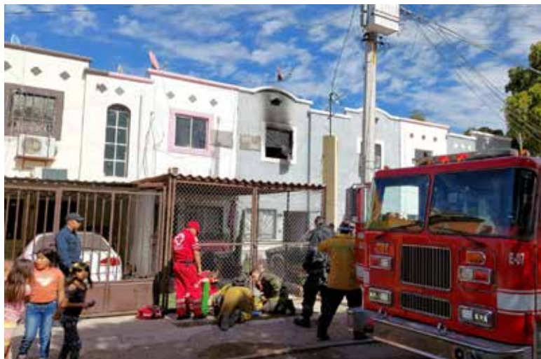
Elevadas pérdidas materiales dejó el siniestro.

Esto, mientras su hijo dormía en una de las habitaciones y de-