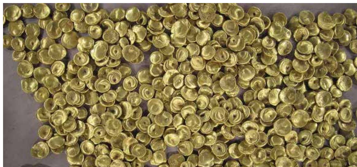
Tienen más de dos mil años de antigüedad.

“La pérdida del tesoro celta es una catástrofe, las monedas de oro son insustituibles como tes-