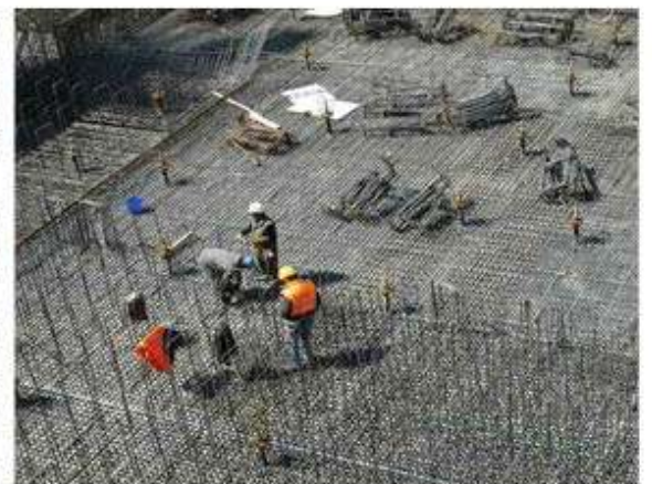
El personal ocupado en dicha industria no reportó variaciones respecto a octubre.

lla que las horas trabajadas en las empresas constructoras tuvieron un retroceso mensual de 0.1%;