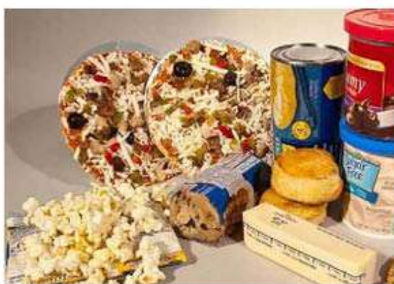
Se hizo un llamado a los fabricantes de alimentos, así como a los proveedores de aceites y grasas, a eliminar las grasas trans producidas industrialmente de sus productos.

de la ONU, estos ácidos grasos se encuentran comúnmente en alimentos envasados, productos horneados, aceites de coci-