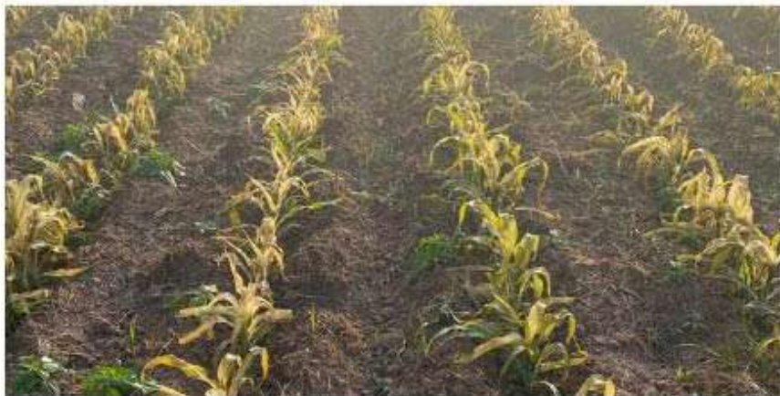
Son alrededor de 50 mil hectáreas las que se siembran en la región.

Es de resaltar que en el Valle del Yaqui se siembran cerca de 50 mil hectáreas con cultivos que sufren bastante con el clima helado, la calabaza es una de ellas, una de las plantas que se encuentran en