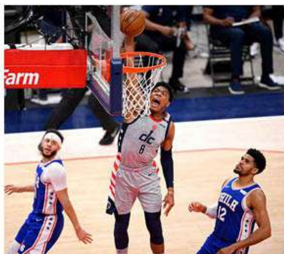
Los Lakers mandan a Washington a Kendrick Nunn y tres segundas rondas, para obtener a Rui Hachimura.

El fichaje de Hachimura es bueno para los Lakers, principalmente por no perder nada en el proceso. Pero también puede salir deportivamente bien: cubre una posición de la que carecían los angelinos y tiene talento en ataque, además de tener facilidad para anotar y lanzar bien desde la media distancia.