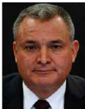
Genaro García Luna