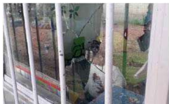
Los responsables destruyeron varios cristales y crearon más daños.

De lo anterior, se notificó al Ministerio Público del Fuero Común, mediante un Informe Policial Homologado, a fin de que se inicie la averiguación previa de este caso.