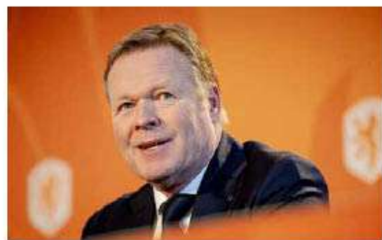
El estratega neerlandés Ronald Koeman, regresó al banquillo de la selección de Holanda y aseguró que cambiará cosas.