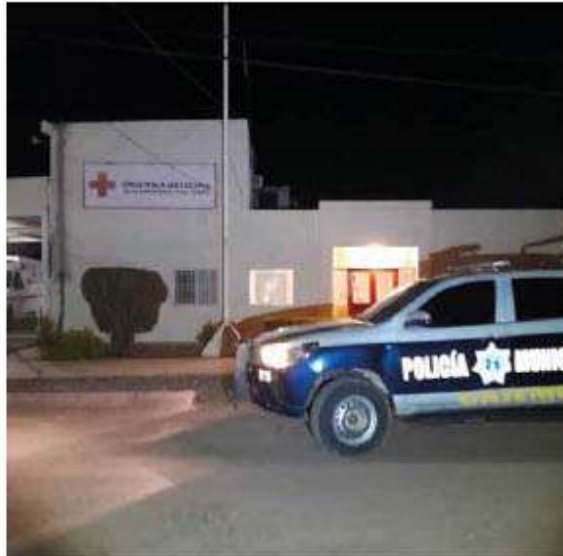
Elementos policiacos acudieron a tomar nota de lo ocurrido.