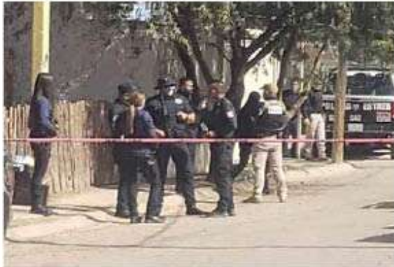
El violento episodio se produjo por la calle Paseo Jacarandas entre Paseo Golondrinas y de Los Duraznos.

co en el hombro derecho, pecho lado izquierdo y en el abdomen.