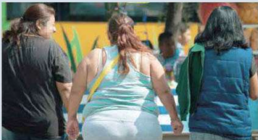
Si no se lleva un buen control pueden desarrollar enfermedades cardiovasculares o diabetes mellitus.

Además, añadió, se cuenta con la Clínica Integral de Nu-