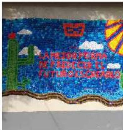
Alumnos de Cobach realizaron un mural de tapitas de plástico como parte del proyecto 'Cultura para la paz'.