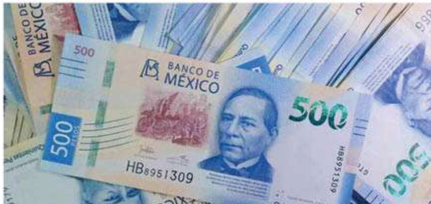
La organización Oxfam México propone impuestos a millonarios para aumentar el gasto a la salud.

Para buscar una distribución más equitativa de la riqueza, la ONG recomienda aplicar una