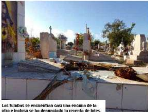
Las tumbas se encuentran casi una encima de la otra e incluso se ha denunciado la reventa de lotes.

En el 2018 se informó sobre la compra de un terreno de 3.2 hectáreas sobre la calle Meridiano, las y los habitantes de la comisaría rechazaron el espacio, motivo por el cual el problema de hacinamiento se ha incrementado en los últimos años.