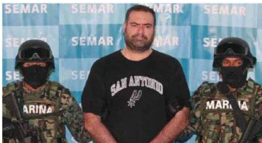
La fiscalía acusó a García Luna de haber "traicionado" a México y EU por ayudar al tráfico de cocaína; la defensa asegura que no hay pruebas.