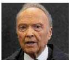
Alejandro Gertz Manero