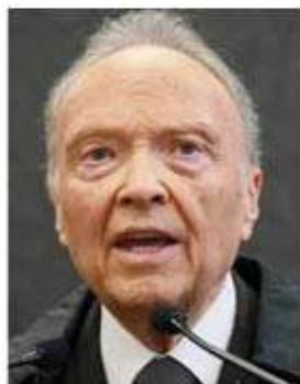
Alejandro Gertz Manero