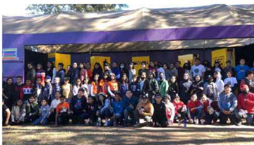
El concurso 'Pequeños Grandes Lectores' regresa a la Biblioteca Pública Jesús Corral Ruiz.

Es por ello que piden seguir siendo atendidos con la Eucaristía y crecer en la catequesis a lo que se animó a que cada casa se haga un lugar de encuentro y oración con el Señor.