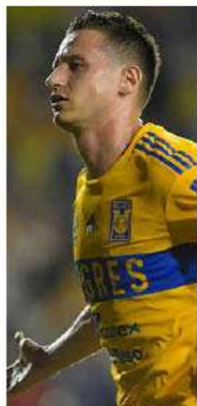
Florian Thauvin llegó como una estrella a Tigres, sin embargo, no pudo brillar.

En total fueron 2,064 minutos los que Florian Thauvin estuvo en el terreno de juego como futbolista de Tigres, tiempo que sumó en los 38 partidos que participó, en los que colaboró con ocho goles y cinco asistencias.