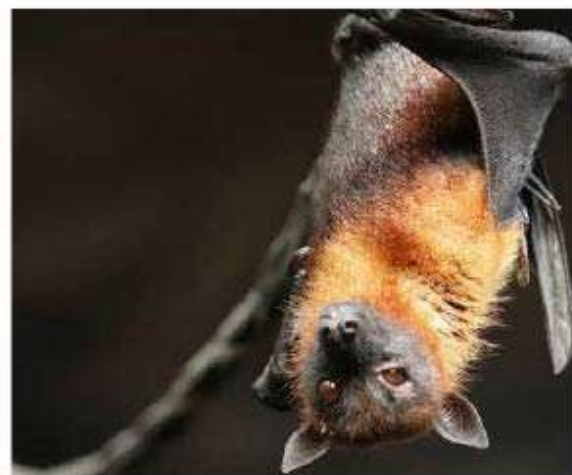
El Sistema Nacional de Vigilancia Epidemiológica (Sinave), organismo de la Secretaría de Salud, emitió un aviso epidemiológico por cuatro casos confirmados de rabia en Nayarit, Jalisco y Oaxaca.

Y aclara que el diagnóstico para confirmar esos casos se llevará a cabo en el Instituto de Diagnóstico