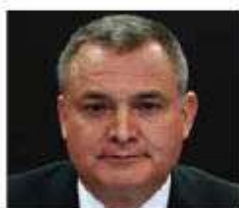
Genaro García Luna