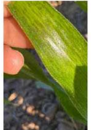
Yaqui como en el Mayo.

problemas por el frío y que se han estado dando recorridos para confirmar si hay más partes dañadas, tanto en el Valle del