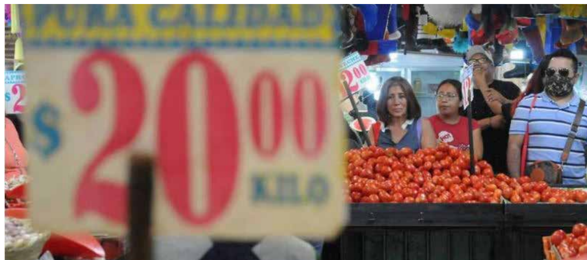
Las mercancías se incrementaron 0.17 por ciento quincenal en las primeras semanas de mayo.

“El salario promedio real aumentó 2.3 por ciento anual en el primer trimestre de 2023 y el porcentaje de población en pobreza laboral muestra tendencia decreciente, al ubicarse en 38.9 por ciento al cierre de 2022, la cifra más baja desde 2008”, consignó el secretario frente a representantes del sector financiero.