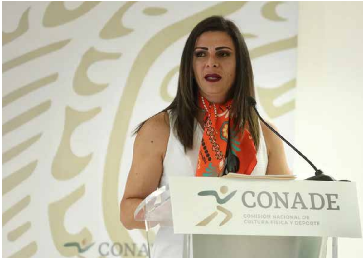
Ana Gabriela Guevara continúa en el ojo del huracán por su ejercicio al frente de la Comisión Nacional del Deporte.

un llamado a que la también ex senadora comparezca ante el Congreso a fin de abundar en el uso de recursos públicos y del presupuesto de la Comisión — el cual ha sido una de las mayores polémicas que la ex atleta olímpica ha enfrentado durante su ejercicio al frente de la Conade.