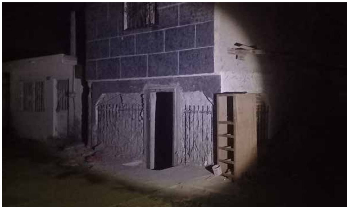
Infantes de Marina incluso derribaron la puerta de una vivienda de dos plantas.