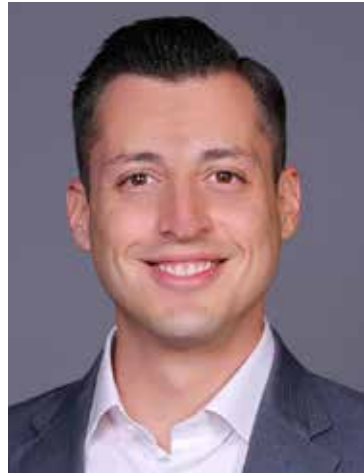
Luis Donaldo Colosio Riojas