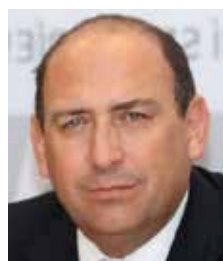
Rubén Moreira Valdés

Al escalar la disputa entre el PRI y Movimiento Ciudadano, ayer el coordinador del tricolor en la Cámara de Diputados, Rubén Moreira Valdés, invitó a no votar por Movimiento Ciudadano, toda vez que votar por ese partido, equivale a votar a favor del narcotráfico y la inseguridad, obviamente refiriéndose a que sería ayudarle a Morena, cuyos gobiernos han propiciado la libertad de operación para las bandas el crimen a lo largo y ancho del país. Moreira Valdés, reprochó a MC el emprender una campaña en contra del PRI, a solo 15 días de las elecciones en Coahuila y el Estado de México, por lo que se lanzó con ese partido, calificándolo de esquírol de Morena. Y fue más allá al mencionar que MC no es ni movimiento ni ciudadano, porque ha decidido alinearse bajo la sombra de Morena y por lo tanto del poder, es un partido marginado, es un mini partido que ha traicionado a sus seguidores. Así mismo se lanzó en contra del senador Dante Delgado, fundador y dirigente de MC, asegurando que los va a llevar a la ruina, más adelante y le anunció: "Es tu caída Dante, porque Dante no dice nada, es un político de Polanco".