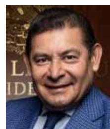
Alejandro Armenta Mier

Presto a obedecer siempre al pie de la letra al presidente de la república Andrés Manuel López Obrador, su mayor pastor político, el presidente de la Mesa Directiva del Senado de la República, Alejandro Armenta Mier, dijo que obedecerá la recomendación para evitar que la controversia generada por los mensajes que le mandó vía WhatsApp la presidenta de la Suprema Corte de Justicia de la Nación (SCJN) trascienda a otras esferas. Sin embargo, como le dolieron, no se quedó con las ganas de reiterar que esos mensajes representan no solo un acto de presión contra su persona, sino una injerencia y una intromisión de un poder a otro, sobre el trabajo que se realiza en el Senado. No fue una acción personal, es una conducta que no se puede admitir ni del Poder Judicial al Senado ni viceversa. Y es que la ministra presidenta de la SCJN, le cuestionó vía WhatsApp si podía ver a sus hijos a la cara luego de la campaña que han emprendido en contra de la SCJN, obviamente porque es algo que le ordenaron llevar a cabo desde palacio nacional.