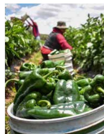
La presencia de 'picudo' u otras especies como mosquita blanca fue casi nula, sobre todo ahora que el ciclo agrícola está prácticamente de salida.

Castelo hizo un llamado a los productores a terminar de producir en tiempo y forma, debido a que el día de 10 de junio es la