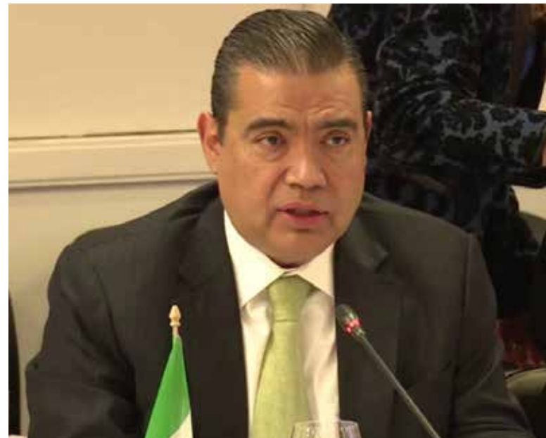
Gustavo Rómulo Salas Chávez, será el nuevo fiscal en Sonora.