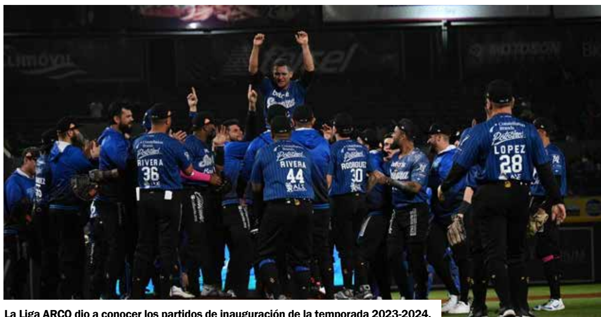
La Liga ARCO dio a conocer los partidos de inauguración de la temporada 2023-2024.