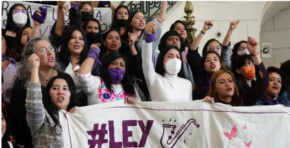
Con la ley se establecen penas de 25 a 40 años y se adicionará el concepto a las legislaciones, además que el Estado estaría a cargo de la reparación del daño.

Con ésta se establecen penas de 25 a 40 años y se adicionará el