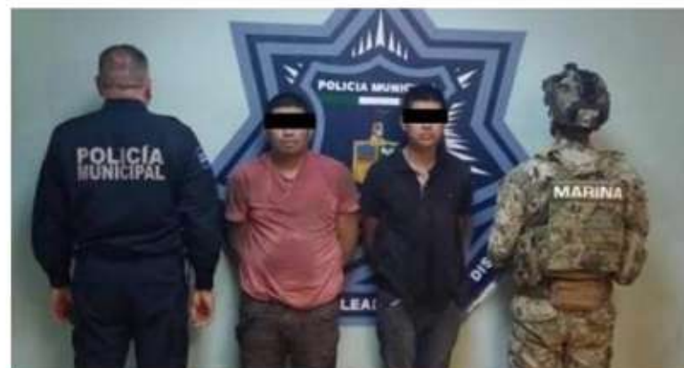
Los presuntos fueron detenidos en un operativo especial implementado en el centro de la ciudad.

Un arma de alto poder, diversos cartuchos útiles y drogas fue lo que agentes de la Secretaría de Seguridad Pública en conjunto con Marina, lograron decomisar tras un operativo especial en el Centro de la Ciudad, capturando a dos personas del sexo masculino.