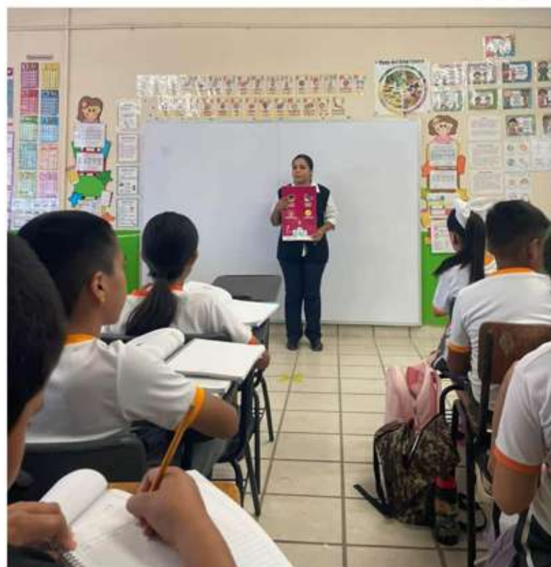
Autoridades de salud implementan recorridos de orientación especialmente en las escuelas para enseñar a los estudiantes medidas preventivas contra el dengue.