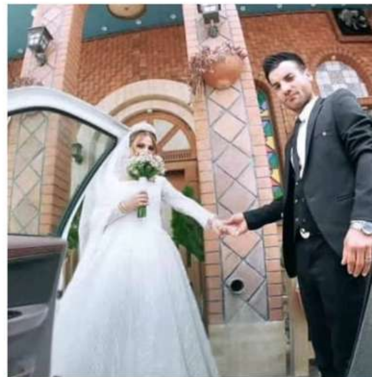
Fue cuando disparaban al aire y accidentalmente accionaron el arma directo a él.

El hombre que accidentalmente mataría al novio, bailaba con un buen humor y al menos disparó en seis ocasiones al cielo para seguir con el ritmo de la música. Pero cuando de nueva cuenta accionó su arma larga ahora mientras se quitó su turbante de la cabeza, jaló el gatillo mientras sostenía el arma de manera horizontal.