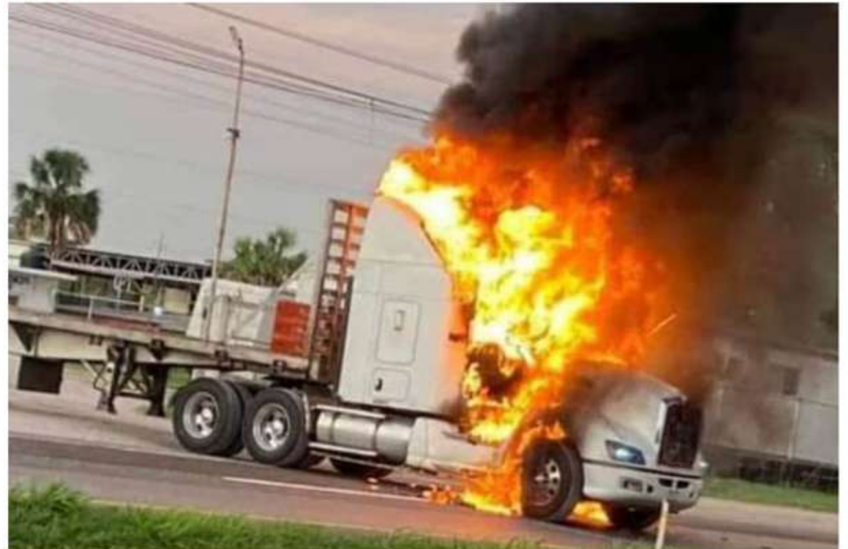
Autoridades intensificaron la vigilancia en la zona, para evitar más atentados.

lida que conecta a Villahermosa, donde se registró un severo caos vial precisamente porque otro tráiler fue dejado ahí para cerrar la circulación.