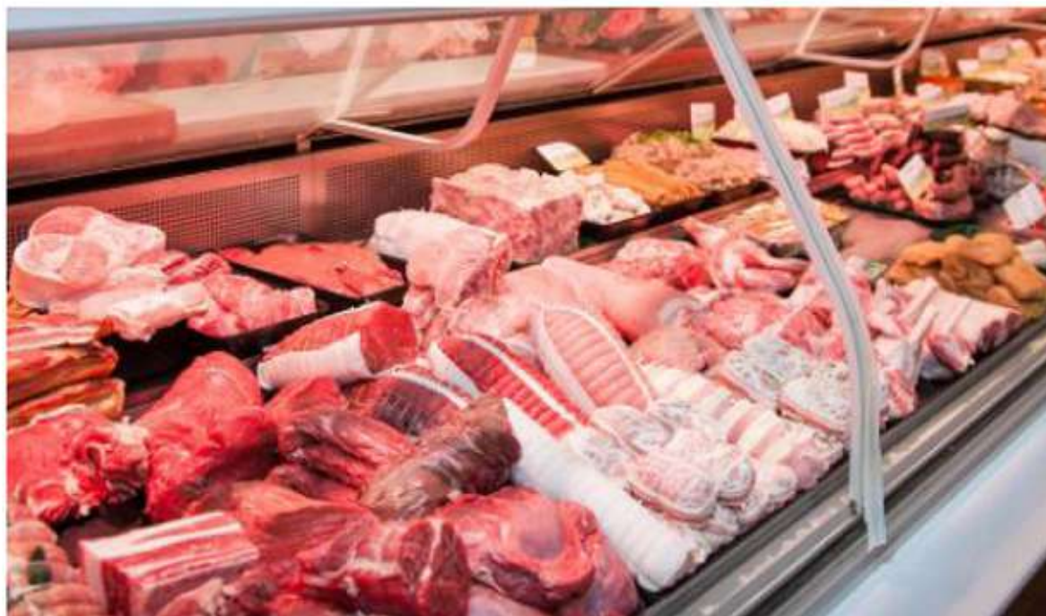
La calidad de la carne ha permitido que se pueda exportar con mayor facilidad.

Según datos del Servicio de Información Agroalimentaria y Pesquera (SIAP), de enero a agosto Sonora reportó 203,677.569 toneladas de este alimento, mientras Jalisco, entidad que ocupa el primer lugar en el país, produjo 267,518.834 toneladas.