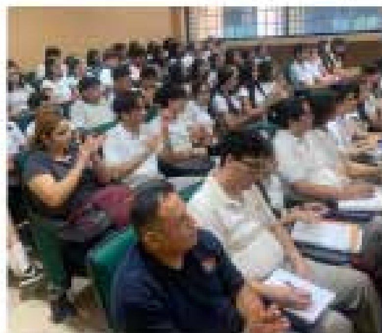
Estudiantes de preparatoria participan en el Primer Foro Estatal de Energías Limpias.

Las autoridades continúan recopilando pruebas y testimonios para entender completamente los eventos que llevaron a esta violenta agresión y garantizar que se haga justicia en el caso.