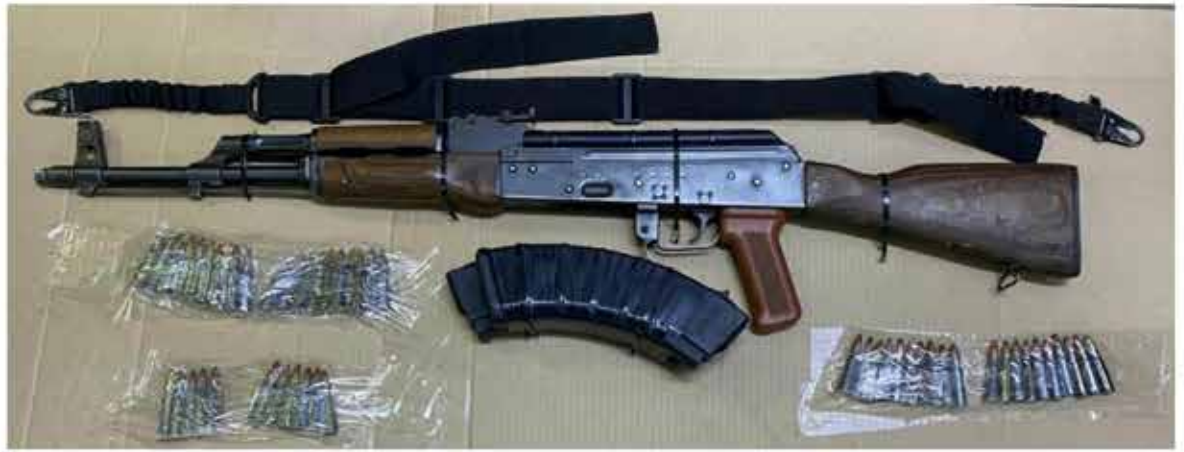
Oficiales de la Policía Estatal de Seguridad Pública realizaron el aseguramiento de un hombre en posesión de arma de fuego, cargadores, cartuchos y un vehículo robado.

Todo lo descrito fue turnado a la autoridad correspondiente para continuar con las investigaciones, fincar responsabilidades y combatir este delito que afecta el desarrollo de los menores en la capital del Estado.