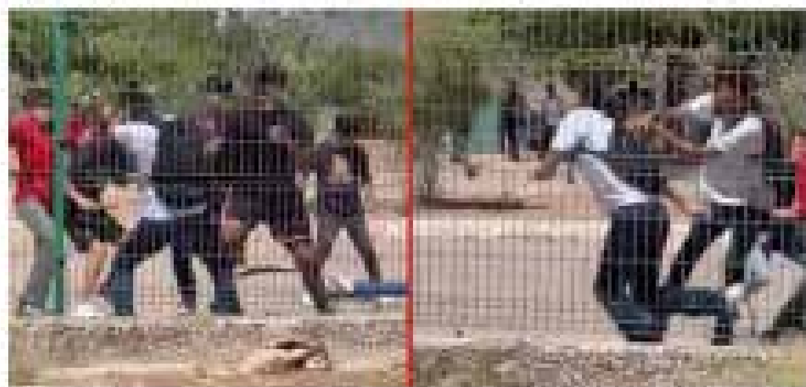
El estudiante fue golpeado y apuñalado por sus compañeros.