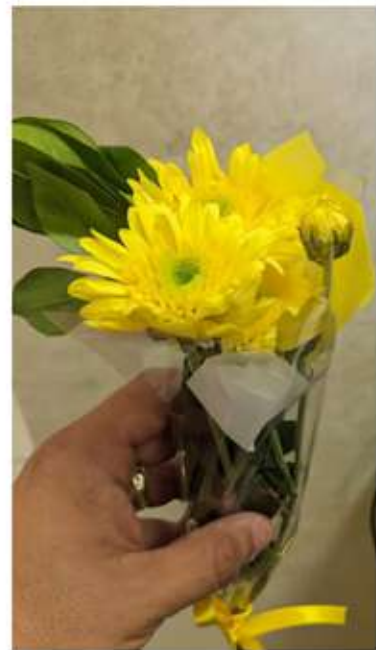
Rosas, girasoles, gerberas y margaritas, fueron de las más pedidas en las floristerías para regalarsé el pasado 21 de septiembre.

Esta tradición surge en Argentina por el inicio de la primavera y se popularizó por una canción de la novela Floricienta, y es que el regalar flores amarillas tiene como significado "estar juntos por siempre", así como alegría, felicidad y amor.