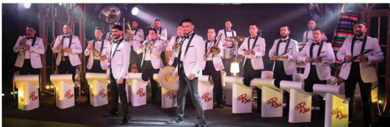
En la próxima entrega del Latin Grammy la banda 'El Recodo' va por el galardón a 'Mejor Álbum de Música de Banda', categoría en la que compete al lado de banda 'MS', 'La Arrolladora Banda Limón' y 'La Adictiva'.