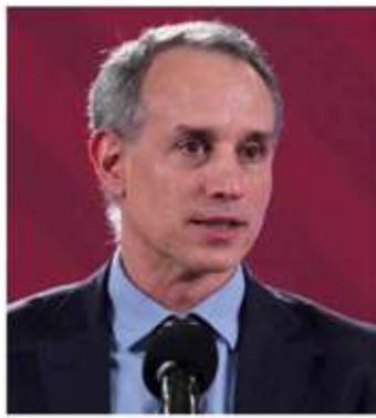
El funcionario hizo público su propósito de ser el coordinador de los Comités de Defensa de la Transformación en la Ciudad de México.