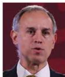
Hugo López Gatell

El subsecretario de Salud del Gobierno Federal, Hugo López Gatell, se "destapó" para la jefatura de Gobierno de la Ciudad de México, quien se la jugará contra Omar García Harfuch, para buscar la titularidad de la coordinación de la defensa de la Cuarta Transformación, en la metrópoli y enseguida convertirse en el candidato en las elecciones que se llevarán a cabo en el 2024. Tanto en las redes sociales como en una entrevista con un medio de comunicación masiva, habló de sus intenciones de ir por la jefatura de gobierno en mención, dado