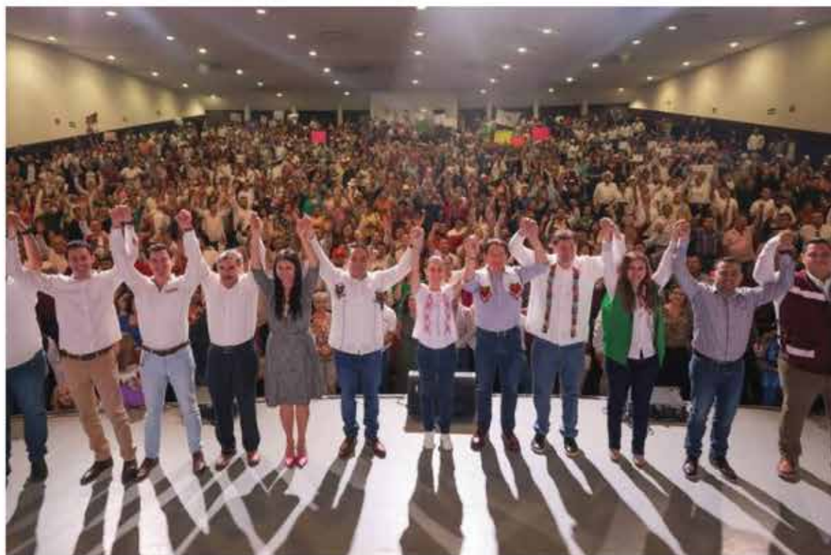
Claudia Sheinbaum Pardo, coordinadora Nacional de los Comités de Defensa de la Cuarta Transformación, estuvo en Hermosillo para firmar el acuerdo "La Esperanza Nos Une", donde sostuvo una reunión con liderazgos y simpatizantes de Morena.