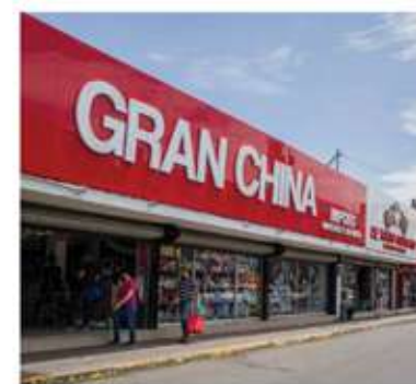
Comerciantes del primer cuadro de la ciudad de Hermosillo están preocupados por la próxima apertura de un mall chino, en el sector centro.

López Peralta indicó que no generan un valor económico mediante empleos formales y con prestaciones de ley, por lo que invitó a reflexionar sobre si al comprar en estos comercios estamos asegurando un futuro laboral estable y con beneficios para nuestros hijos.