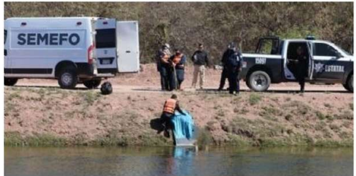
Un hombre fue ultimado a tiros en la orilla del Canal Alto frente a Laguna Encantada; su cadáver fue rescatado por Bomberos.

Trascendió que el cadáver fue recuperado a eso de las 00:55