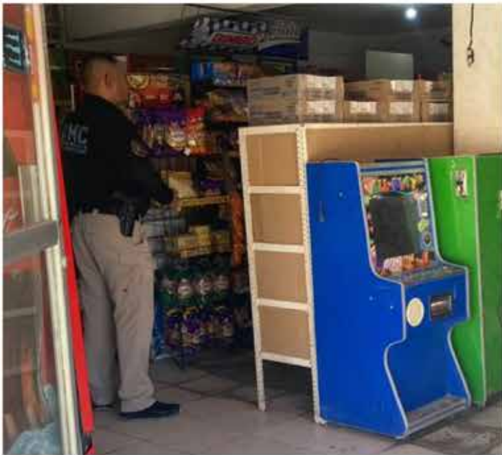
Elementos de AMIC aseguran 11 máquinas tragamonedas y un arma de fuego en cateo a cinco comercios de Hermosillo.

Oficiales de la PESP continúan en Caborca y municipios del norte del Estado, trabajando con los tres niveles de gobierno para atender la denuncia y promover el reporte del delito a la línea anónima 089.