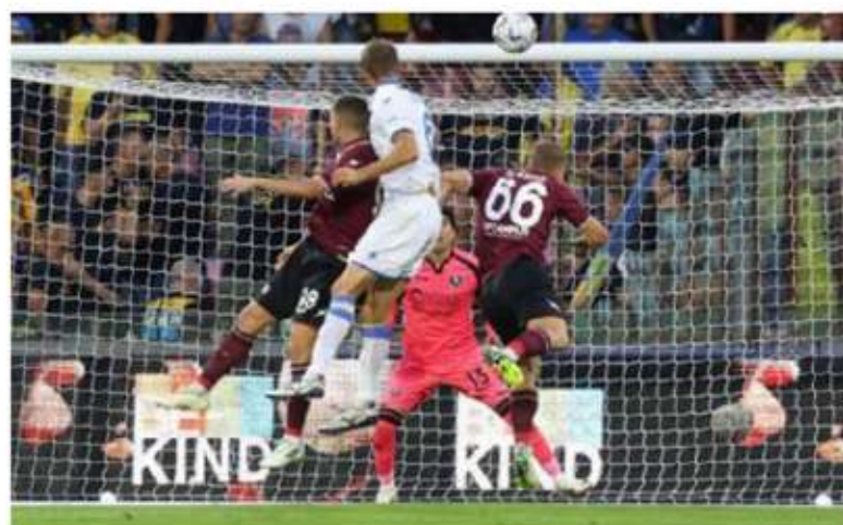
El equipo del mexicano sigue sin ganar en el torneo.

con el tanto de Firas Al Buraikan del Al Ahli al 87. Si bien hubo 10 minutos de agregado, el equipo de Cristiano aguantó el marcador para quedarse en el quinto lugar de la clasificación con 15 puntos a tres del líder, Al Ittihad.