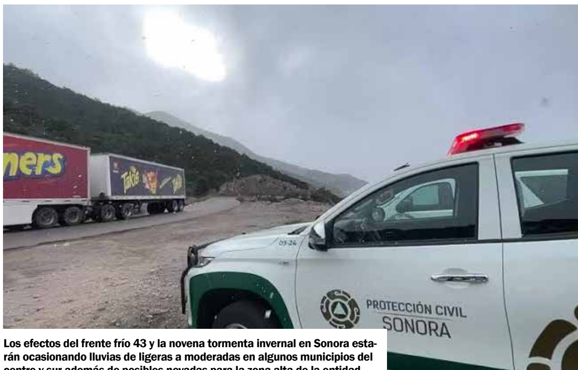
Los efectos del frente frío 43 y la novena tormenta invernal en Sonora estarán ocasionando lluvias de ligeras a moderadas en algunos municipios del centro y sur además de posibles nevadas para la zona alta de la entidad.

"Movilizamos elementos de los destinos turísticos a carreteras principalmente. Hay que recordar que esta semana va ser