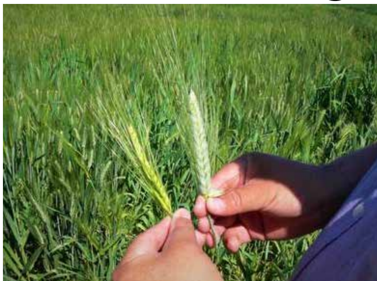
Las bajas temperaturas son fundamentales para el buen desarrollo del trigo.

El ciclo agrícola pasado se registraron en algunas estaciones