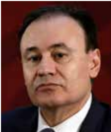
Alfonso Durazo Montaño