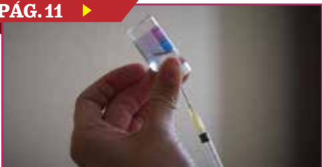
INICIA CAMPAÑA DE VACUNACIÓN