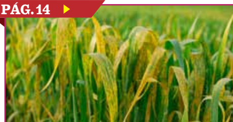
PIDEN ESTAR ALERTA ANTE LA PRESENCIA DE LA ROYA