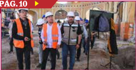
SUPERVISAN OBRA DE MERCADO MUNICIPAL