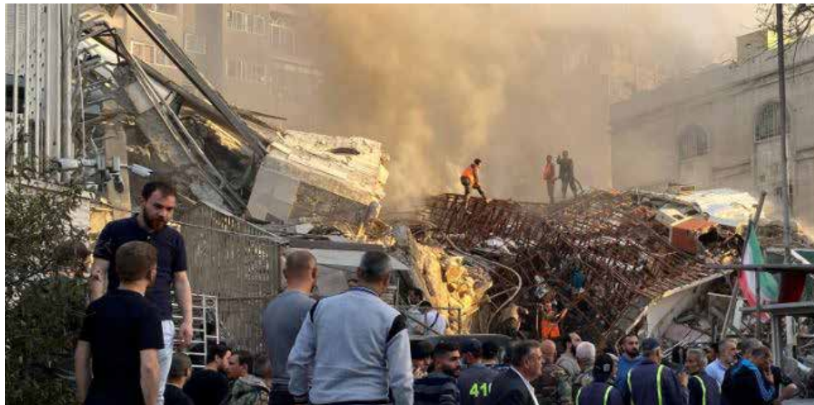
Este bombardeo se produjo días después de que el OSDH informara de ataques israelíes en Siria en que murieron 53 personas.

No hubo comentarios inmediatos por parte de Israel, que desde el inicio el 7 de octubre de su guerra en la franja de Gaza contra el movimiento islamita palestino Hamas