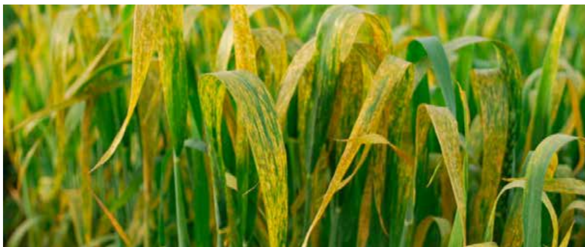
La Junta de Sanidad, señaló que siguen atendiendo los predios afectados.

Según el organismo, de la semana del 17 al 23 de marzo se han