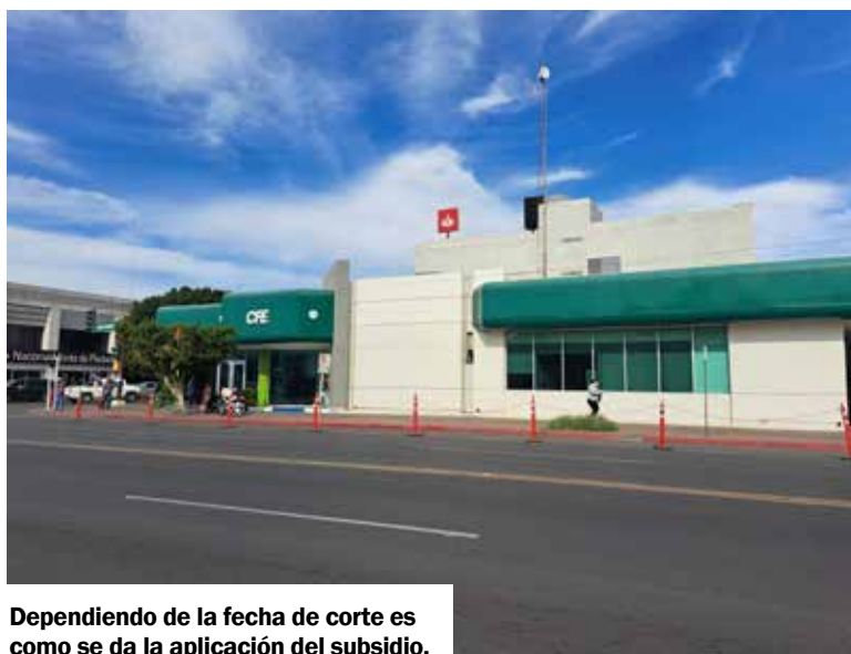
Dependiendo de la fecha de corte es como se da la aplicación del subsidio.

‘Anunciamos a la gente que esté muy atenta y no deje de marcar al 071, con recibo en mano para que