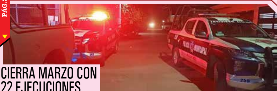
CIERRA MARZO CON 22 EJECUCIONES