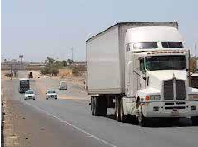
La Cámara Nacional del Autotransporte de Carga en Sonora y el Gobierno del Estado trabajan para instalar paraderos seguros en diversos puntos de la entidad para cuidar la integridad de operadores.