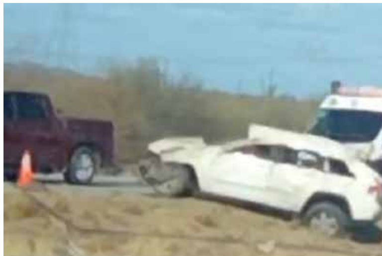
Ambos viajaban a bordo de una vagoneta de color blanco, conducida por Lázaro Uriel, quien por razones que se desconocen perdió el control del volante.

Ambos viajaban a bordo de una vagoneta de color blanco,