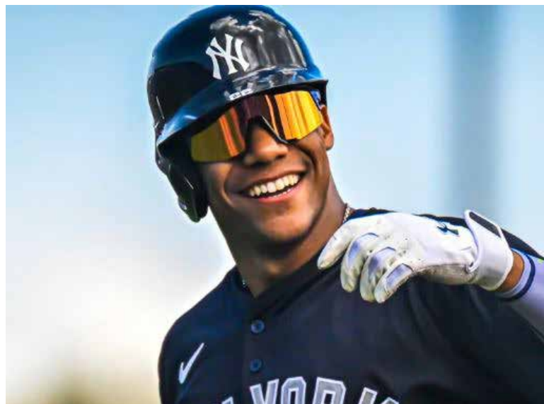
Para el dominicano representa la tercera selección de su carrera.

El jardinero dominicano bateó para .529 de average con un jonrón, 4 carreras remolcadas, un doble, 3 boletos negociados, dos rayitas anotadas y .765 de slugging en la primera serie del equi-