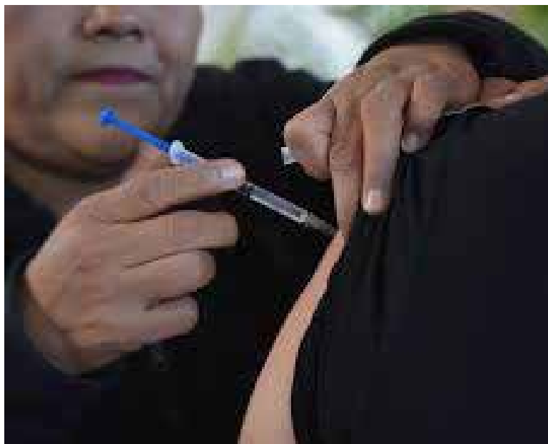
La Secretaría de Salud (SSA), inició este 1 de abril la Campaña de Vacunación contra el sarampión, rubéola, parotiditis y poliomielitis en Sonora mediante la aplicación de vacuna triple viral y hexavalente.

Cabe destacar que las acciones de vacunación han contribuido a mantener la eliminación de poliomielitis y sarampión en So-