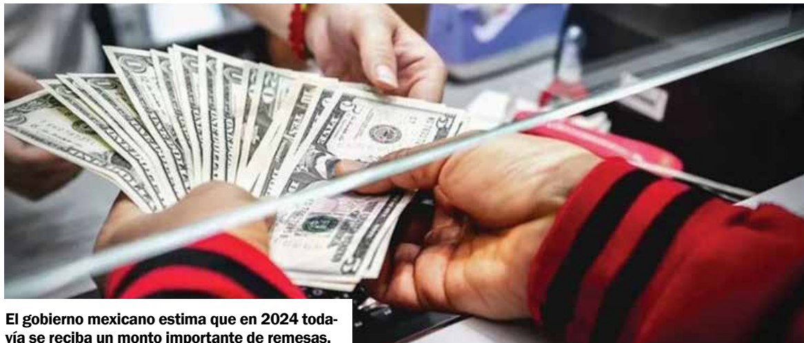
El gobierno mexicano estima que en 2024 todavía se reciba un monto importante de remesas.

En el acumulado de enero a febrero preámbulo de los procesos electorales en México y parte de las primarias en Estados Unidos