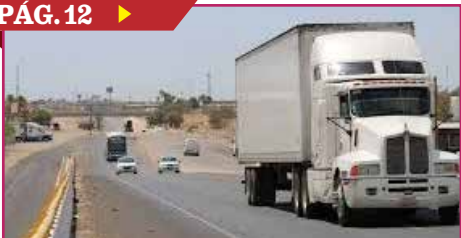
HABRÁ EN SONORA PARADEROS SEGUROS