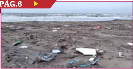
QUEDAN PLAYAS LLENAS DE BASURA