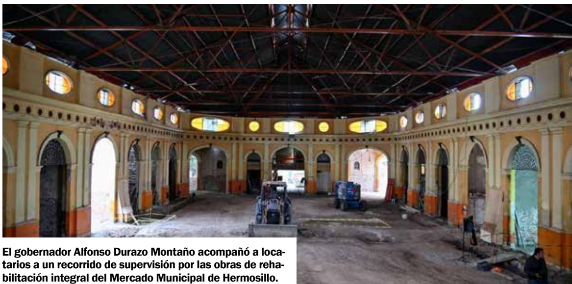
El gobernador Alfonso Durazo Montaña acompañó a locatarios a un recorrido de supervisión por las obras de rehabilitación integral del Mercado Municipal de Hermosillo.