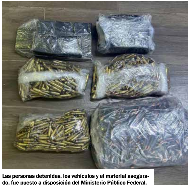
Las personas detenidas, los vehículos y el material asegurado, fue puesto a disposición del Ministerio Público Federal.