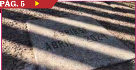
ABRIRÁN 'CÁPSULA DEL TIEMPO' EN TÉCNICA 2