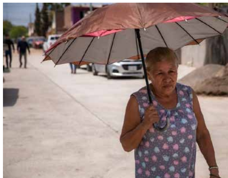
Sería a partir de este martes cuando en el estado de Sonora se comiencen a presentar valores máximos de temperaturas cercanos a los 40 grados.

Precisó, que los municipios que estarán presentando las tempera-