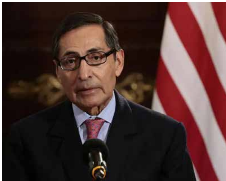
El secretario de Hacienda (SHCP), Rogelio Ramírez de la O, participó en un foro del Atlantic Council de Washington.

El secretario explicó que el enfoque del Gobierno de Andrés Manuel López Obrador es el de construir "una economía para el pueblo mexicano", pero a la vez tiene una de las economías más abiertas de América Latina, dado