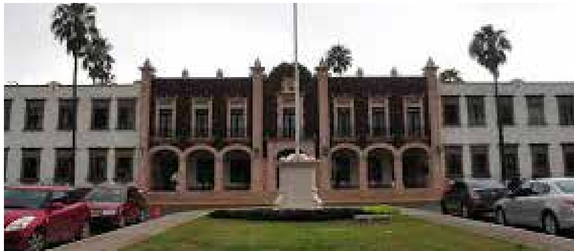
La Universidad de Sonora y el Gobierno del estado han hecho un esfuerzo presupuestal de carácter histórico y hasta el límite de lo que permiten los recursos de ambas instituciones.

Desde el Gobierno de Sonora, se hace un respetuoso llamado a las autoridades universitarias y a los representantes sindicales para persistir en un diálogo caracterizado por la prevalencia del interés público, con el fin de reanudar a la brevedad las actividades de la Unison, de tal manera que no se vea afectada la comunidad estudiantil.