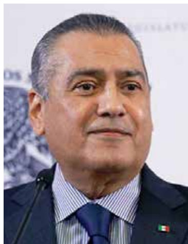
Manlio Fabio Beltrones