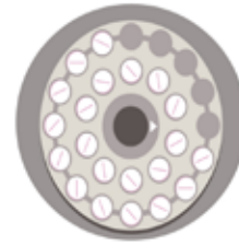
Pastillas anticonceptivas hormonales