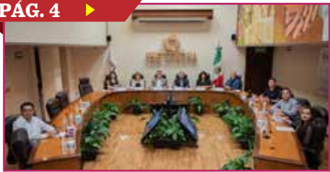
DEBATIRÁN EL 11 DE MAYO