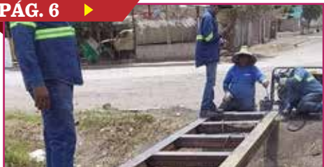
REPARAN CIUDADANOS PUENTE PEATONAL