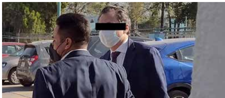
La FGR planeaba formalizar la acusación por su presunta participación en el delito de operaciones con recursos de procedencia ilícita.

En esta ocasión, el Segundo Tribunal Colegiado en Materia de Apelación en Materia Penal admitió a trámite una nueva solicitud de amparo de Lozoya Austin, en la que impugnó la resolución emitida por el Primer Tribunal Colegiado en la citada materia, en la que se ordenó reabrir el caso de