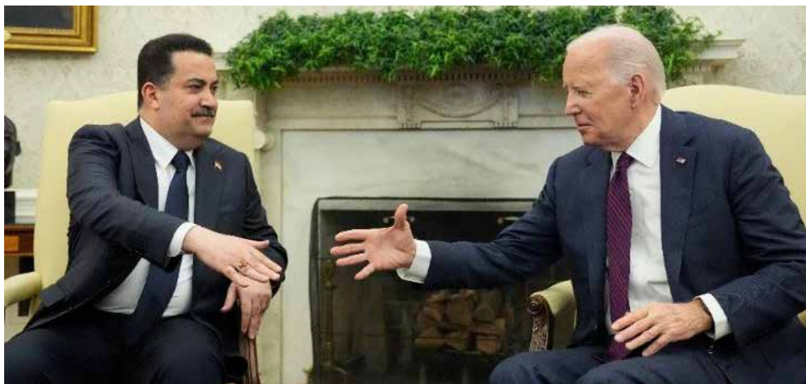
El presidente de Estados Unidos, Joe Biden, se reunió con el primer ministro de Irak, Mohamed Shia al Sudani, en la Casa Blanca.

“Hemos visto información que afirma que los iraníes querían fracasar, y que este fracaso impresionante y bochornoso era deliberado”, declaró el portavoz del