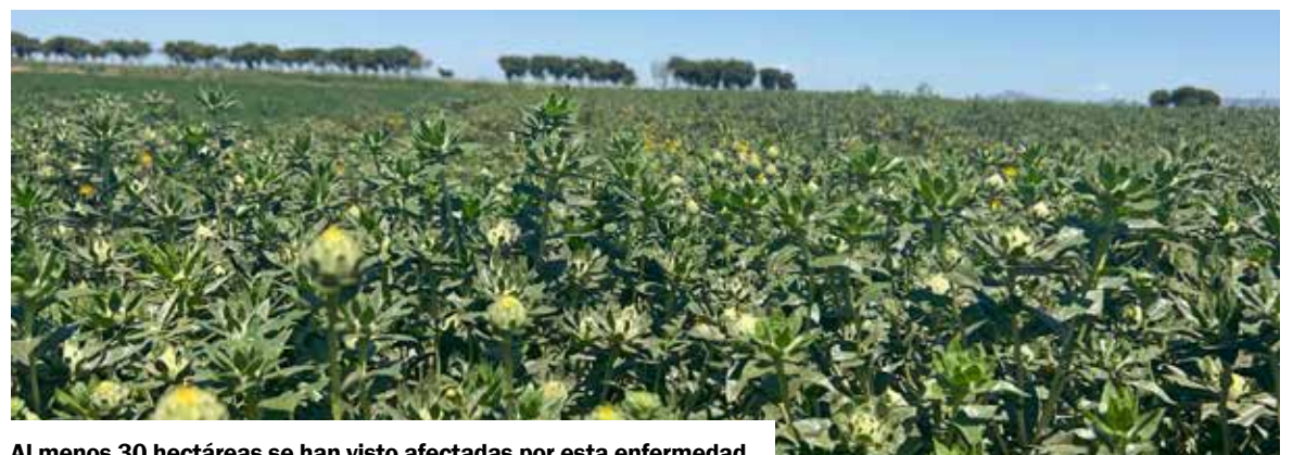
Al menos 30 hectáreas se han visto afectadas por esta enfermedad.

Se reveló que los productores establecieron en este ciclo 2 mil