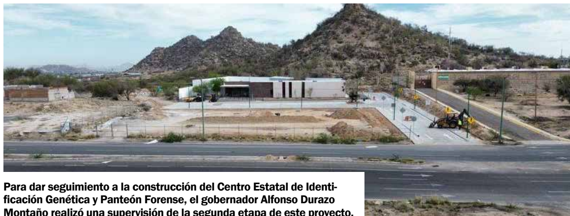
Para dar seguimiento a la construcción del Centro Estatal de Identificación Genética y Panteón Forense, el gobernador Alfonso Durazo Montaño realizó una supervisión de la segunda etapa de este proyecto.

H ERMOSILLO. Para dar seguimiento a la construcción del Centro Estatal de Identificación Genética y Panteón Forense, el gobernador Alfonso Durazo Montaño realizó una su-