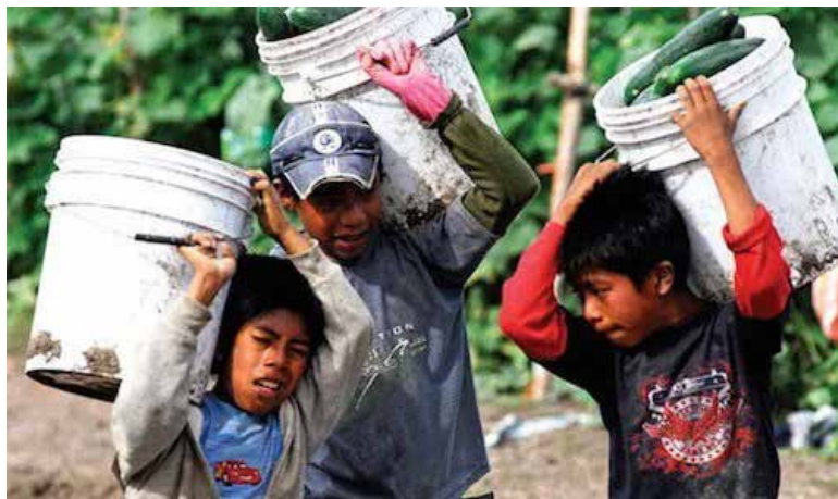
La Cámara de Diputados aprobó por unanimidad una propuesta del Partido Verde para reconocer y garantizar los derechos de las niñas, niños y adolescentes en situación de desamparo familiar.

La reforma a la Ley General de Derechos de las Niñas, Niños y Adolescentes busca atender al millón 600 mil menores de edad que viven en situación de orfandad, de acuerdo con cifras del