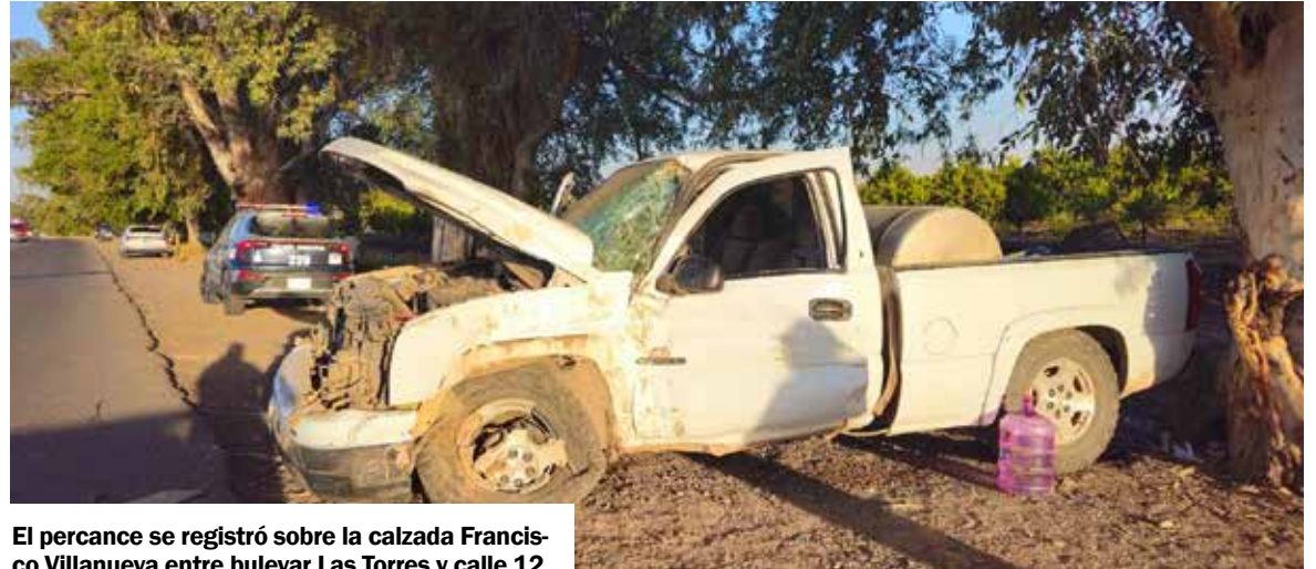
El percance se registró sobre la calzada Francisco Villanueva entre bulevar Las Torres y calle 12.