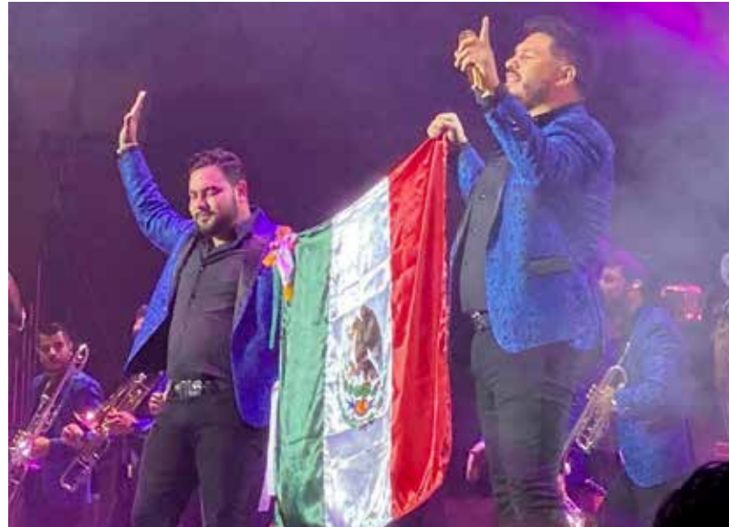
Por ser la música de banda una de las más representativas de México es que Andrés Manuel López Obrador desea que sean los intérpretes de 'El color de tus ojos' y 'Mi razón de ser' quienes se presenten en la noche del 15 de septiembre en el Zócalo de la ciudad de México.

"Estamos viendo, porque ya va a ser el último grito que me corresponde de Independencia el día 15, y va a ser de bandas, pero queremos bandas de Oaxaca, ahí están bandas de lo mejor, luego queremos algo que tenga que ver con mariachi y luego hay una banda, que de una aprovecho para decirle a la 'Banda MS' que los invitamos porque se han portado muy solidarios, muy fraternos", dijo el mandatario, quien cariñosamente es apodado por los mexicanos como 'cabecita de algodón'.