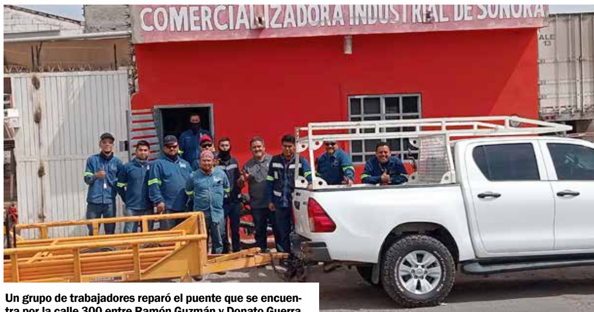
Un grupo de trabajadores reparó el puente que se encuentra por la calle 300 entre Ramón Guzmán y Donato Guerra.

Fueron trabajadores de los talleres MIE, Mantenimiento Industrial y Taller Mecánico 'El Pulpo' quienes se encargaron de reparar este puente peatonal, en espera que las autoridades le den el mantenimiento necesario.