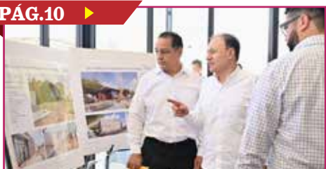
AVANZA CONSTRUCCIÓN DE PANTEÓN FORENSE