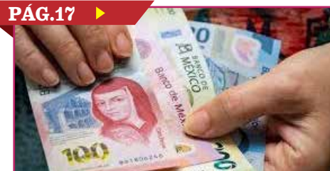
'PROBLEMAS GLOBALES AFECTA LA ECONOMÍA'