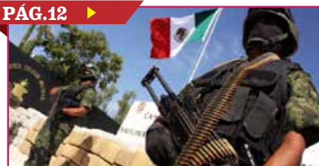
SEÑALAN CORRUPCIÓN EN COMBATE AL NARCOTRÁFICO