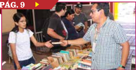
CELEBRA ITSON LA LITERATURA