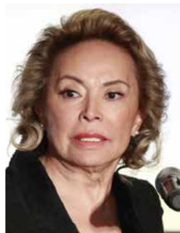
Elba Esther Gordillo