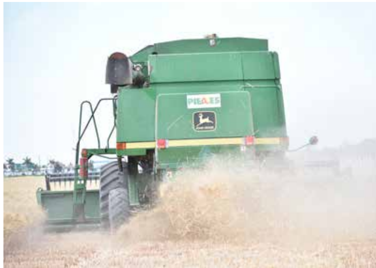
Valle del Yaqui se prepara para cosecha de trigo.

De acuerdo con especialistas, este no parece ser un buen año para el cereal con relación a los precios que se mantienen bajos generando incertidumbre en el sector, además de que existe el