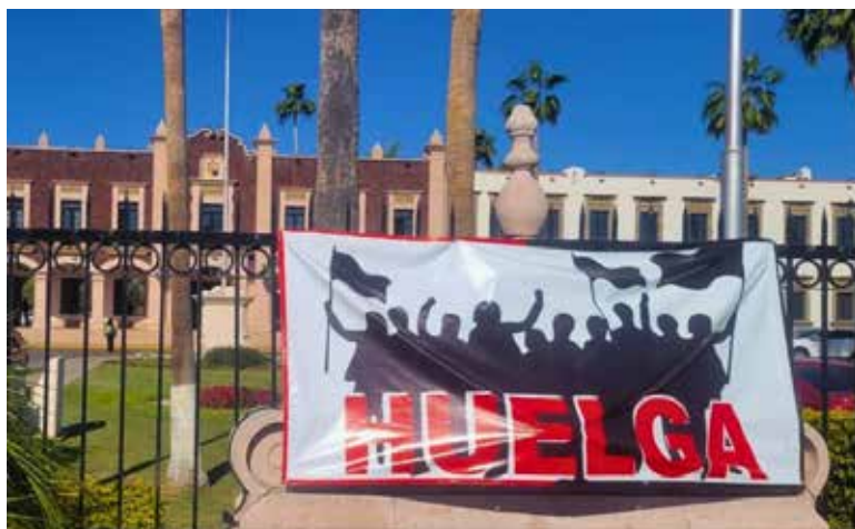
Agremiados del Staus decidieron que es insuficiente el último ofrecimiento económico por parte de las autoridades de la Unison.