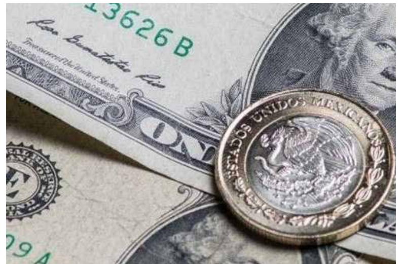
Reconocen empresarios sonorenses que la apreciación actual del peso frente al dólar estadounidense, afecta directamente la operatividad de cientos de empresas en la localidad y por consiguiente a nivel nacional.

En ese sentido el presidente de Index Sonora, detalló cómo el precio del dólar contra el peso, se encontraba en el 2020 en promedios de 21 a 22 pesos y actualmente se está por debajo de los 17 pesos, lo cual marca una brecha bastante importante.