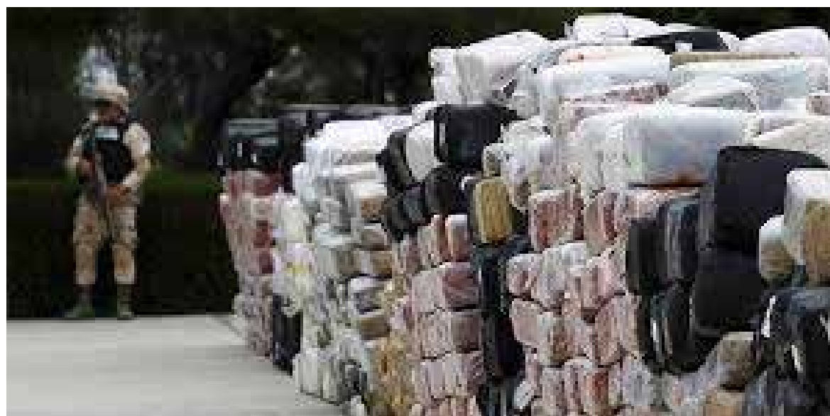
El Servicio de Investigación del Congreso de Estados Unidos publicó un informe sobre el papel que tiene México en el tráfico ilícito de fentanilo.

Además, el informe señala que la droga al parecer se fabrica en