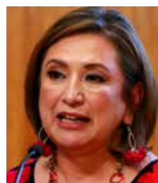
Xóchitl Gálvez Ruiz

Se dice que en los pasillos del edificio del PAN y de las bancadas en el Congreso de la Unión, se maneja la posibilidad de que la oposición esté preparando una "megamarcha" en contra del llamado "atraco de las afores", que ya aprobaron en comisiones los diputados de Morena, al considerarlo un grave riesgo para los trabajadores. Hay algunos legisladores y líderes políticos de oposición que ven con buenos ojos que se lleve a cabo una gran manifestación para protestar por este tema tan sensible para los trabajadores, e incluso hay quienes dicen que esto hasta podría ayudarle a la candidatura de Xóchitl Gálvez Ruiz, misma que ya dijo que las desesperación por sacar esa ley secundaria con la mayoría simple que tiene en el Congreso, es porque saben que van a perder en las próximas elecciones y ya les sería imposible forma ese Fondo de Pensiones, con dinero de las afores de personas mayores de 70 años, que sin duda corren el riesgo de que se los roben.