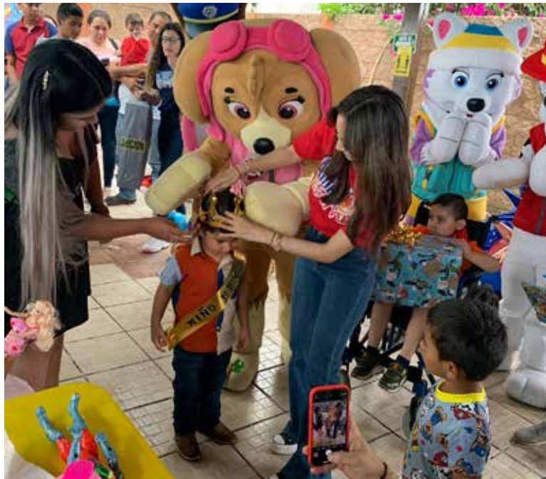
La Asociación Amar y Servir invita a la comunidad a apoyar en estos eventos especiales.

Por lo anterior, la Asociación Amar y Servir invita a la comunidad a apoyar en estos eventos especiales, ya sea con regalos, pasteles, piñatas, dulces y otros artículos, o bien participando en sus dinámicas y con donativos