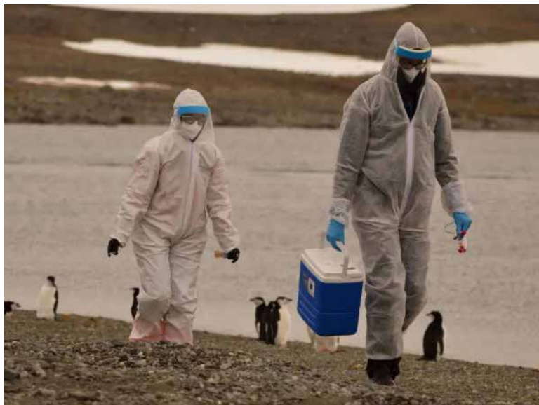
El virus H5N1 tiene alta mortalidad entre personas que se han contagiado de aves, por lo que la propagación en humanos aumenta el riesgo de mutaciones más severas.

humanos registrada en Estados Unidos y la cuarta notificada en el continente americano, con el caso anterior más reciente registrado en Chile en marzo de 2023.