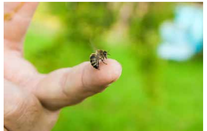
El veneno de una abeja contiene varias sustancias, entre ellas la melitina, fosfolipasa A2, e histamina.

tos Himenópteros se debe a la producción de anticuerpos tipo IGE, los cuales en contacto con