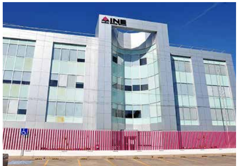
Confirma el Instituto Nacional Electoral que son más de 400 sonorenses en el extranjero que están en riesgo de no poder ejercer su voto por inconsistencias en su credencial de elector.

Especificó también, que se ha hecho la difusión y el llamado a que las y los interesados manden un correo electrónico a votoextranjero@ine.mx, soliciten la aclaración y en caso de que hayan sido dados de baja se deberá hacer un análisis, a fin de garantizar la certeza del padrón electoral y la lista nominal, que los registros sean auténticos.