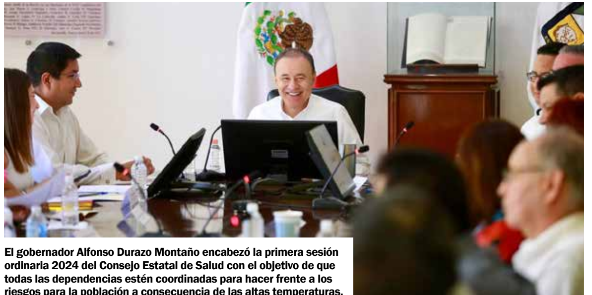
El gobernador Alfonso Durazo Montaño encabezó la primera sesión ordinaria 2024 del Consejo Estatal de Salud con el objetivo de que todas las dependencias estén coordinadas para hacer frente a los riesgos para la población a consecuencia de las altas temperaturas.