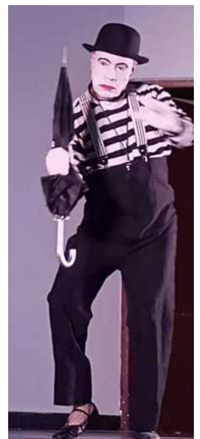
Las clases son impartidas por el actor Carlos Valenzuela.