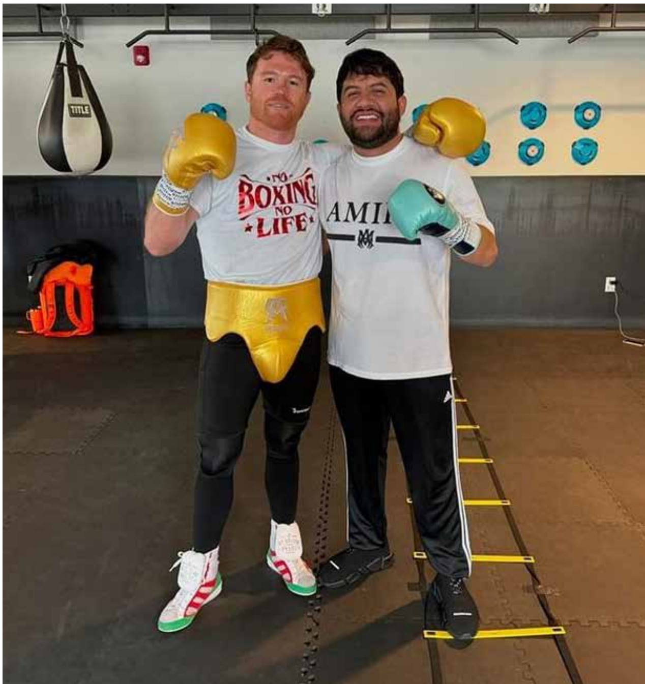
Es tanto el aprecio que se tienen Luis R Conriquez y Saúl 'El Canelo' Álvarez que muy a menudo se dejan ver juntos.

Pese a las fotografías en las que son vistos en guantes y short, los famosos personajes no han aclarado si fue un entrenamiento 'entre amigos' o si fue con la intención de aprender defensa personal, lo que se sabe es que Luis R Conriquez y Saúl 'El Canelo' Álvarez tienen una gran amistad, por lo que muy seguido se dejan ver juntos en fiestas o en algún otro tipo de reunión.