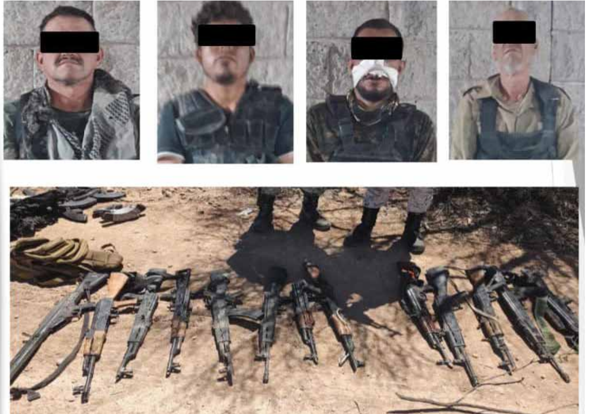
Detenidos, droga y el material bélico asegurado, fue puesto a disposición del Ministerio Público Federal.