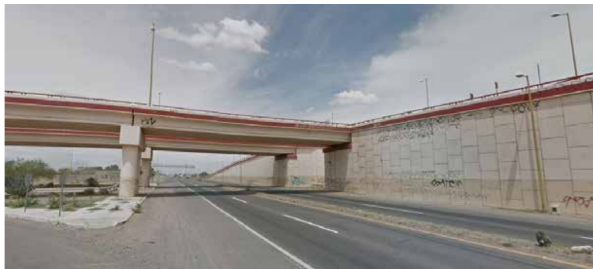
La manta fue dejada en el puente de la carretera Internacional y Bordo Nuevo a unos tres kilómetros al norte de la localidad.

Las pérdidas materiales, se estimaron en mil pesos. De lo anterior se hicieron oficiales de Tránsito Municipal y elaboraron un Informe Policial Homologado para dar conocimiento al Ministerio Público para los fines correspondientes.