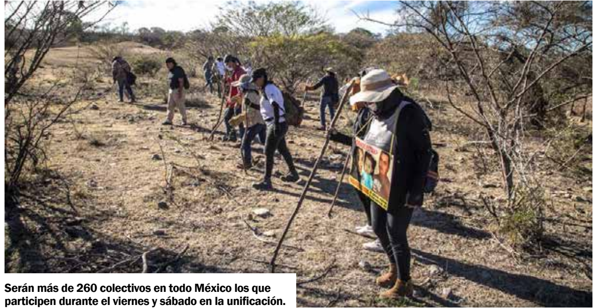
Serán más de 260 colectivos en todo México los que participen durante el viernes y sábado en la unificación.