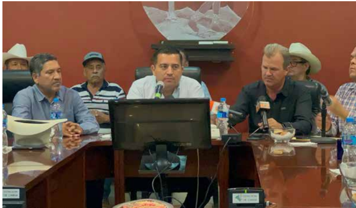
Los productores siguen en incertidumbre por los bajos precios y nulos apoyos por parte de las autoridades.