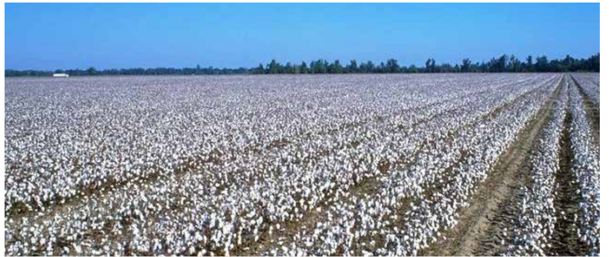
Valle del Yaqui retoma siembra de algodón con programa piloto.

Comentó que con este nuevo plan piloto hubo áreas afectadas por las heladas que se tuvieron que resembrar y otras sufrieron afectaciones como la desaceleración en el desarrollo de la planta, pero podrá reponerse con el tiempo.