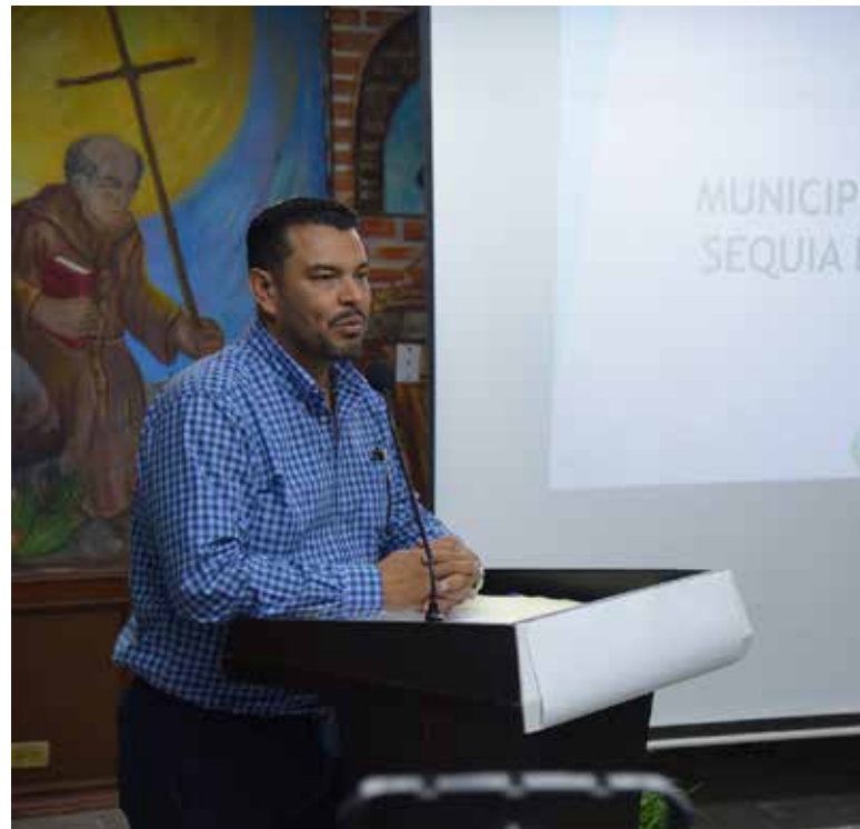
No hay impacto negativo en disposición de agua para suministro humano.

una campaña permanente para crear concientización en el uso adecuado del agua, por lo que reitera el llamado a cuidar el agua y a