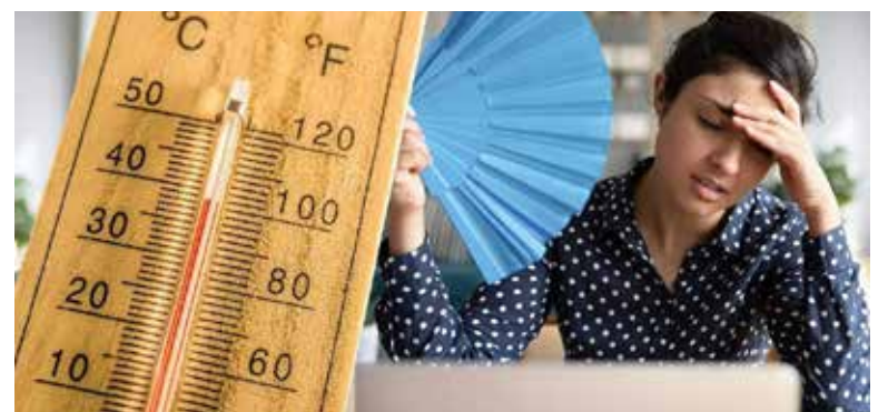
Deshidrataciones y diarreas, son las principales enfermedades que se presentan durante la temporada de calor, por lo que es necesario que la ciudadanía tome precauciones ante el incremento de temperaturas.

“Cómo podemos nosotros evitar un golpe de calor o deshidratación, podemos aplicar bloqueador solar, usar ropa delgada pero que cubra, no estar en temperaturas muy altas por tiempo prolongado, tratar de disminuir bebidas alcohólicas y azucaradas” dijo.