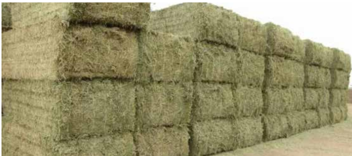
Actualmente las pacas rondan los 90 y 150 pesos, dependiendo lo que pese.

Por último, con el inicio de las trillas, el esquilmo se podría utilizar como alimento para ganado, aunque los productores tendrán que suplementarla con algunas vitaminas.