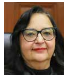
Norma Lucía Piña

Legisladores del Partido Acción Nacional, ven improcedente la solicitud de juicio político en contra de la ministra Norma Lucía Piña Hernández, presidenta de la Suprema Corte de Justicia de la Nación (SCJN) sencillamente porque conocen el tema y no ven ni de cerca las condiciones para que prospere esa solicitud que tiene que pasar por una serie de filtros y análisis, donde se han quedado atorados alrededor de 250 juicio a igual número de políticos a los que se les ha demandado por diferente razones que no alcanzan a configurar la figura del juicio político. Dijeron que la ruta comienza en la Comisión de Examen Previo en San Lázaro la cual determina si es procedente o no. Después se turna a la Comisión Jurisdiccional, la que recibe pruebas y alegatos para emitir un dictamen que pasa al pleno por mayoría calificada y de ahí siguen otra serie de pasos, que hacen muy engorroso el trámite y terminen por colapsar, por eso es muy remota o casi nula la sometida a un juicio de ese tipo, además ella solo recibió la denuncia anónima, que carga nervioso al exministro presidente Arturo Zaldívar Lelo De Larrea.