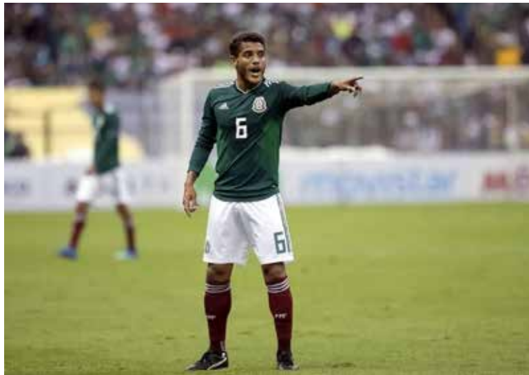
Jonathan Dos Santos confirmó que es un hecho su retiro de la Selección Mexicana y subrayó que la Copa del Mundo del 2026 no es algo que esté en sus planes.

‘Lo comenté, siento que ahora mismo ya no es mi momento de estar en la Selección (Mexicana), estoy 100 por ciento concentrado en América, es mi prioridad, me han dado todo. Estoy feliz por mi decisión porque sé que la Selección me ha dado muchísimo, también hay jóvenes muy talentosos, jugadores increíbles, un entrenador espectacular. Yo creo que les va a ir muy bien, están en un proceso y en los años siguientes les va a ir muy bien’, expresó.