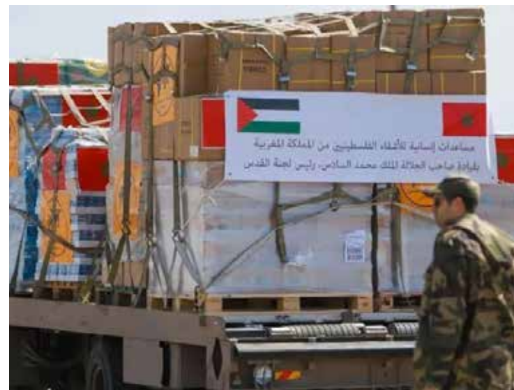
Israel anunció el ingreso a Gaza de cargamentos de harina del Programa Mundial de Alimentos (PMA) desde el puerto de Asdod.

Frente a esta evolución, Farrar señaló que ahora será importante determinar cuántas infecciones humanas con el virus H5N1 están pasando desapercibidas porque es en esta situación que se afronta el mayor riesgo de una mutación del virus.