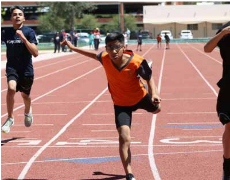
Del 23 al 25 de abril cerca de dos mil estudiantes deportistas de primaria y secundaria participarán en los Juegos Deportivos Estatales Escolares de la Educación Básica.

La SEC Sonora reconoció el esfuerzo realizado por la comunidad escolar para impulsar la práctica de algún deporte como hábito de vida saludable, a través de las distintas etapas eliminatorias que tuvo el evento.