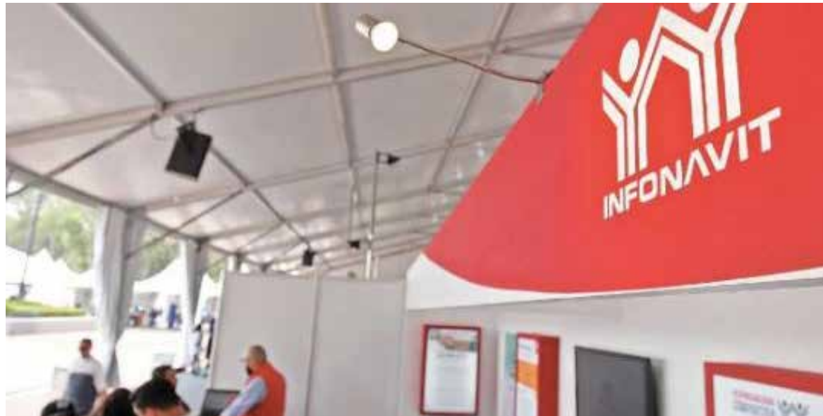
De ser aprobada la propuesta que está pendiente de discusión en el pleno de la Cámara de Diputados, el dinero llegaría al fondo de pensiones.

El traspaso de estos recursos más los que se encuentran sin movimiento en las administradoras de ahorro para el retiro (Afore) “no significa de ninguna manera que se tomarán recursos de los trabajadores”, en-