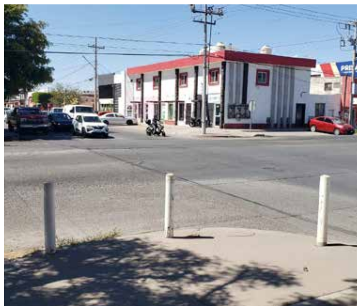
El circular a elevadas velocidades ha sido uno de los factores para que se presenten accidentes con mayor recurrencia.

Sin duda, la reunión será clave para sellar este acuerdo y darles a los vecinos la seguridad y certeza que tanto merecen.