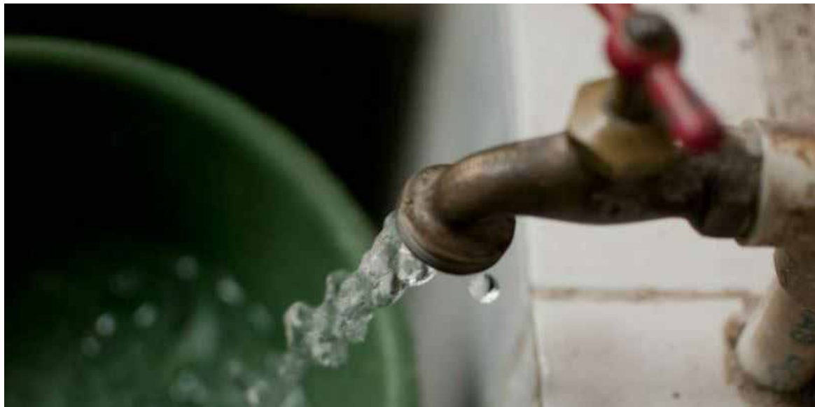
Está disponible recurso hídrico para la población, afirma el Distrito de Riego del Río Yaqui.