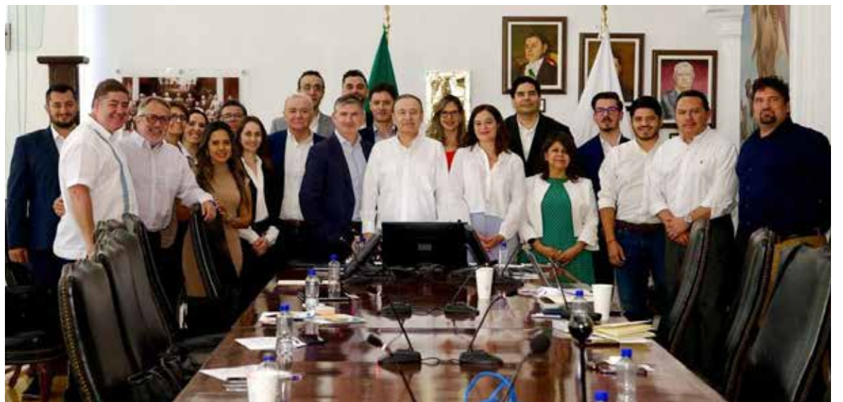
El gobernador Alfonso Durazo Montaña atendió la reunión de seguimiento con la Delegación de la Cámara de Comercio e Industria Franco-Mexicana.

Por más de un año se han tenido mesas de trabajo virtuales y en esta ocasión de forma presencial, donde se ha dado continuidad a los proyectos que buscan instalarse en la entidad, alineados con el proyecto de energías sostenibles que se implementa en Sonora.