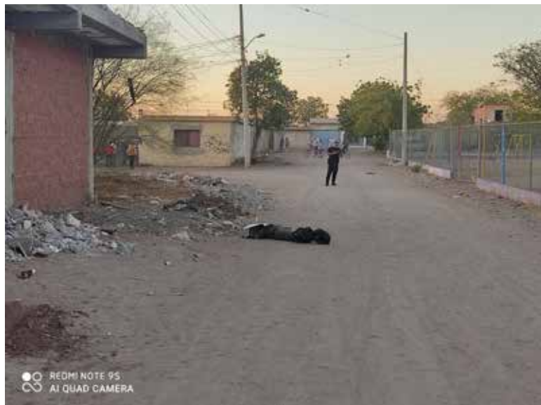
El cadáver fue dejado sobre la calle 12 de Noviembre entre Manuel Esperón y Juan Diego.

A un lado del cadáver, se encontró una cartulina blanca con un