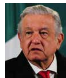
Andrés Manuel López

Con el fin de auto ungirse como el héroe y salvador de los mexicanos, es que el presidente de la República, Andrés Manuel López Obrador, pretende que se apruebe la nueva ley de las afores que se envió al Congreso de la Unión, con el propósito de que el Primero de Mayo en ceremonia especial, así como a él le fascina, crear el fondo de pensión del bienestar con el dinero de las afores de los trabajadores. Dijo que solo se tomará el dinero de aquellas afores que no sea reclamado, por personas mayores de 70 años que cotizaron en el Seguro Social, en tanto los del ISSSTE no se puede, porque en su ley dice que deben transcurrir 10 años inactivos los fondos para poder disponer de ellos.