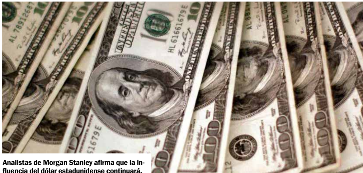
Analistas de Morgan Stanley afirma que la influencia del dólar estadounidense continuará.

La rivalidad con China, la guerra de Rusia en Ucrania, las disputas en Washington sobre el techo de deuda de Estados Unidos y el aumento de los niveles de deuda han puesto bajo escrutinio en los últimos años el