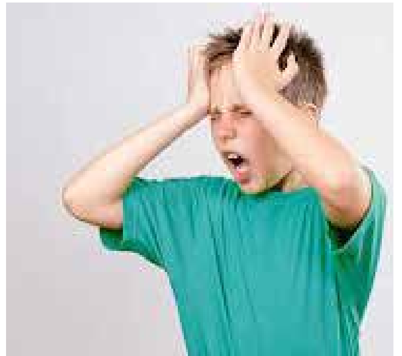
La Secretaría de Salud de Sonora llamó a crear conciencia sobre la cefalea.

La SSA comentó que, identificar los motivos de los dolores de cabeza con el apoyo de un profesional de la salud, ayudará a llevar un tratamiento adecuado y eficaz. Es importante mencionar