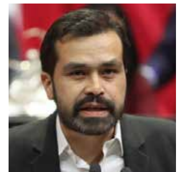
Jorge Álvarez Máynez

Y vaya que las novelas de ficción se están quedando cortas de frente a la realidad, pues mientras por un lado el Senador Monreal y otros -por encomienda de Palacio Nacional- tratan de pegarle una buen estrujada a la república, en uno de sus tres pilares fundamentales; por otro lado, por rumbos de Avenida Insurgentes Sur y Eje 10, en el edificio sede del Consejo de la Judicatura Federal, se está destapando la cloaca...y con bastante olor a metano.