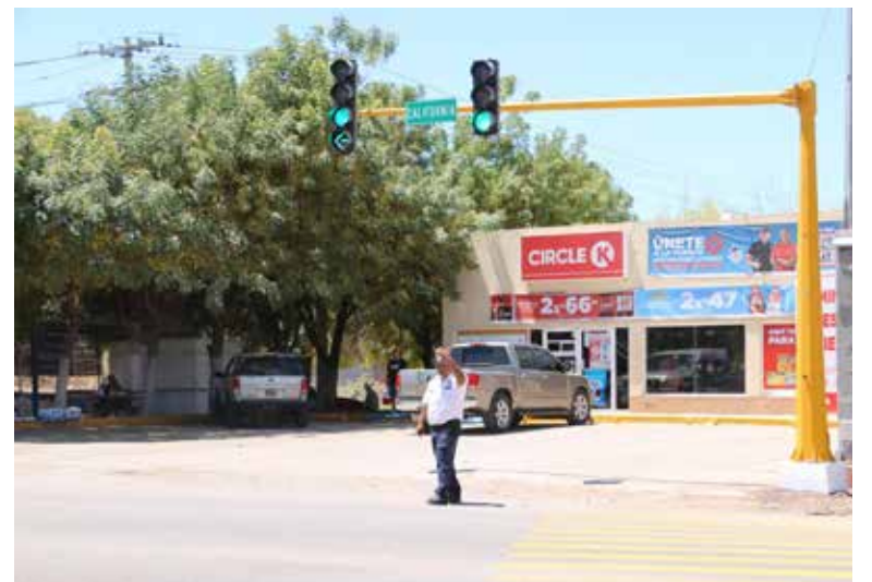
El semáforo se encuentra situado sobre la calle California y boulevard Villa Bonita, donde además se llevaron a cabo trabajos de pintura de franjas reductoras de velocidad y alto.

blica Municipal, recuerda que se labora en un plan enfocado en la prevención de accidentes y promoción de la cultura vial, en