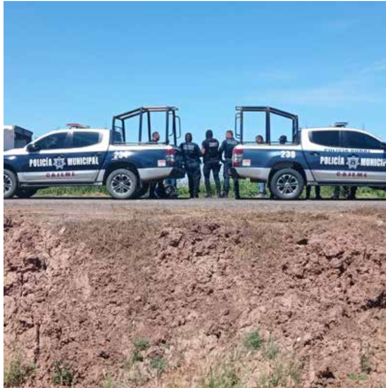
Los hechos se dieron por la calle Meridiano entre 500 y 600, al sur del Campo 5.

De inmediato fue cerrado el paso vehicular en calles 500 y 600