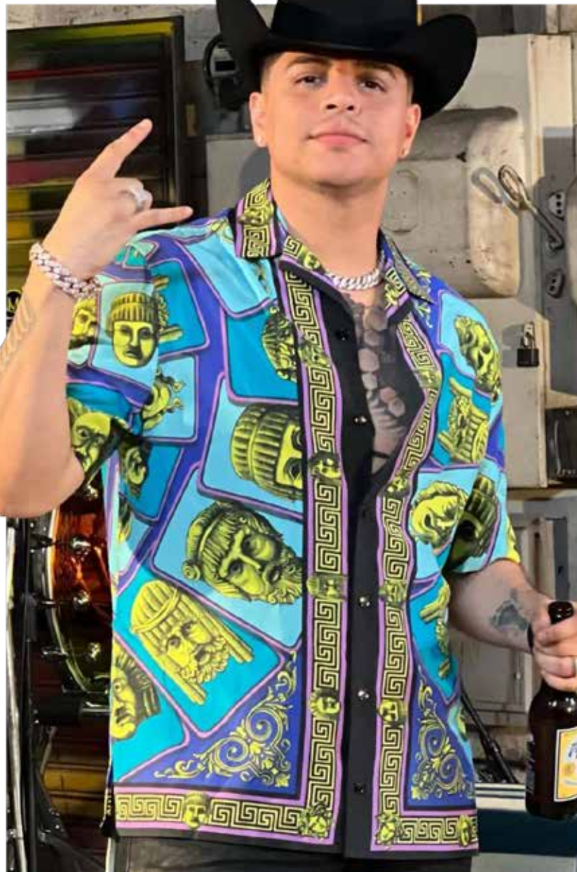
Eduin Caz discutió con una banda en Mazatlán porque le cobraron de más.

Video que ha generado opiniones encontradas entre los cibernautas, pues mientras unos están del lado del líder del grupo 'Firme', pues alegan que no se le escucha alterado, mucho menos se le oye regatear, sino todo lo contrario, hay quienes también se burlan de él.