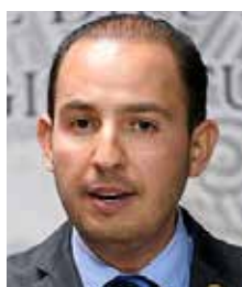
Marko Cortés Mendoza