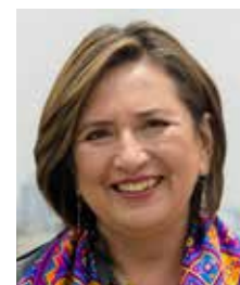
Xóchitl Gálvez Ruiz