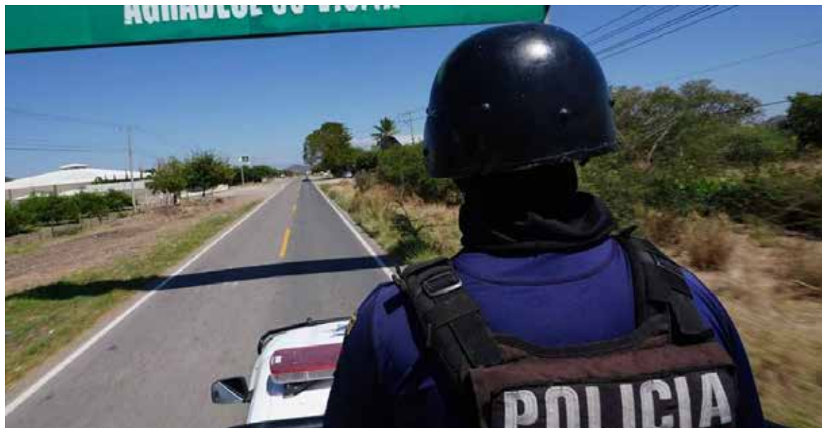
Desde que inició el sexenio el 1 de diciembre de 2018 y hasta el 18 de abril de 2024 se han registrado, al menos, 2 mil 320 policías asesinados

Durante enero de 2024, Causa en Común documentó 24 asesi-