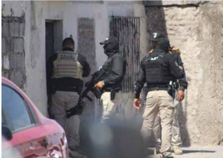
La inesperada diligencia se efectuó por la calle Vicente Suárez entre Coahuila y Tabasco.

Uno de ellos cuenta con aproximadamente 25 años y el otro 40. Se les aseguró una maleta roja desconociéndose si tenía droga o