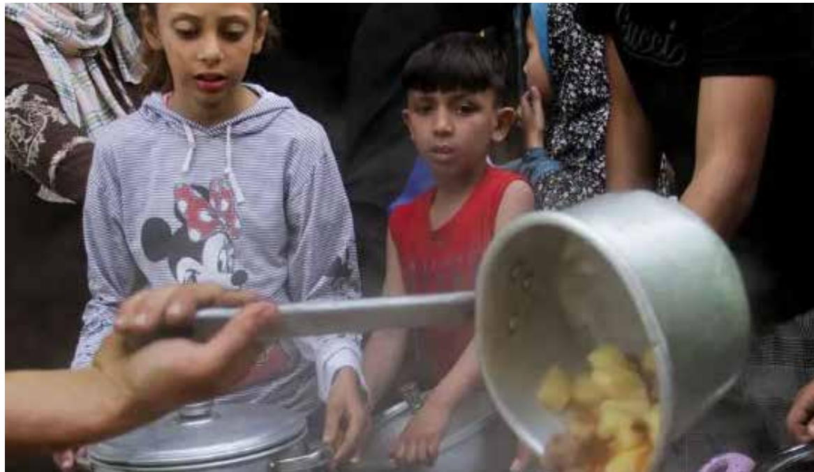
A pesar de que la producción de cereales aumentó, la inflación fue el gran problema del país caribeño.

El número de personas en situación crítica aumentó en 24 millones respecto a 2022, según este informe elaborado conjuntamente por 16 agencias de la ONU y organizacio-