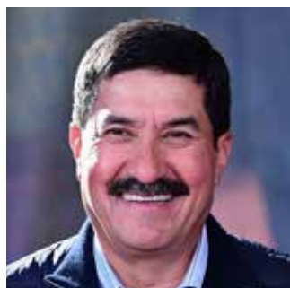
Javier Corral Jurado