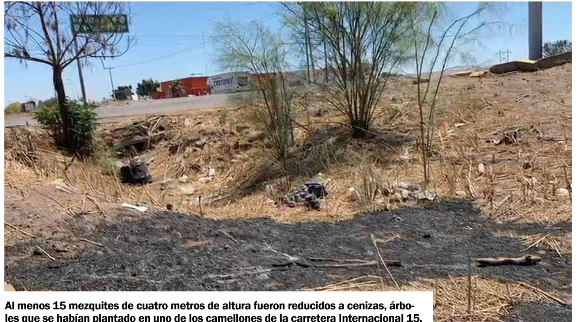
Al menos 15 mezquites de cuatro metros de altura fueron reducidos a cenizas, árboles que se habían plantado en uno de los camellones de la carretera Internacional 15.

Por parte de la fundación se extendió el llamado a cuidar estas zonas que son reforestadas, trabajos que también se realizan en otras zonas como la calle Meridiano.