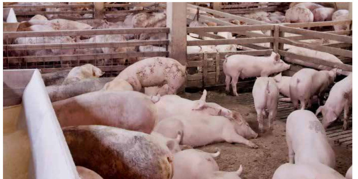
Es una situación complicada la que vive la actividad porcícola.

Es una situación complicada la que vive la actividad porcícola,