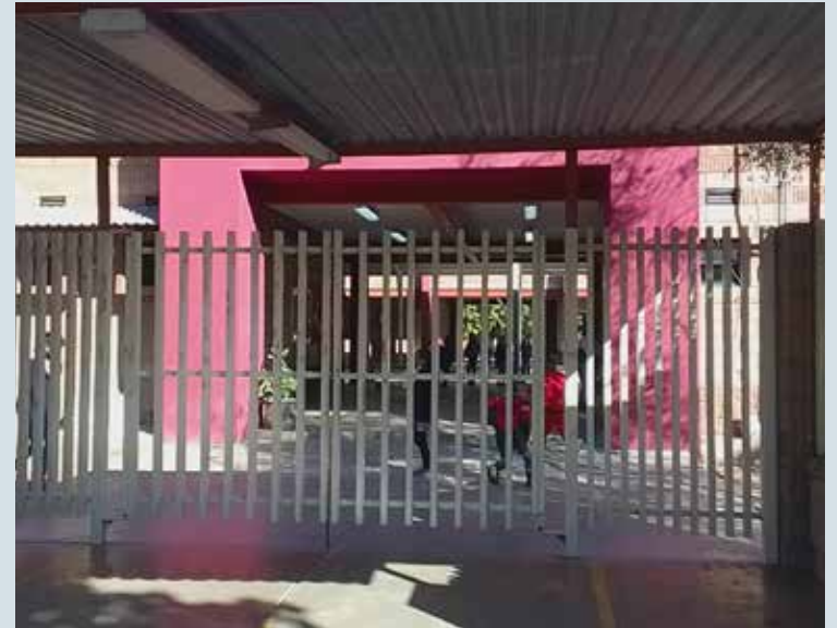
Este viernes 26 de abril, las y los estudiantes del nivel básico no tendrán clases, ya que se llevará a cabo la junta de Consejo Técnico y Taller de Formación para Docentes por parte de la SEC.

Educación y Cultura (SEC), el próximo mes de mayo se tendrá dos días de asueto, el pri-