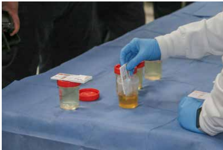
Se llevó a cabo de manera sorpresiva un examen de antidoping a todos los agentes de la Policía Preventiva y Tránsito Municipal.

Dicho examen toxicológico se realiza en cumplimiento con los lineamientos establecidos por la Ley de Seguridad Pública en el