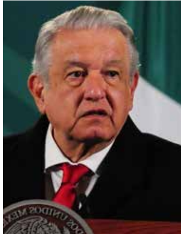
Andrés Manuel López Obrador