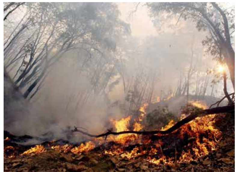
Se tienen identificados 13 incendios forestales en Sonora.

Por último, detalló que los municipios donde se han presentado principalmente estos incendios son en Nacori chico, Yécora, Álamos, mientras que en el norte del estado, Trincheras y Nogales.