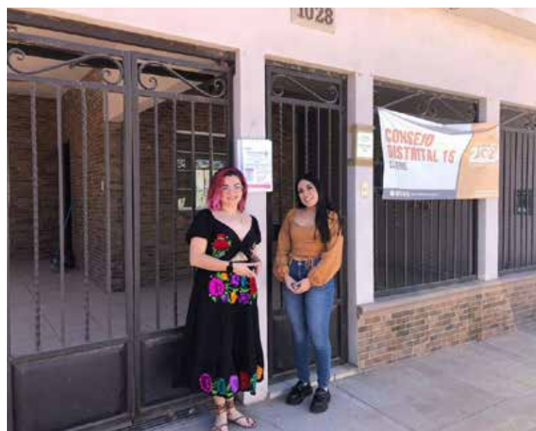
A las afueras de domicilio y comercios, en diferentes puntos de la ciudad se colocaron los llamados Encartes, que son unos folletos a través de los cuales las y los ciudadanos pueden consultar en donde se encontrará su casilla

den consultar los listados de ubicación e integración de mesas directivas de casilla, conocidos