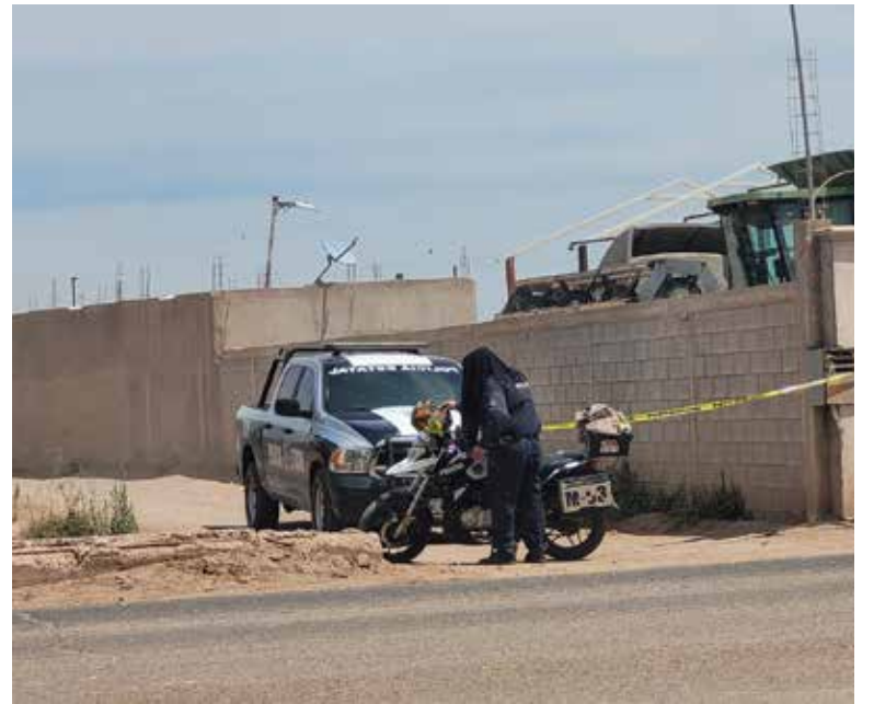
El hallazgo fue reportado en el basurón del ejido Francisco Javier Mina, mejor conocido como Campo 60.

Los bultos estaban cubiertos con una sábana de color azul