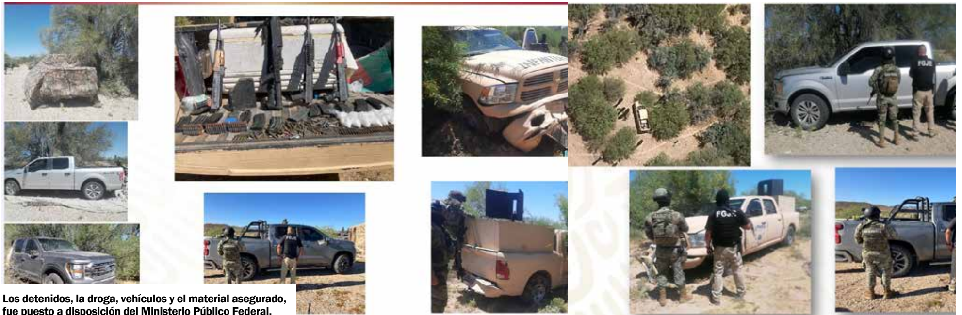
Los detenidos, la droga, vehículos y el material asegurado, fue puesto a disposición del Ministerio Público Federal.