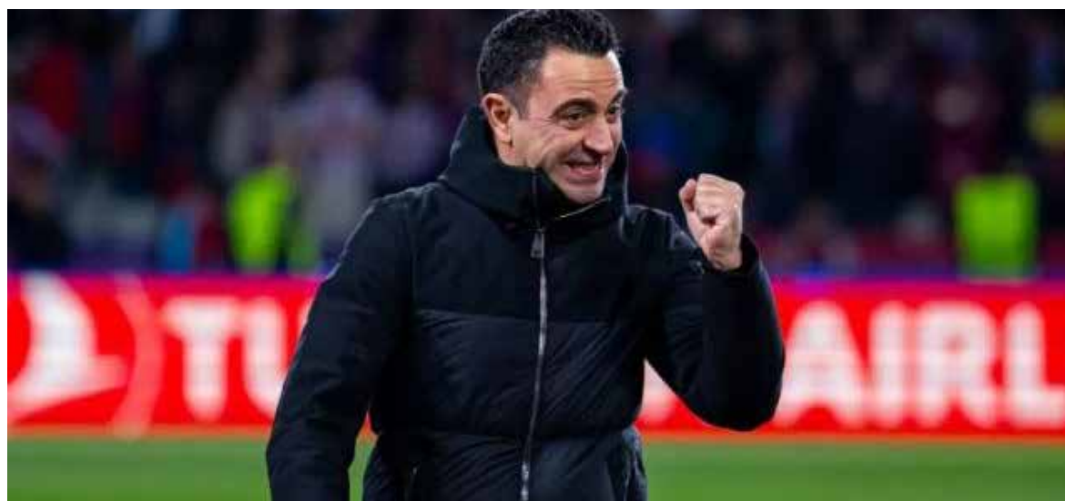
El técnico seguirá en el cuadro blaugrana tras aceptar cumplir su contrato al finalizar una reunión con la directiva.

El giro de guión de este miércoles se produce a pesar de la derrota el domingo en el Santiago Bernabéu en el 'Clásico' ante el Real Madrid (3-2), que dejó al Barça prácticamente sin opciones de conquistar el título, a once puntos de los merengues y con seis jornadas para el final.