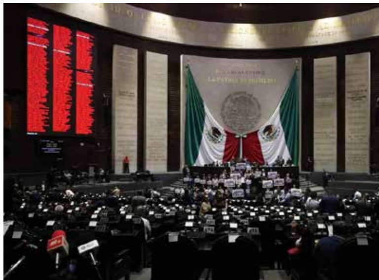
Con el apoyo de senadores de Morena y sus aliados se aprobó en lo general el dictamen.

Con el apoyo de senadores de Morena y sus aliados con 19 votos, 10 en contra y cinco abstenciones de legisladores del PAN, PRI, PRD y Movimiento Ciudadano, se aprobó en lo general el dictamen, por lo que será turnado al pleno legislativo para su aprobación este jueves.