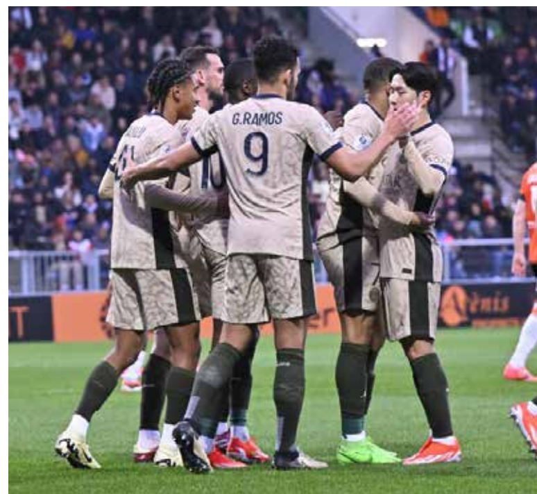
pasado (4-1), un partido en que Mbappé y Dembélé, los héroes en el estadio Moustoir, gozaron de descanso.

La ocasión era propicia para los parisinos ante uno de los equipos menos en forma del momento. Y los hombres de Luis Enrique parecen lanzados con la clasificación a semifinales de Liga de Campeones tras golear 4-1 al Barcelona en Montjuic, mismo resultado con el que se impusieron al Lyon el domingo