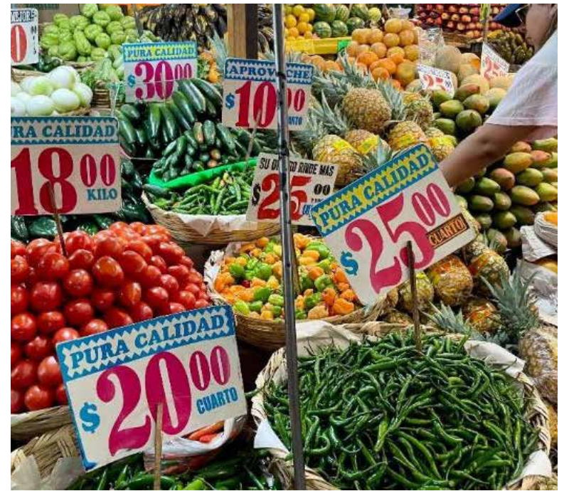
La inflación general anual se disparó a 4.63% en la primera quincena de abril desde 4.37 de la segunda mitad de marzo, debido al incremento de los precios de las frutas y verduras.

Y es que el jitomate tuvo una incidencia con precios al alza de 0.070 puntos para reportar una variación quincenal de 12.14 por ciento; tomate verde, con una participación a la inflación de 0.036 unidades para un aumento de 22.97 por ciento con respecto a la última quincena de marzo. El chile serrano presentó una variación quincenal de 31.81 por ciento; naranja, 8.83 por ciento; aguacate, 7.76 por ciento; loncherías, fondas, torterías y taquerías,