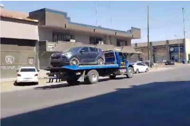
La unidad es una tipo vagoneta de la marca Kia, línea Sportage, de color gris, con placas de circulación WFC-063-A.

Al llegar las autoridades al sitio revisaron el vehículo, percatándose que sobre el asiento posterior había cuatro objetos puntiagudos de los llamados ponchallantas. Asimismo, en la parte de la cajuela observaron a simple vista un chaleco táctico con cargadores para arma larga, procediendo