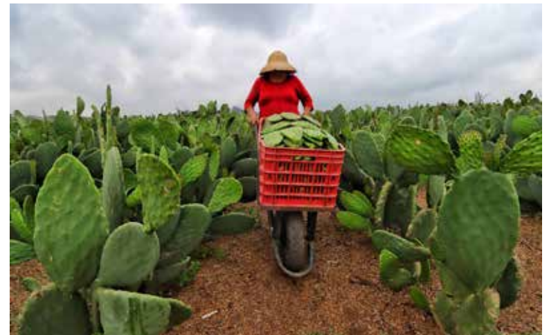
El nopal puede incluirse como complemento en una gran variedad de platillos

Potencial antioxidante: El nopal contiene antioxidantes como la vitamina