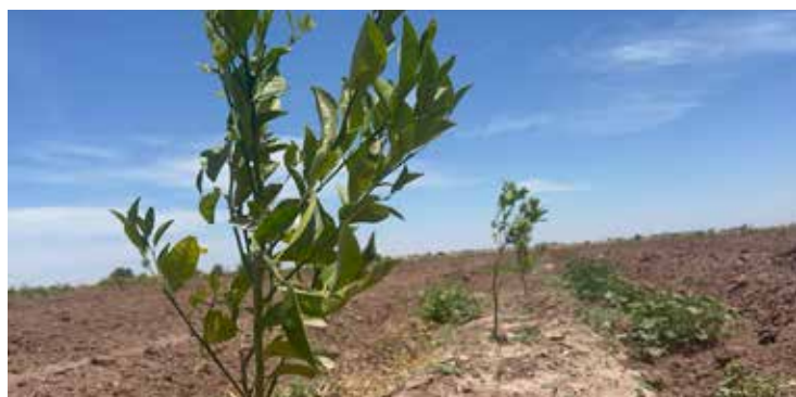
Actualmente ya son 568.82 hectáreas las que están establecidas en la región.

Agregaron que la mandarina se va a exportación en un 90% de su cosecha, siendo 2023 buen año donde el estado produjo 7 mil 728 toneladas de un área de 391 hectáreas que se encontraban en labor.