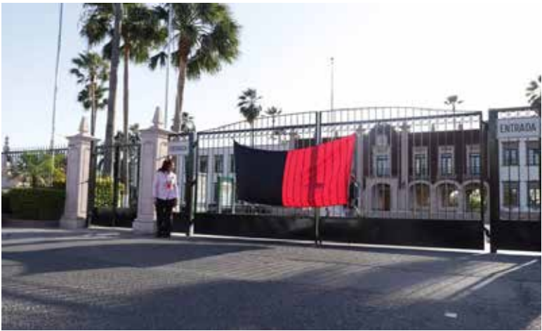
Autoridades de la Unison hicieron un último ofrecimiento en materia de prestaciones al Sindicato de Trabajadores Académicos.

determinó levantar la huelga en los seis campus, el siguiente paso es hacer la entrega formal de las instalaciones a las autoridades con la presencia de los abogados”, expresó. La dirigente del gremio reconoció que, por los números que