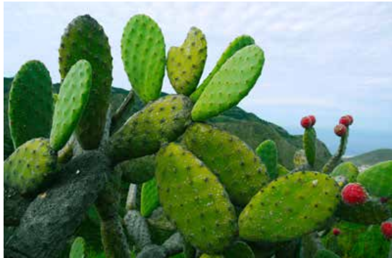
Además de una gran tradición cultural los aztecas también nos heredaron una tradición alimenticia de gran valor.

De acuerdo con información de la Secretaría de Gobernación, al colonizar estas tierras los españo-