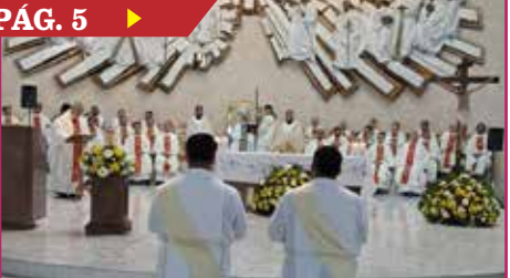
HAY POCO INTERÉS POR EL SACERDOCIO