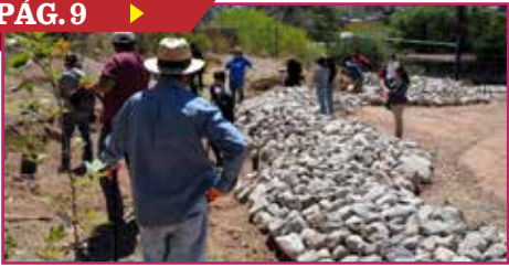
IMPLEMENTA UTN 'JARDINES DE LLUVIA'