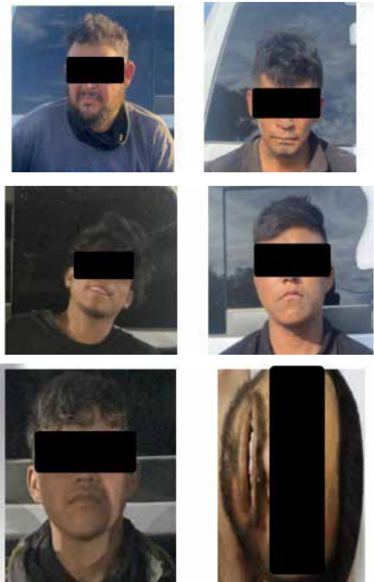
Los detenidos quedaron a disposición del Ministerio Público Federal junto con el material asegurado.