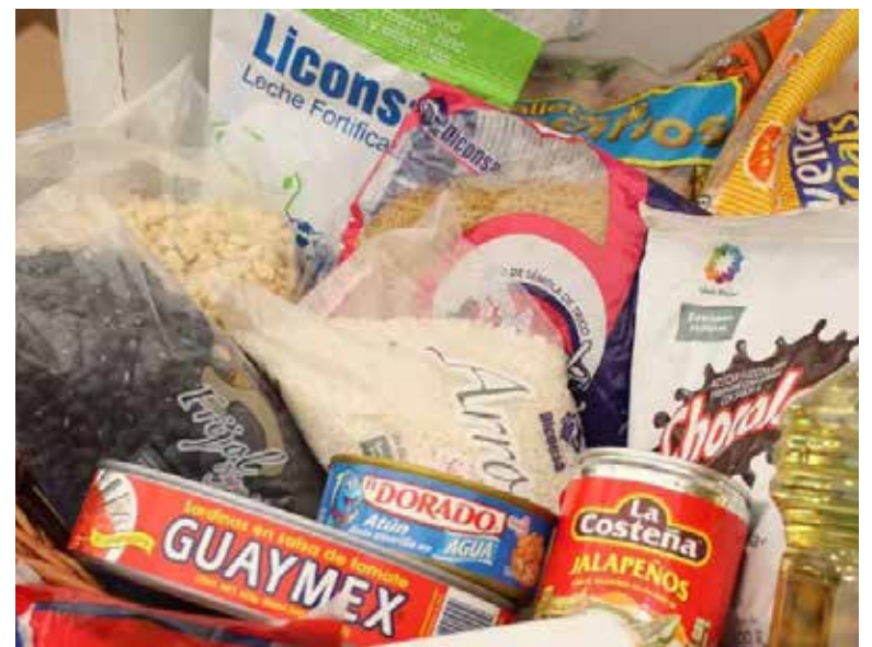
El Coneval estima que cerca del 35% de los mexicanos percibe ingresos laborales insuficientes para cubrir la canasta básica alimentaria.

Esta medición del Coneval considera que los y las mexicanas que tienen ingresos inferiores al valor monetario de la canasta básica de alimentos se encuentran en pobreza extrema.