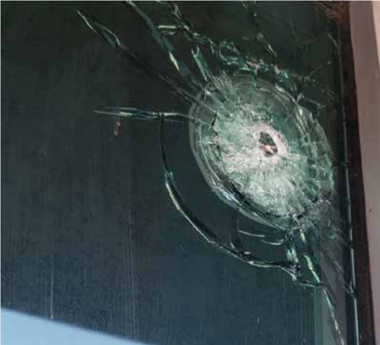
Los cristales y la puerta de acceso de la Secretaría de Bienestar, en el edificio del Centro de Usos Múltiples, presentaron impactos de bala.

El saldo reportado incluye la neutralización de un presunto criminal, cuya identidad aún no ha sido revelada, y un militar herido en las calles Mayo y Chihuahua, al norte de la ciudad.