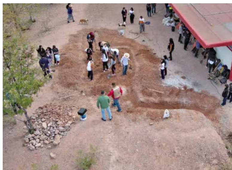
La Universidad Tecnológica de Nogales (UTN) participó en la implementación del programa "Jardines de Lluvia Escolares".

de Arizona, que ayudaron a transformar los patios escolares en espacios verdes que captan y aprovechan este valioso y escaso recurso.