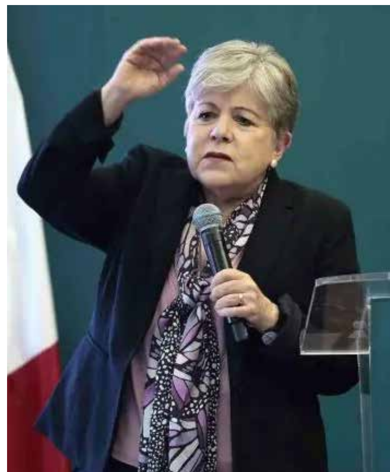
Alicia Bárcenas en la Reunión Ministerial de la Declaración de Los Ángeles sobre Migración y Protección este martes, en Ciudad de Guatemala.

El plan incluye varios ejes. El primero es el que llaman de “cooperación”, que incluye invertir 133 millones de dólares, unos 2.250 millones de pesos, en Belice, Cuba, Colombia, El Salvador, Guatemala, Haití y Honduras. “Que no es tanto si se pone a pensar en todo lo que puedes beneficiar”, ha dicho la secretaria, que ha cifrado en 80 mil los beneficiarios del programa. “Se les da un