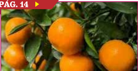
AUMENTA INTERÉS POR LA SIEMBRA DE MANDARINA