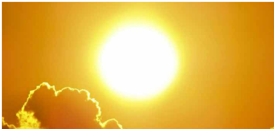
El verano pasado fue 2.2 °C más cálido que las temperaturas medias estimadas para los años comprendidos entre el 1 y el 1890.

Pero el calor del verano de 2023 en el hemisferio norte también