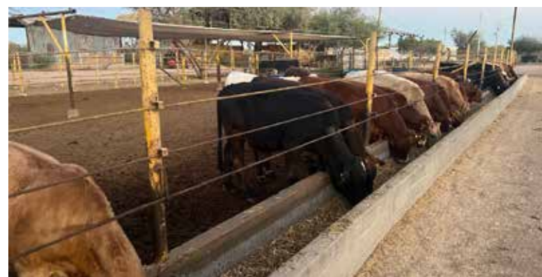
Ante la sequía que azota a la región, se busca fortalecer la ganadería del estado.

Hizo hincapié, en que este programa no debe manejarse políticamente bajo ninguna circunstancia, esto debido a la época electoral, pues es un apoyo por parte del Estado y la Unión a las zonas más afectada.