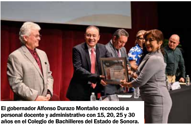
El gobernador Alfonso Durazo Montaña reconoció a personal docente y administrativo con 15, 20, 25 y 30 años en el Colegio de Bachilleres del Estado de Sonora.

Ahí, el mandatario sonorenses expresó su felicitación al gremio educativo por el rol fundamen-