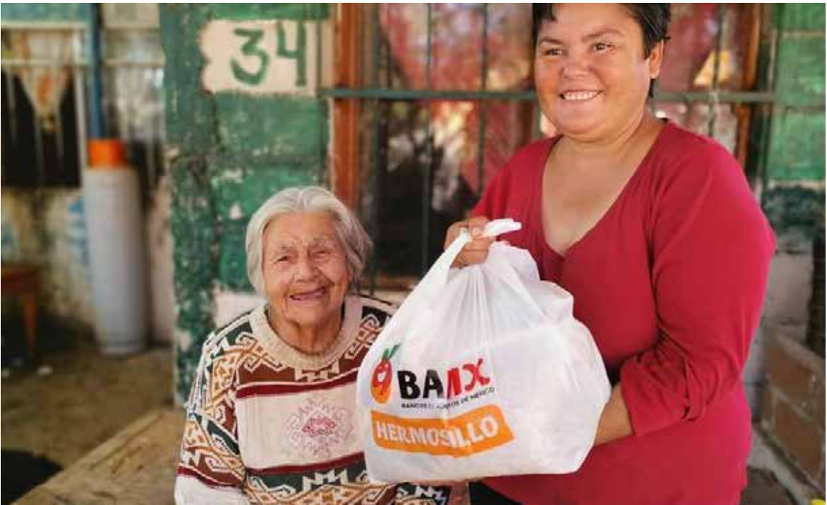
El Banco de Alimentos de Hermosillo (Bamx) inició la tercera edición de la campaña “Challenge Contra el Hambre” en alianza con 13 empresas de la localidad.

Finalmente, el director del Banco de Alimentos de Hermosillo dijo, que ese tipo de programas permiten llegar a miles de personas en pobreza alimentaria y de paso reducir esa brecha entre población de muy escasos recursos.