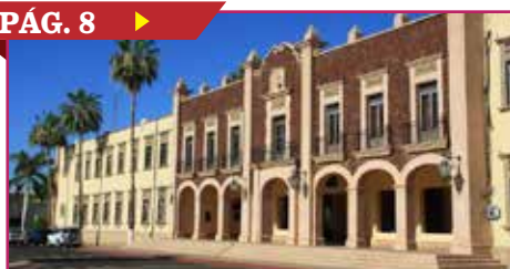
ACABA HUELGA EN LA UNISON