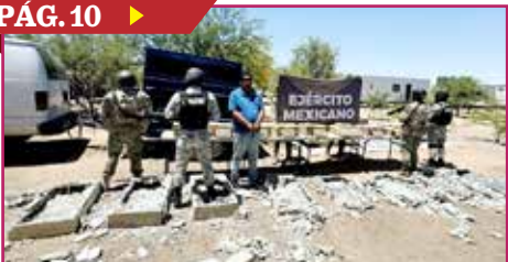
TRASPORTABA 176 KILOS DE COCAÍNA