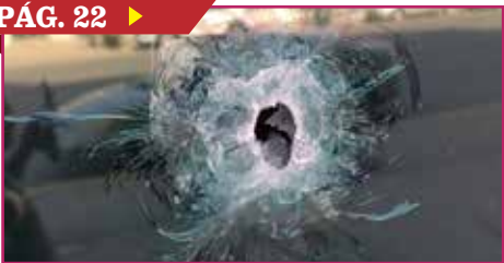
SUFRE DAÑOS CUM TRAS ENFRENTAMIENTO