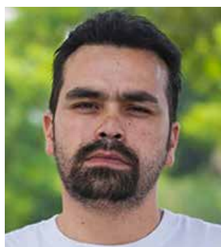
Jorge Álvarez Maynez