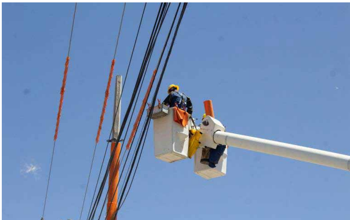
En busca de apoyo para gestionar con celeridad los trámites para la instalación del servicio de energía eléctrica, habitantes de San Carlos, Nuevo Guaymas acudieron al Palacio de Gobierno en Hermosillo.