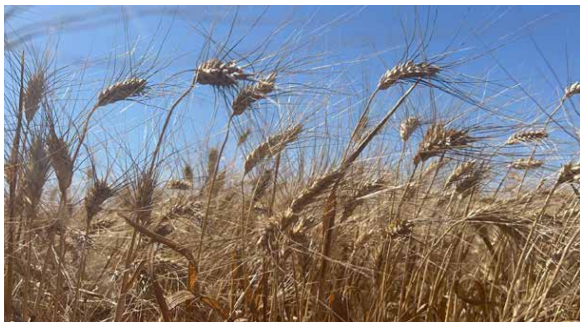
Productores del sur de Sonora esperan buena gestión ante Hacienda.

Mencionó que, la actitud de las autoridades federales, este año, fue mejor a la del año pasado, por lo que esperan si se pueda concretar algo y recibir noticias del secretario esta misma semana.