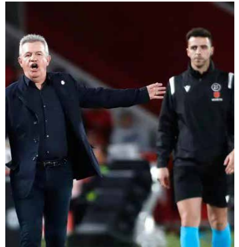
El Mallorca rescató un punto de 'oro' ante el Osasuna, a falta de dos jornadas de que finalice LaLiga.

Con este resultado, el Manchester City llegó a 88 puntos, colocándose en la cima de la Premier League y superando al Arsenal (86 unidades), a falta de una jornada por disputarse, donde los pupilos de Pep Guardiola recibirán al West Ham; mientras que los 'Gunners' se medirán ante el Everton.