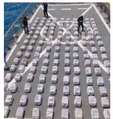
Autoridades informaron que el hecho sucedió durante un patrullaje de vigilancia marítima.

Los efectivos realizaron el aseguramiento de la embarcación, la carga ilícita y el hidrocarburo, así como de la puesta a disposición de tres presuntos infractores de la ley, a quienes se les leyeron sus derechos humanos para integrar la carpeta de investigación con las autoridades