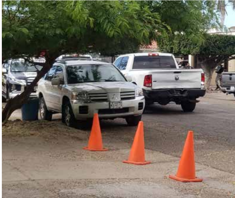
El sitio se vio colmado de unidades de las diferentes corporaciones policiacas.

Debido al elevado hermetismo que se manejó en la escena, hasta el momento no se han dado a conocer las causas del incendio, si se trató de un caso fortuito o, por lo contrario, si fue provocado.