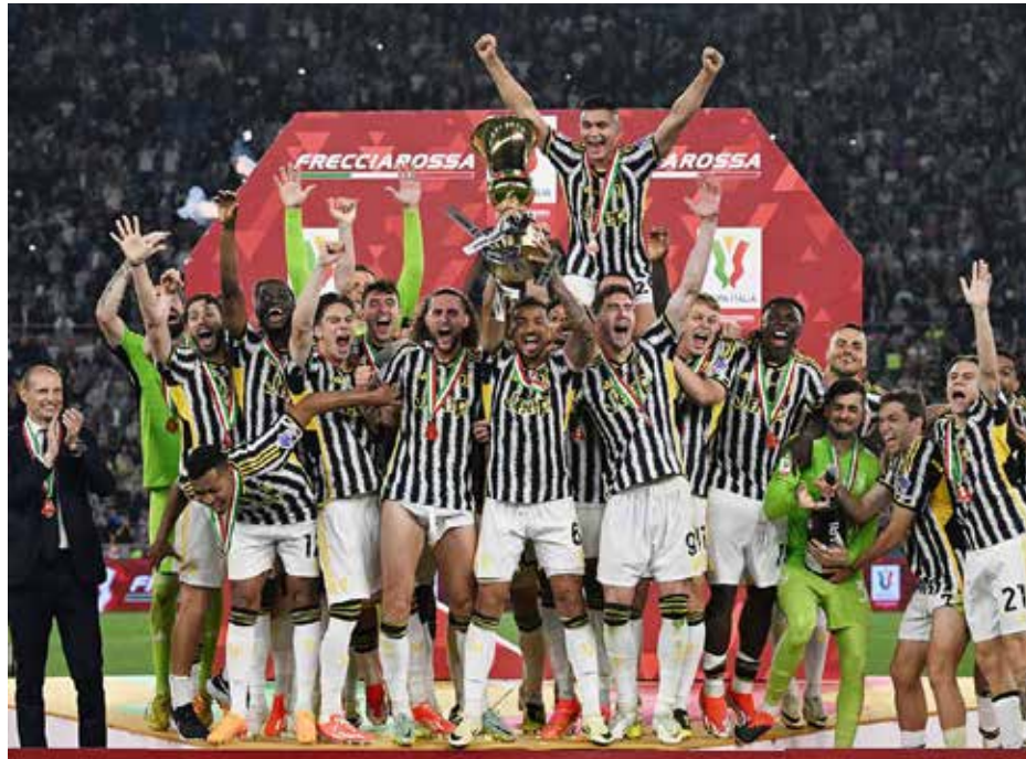
Juventus volvió a vencer al Atalanta en una Final de Copa de Italia.

Cuarto clasificado en la Serie A y en línea descendente tras encadenar cinco