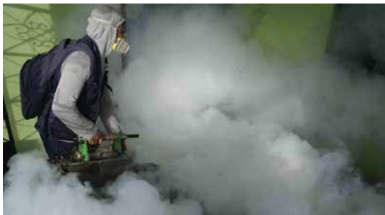
Los estudios han demostrado que la vacuna de Takeda es un 84% efectiva en prevenir que las personas sean hospitalizadas por dengue y un 61% eficaz para detener los síntomas.

agencia de la OMS para la aprobación de medicamentos y vacunas, dijo que era “un paso importante en la expansión del acceso global a las vacunas contra el dengue”. Señaló que es la segunda inmunización que la agencia de la ONU autoriza para el dengue.