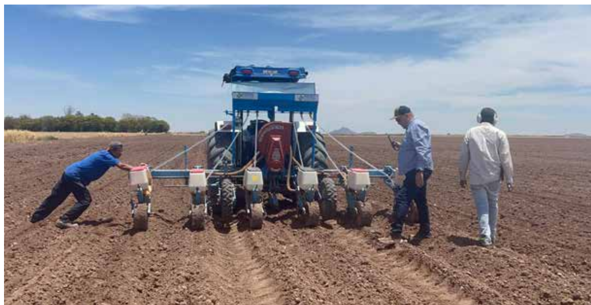
Este cultivo no requiere más que el riego de asiento y uno de auxilio y si las lluvias son bondadosas se puede prescindir del riego de auxilio.

invitó a los productores a apostar por el en verano, facilitando