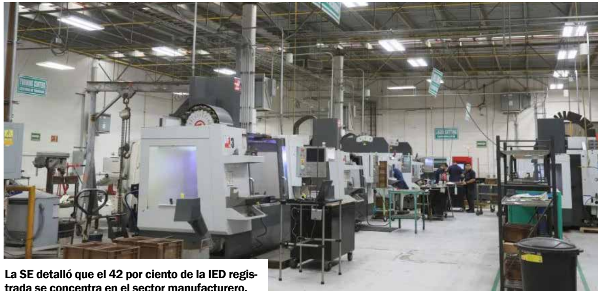
La SE detalló que el 42 por ciento de la IED registrada se concentra en el sector manufacturero.

La cifra alcanzada fue un 9 por ciento superior al reportado para el mismo periodo de 2023 cuando alcanzó 18 mil 636 millones de dólares. La entidad apuntó además que el 97 por ciento de esta