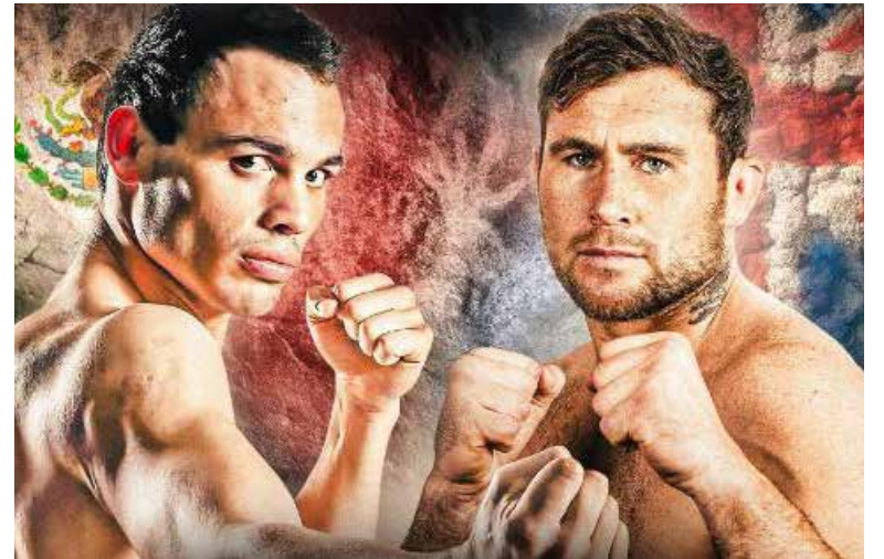
Tras salir de la cárcel, el 'Júnior' entró desde entonces a un programa de rehabilitación por adicciones.

"Estoy emocionado de regresar después de un tiempo de descanso, estoy motivado y ansioso por restablecerme como uno de los más grandes. Mi regreso al ring este en este evento histórico es un honor. El sábado 20 de julio voy a ganar por nocaut y continuar mi