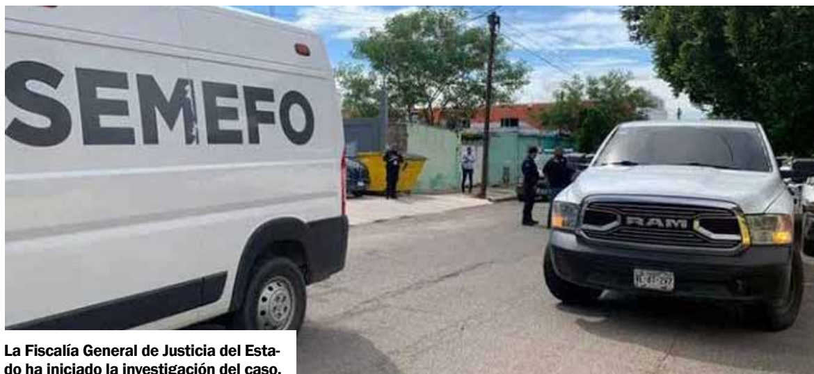
La Fiscalía General de Justicia del Estado ha iniciado la investigación del caso.

Cabe señalar que las autoridades mantienen un operativo para localizar a los presuntos responsables, y la Fiscalía General de Justicia del Estado ha iniciado la investigación del caso.