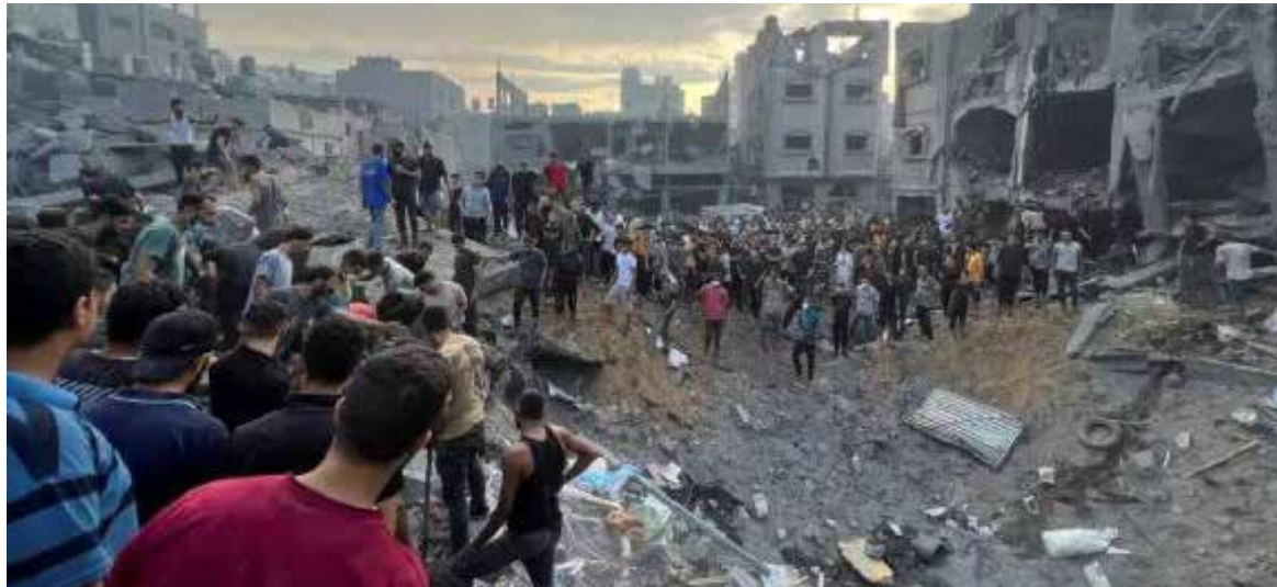
La OMS respalda las cifras de muertes del Ministerio de Salud de Gaza y está cerca de confirmar la cantidad de fallecidos, a pesar de las dudas planteadas por Israel.

El Ministerio de Salud de Gaza, donde gobierna Hamás -considerada una organización terrorista por la Unión Europea (UE), EE. UU. y otros países- actualizó la semana pasada su desglose del alrededor de 35,000 muertos desde el 7 de octubre, diciendo que, hasta ahora, unos 25,000 de ellos han sido completamente identificados, y más de la mitad eran mujeres y niños.