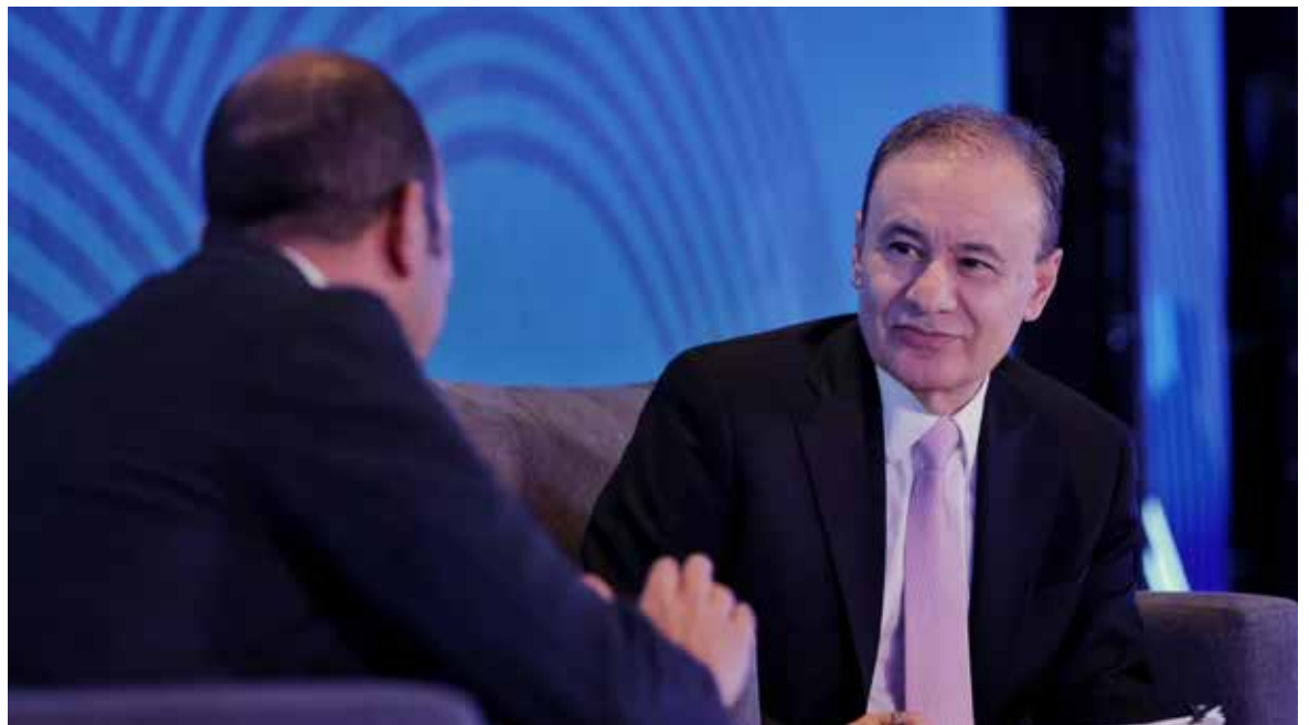
El gobernador Alfonso Durazo Montaña participó en la Expo Desarrollo Inmobiliario 2024, un encuentro en el que se congregan empresarios del ramo de todo el país.

La ADI es el máximo organismo del sector y está integrada por 78 de los desarrolladores más importantes del país, y tiene como objetivo principal impulsar progreso urbano e integral.