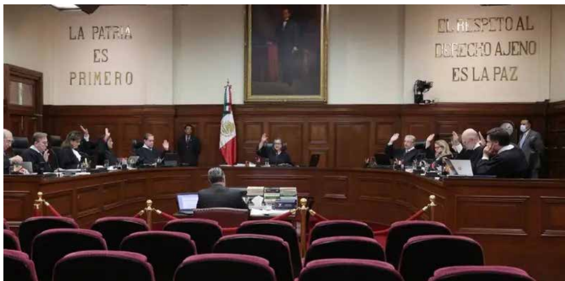
El asunto fue retornado al ministro Luis María Aguilar Morales, para la elaboración de un nuevo proyecto.

De esta forma, el asunto fue retornado al ministro Luis María Aguilar Morales, para la elaboración de un nuevo proyecto con el criterio de la mayoría de la Sala, por la permanencia de la suspen-