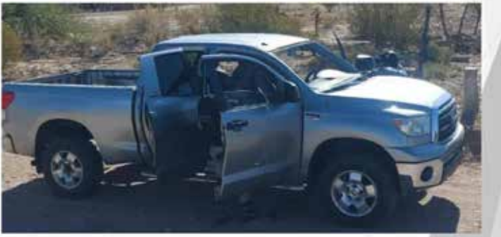
El material y los vehículos asegurados fueron puestos a disposición del Ministerio Público Federal.