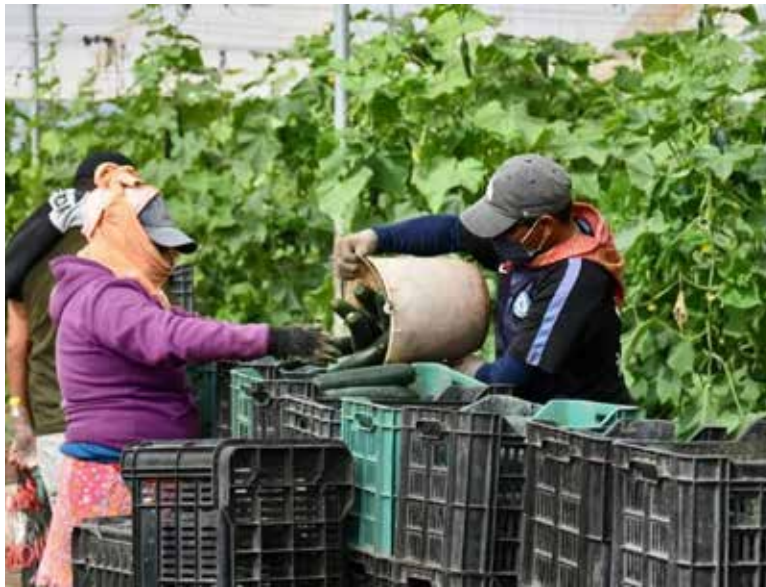
Sonora es el segundo productor de pepino con 198 mil 103 toneladas producidas en 2023.

cultores se encuentran en incertidumbre de cara al próximo ciclo, dado a que la siembra de este cultivo puede desaparecer o en el mejor de los casos tener una disminución considerable por causa