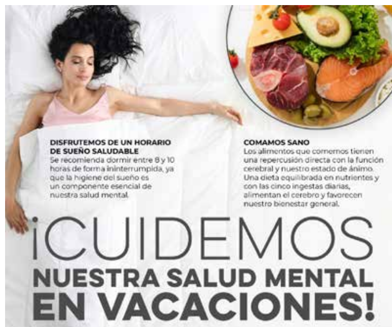
La Secretaría de Salud (SSA) hizo un llamado a madres y padres de familia a reforzar el cuidado de la salud mental en el hogar durante estas vacaciones.

La SSA indicó que en este periodo vacacional hay que evitar el aislamiento y mejor compartir el tiempo con los demás, involucrar en actividades recreativas, de juego y sana convivencia a