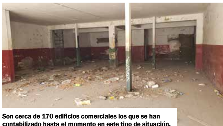
Son cerca de 170 edificios comerciales los que se han contabilizado hasta el momento en este tipo de situación.

de la CFE informó que para presentar una queja por afectaciones en electrodomésticos, se debe llenar un formato y la falla en la energía debe ser por parte de la comisión y no incluye, apagones por lluvia o calor.