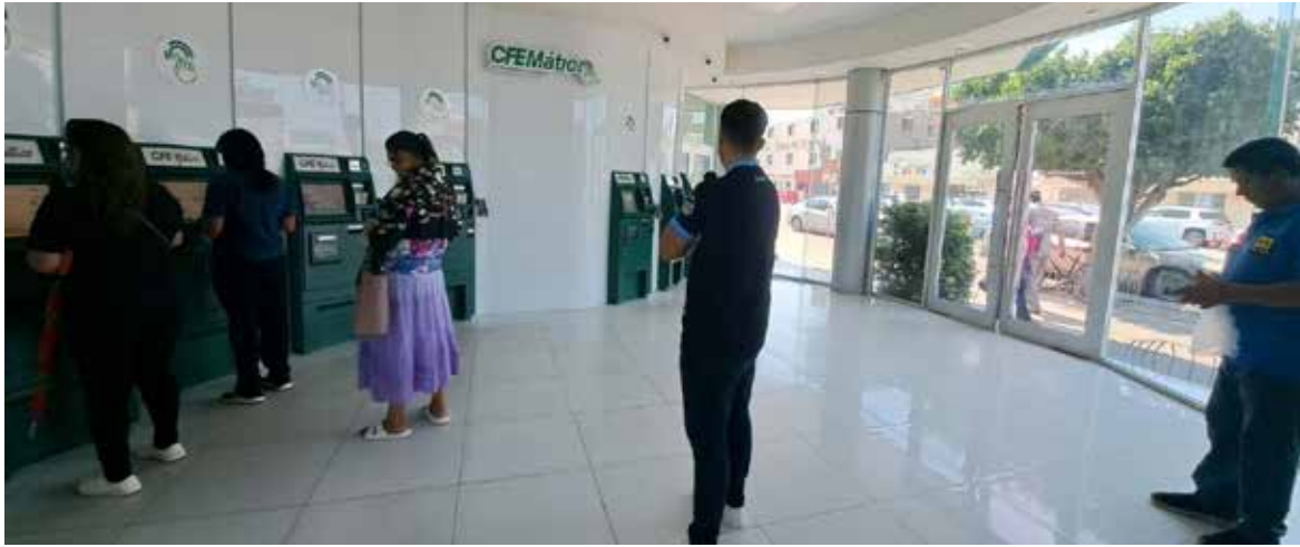
Para recibir orientación, los afectados pueden acudir al módulo que se instala cada lunes frente a las oficinas de CFE.