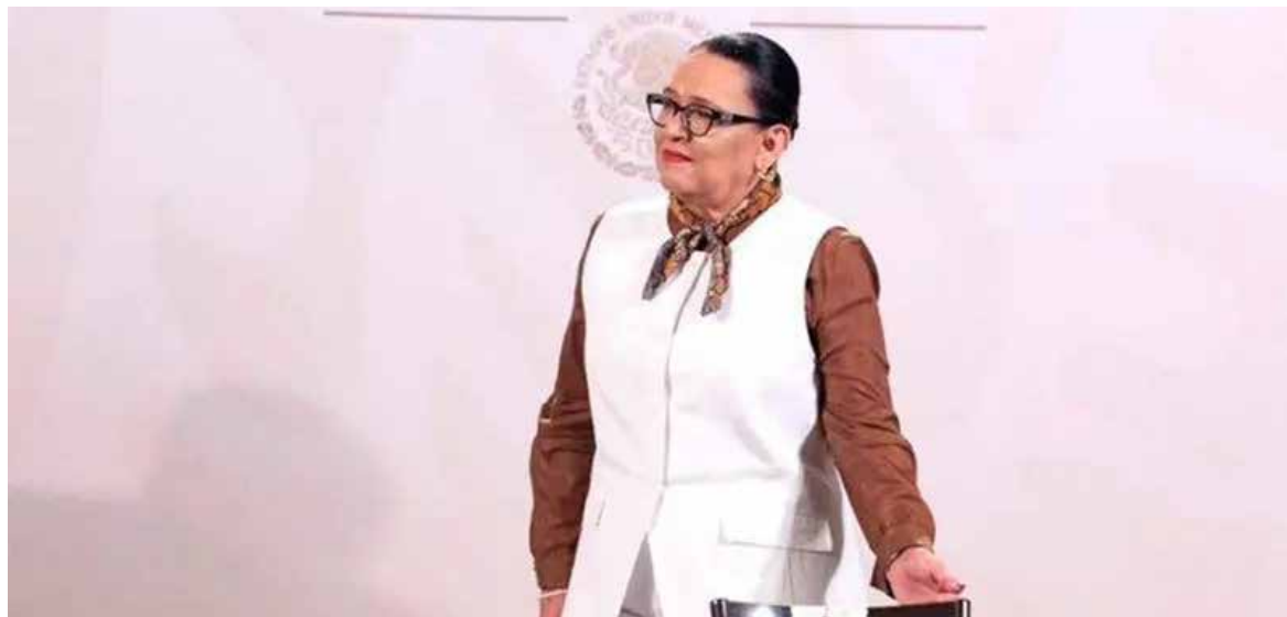
La titular de la SSPC apuntó que en los 50 municipios prioritarios ese delito cayó 15.3% respecto a diciembre de 2018.

Tras su detención, El R8 y los otros tres miembros de la célula del hermano del Chapo Guzmán fueron llevados en helicóptero hacia la Base Aérea Militar 10 y desde ahí hasta la Ciudad de México para ser presentados ante la Fiscalía General de la República (FGR).