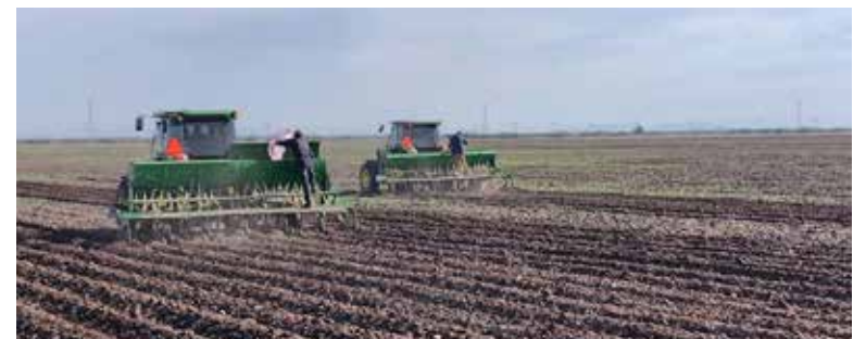
El panorama para los agricultores de baja escala no es nada alentados, pues a la falta de agua se le suman los problemas financieros que se tendrían en el 2024-2025.

Detalló que el principal problema para los pequeños productores fue la desaparición de las