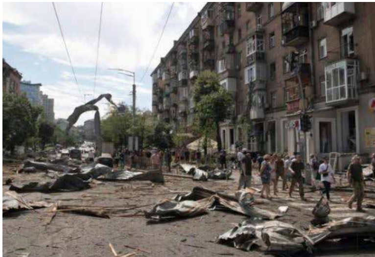
El servicio de seguridad ucraniano dijo tener pruebas inequívocas de que el centro médico fue alcanzado por un misil de crucero ruso Kh-101.

El jefe de la Misión de Observación de los Derechos Humanos de la ONU en Ucrania, declaró: