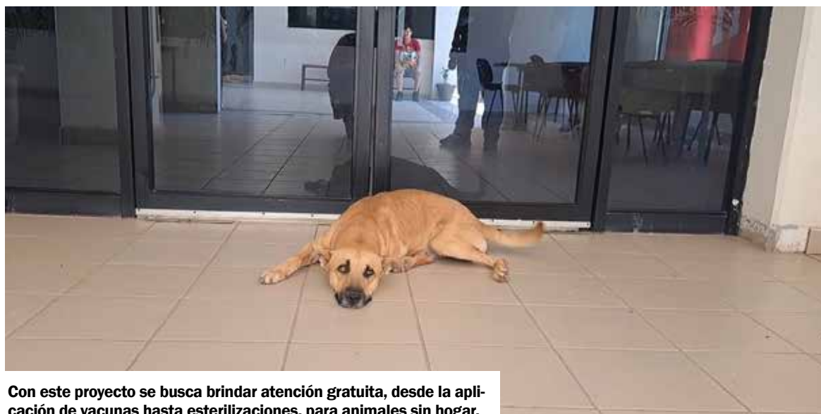
Con este proyecto se busca brindar atención gratuita, desde la aplicación de vacunas hasta esterilizaciones, para animales sin hogar.

La diputada y presidenta de la Comisión de Justicia y Derechos Humanos, señaló que con este