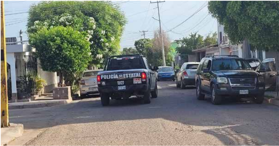
El operativo se realizó en las calles Valle Imperial y Valle Colorado.