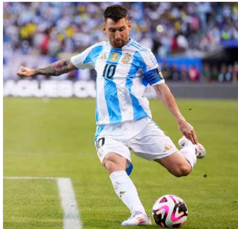
Con goles de Julián Álvarez y Lionel Messi, Argentina cumplió con los pronósticos y venció 2-0 a Canadá para conseguir su boleto a la Final de la Copa América 2024.

Por sexta ocasión consecutiva en la historia de las Copas América, Lionel Messi se hizo presente en el marcador al minuto 51 luego de que el '10' desviara ligeramente la