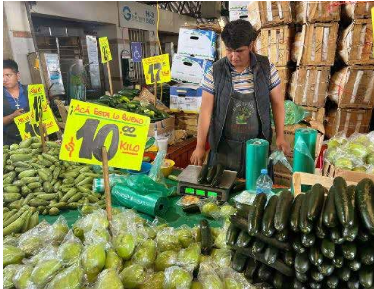
En junio, el índice de mercancías y servicios finales, incluido petróleo, ascendió 1.34 por ciento a tasa mensual y 5.02 por ciento a tasa anual.

se reportaron cuatro meses consecutivos con inflación al alza, ya que en febrero el INPC fue de 4.40 por ciento; marzo, 4.42 por ciento; abril, 4.65 por ciento; mayo, 4.69 y junio, 4.98 por ciento.