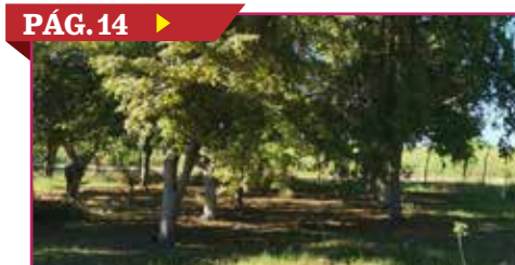
PÁG. 14 ▶ BUSCAN APICULTORES REFORESTAR CAJEME