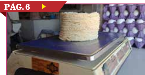
PÁG. 6 ▶ LANZAN APLICACIÓN PARA LAS TORTILLERÍAS