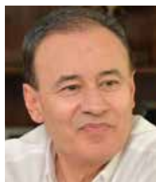
Alfonso Durazo Montaña