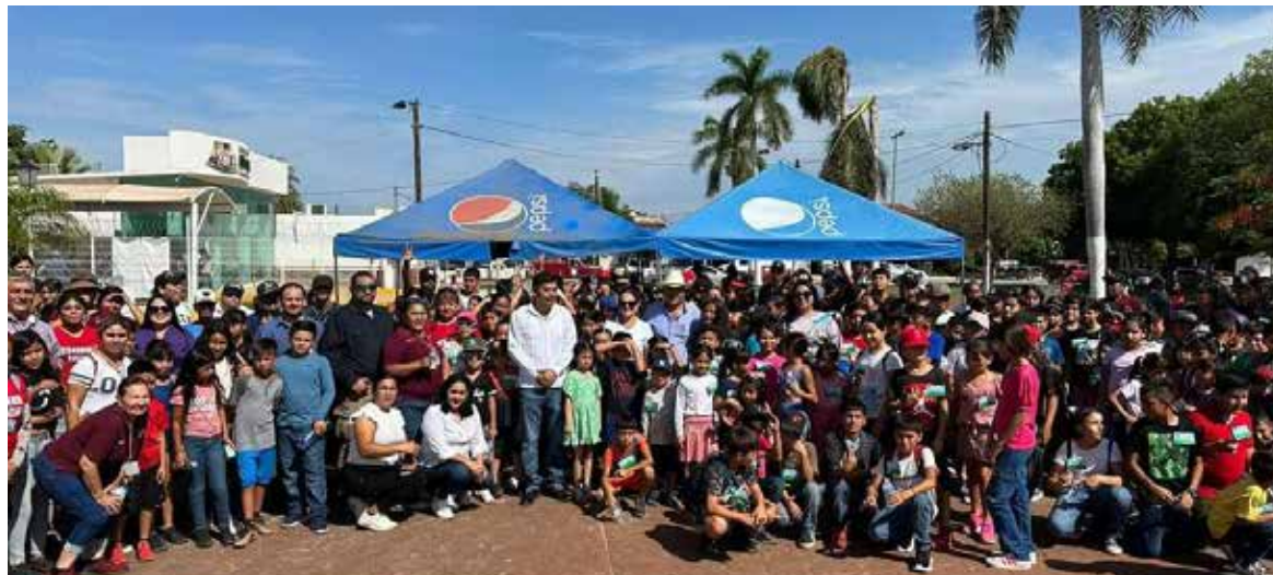
La cabecera municipal de Baco se vistió de alegría, entusiasmo y algarabía de cientos de niños de primaria y secundaria de las 13 comunidades del municipio y que se dieron cita a la ceremonia de inauguración del Campamento de Verano 2024.

Este campamento, tiene como objetivo ofrecer a los niños, al-