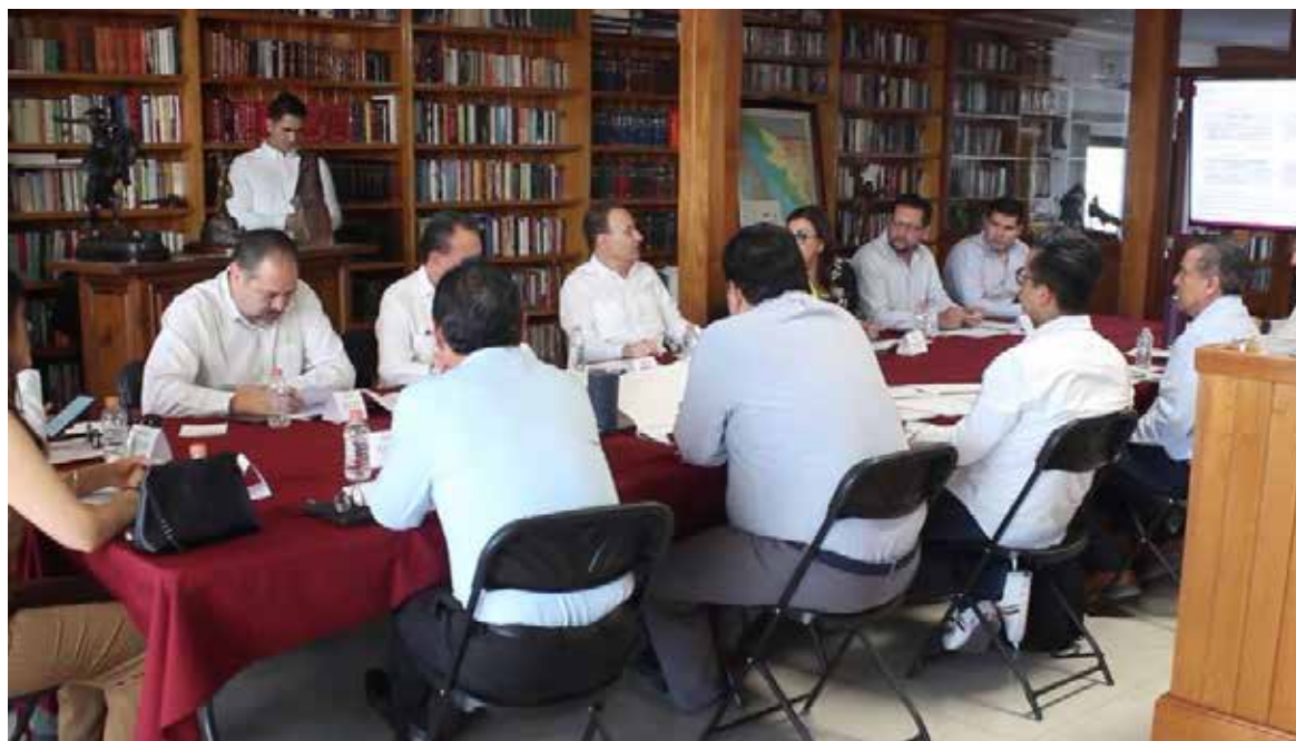
El gobernador Alfonso Durazo Montaño encabezó la instalación del Consejo Técnico Consultivo de la Comisión Estatal de Bienes y Concesiones.

Este consejo funcionará como un órgano de dirección, asesoría, y apoyo de la Comisión Estatal, y tendrá entre sus atribuciones el estudio, análisis, y propuestas de solución a los asuntos en materia