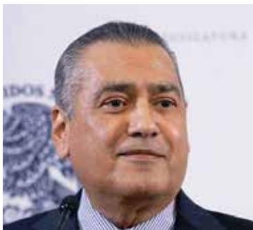
Manlio Fabio Beltrones