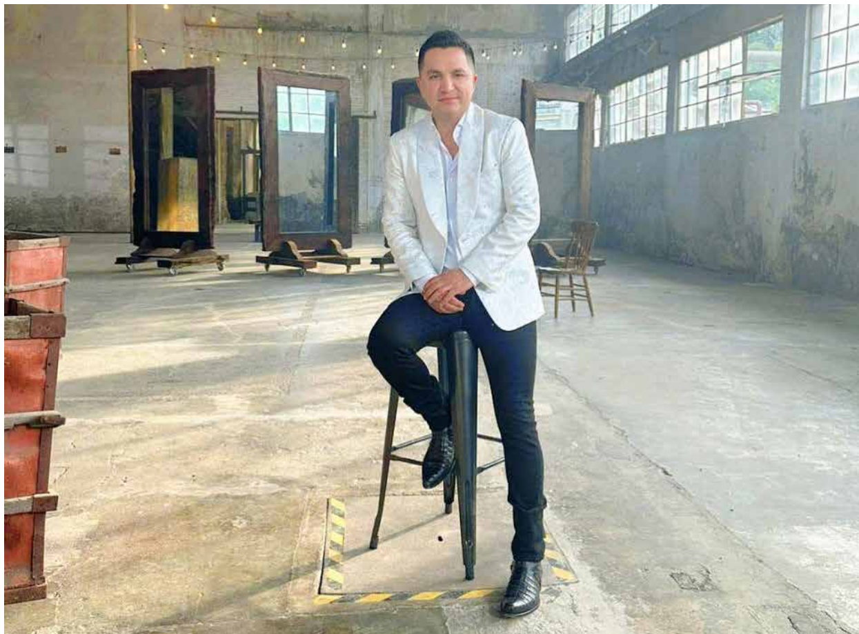
Josi Cuen continúa dando pasos firmes en el regional mexicano, ahora sorprende a sus seguidores al presentarles 'Parchado el corazón', sencillo promocional que es acompañado de un videoclip muy innovador.

En espera de que 'Parchado el corazón' ocupe los primeros lugares de las más importantes listas de popularidad tanto de México, como de Estados Unidos, Josi Cuen continúa con su gira de presentaciones por toda la república mexicana, llegando este 22 de julio a Pamatácuaro, Michoacán, mientras que el sábado 27 estará en Juchipila, Zacatecas y el primero de agosto cantará todas sus canciones en la feria de Silao, Guanajuato.