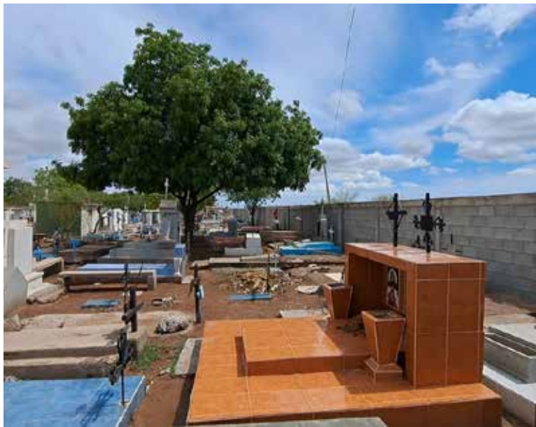
Con al menos 3 mil 071 lotes se busca ampliar el panteón de Pueblo Yaqui.

El terreno de extensión es de aproximadamente una hectárea, el cual se ubica entre las calles Avenida Chichén Itzá y Yaquis