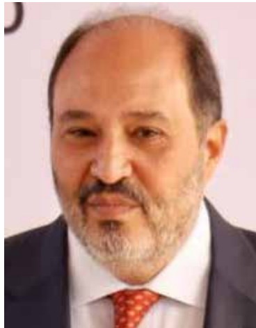
Lázaro Cárdenas Batel