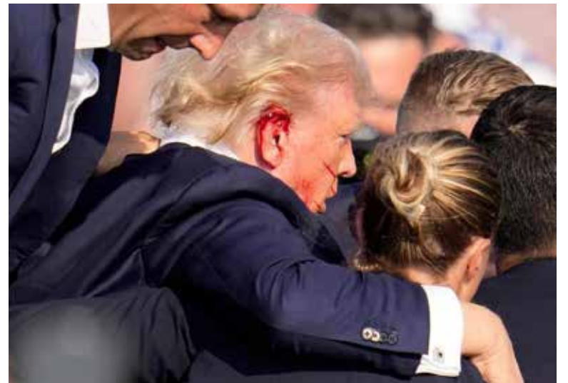
El expresidente de EEUU, Donald Trump, es escoltado por miembros del Servicio Secreto tras resultar herido y escucharse varios disparos en un evento de campaña realizado el sábado 13 de julio de 2024 en Butler, Pensilvania.

El Servicio Secreto negó las acusaciones de algunos partidarios de Trump de que había rechazado las peticiones de la campaña de seguridad adicional.