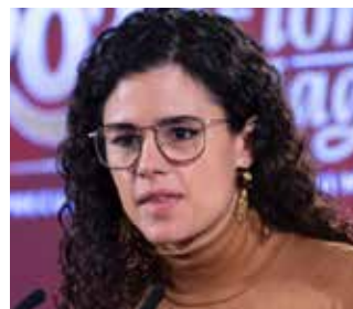
Luisa María Alcalde