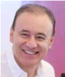
Alfonso Durazo Montaño