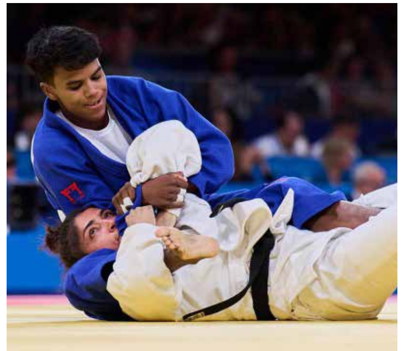
Prisca Awiti se quedó con la plata en el Judo de los Juegos de París.

vena buscó el derribo y logró mandar al tatami a Prisca Awiti, primero devolviéndole la cortesía del 'waza-ari' y posteriormente sometiéndola en el mismo movimiento para conseguir el 'ippon' que le dio la victoria y