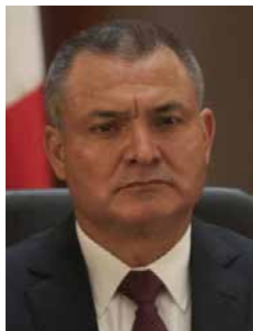
Genaro García Luna