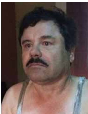
Joaquín Guzmán Loera