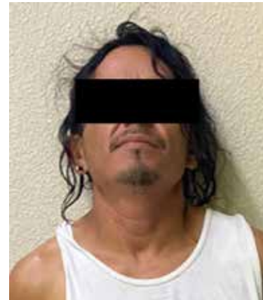
Los detenidos fueron puestos a disposición de la autoridad correspondiente.

na asegurada cuenta con antecedentes penales por faltas administrativas en los años 2016, 2017, 2018 y 2022.