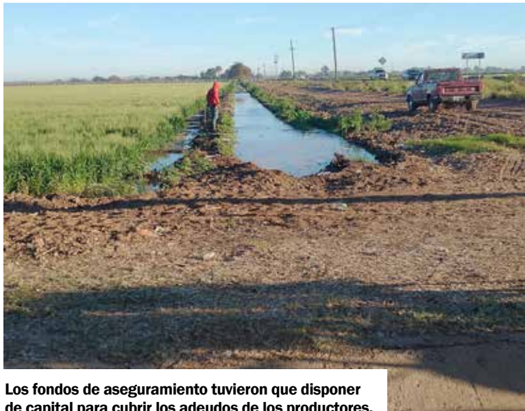
Los fondos de aseguramiento tuvieron que disponer de capital para cubrir los adeudos de los productores.

En el Valle del Yaqui existen varios organismos agrícolas, uno de ellos es la Unión de Sociedades de Producción Rural del Sur de Sonora (Uspruss), la cual prevé dejar de sembrar como mínimo mil hectáreas para el próximo ciclo agrícola debido al