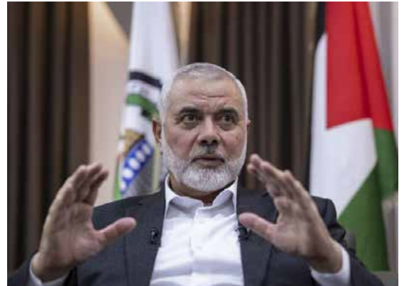
Ismail Haniyeh, fue asesinado en Teherán junto a uno de sus guardaespaldas.

Israel lanzó un bombardeo selectivo en Beirut que asegura "eliminó" al comandante del movimiento libanés Hezbollah, Fuad Shukr, a quien responsabilizó del reciente ataque mortal en los anexados Altos del Golán.