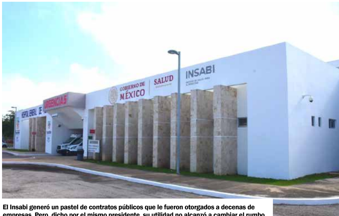
El Insabi generó un pastel de contratos públicos que le fueron otorgados a decenas de empresas. Pero, dicho por el mismo presidente, su utilidad no alcanzó a cambiar el rumbo.

Esta es la historia de cómo usó su presupuesto el organismo que