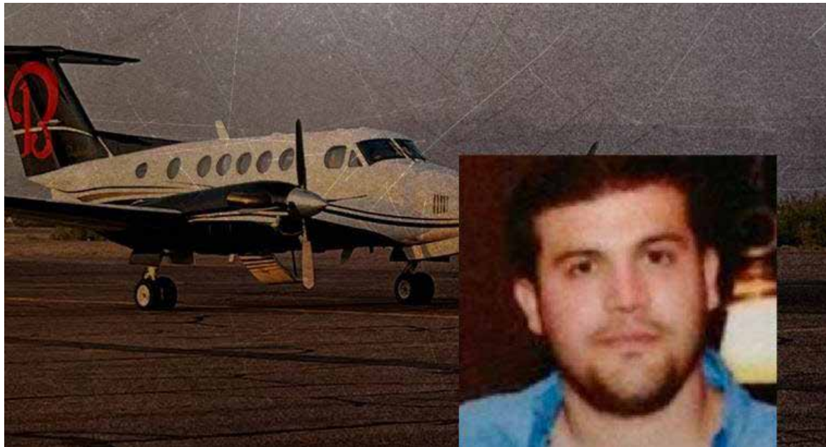
Joaquín Guzmán López, uno de los hijos del notorio narcotraficante mexicano Joaquín "El Chapo" Guzmán, se declaró inocente el martes de cargos de narcotráfico y otros.

Zambada eludió a las autoridades estadounidenses durante años. Se pensaba que participaba más en las operaciones co-