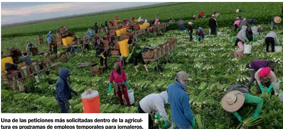
Una de las peticiones más solicitadas dentro de la agricultura es programas de empleos temporales para jornaleros.

Cabe destacar que la cosecha de nuez, se programa para la primera quincena de septiembre, donde la mayoría de los productores empiezan con el corte, de acuerdo al Sistema Producto Nuez de Sonora.