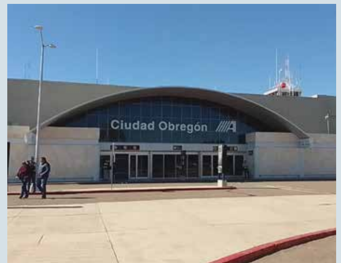
Ciudad de México y Monterrey serán los dos nuevos vuelos a partir del mes de noviembre.