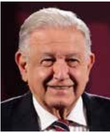
Andrés Manuel López