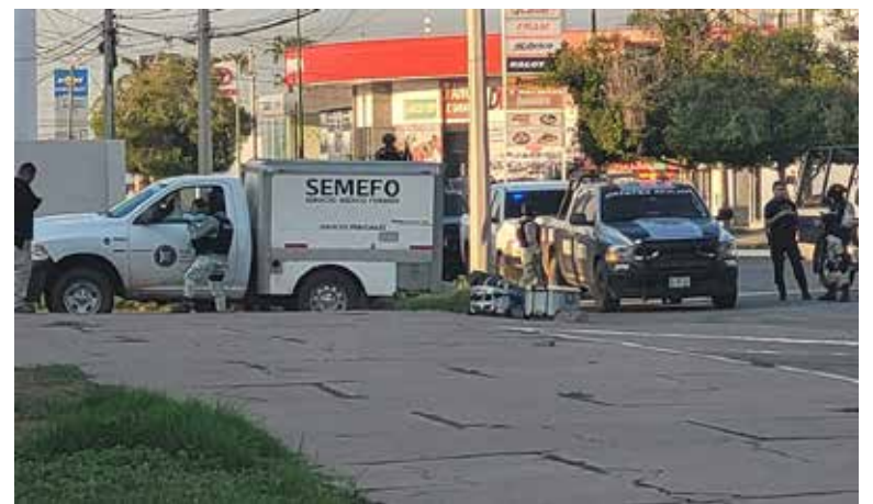
Los restos humanos fueron repartidos en dos hieleras, levantadas por personal de Semefo.

na forense, médicos legistas analizarían los restos humanos para determinar si en realidad se trata de dos cuerpos y tratar de establecer su identidad.