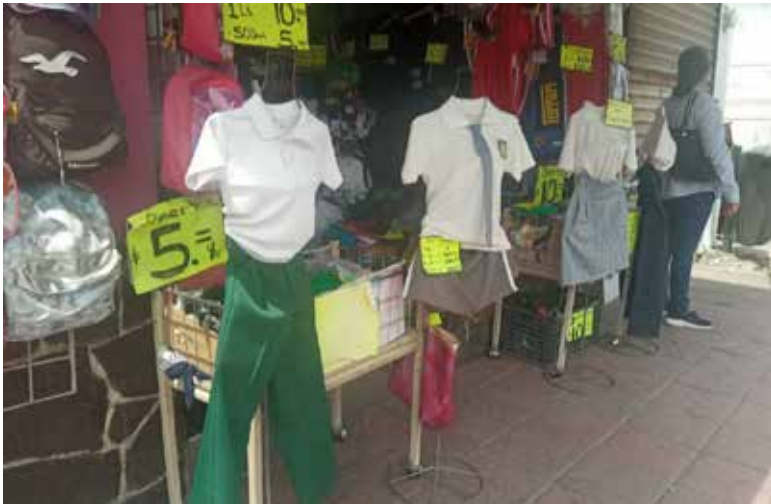
Hay confianza por parte del comercio establecido en Sonora de que suban las ventas en establecimientos donde expendien todos los productos alusivos al regreso a clases por el nuevo ciclo escolar.