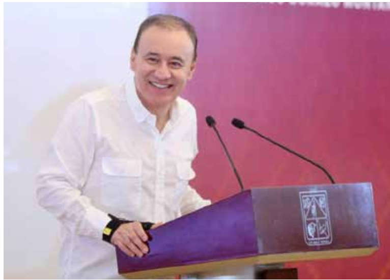
El gobernador Alfonso Durazo dio a conocer que se ha logrado atraer inversión sin precedentes del IMSS en Sonora.