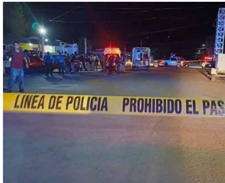
Los lesionados fueron auxiliados por paramédicos de Cruz Roja y llevados a un hospital.

Ello luego de prestarle los primeros auxilios y revisar las heridas que presentaron, informándose que se hallaban estables.