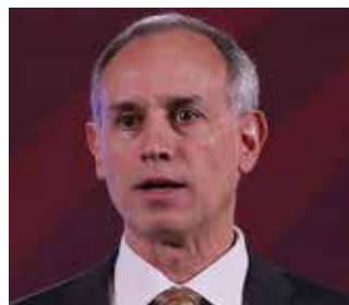
Hugo López Gatell