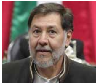
Gerardo Fernández Noroña