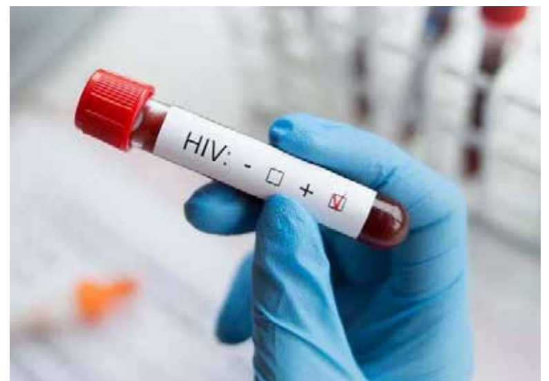
Pruebas realizadas a dos donantes por un laboratorio privado contratado por el sistema sanitario de Rio de Janeiro dieron positivo al virus.

El caso fue descubierto el 10 de septiembre, cuando un paciente que recibió trasplante de corazón y que no tenía el VIH antes de la cirugía acudió al hospital con síntomas neurológicos y dio positivo al virus, según medios locales.