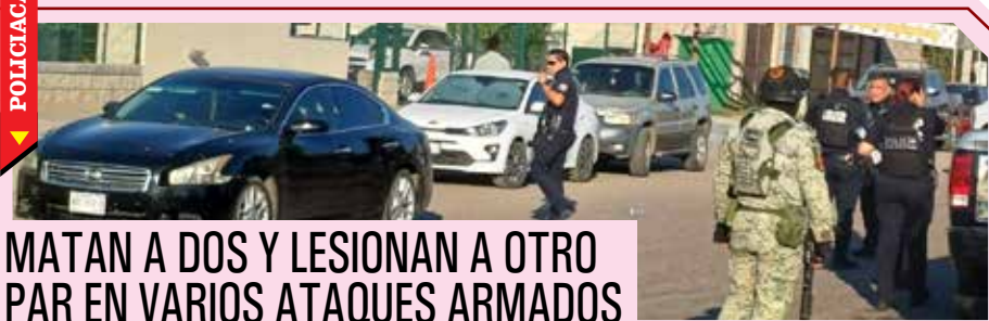
MATAN A DOS Y LESIONAN A OTRO PAR EN VARIOS ATAQUES ARMADOS