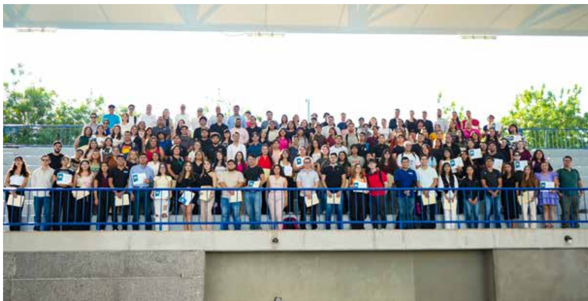
El Itson hizo entrega de reconocimientos a alumnos beneficiados con la beca de Alto Rendimiento Académico.