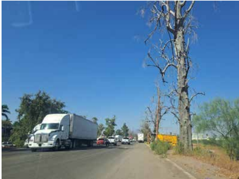
El abandono en materia ambiental, provocó que decenas de árboles de eucalipto se encuentren ecos.

'Ya que el eucalipto es muy fibroso y con cualquier viento se