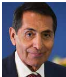
Rogelio Ramírez de la O