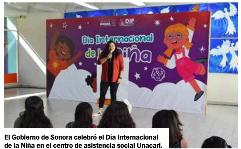
El Gobierno de Sonora celebró el Día Internacional de la Niña en el centro de asistencia social Unacari.