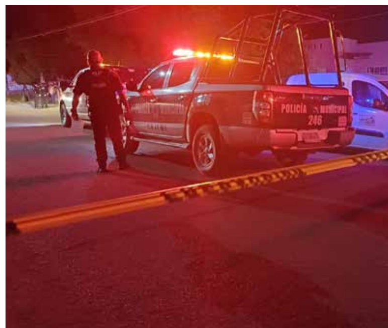
El violento acontecimiento se suscitó por la calle San Dimas entre del Toro y Cuauhtémoc.