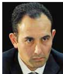
Roberto Gil Zuarth

El expresidente de la Mesa Directiva del Senado de la República, Roberto Gil Zuarth, anunció que aunque no está de acuerdo con la Reforma Judicial, él se lanzará por el cargo de ministro de la Suprema Corte de justicia de la Nación (SCJN) porque asegura que en el Partido Acción Nacional (PAN) le enseñaron que ante los tiranos no hay que arrodillarse, por lo que sólo esperará a que sea lanzada la convocatoria correspondiente para la elección de jueces, magistrados y ministros, para alistar la papelería respectiva y lanzarse por las elecciones de ministro que se llevarán a cabo el mes de Junio del 2025. La noticia la dio a conocer en el programa de Ciro Gómez Leyva, donde el panista indicó que ciertamente los partidos como tales no deben participar porque así lo marcan las reglas, sin embargo, sí podrán participar organizaciones de la sociedad civil, así que se declaró totalmente decidido a participar en la elección, porque los tiempos sin duda alguna han cambiado y no debemos quedarnos rezagados, sino que hay que mantenernos a la vanguardia.