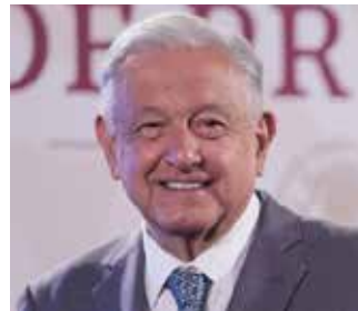
Andrés Manuel López Obrador