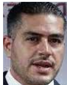
Omar García Harfuch