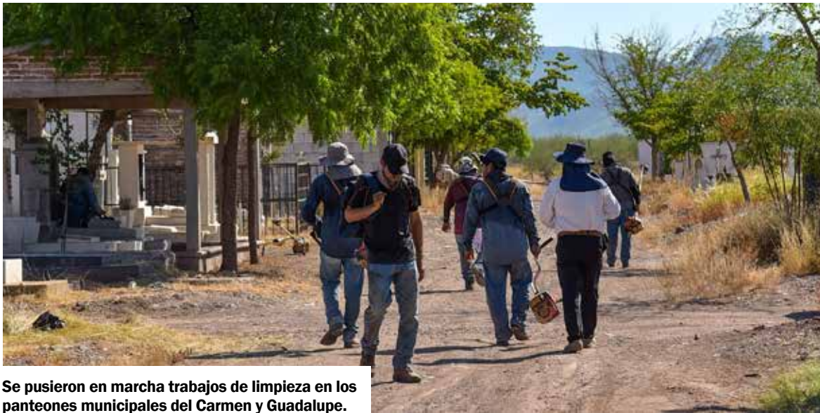
Se pusieron en marcha trabajos de limpieza en los panteones municipales del Carmen y Guadalupe.