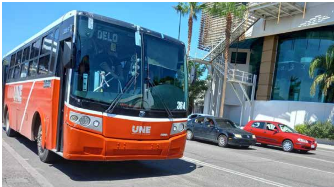
El Gobierno de Sonora giró la instrucción a las empresas concesionarias, para que hagan una extensión en el encendido de aire acondicionado en las unidades del servicio de transporte público urbano de la entidad.