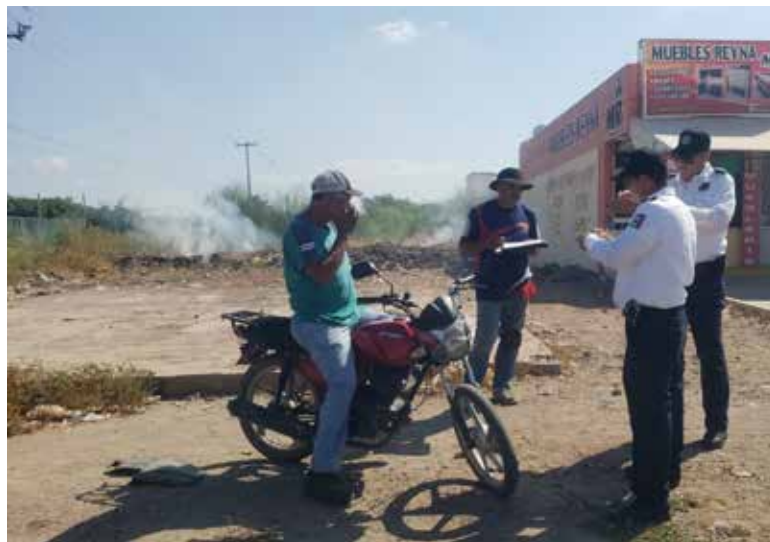
El operativo tiene como principal objetivo detectar motocicletas con reporte de robo y aquellas que representan un peligro para los conductores y peatones.

Asimismo, se prestará especial atención a aquellos vehículos que