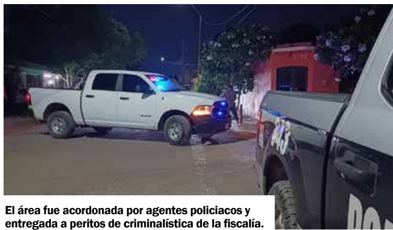
El área fue acordonada por agentes policiacos y entregada a peritos de criminalística de la fiscalía.

Este nuevo homicidio ocurrió a eso de las 17:50 horas de este viernes, por calles Nuevo Lare-