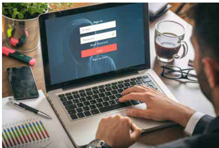
Un exhorto a la ciudadanía a incrementar las medidas de prevención contra el robo de contraseñas hace la Secretaría de Seguridad Pública (SSP) de Sonora a través de su Unidad Cibernética.

La Beca ARA busca otorgar incentivos que brinden mejores oportunidades de desarrollo académico y extracurricular, promoviendo la reciprocidad estudiante- universidad, por medio de la participación activa de las y los alumnos.