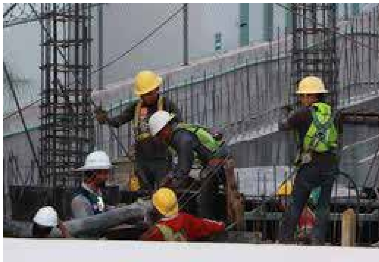
El sector de la construcción en Sonora ha ayudado a que la derrama económica se mantenga estable en la entidad en lo que va del año.

“Mientras haya inversión en la construcción, tanto del gobierno como de la iniciativa privada, se incentiva toda una cadena de valor: talleres, combustibles, ferreterías, tiendas en general. Durante años este sector ha sido una punta de lanza para la generación de derrama económica en Sonora y queremos continuar en esa tó-