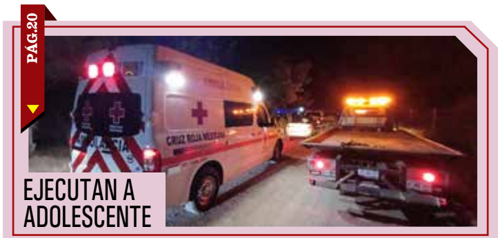
PÁG. 20 ▶ EJECUTAN A ADOLESCENTE