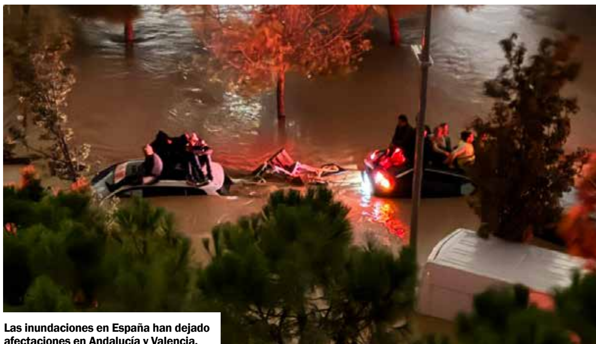
Las inundaciones en España han dejado afectaciones en Andalucía y Valencia.