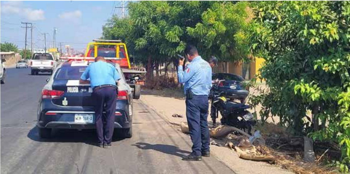
Lesiones de consideración sufrió un peatón al ser arrollado por un motociclista, que igualmente resultó herido.