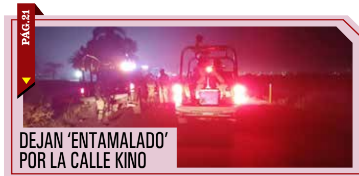
PÁG. 21 ▶ DEJAN 'ENTAMALADO' POR LA CALLE KINO