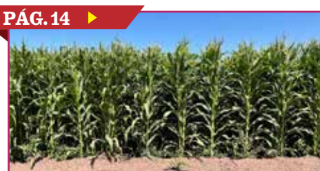
PÁG. 14 ▶ APUESTAN PRODUCTORES POR EL MAÍZ PARA ELOTE