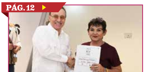
PÁG. 12 ▶ LLEVAN MEJORAS A SLRC Y PEÑASCO