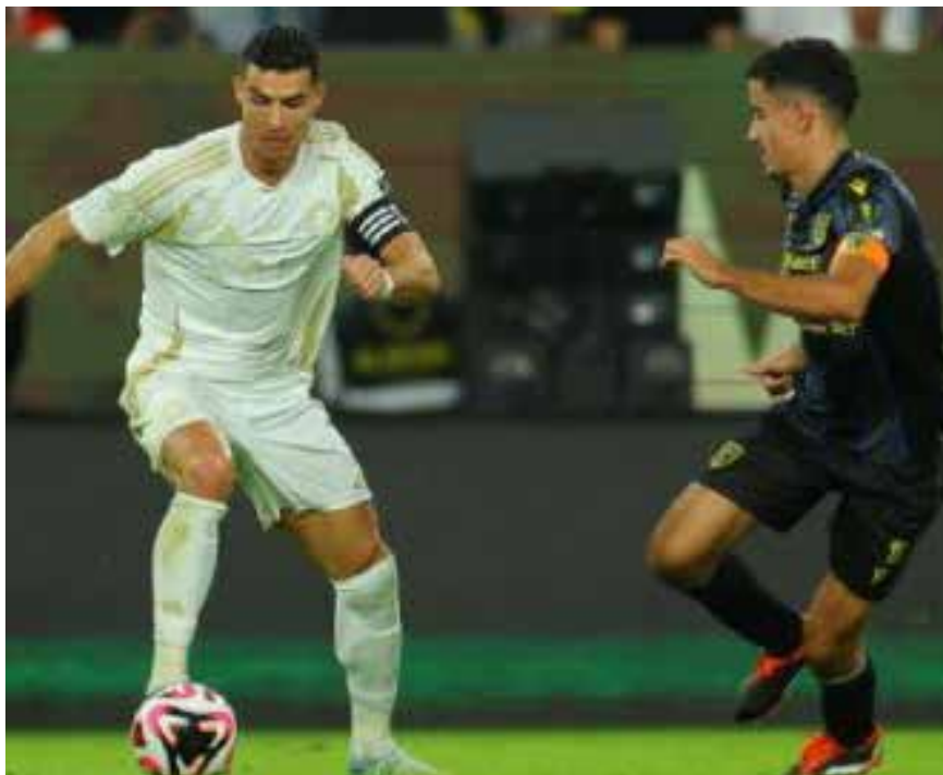
El equipo de Ronaldo fue eliminado de la competencia.

e impactó de derecha, pero el remate fue con demasiada potencia y lo voló por encima del travesaño del rival.