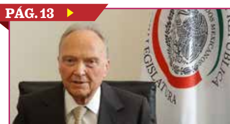
PÁG. 13 ▶ SECUESTRO DE 'EL MAYO' ESTÁ PROBADO: GERTZ