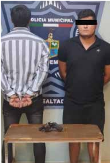
Los tres sujetos fueron trasladados al edificio de la SSPM para la elaboración del Informe Policial Homologado, así como turnados a las instancias correspondientes conforme a ley.

probable delito de portación de arma prohibida. Asimismo, en operativos mixtos entre SSPM y Marina, en las calles 400 entre Zafiro y España de la colonia Villas del Cortés, se realizó la detención de dos hombres, quienes circulaban en un automóvil tipo pick up de la