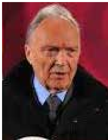
Alejandro Gertz Manero