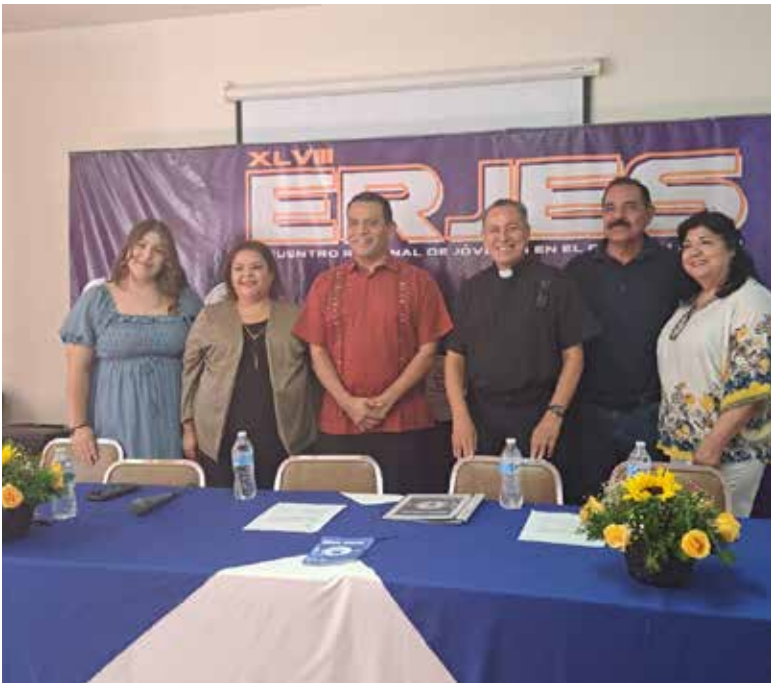
Después de 17 años, Encuentro Regional del Espíritu Santo, ERJES, regresa Cajeme y en esta ocasión recibirá a al menos 1,300 personas de diferentes ciudades.

que profesen. Los horarios son de 8:30 de la mañana a 2:30 de la tarde, con un costo de recuperación de 120 pesos. El ERJES 2024, se realizará en el marco del jubileo del Sagrado Corazón, por ello el Lema de este año es “Te daré un corazón nuevo”. Entre las actividades se encuentra las charlas, dinámicas, oraciones, momentos de alabanza y la interacción con otros jóvenes de todo el noroeste del país. La finalidad es reunir a la juventud, para que las y los participantes promuevan su fe, su espiritualidad y sobre todo experimenten un encuentro con Dios traducido en un crecimiento personal.