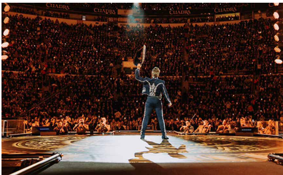
Histórico concierto ofreció Alejandro Fernández el pasado fin de semana en el arranque de su gira llamada 'De rey a rey', tour que cuenta ya con más de 30 fechas confirmadas.