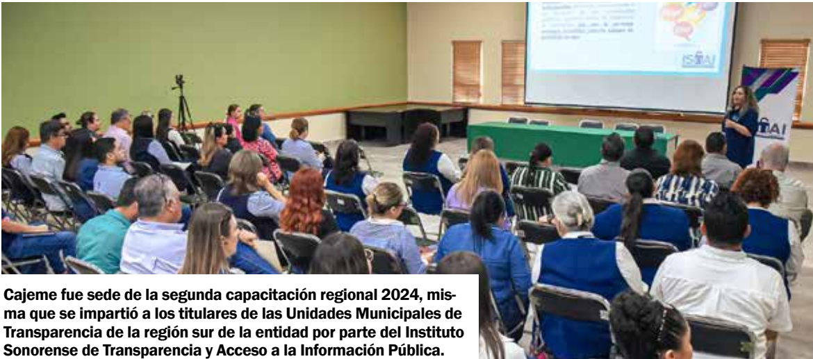
Cajeme fue sede de la segunda capacitación regional 2024, misma que se impartió a los titulares de las Unidades Municipales de Transparencia de la región sur de la entidad por parte del Instituto Sonorense de Transparencia y Acceso a la Información Pública.