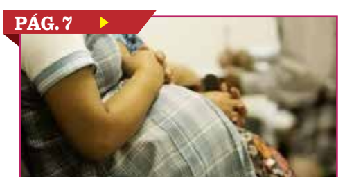
PÁG. 7 ▶ 'EDUCACIÓN SEXUAL TAMBIÉN ES EN CASA'