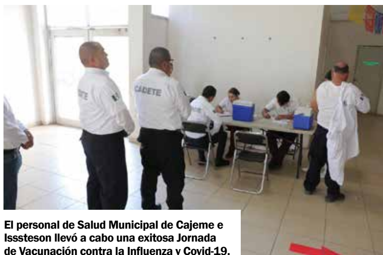
El personal de Salud Municipal de Cajeme e Issteson llevó a cabo una exitosa Jornada de Vacunación contra la Influenza y Covid-19.

de la superficie, riego de impregnación y aplicación de base con carpeta asfáltica modificada con polímeros de alta resistencia.