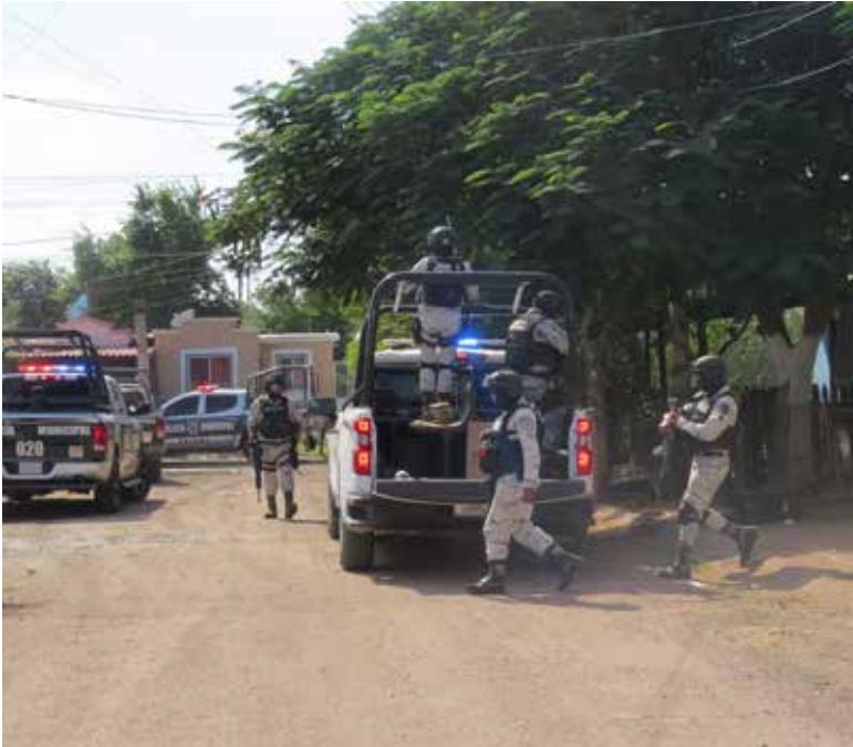
Sujetos no identificados protagonizaron una balacera en Villa Bonita lo que generó tenaz despliegue policiaco militar.

Hasta esa zona arribaron agentes de diferentes corporaciones, así como personal del Ejército, Marina y Guardia Nacional. Hicieron un recorrido en el perímetro y revisaron un terreno baldío en busca de posibles víctimas, pero no se encontró nada de momento.