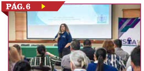
PÁG. 6 ▶ CAPACITAN EN TRANSPARENCIA