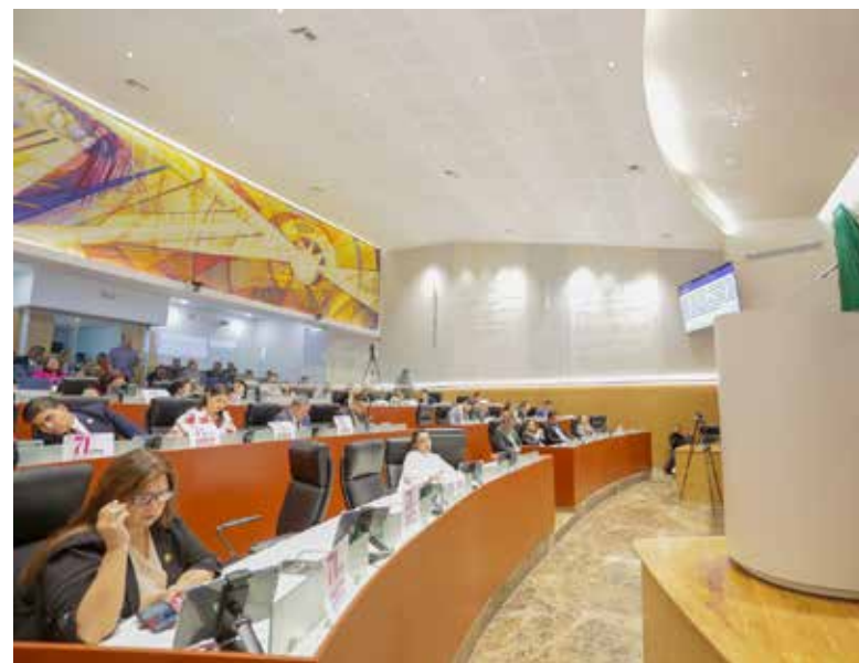
El Congreso de Sonora aprobó iniciativas para reformar la Ley de Protección y Bienestar Animal.

dad de Álamos, para realizar una sesión ordinaria el jueves 14 de noviembre del presente año, con motivo de la conmemoración del bicentenario de la constitución del Estado Interno de Occidente.