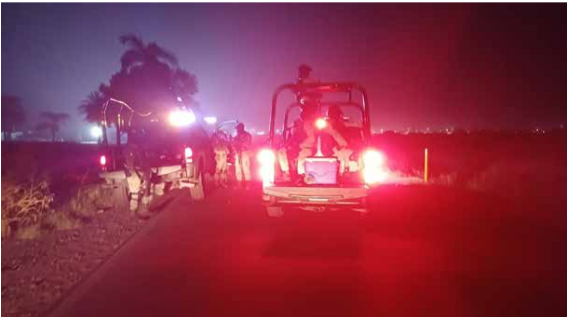
En los últimos minutos del lunes fue dejado el cadáver de un hombre envuelto en plástico negro a un costado de la calle Kino.

Este sería el cuarto ejecutado del lunes, luego por la tarde dieron muerte a dos jóvenes en diferentes ataques armados en colonias Misión del Sol 2 y Misión San Xavier. El tercer homicidio fue perpetrado en calles Nubia y Mozambique, en colonia Ampliación Alameda poco antes de las 18:20 horas. Al lugar del hallazgo del “entamalado” se movilizaron agentes policiacos de distintas corporaciones, militares, marinos y Guardia Nacional. Personal de Servicios Periciales de la fiscalía estatal, aseguraron indicios y procesaron el sitio donde se encontró el cadáver. Después fue levantado y trasladado por elementos del Servicio Médico Forense (Semefo) a instalaciones de medicina legal para los efectos de ley.