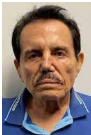
Ismael "El Mayo" Zambada lo secuestraron en México y eso está probado, afirmó el fiscal General de la República, Alejandro Gertz Manero.

'Esa persona fue secuestrada en Culiacán, llegó por avión a una ciudad fronteriza de los Estados Unidos, la entrada de cualquier avión y cualquier persona están reglamentadas con la Ley Norteamericana y se tiene que identificar el vehículo', aseveró el titular de la FGR