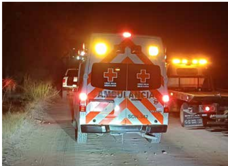
Un menor de edad fue privado de la vida con ráfagas de armas de alto poder, en Esperanza.

Quedó a un costado de una motocicleta de color negro con rojo, que tripulaba al momento de ser alcanzado por las mortí-