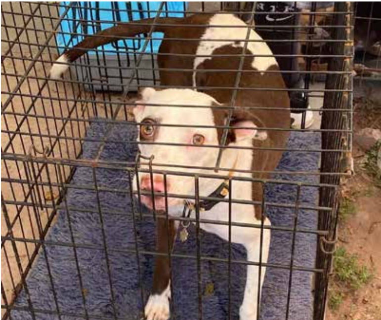
La próxima jornada de esterilización se llevará a cabo el próximo 26 de noviembre, para la cual las personas pueden apoyar con donativos comunicándose a través de las redes sociales de Entre Canes o Esteriliza y Salva Miles de Vidas.

096 animales operados con el objetivo de reducir la sobrepoblación animal en las calles, por lo que se extiende el llamado a la ciudadanía a apoyar con donativos y a dueños de mascotas a tener una tenencia responsable. La próxima jornada de esterilización se llevará a cabo el próximo 26 de noviembre, para la cual las personas pueden apoyar con donativos comunicándose a través de las redes sociales de Entre Canes o Esteriliza y Salva Miles de Vidas.