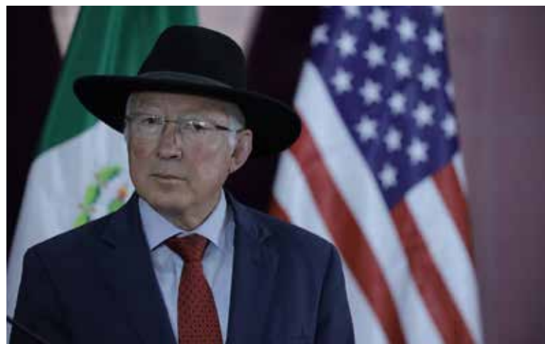
Ken Salazar, embajador de Estados Unidos señaló que el gobierno de México debería considerar la detención del líder del Cártel de Sinaloa como una "victoria".

En la conferencia matutina de Sheinbaum, Gertz criticó al gobierno de Estados Unidos por no entregar una información "fundamental" al gobierno de México respecto a la avioneta utilizada para sustraer a Zambada. El fiscal insistió en que Zambada fue secuestrado en Culiacán y llevado por avión a Estados Unidos, un país donde "la entrada de cualquier avión y de cualquier persona están reglamentadas".