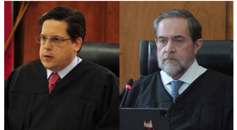
Los ministros que presentaron su renuncia son: Alfredo Gutiérrez Ortiz Mena y Jorge Mario Pardo Rebolledo.