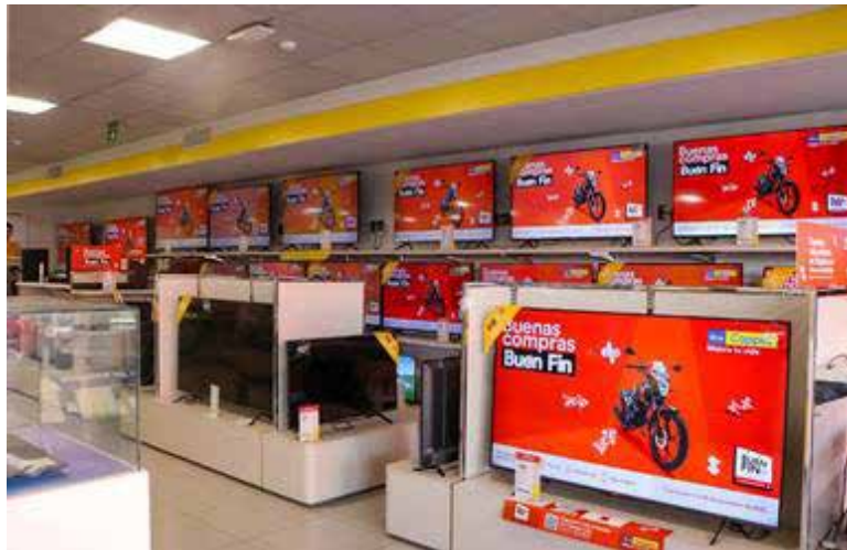
La Federación de Cámaras Nacionales de Comercio, Servicios y Turismo en Sonora (Fecanaco), reconoce los resultados positivos que arrojó la última edición del programa nacional "Buen Fin 2024" en la entidad.

HERMOSILLO. La Federación de Cámaras Nacionales de Comercio, Servicios y Turismo en Sonora (Fecanaco), reconoce los resultados positivos que arrojó la última edición del programa nacional "Buen Fin 2024" en la entidad.