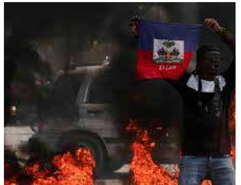
Al menos 150 personas muertas, 92 heridas y aproximadamente 20.000 desplazadas durante la semana del 11 de noviembre.