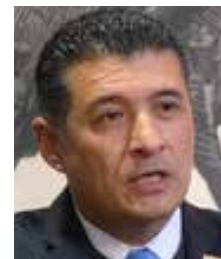
Adrián Alcalá Méndez

El Instituto Nacional de Acceso a la Información y Protección de Datos Personales (INAI) emitió un enérgico posicionamiento ante la discusión de la Cámara de Diputados, sobre la iniciativa de reforma constitucional que podría llevar a la desaparición. Adrián Alcalá Méndez, calificó esta medida como un grave retroceso en materia de derechos humanos, transparencia y protección de datos personales, pilares fundamentales de la democracia mexicana. Dijo que la defensa del INAI no es la defensa de un ente democrático, sino la defensa de conquistas sociales ganadas a pulso por generaciones de mexicanas y mexicanos. La medida presentada como una medida de simplificación orgánica, propone transferir las funciones del INAI a una nueva Secretaría de Anticorrupción y Buen Gobierno, sin embargo, esta transición sería convertirla en juez y parte, por lo que así le estará sirviendo solo al gobierno, no a los ciudadanos, para lo que fue creado ante los abusos de poder y falta de transparencia.