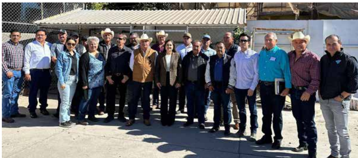
Sagarhpa se reúne con lecheros del Valle del Yaqui.

Como parte de los trabajos de la Secretaría de Agricultura, Ganadería, Recursos Hidráulicos, Pesca y Acuicultura (Sagarhpa), se tuvo una reunión con los productores de leche del Valle del Yaqui el pasado martes.