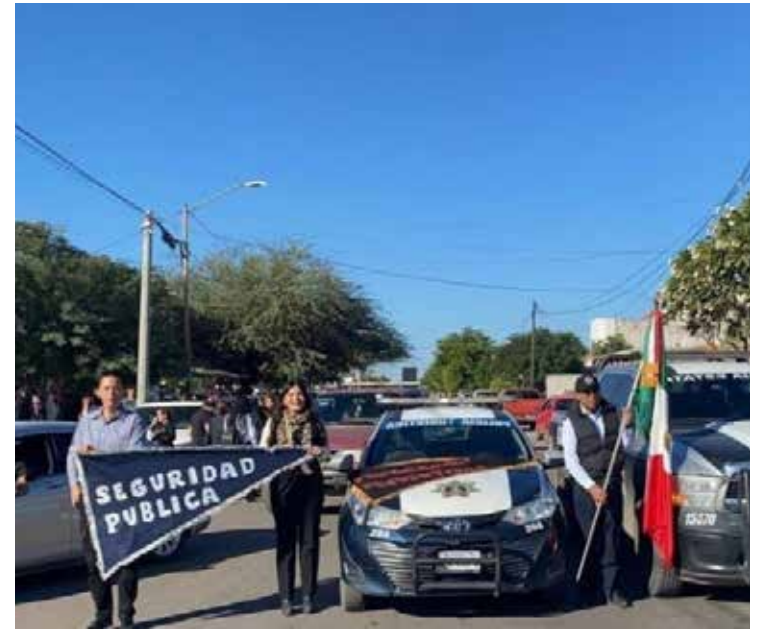
Estudiantes de la colonia Urbi Villa del Rey, en Cajeme, participaron en el desfile para conmemorar el 114 aniversario del inicio de la Revolución Mexicana, como parte de las actividades de la Jornada Permanente por la Paz, que impulsa la Secretaría de Seguridad Pública.

Algunos han optado ante la gravedad de sus situaciones personales que han tenido que ausentarse sin autorización, por lo que les han acreditado faltas injustificadas, con lo que han perjudicado los bonos por puntualidad y asistencia.