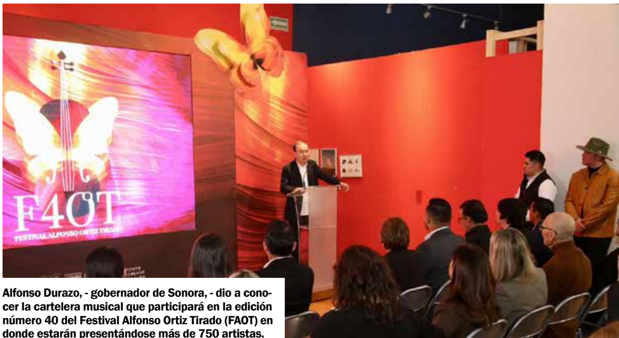
Alfonso Durazo, - gobernador de Sonora, - dio a conocer la cartelera musical que participará en la edición número 40 del Festival Alfonso Ortiz Tirado (FAOT) en donde estarán presentándose más de 750 artistas.