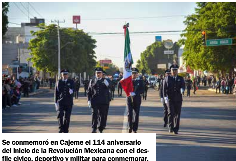
Se conmemoró en Cajeme el 114 aniversario del inicio de la Revolución Mexicana con el desfile cívico, deportivo y militar para conmemorar.

Previo al tradicional desfile se realizó un izamiento de bandera en la plaza Álvaro Obregón, donde participaron funcionarios de primer nivel, personal del 60 Batallón de Infantería, agentes de la SSPM y jóvenes que realizan su servicio militar