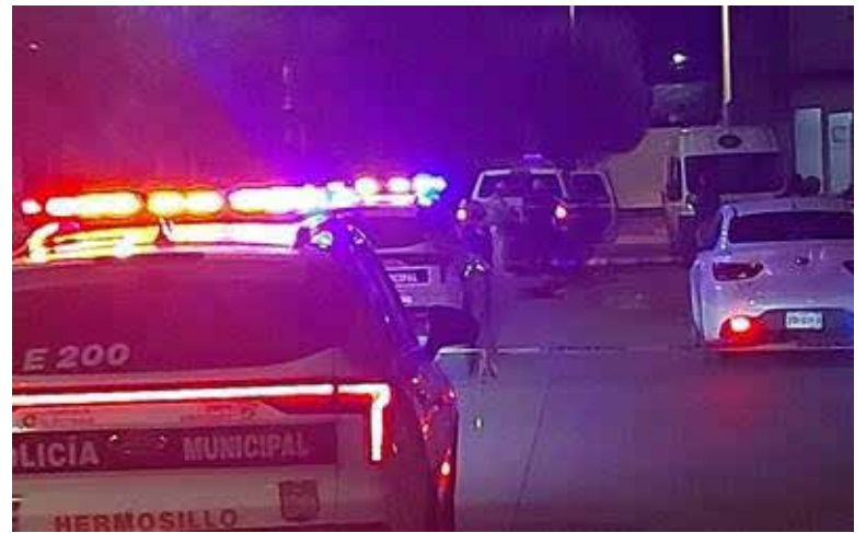
Agresión armada en el Ejido La Victoria dejó el saldo de una persona sin vida y una más lesionada, durante la madrugada de este miércoles.

Los oficiales tuvieron conocimiento de que más adelante, por la Calle 6, se reportó a una persona, de 19 años, lesionada por proyectiles de arma de fuego, por lo