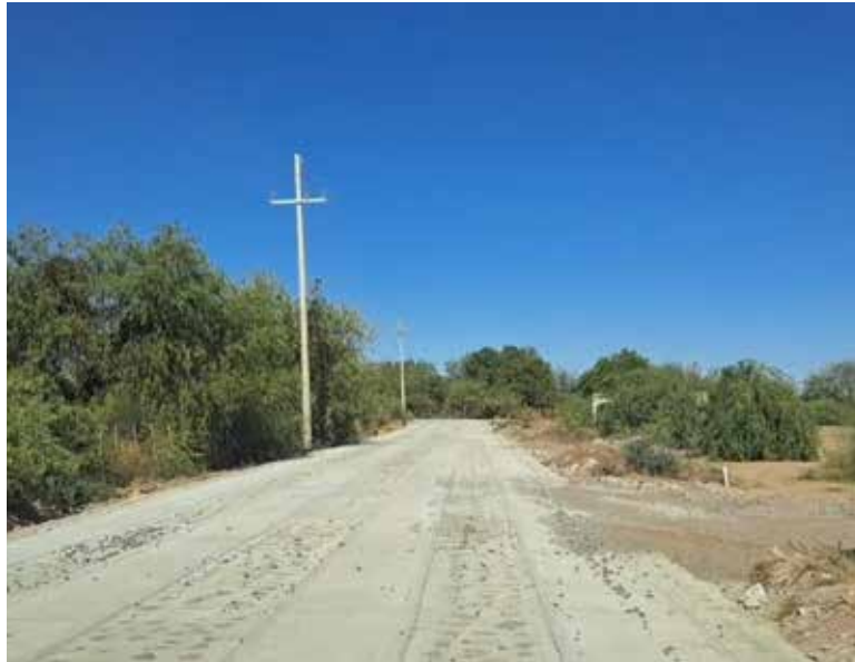
El camino artesanal que conecta a los pueblos yaquis de El Conti y Loma de Guamúchil se proyecta concluir para mediados de diciembre. Son alrededor de 400 metros los que restan por ser pavimentados.

metros de ancho y tendrá una vida útil de aproximadamente 20 años.