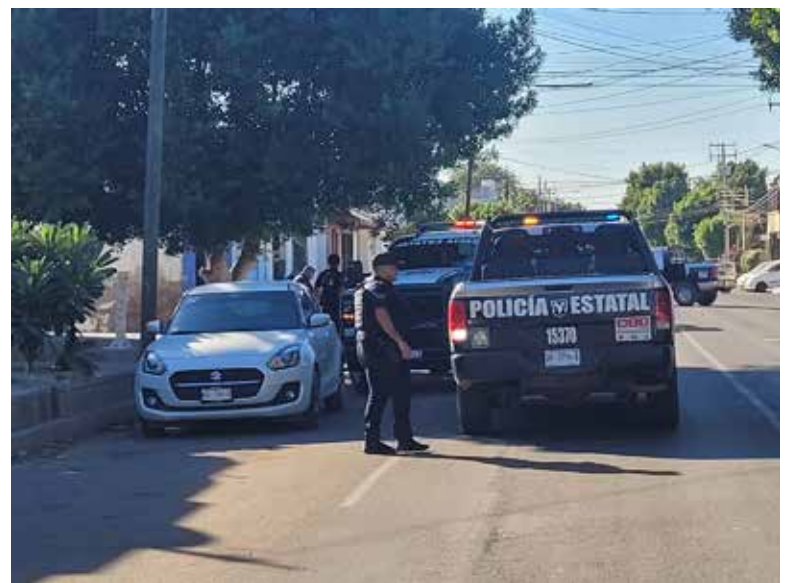
El cadáver fue levantado y trasladado por personas del Servicio