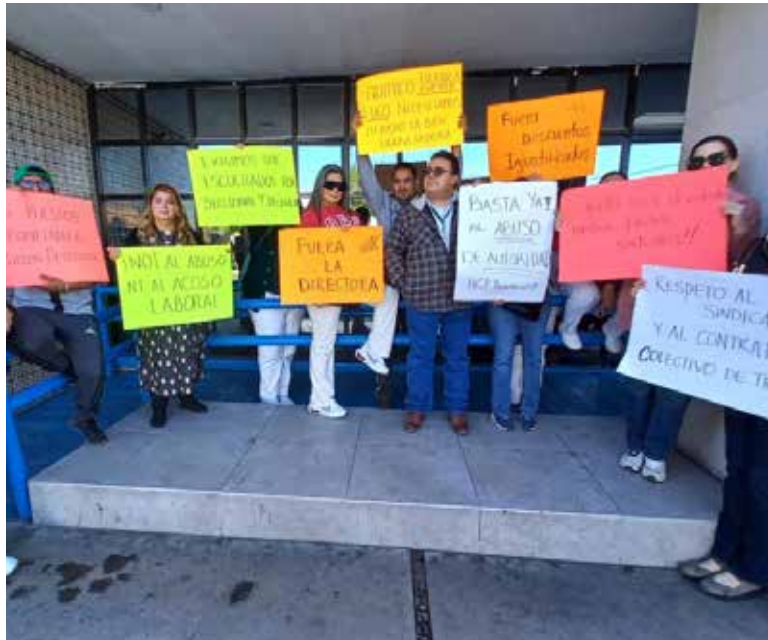
Para exigir la destitución de su directora, trabajadores del Hospital de Ginecopediatría del Instituto Mexicano del Seguro Social (IMSS) realizaron una marcha y se manifestaron en el nosocomio.

Con pancartas en las que señalaban las irregularidades en las que presuntamente ha incurrido la funcionaria, al negarse a cumplir con beneficios que tiene el trabajador, demandaron el cese de la directora del nosocomio.