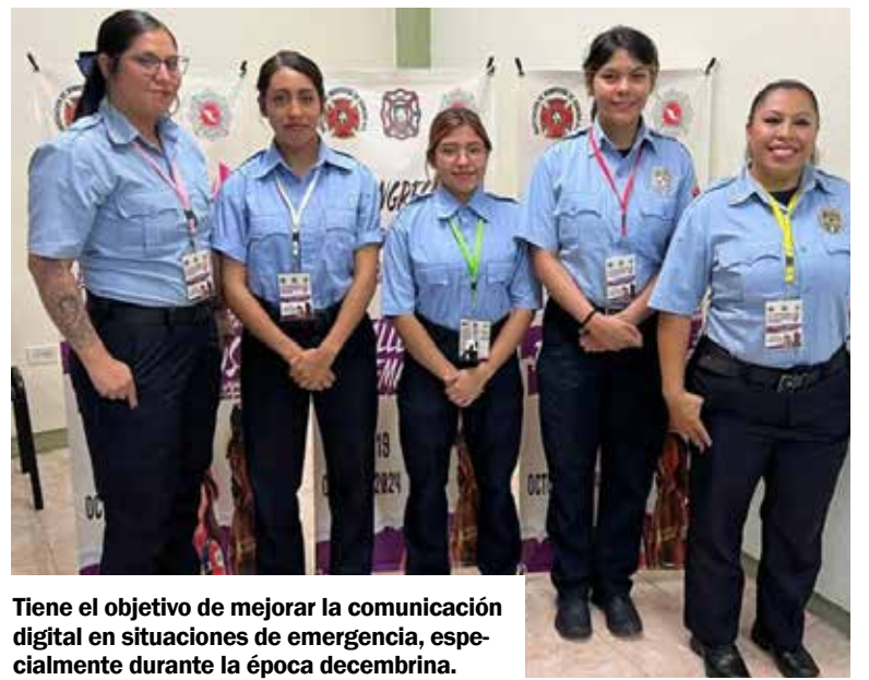
Tiene el objetivo de mejorar la comunicación digital en situaciones de emergencia, especialmente durante la época decembrina.