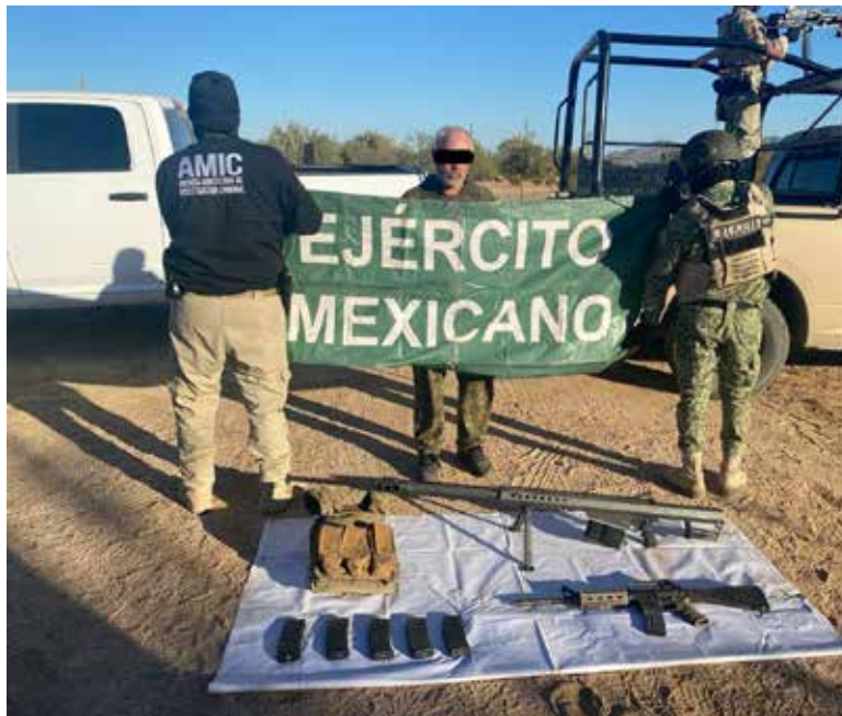
Olimpico 'N', de 54 años, fue asegurado en posesión de un fusil Colt AR-15.

Olimpico 'N', de 54 años, originario de Tamazula, Durango, fue asegurado en posesión de un fusil Colt AR-15 y un chaleco táctico con cargadores abastecidos, además, al inspeccionar el área, se