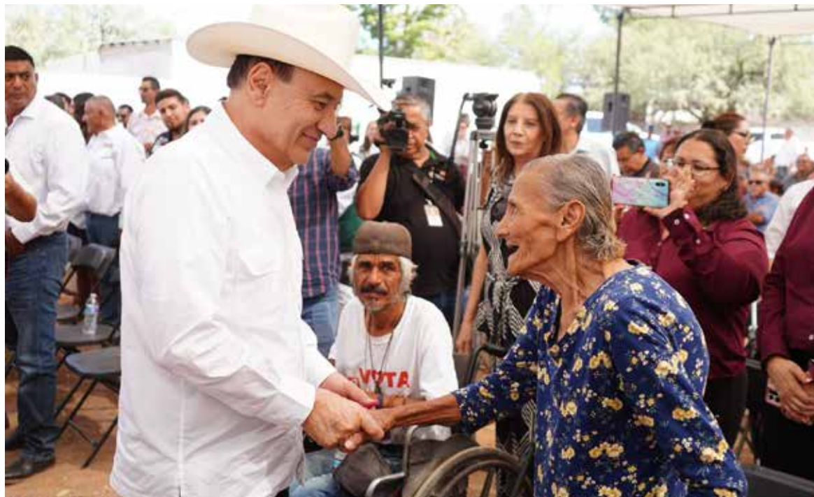
El Congreso de Sonora aprobó un presupuesto histórico y con sentido social para el ejercicio fiscal 2025, cuyo objetivo principal es priorizar el bienestar de los sonorenses, aseguró el gobernador Alfonso Durazo Montaña.

El mandatario estatal destacó que el monto aprobado por las y los diputados asciende a 89 mil 198 millones 372 mil 583 pesos,