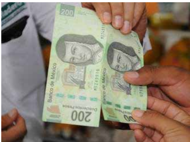
Exhorta el departamento de policía en Hermosillo a la sociedad a extremar medidas y no ser víctimas de posibles estafadores que ponen en circulación billetes falsos.

mecanismos y aditamentos para detectar los billetes falsos como las barras de identificación que