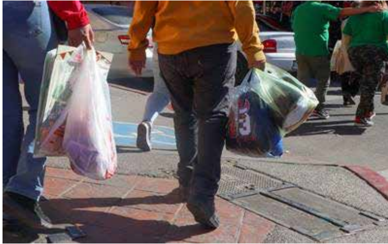
Para prevenir que la ciudadanía sea víctima de delitos al realizar las compras de fin de año, la Secretaría de Seguridad Pública de Sonora, emitió importantes recomendaciones.

Recomienda Seguridad Pública redoblar medidas como estacionar de forma correcta sus vehículos, buscar lugares bien iluminados, mantener consigo en todo momento llaves y objetos personales como bolsas