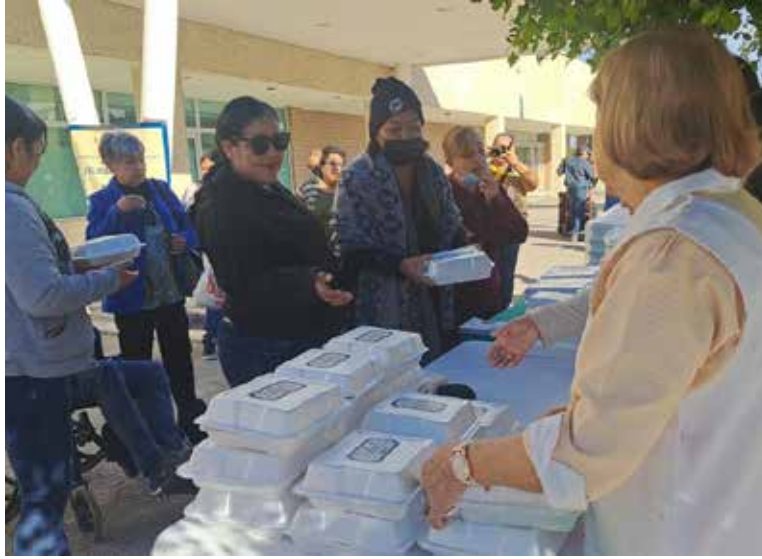
Las voluntarias del Albergue Santa María de Guadalupe, en Ciudad Obregón, entregaron desayunos gratis.

las voluntarias, explicó que esto se realizó en Veracruz, Coahuila, Ciudad de México y Obregón, que son lugares en donde se encuentran plantas de Constellation Brands.