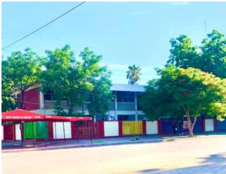
Desde octubre, el Jardín de Niños Juan Enrique Pestalozzi, localizado en la Comisaría de Esperanza, Sonora, enfrenta una grave situación debido a la falta de energía eléctrica.

Los padres de familia han intentado comunicarse con la Secretaría correspondiente en busca de información y soluciones, sin embargo, no han obtenido respuestas satisfactorias.