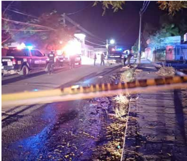
Este nuevo hecho violento se registró por la calle Coahuila entre Nochebuena y Laureles.

Trascendió que el ahora occiso se encontraban en el exterior de un domicilio cuando fue sorprendido por al menos un sujeto armado, quien le disparó en repetidas ocasiones para después darse a la fuga.