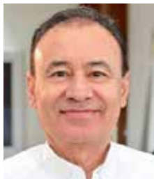
Alfonso Durazo Montaña