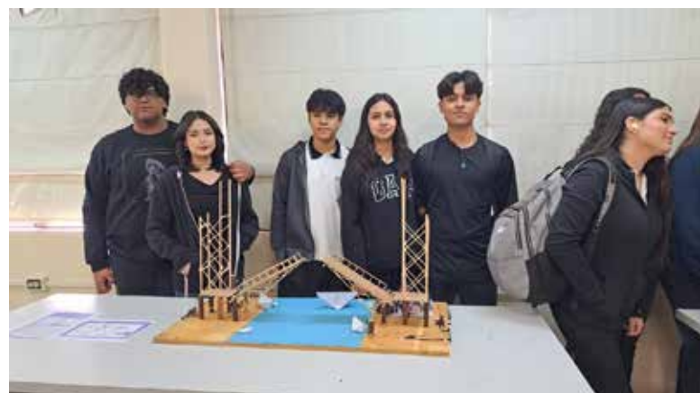
Desde tableros electrónicos, elevadores y sensores de movimiento, formaron parte los proyectos que estudiantes de la carrera de Electrónica del Cbtis #37 presentaron durante la 'Feria del Conocimiento'.

Mencionó que estos proyectos permiten el desarrollo de los estudiantes, por lo que son de suma importancia para las y los jóvenes. 'Son muy buenos proyectos, los