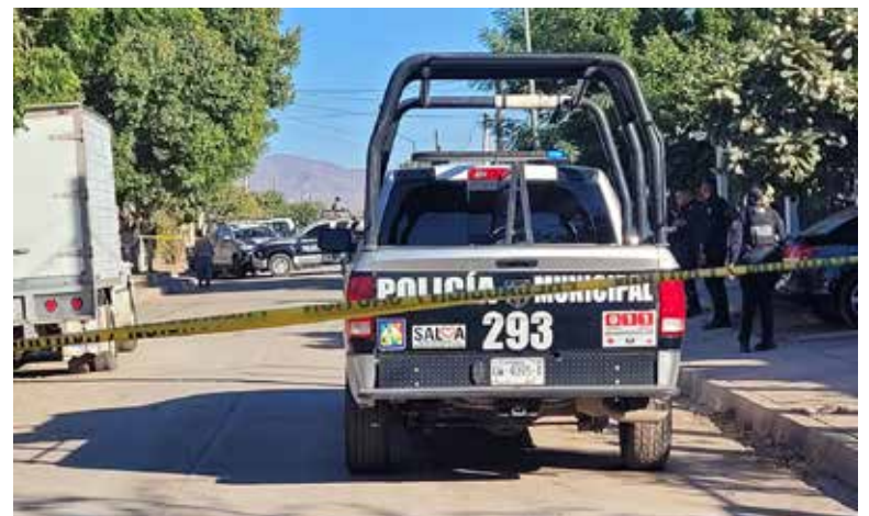
El violento incidente se produjo por la calle Luis Alcaraz entre bulevar Abelardo L. Rodríguez e Ignacio López Rayón.