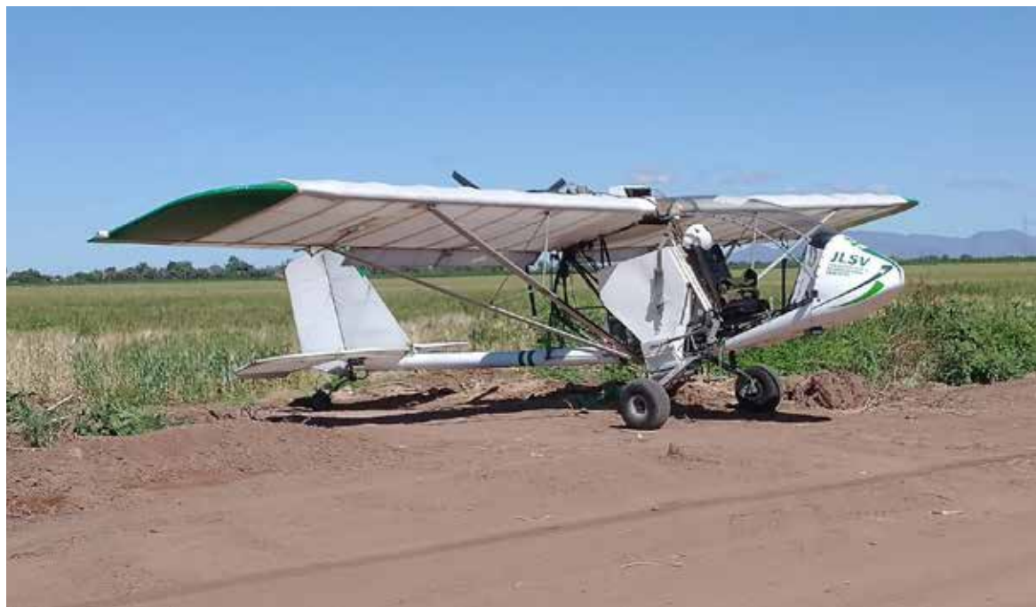
Por más de 10 años, personal de Sanidad Vegetal se encargó de aplicar la liberación de insectos benéficos en los campos del Valle del Yaqui, un proyecto que tomó demasiada importancia en el control de plagas, hoy se ha decidido cancelar.

La noticia fue dada a conocer a través de redes sociales, donde el departamento de liberación publicó lo siguiente: "Este servicio al campo por parte de la Junta Local