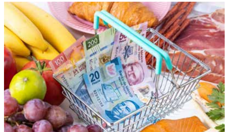
Esta es la racha más larga desde 2003, cuando se estableció la meta puntual de inflación en México.

incremento de 5.95% anual, una notable reducción frente al 7.60% anual reportado en noviembre.