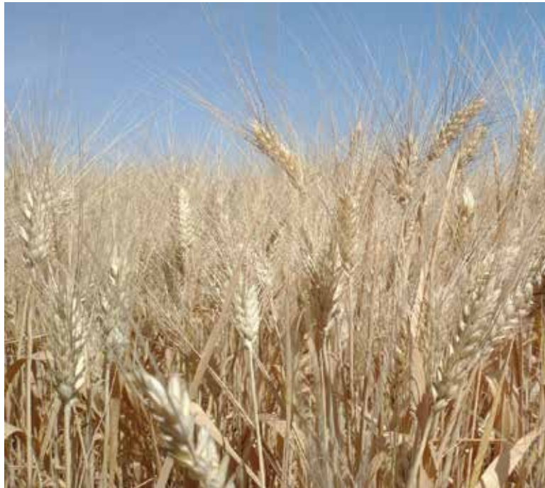
Como consecuencia de la baja siembra de granos como trigo duro y maíz en el Valle del Yaqui y el resto del sur de Sonora, el país enfrentará un déficit en su abasto que lo obligará a aumentar sus importaciones de estos productos.

Resaltó que en el Valle del Yaqui son solo 3 mil hectáreas de 160 mil que se sembraron de este cereal el ciclo pasado, lo que significa que por primera vez en la historia México tendrá que importar la variedad cristalina.