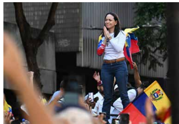
"Durante el periodo de su secuestro fue forzada a grabar varios videos y luego fue liberada", señaló la jefa de comunicaciones de la dirigente opositora.