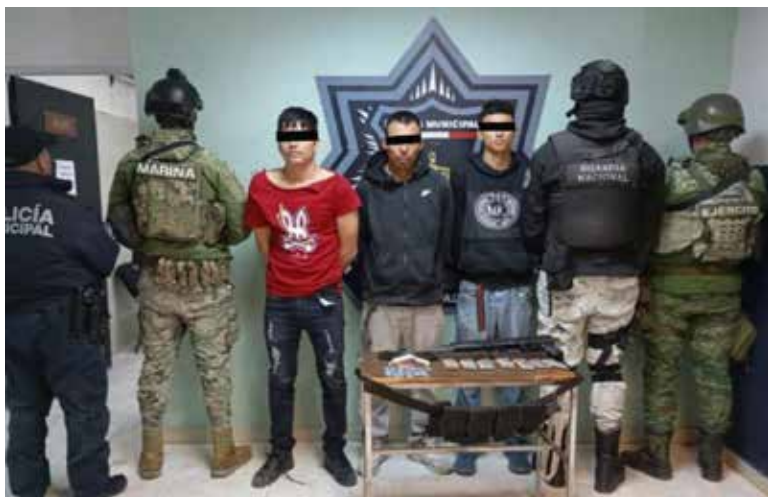
De Arizona a Sonora, es una de las principales rutas por donde ingresan armas a México, fabricadas en Estados Unidos, de acuerdo a un informe de la Oficina de Alcohol, Tabaco, Armas de Fuego y Explosivos (ATF).

Este análisis difundido por el Inegi y elaborado por el Seminario sobre Violencia y Paz (SVP) de El Colegio de México, Sólo 8.6 por ciento de las armas de fuego ilegales en circulación en México son aseguradas por las autoridades.