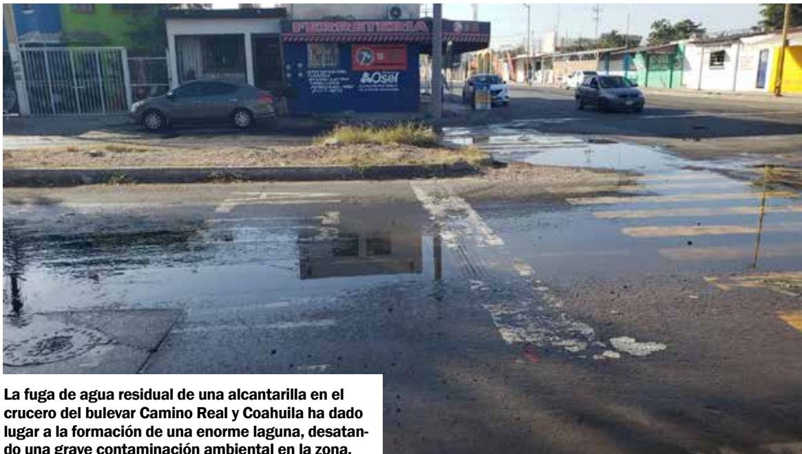
La fuga de agua residual de una alcantarilla en el cruce del bulevar Camino Real y Coahuila ha dado lugar a la formación de una enorme laguna, desatando una grave contaminación ambiental en la zona.