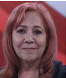
Rosario Piedra Ibarra