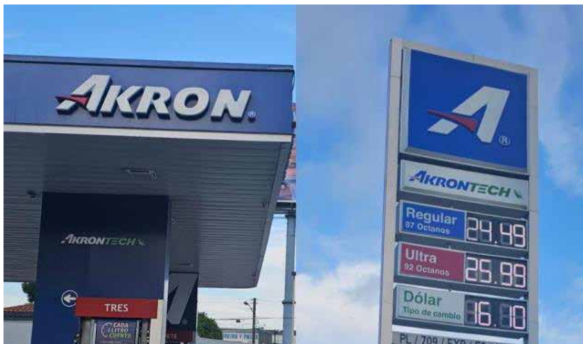
El incremento a los precios de las gasolinas durante los primeros días de este 2025 en México del 4.55% se debe al índice inflacionario y es el único aumento que se estima en este año.