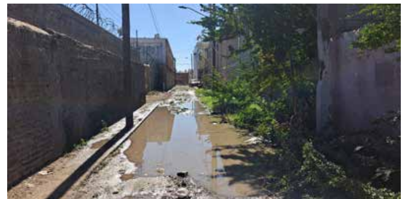
imagen y hasta de accesibilidad, pues el llegar a sus domicilios se

Para las y los vecinos de este sector, la situación se ha convertido en un problema de salud pública,