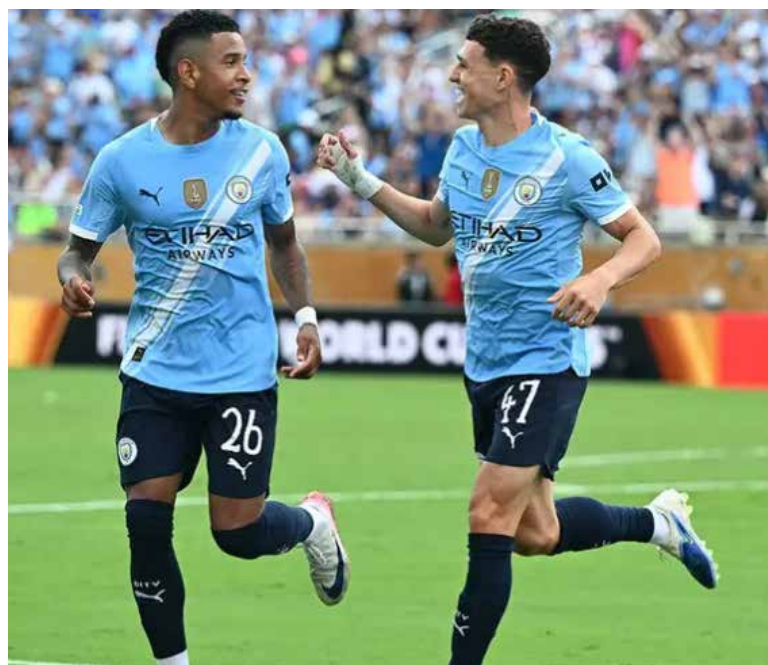
El Manchester City goleó 5-2 a la Juventus en la última jornada del Grupo G del Mundial de Clubes y podría cruzarse con el Real Madrid en octavos de final.

Con ambos equipos clasificados a la siguiente ronda, el duelo no tuvo tanta intensidad y eso lo aprovechó mejor el City, que se