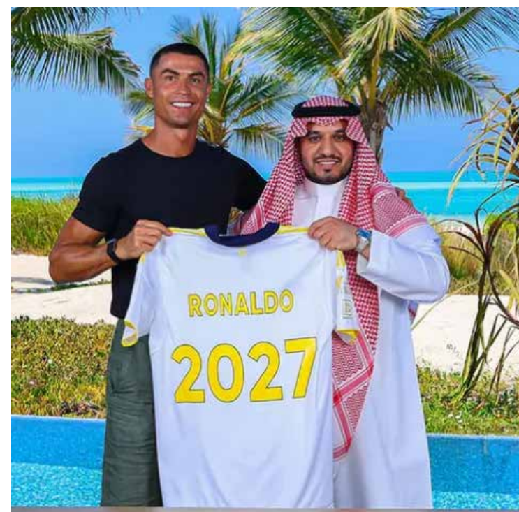
El luso Cristiano Ronaldo decidió renovar con el Al-Nassr hasta 2027. 'La historia continúa'.

En el otro encuentro del grupo, el Al Ain ganó 2-1 al Wydad, aunque el resultado es intrascendente ya que ambos estaban eliminados.