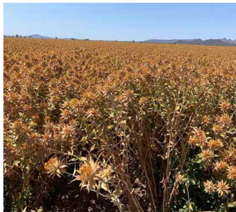
El cártamo presentó un buen desarrollo durante la temporada.