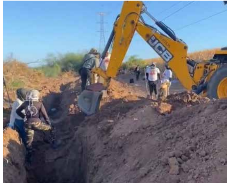
Fue necesaria la utilización de una máquina retroexcavadora para agilizar las labores.