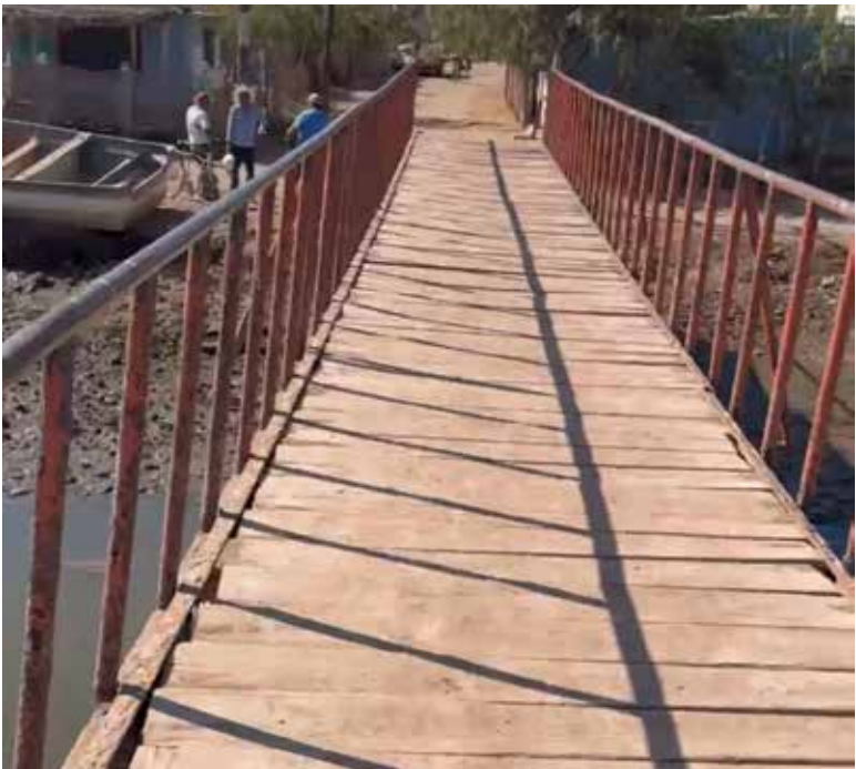
En mal estado se encuentra el puente peatonal para cruzar el canal de llamada que divide a la comunidad yori y yaqui en Bahía de Lobos.