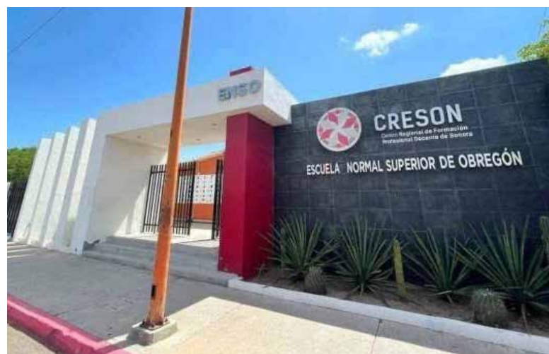
Hasta el próximo 30 de junio estará abierta la convocatoria para la Maestría en Educación Especial con Enfoque Inclusivo que se impartirá en la Escuela Normal Superior de Obregón.