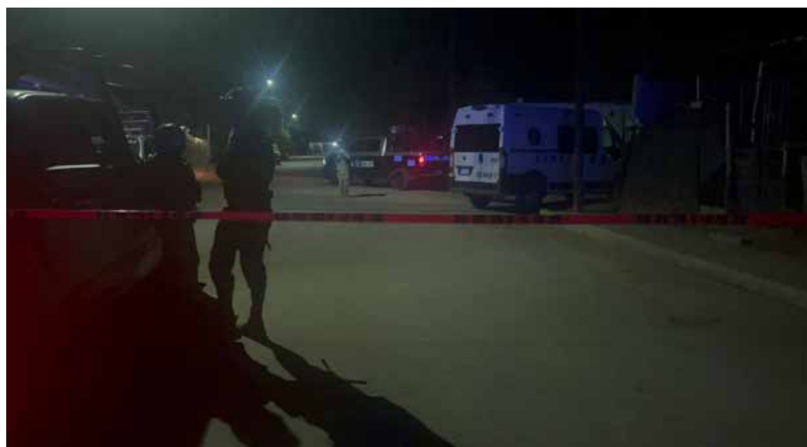
Personal del Servicio Médico Forense (Semefo) levantó y trasladó el cadáver a Medicina Legal.

Personal del Servicio Médico Forense (Semefo) levantó y