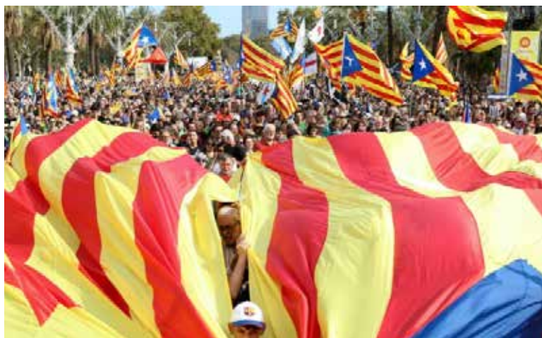
El Tribunal Constitucional de España validó la ley de amnistía para los implicados en el proceso independentista catalán de 2017.