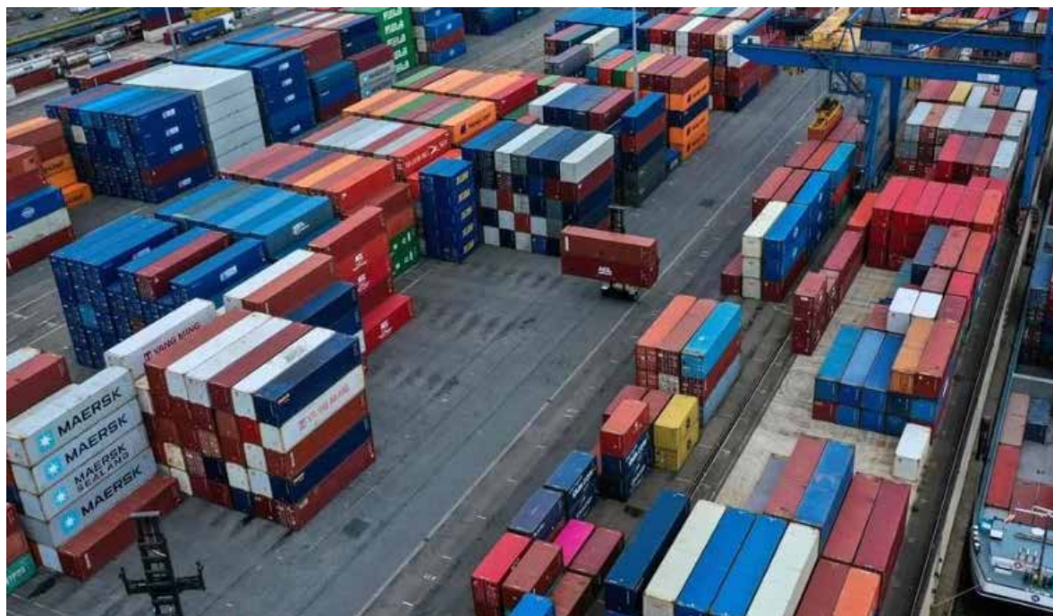
Registran exportaciones en mayo segunda baja.

En mayo de 2025, el valor de las exportaciones ascendió a 55 mil 476.4 millones de dólares, monto inferior en un 0.35 por ciento con respecto al del mismo mes de 2024. Las ventas al exterior de productos agropecuarios, en medio de la incertidumbre por los aranceles, descendieron 6.6 por ciento, y de las manufacturas automotrices, que descen-