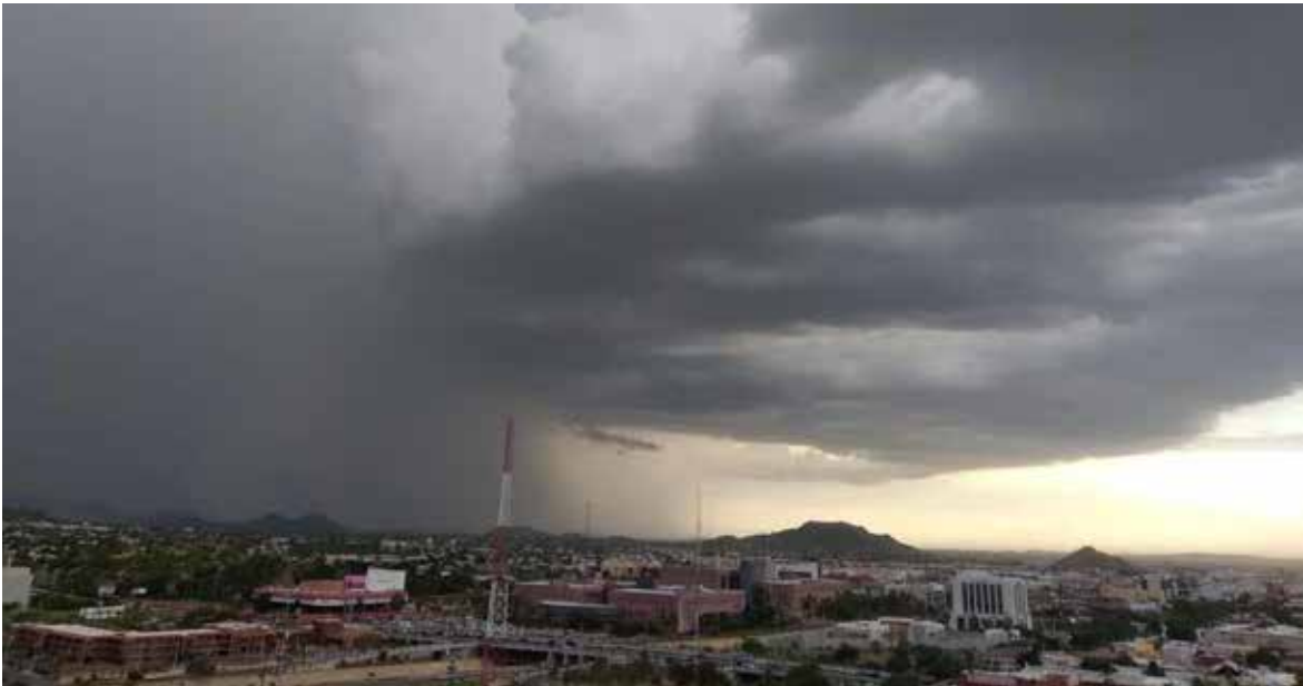
Protección Civil Sonora exhorta a mantenerse informados y tomar precauciones ante el pronóstico de calor extremo seguido de posibles condiciones de lluvias en la región centro del estado.

HERMOSILLO. Durante el viernes 27 de junio, se prevé el posicionamiento de una circulación anticiclónica en niveles medios de la atmósfera, la cual originará un notable aumento en las temperaturas durante el fin de semana y parte del lunes. En las regiones noroeste, centro y sur del estado se pronostican valores máximos que oscilarán entre los 43 y 46 °C, e incluso superiores en algunos puntos. Aunado a esto, una considerable cantidad de humedad en el ambiente pro-