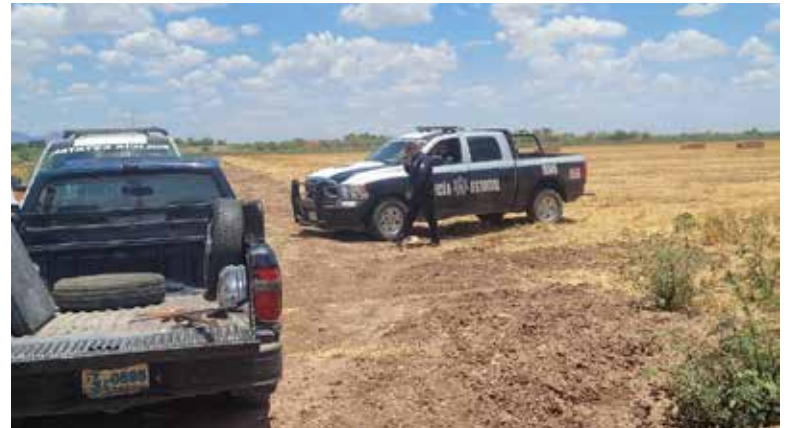
Las osamentas fueron trasladadas al anfiteatro del Centro Integral de Procuración de Justicia.

Esto, agregó: ‘aún y cuando no sean nuestros familiares que buscamos, hacemos nuestro el dolor