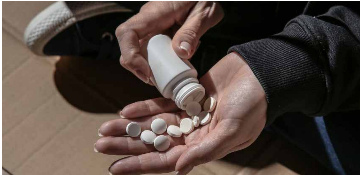
El Informe Mundial sobre Drogas 2025 revela un preocupante incremento global en el consumo de sustancias ilícitas.

El informe pone énfasis en el creciente dominio de las drogas sintéticas, como el fentanilo y la metanfetamina, las cuales están transformando el mercado glo-