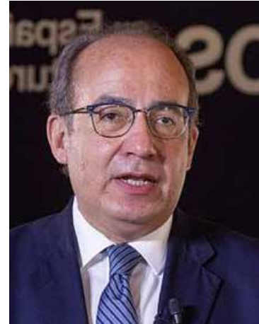
Felipe Calderón Hinojosa