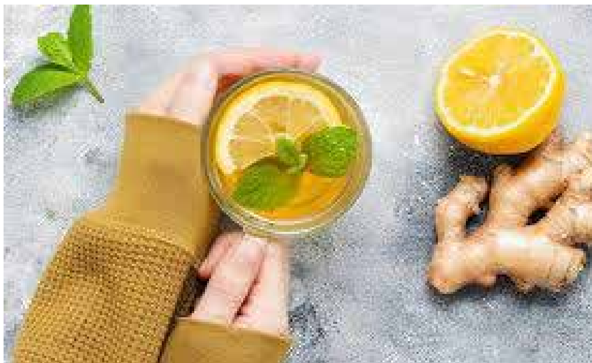
El jengibre se caracteriza por su sabor picante, aroma intenso y múltiples propiedades beneficiosas para la salud.

Es por eso que aquí te damos varios tips sobre cómo usarlo para obtener sus propiedades curativas.