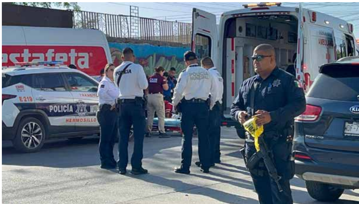
Paramédicos de la Cruz Roja le brindaron atención prehospitalaria en el lugar.

El ataque armado se registró alrededor de las 16:59 horas, en un domicilio ubicado sobre la calle Aconchi entre Guadalupe Victoria y José López Portillo, a donde acudieron autoridades de la Policía Municipal, Policía Estatal de Seguridad Pública (PESP), Cruz Roja y el Centro