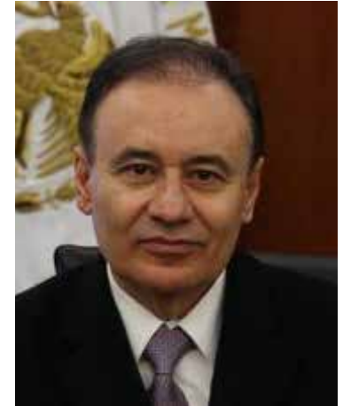
Alfonso Durazo Montaña

Ante una serie de protestas en la capital del estado de Nayarit, esto es en Tepic, por la demolición de un viejo estadio en la zona del centro de esta ciudad, para la construcción de otro, cuando el anterior daba el servicio a la afición local, pues esta entidad no cuenta con equipos profesionales en este deporte. Lo peor de esto a decir de los protestantes, no se ha informado de donde provienen los recursos, el por qué de esta obra en estos momentos innecesaria, cuando la anterior edificación se encontraba en buen estado. Incluso la obra no cuenta con la publicidad de la constructora que lo construye y menos aún en donde tiene su matriz, dicha empresa.