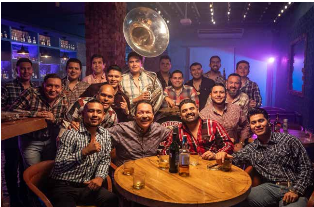
Julio Preciado fue el primer vocalista de 'La Original Banda El Limón', a 60 años de nuevo comparten micrófonos para interpretar 'Traguitos de licor'.