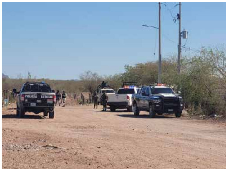
El ataque generó la movilización de elementos de las Policías Estatal, Municipal, Ejército mexicano y Guardia Nacional