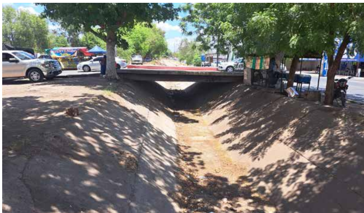
El equipo de Servicios Públicos inició recientemente trabajos de limpieza en el canal ubicado sobre la calle 300, ante la gran acumulación de basura en la zona.

A pesar de que se ha informado a la comunidad sobre las consecuencias de contaminar la vía pública, muchas personas insisten en mantener esta práctica que afecta al entorno y a la salud.