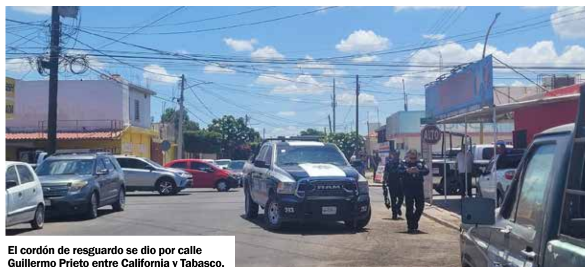
El cordón de resguardo se dio por calle Guillermo Prieto entre California y Tabasco.

hizo el arresto de los dos detenidos y se aseguraron armas largas y cortas, así como indeterminada cantidad de droga.