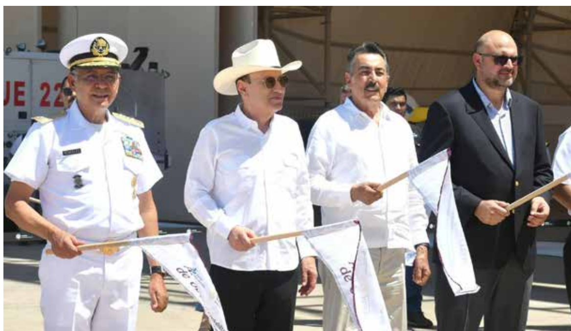
El banderazo estuvo a cargo del Gobernador de Sonora, Alfonso Durazo Montaño y se contó con la presencia del almirante Raymundo Pedro Morales Ángeles, secretario de Marina.

Para 2025, además de los trabajos ya mencionados, en agosto comenzará la rehabilitación de un hangar para dar mantenimiento a aeronaves y, en octubre próximo, empezará la ampliación de la Sala de Última Espera (SUE). Duran-