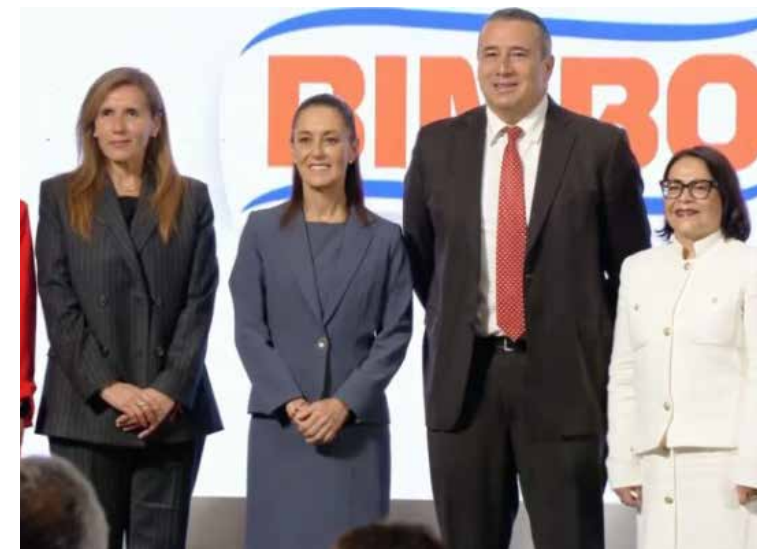
Sheinbaum destacó que esta inversión refleja la confianza que existe en el país por parte de empresarios nacionales y extranjeros.

Detalló que los estados a los que beneficiará principalmente esta inversión son Baja California, Yucatán, Ciudad de México, Nuevo León, Querétaro, Puebla y Estados de México.