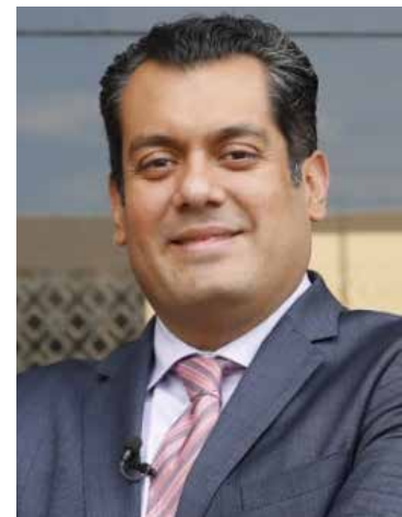
Sergio Gutiérrez Luna

En nuestra colaboración del día de ayer, hicimos el compromiso de hacer una pequeña crónica de las actividades del gobernador sonorense, que efectuó durante la presente semana, compromiso que nace a raíz de que, desde el pasado lunes al día miércoles, visite la capital del estado y ahí me informaron que ninguno de estos días, estuvo en la ciudad de Hermosillo.