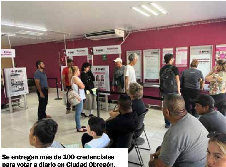
Se entregan más de 100 credenciales para votar a diario en Ciudad Obregón.

cesos electorales, sino que también funciona como la principal forma de identificación oficial en todo el país. Para recoger el documento, los ciudadanos solo necesitan presentarse en el módulo del INE donde realizaron su trámite. No se requiere agendar una cita previa para esta gestión. El horario de atención es de lunes a viernes, de 8:00 a.m. a 3:00 p.m. Las autoridades hacen un llamado a la población para que acudan a recoger su credencial y eviten contratiempos, asegurando así su derecho a la identidad y a la participación cívica.