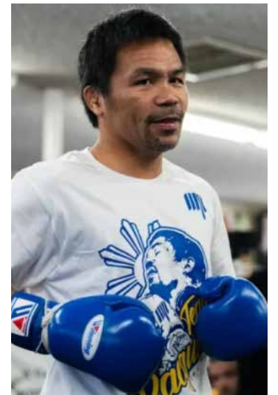
Pac-Man va por el cinturón del Consejo Mundial de Boxeo de peso welter a los 46 años ante Mario Barrios.

el cinturón de la Asociación Mundial de Boxeo (AMB) de las 147 libras. Sin embargo, Mauricio Sulaimán argumentó que el boxeador asiático podría emular a Sugar Ray Leonard, quien regresó al boxeo cinco años después de su retiro.