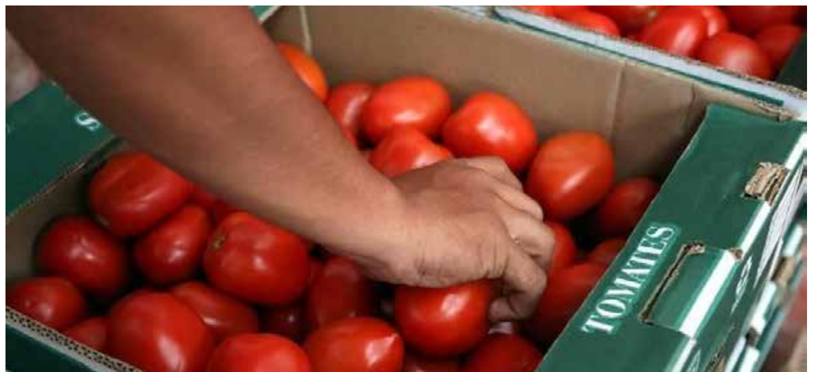
Durante el ciclo se presentaron retos que complicaron la actividad afectando seriamente a los productores.

El líder productor lamentó que estas condiciones llevaron a muchos productores a replantearse si sembrar tomate sigue siendo viable bajo las actuales circunstancias del mercado y el clima, por lo que han migrado a otro cultivo.