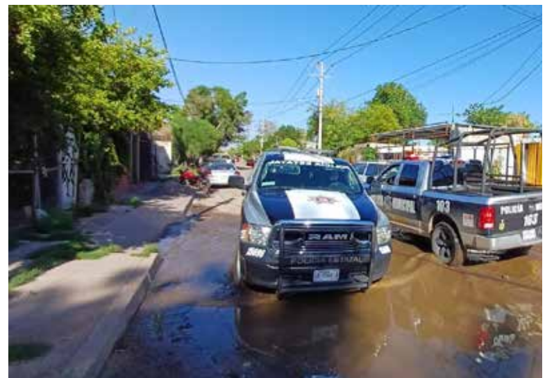
La agresión fue reportada por el bulevar CTM entre Turquesa y Zafiro.