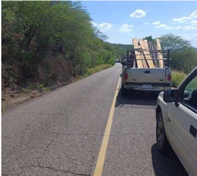
El fatal accidente ocurrió alrededor del mediodía, a la altura del kilómetro 50.