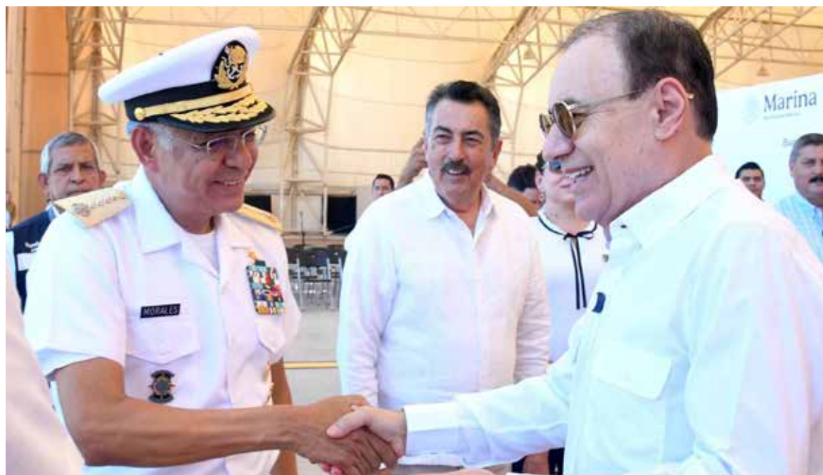
El Gobierno de Sonora y el Grupo Aeroportuario Marina iniciaron obras de ampliación de pista y estacionamiento del Aeropuerto Internacional de Ciudad Obregón.

El presidente municipal de Cajeme, Javier Lamarque Cano, acompañó al gobernador del Estado, Alfonso Durazo Montaña y al secretario de Marina, Raymundo Pedro Morales Ángeles, al banderazo de inicio de