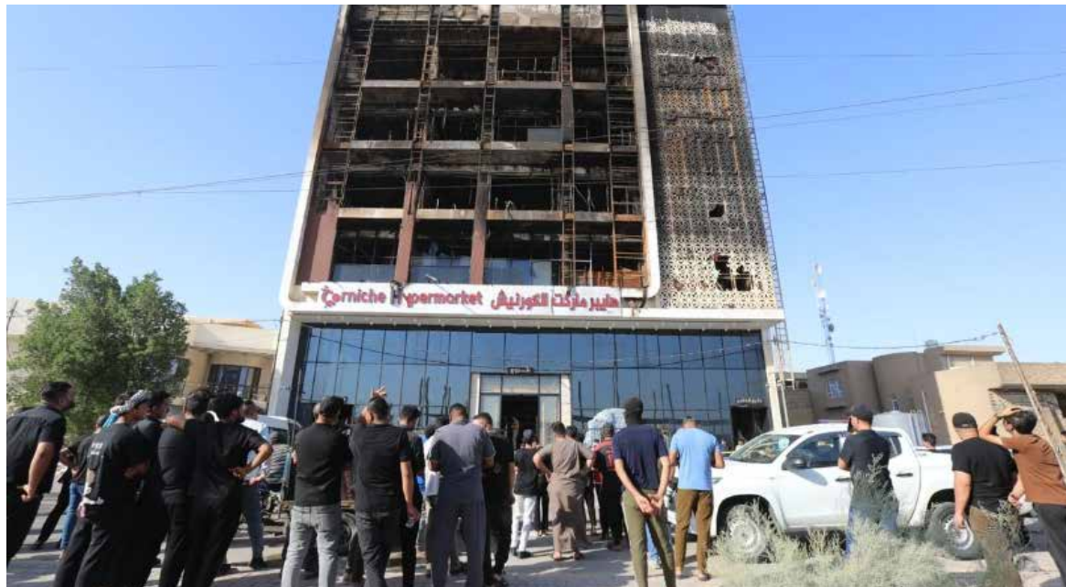
El gobernador provincial, Mohammed al-Mayyeh, declaró tres días de luto.

Los equipos de defensa civil pudieron rescatar a más de 45 personas que quedaron atrapadas cuando el incendio comenzó tarde el miércoles en la ciudad de Kut, en la provincia de Wasit, según el comunicado del Ministerio del Interior. Aún había personas desaparecidas, informó la Agen-