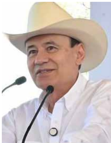
Alfonso Durazo Montaña