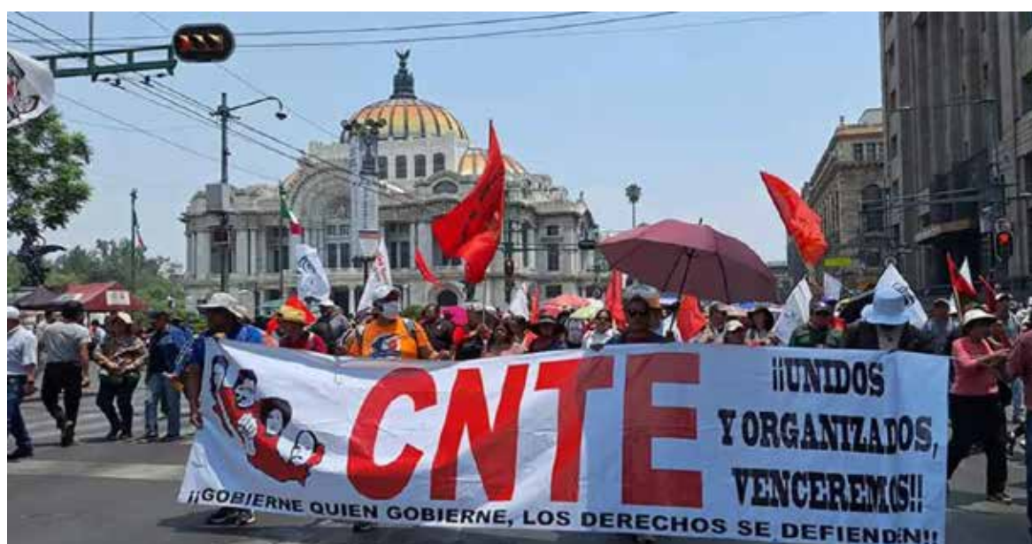
declararon un 'receso' en sus manifestaciones, pero anunciaron que después de las vacaciones de verano podrían retomar sus movilizaciones en la Ciudad de México.

Además, declararon un 'receso' en sus manifestaciones, pero anunciaron que después de las vacaciones de verano podrían retomar sus movilizaciones en la