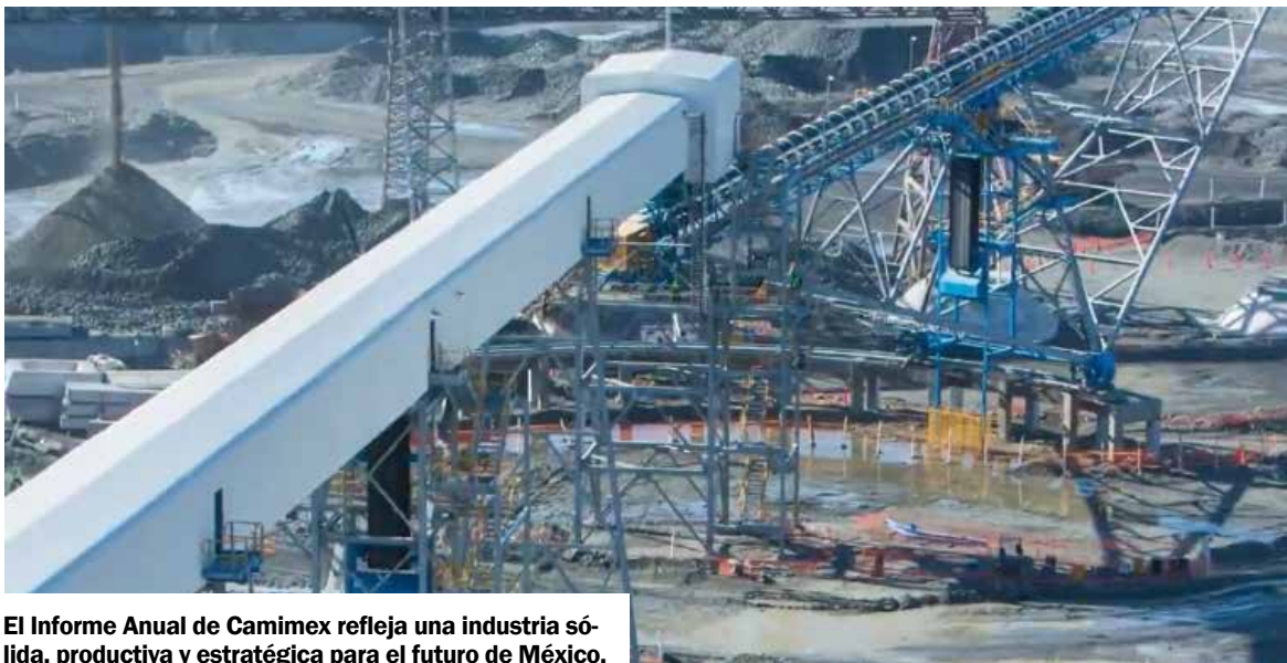
El Informe Anual de Camimex refleja una industria sólida, productiva y estratégica para el futuro de México.