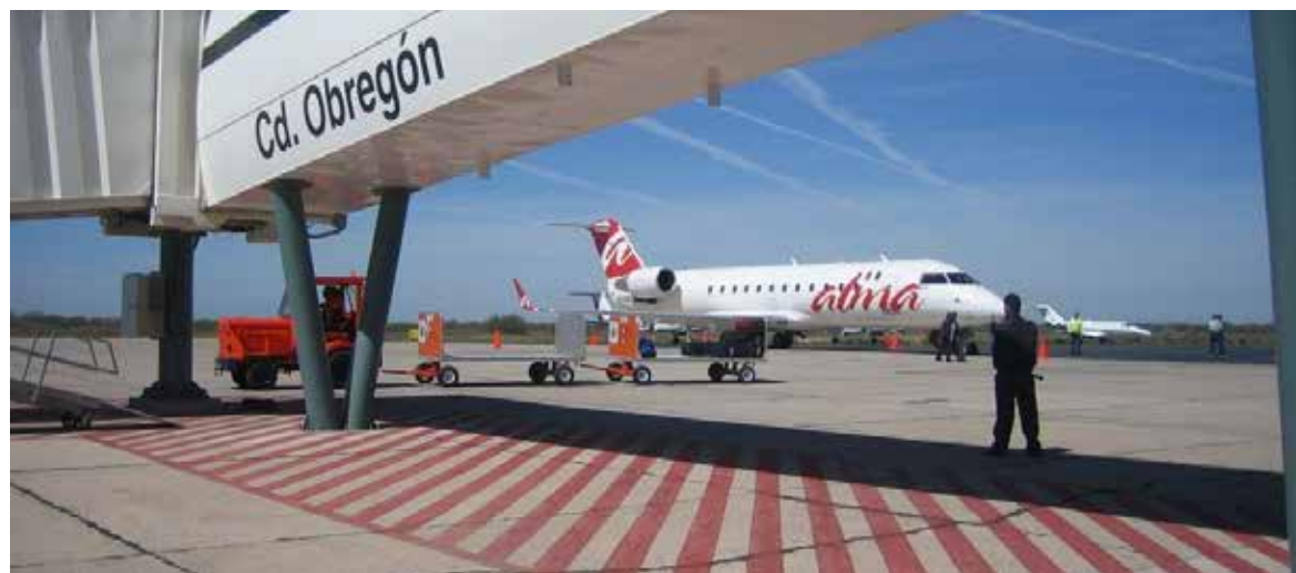
Los trabajos incluyen la ampliación de la pista de aterrizaje, por lo que se contará con la capacidad de recibir aviones más grandes, incluso naves de carga, lo que beneficiará el desarrollo económico de Cajeme.