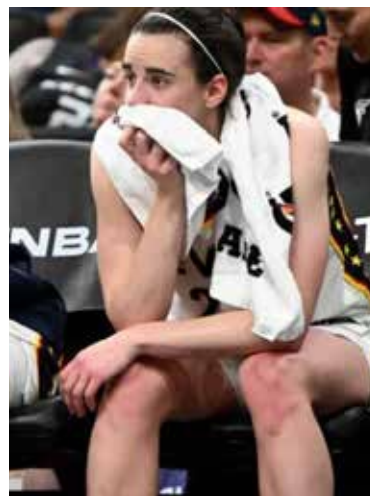
La jugadora del Fever iba a ser la principal estrella del fin de semana en Indianápolis, pero una lesión sufrida en Boston le deja fuera.

La comisionada de la WNBA, Cathy Engelbert, eligió a Brittney Sykes de Washington Mystics y a Brionna Jones de Atlanta Dream