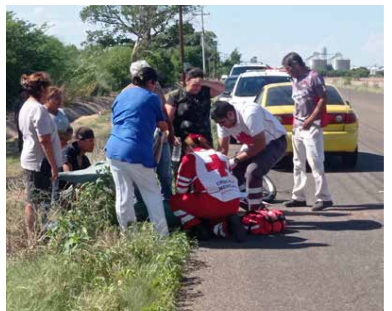
El motociclista se proyectó contra la cinta asfáltica, siendo socorrido por familiares y amigos.

Debido al fuerte impacto, el motociclista se proyectó contra