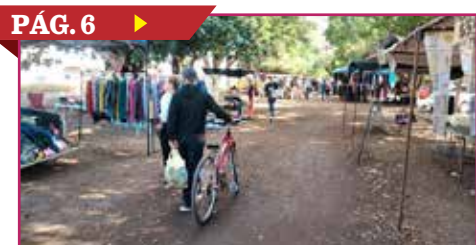
BAJA AFLUENCIA EN EL TIANGUIS DE LA MEXICO