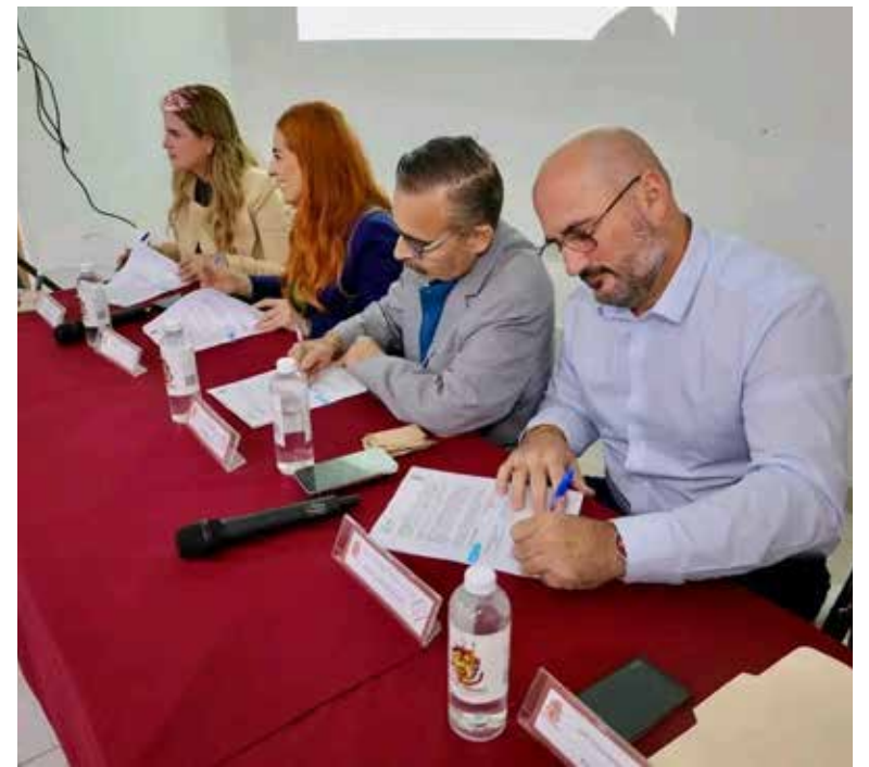
Con el propósito de brindar atención integral a niñas, niños y adolescentes con trastornos neurológicos, la Secretaría de Salud (SSP) informó que el municipio de Puerto Peñasco contará próximamente con una Unidad Especializada en Neurodesarrollo.