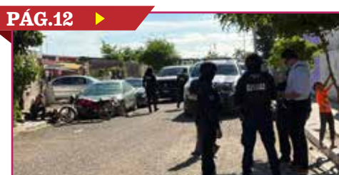
CHOCAN PATRULLAS DE LA MARINA Y PESP