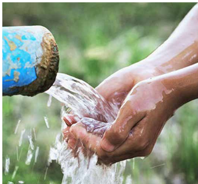
La norma que ha sido calificada por sus críticos como 'el último clavo al ataúd del campo mexicano', ha sufrido cambios cosméticos que no atienden las demandas, han sostenido los agricultores.

Los legisladores han aprobado en lo general y en lo particular, a toda marcha la nueva Ley de Aguas de la presidenta Claudia Sheinbaum. Las múltiples jornadas de protesta que han colapsado carreteras, garitas y puentes fronterizos y aduanas en todo el país, han sido estériles. La norma que ha sido calificada por sus críticos como 'el último clavo al ataúd del campo mexicano', ha sufrido cambios cosméticos que no atienden las demandas, han sostenido los agricultores. El Frente Nacional para el Rescate del Campo, que agrupa varias asociaciones críticas con la reforma, ha reactivado la protesta en varios puntos estratégicos del país y se preparan para recrudecer las movilizaciones al momento de su aprobación en el Senado, a donde se discutirá este mismo jueves. Los agricultores han adelantado la presentación de amparos contra la norma. Mientras, sigue latente el amago de sitiar el Zócalo de Ciudad de México, que recibirá el sábado a la mandataria mexicana y a sus seguidores, para celebrar siete años de la llegada al poder de