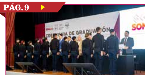
SUMA SSP 171 NUEVOS POLICÍAS