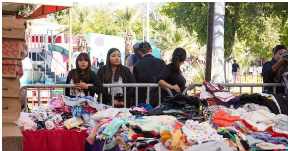
Con el propósito de apoyar la economía de las familias sonorenses durante la temporada decembrina, el Sistema DIF Sonora realizará el Bazar Navideño 2025.

terapias especializadas y capacitación para familias y profesionales. Con ello, la Secretaría de Salud reitera su compromiso de acercar servicios de alta calidad que impulsen el desarrollo y bienestar de la niñez peñasquense.