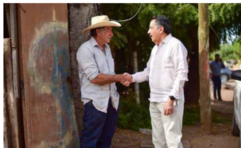
La cifra total se logra tras gestiones complementarias con instancias estatales y federales.

El presidente municipal, explicó que esta cifra contempla recursos adicionales gestionados para obras públicas que se realizarán en coordinación con el Gobierno del Estado.