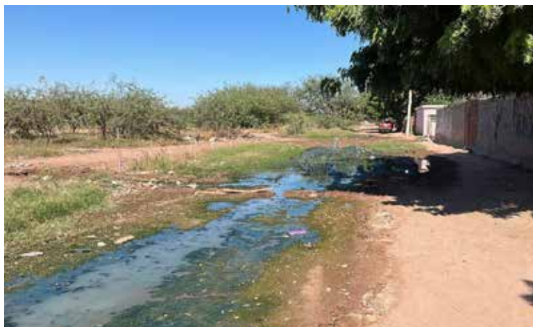
Campañas de recolección de objetos y limpieza continúan en varias colonias para reducir criaderos.

Explicó, que este mosquito se desarrolla únicamente en agua limpia y estancada, como la que se acumula en recipientes, tapas, botes, llantas o cualquier objeto