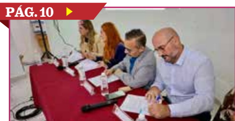
HABRÁ UNIDAD EN NEURODESARROLLO