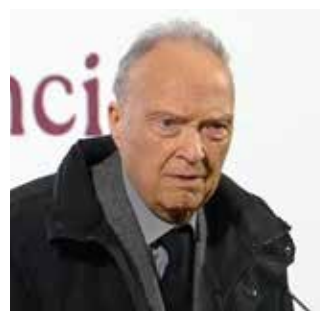
Alejandro Gertz Manero