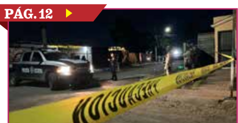
EJECUTAN A HOMBRE EN VILLA DEL PALMAR