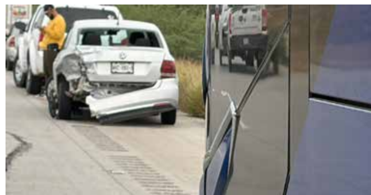
Un accidente donde participaron cuatro vehículos, entre ellos un autobús de pasajeros, se registró sobre la carretera federal México 15, a la altura del kilómetro 180.

El Servicio Médico Forense (Semefo) los trasladó a la morgue para la necropsia correspondiente de quienes se convirtieron en los ejecutados tres y cuatro del mes de diciembre.