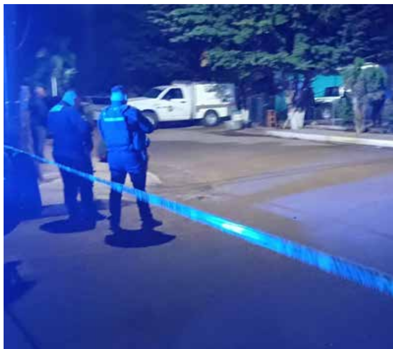
Una pareja fue privada de la vida con proyectiles de arma de fuego por desconocidos.

Se presume que al ser agredidos por sujetos no identificados corrió hacia la parte posterior