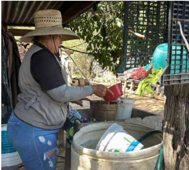
La Secretaría de Salud hace un llamado a la población a reforzar el cuidado del hogar para prevenir enfermedades como la rickettsiosis y el dengue.

a mantener sus patios limpios y libres de objetos que puedan servir como refugio de garrapatas. Esto incluye sacar muebles viejos, cortar el zacate, eliminar maleza, evitar apilar madera u objetos y considerar la fumigación, incluso cuando los patios sean de tierra. Un entorno ordenado es clave para reducir la presencia de estos animales.