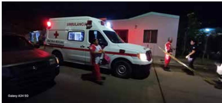
Sin vida y tendido en la vía pública quedó un hombre de edad avanzada, tras ser agredido con proyectiles de arma de fuego, en Urbi Villa del Rey.

como parte de la cadena de custodia delimitaron el área con cintas restrictivas.