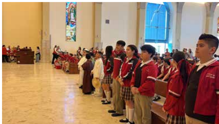
Colegios y parroquias organizan recorridos diarios, mientras que el 11 de diciembre se realizará la gran procesión.

En el lugar recibieron la bendición por parte del padre y celebraron una misa para pedir por la niñez, así como la edu-