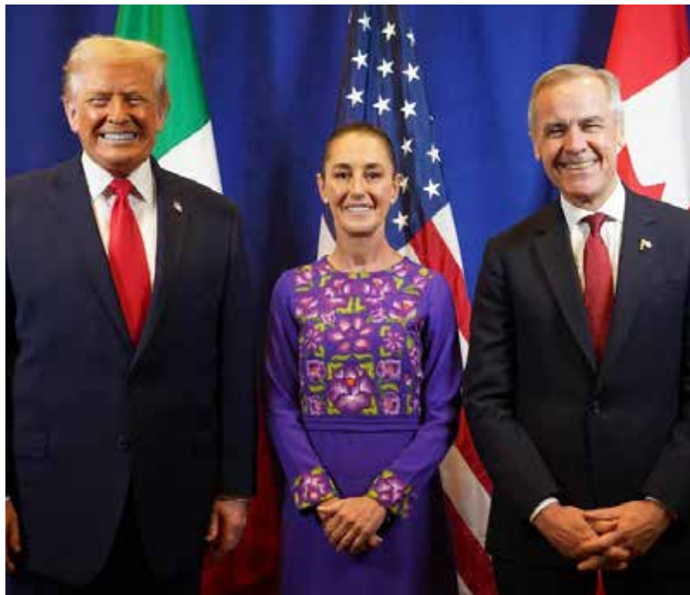
La presidenta de México, Claudia Sheinbaum, declaró que la reunión con el presidente de Estados Unidos, Donald Trump, en Washington, la primera que mantienen los dos, fue 'muy bien' y que acordaron 'seguir trabajando juntos' en temas comerciales.

La mandataria publicó en la red social X que el encuentro con Trump y Carney