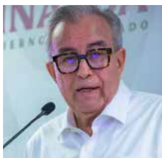
Rubén Rocha Moya