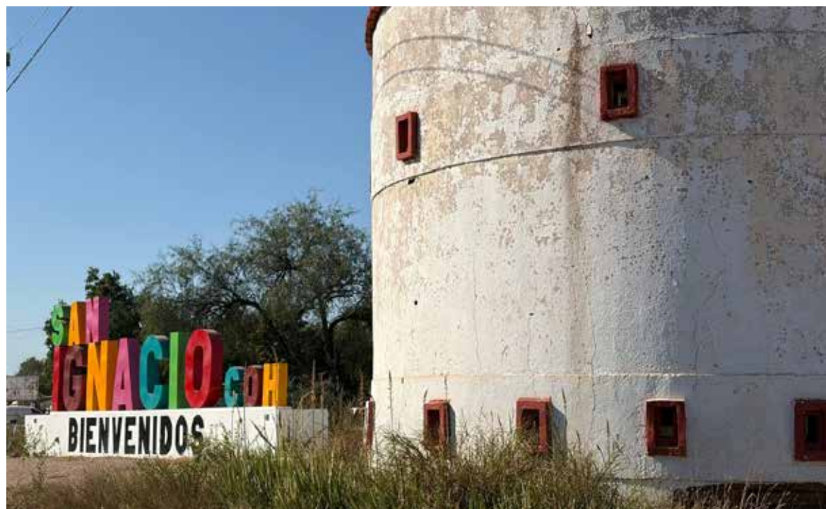
La música, el arte y la participación ciudadana podrían convertirse en aliados clave para devolverle vida al antiguo fortín de San Ignacio.