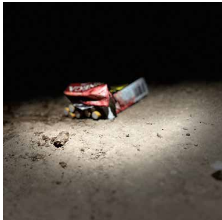
El joven se encontraba a las afueras del domicilio cuando fue atacado a balazos, recibiendo múltiples impactos.

Paramédicos de la Cruz Roja acudieron al sitio y, tras valorarlo, confirmaron que ya no contaba con signos vitales, por lo que fue declarado muerto en el lugar.