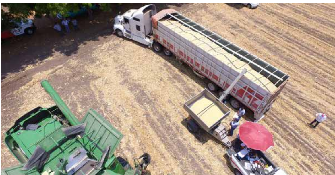
La producción rural disminuyó debido a sequías, altos costos de insumos y mercados inestables.

Asimismo, especialistas señalan que la falta de condiciones climáticas favorables y de apoyos suficientes incidió en una menor superficie sembrada y en menores rendimientos.