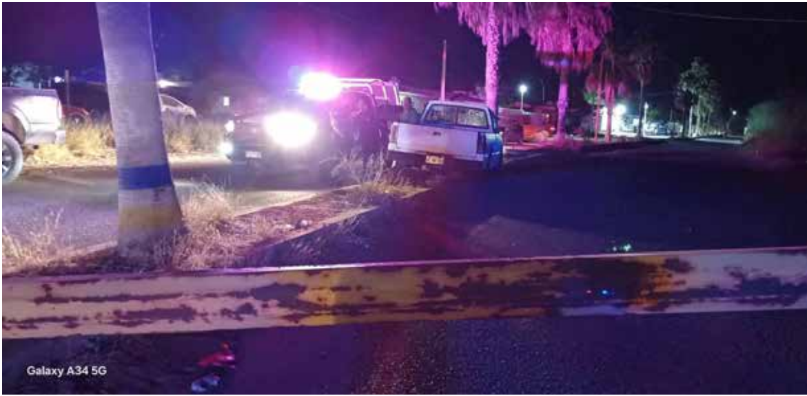
A pesar de que las atenciones por accidentes se han reducido en un 30 por ciento durante la primera quincena de diciembre, en comparación con el año pasado, estos han sido más fuertes.

A pesar de que las atenciones por accidentes se han reducido en un 30 por ciento durante la primera quincena de diciembre, en comparación con el año pasado, estos han sido más fuertes, indicó Alejandro Borbón. El comandante de Cruz Roja señaló que, aunque son menos los casos contabilizados, se ha detectado que los percances son más aparatosos e incluso con mayor número de vehículos involucra-