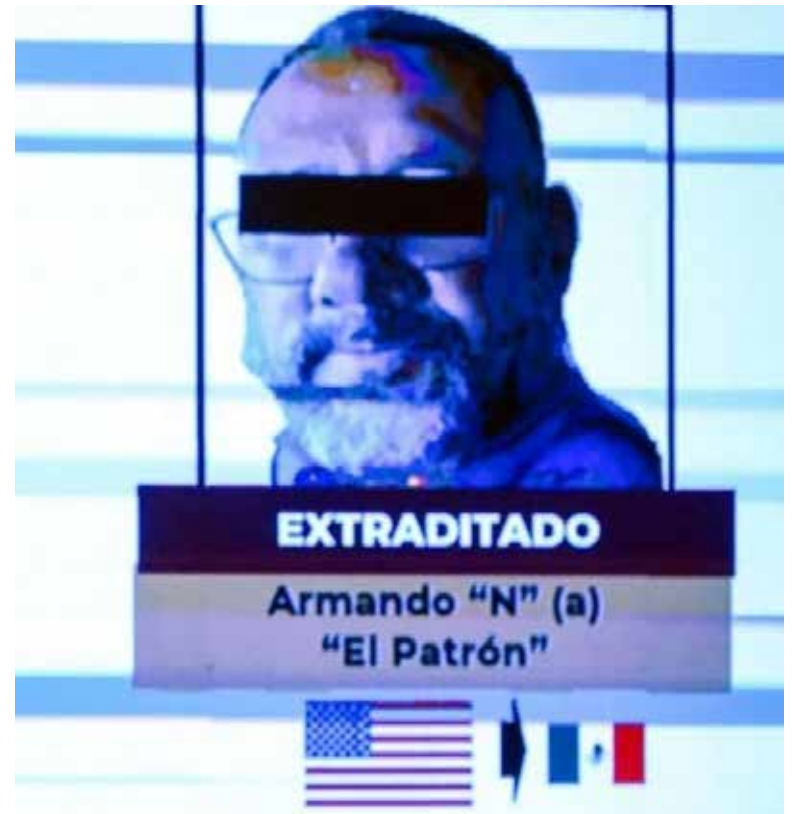
El sentenciado reconoció haber encabezado la célula criminal que ejecutó el ataque en 2022 por órdenes del CJNG.

Gracias a que su vehículo estaba blindado -y a que los agresores lo ignoraban-, fracasó el ataque más importante a un periodista mexicano de los últimos cuatro décadas. Luego de esos tres años, Gómez Leyva hizo un balance de hechos, sentimientos y reflexiones en la forma de un libro (“No me pudiste matar”, Planeta) que pone una mirada ácida sobre López Obrador , al que no menciona nunca por su nombre, otorgándole apenas el pronombre de “él”.