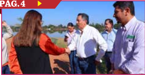
SUPERVISA LAMARQUE TRABAJOS EN OBRAS