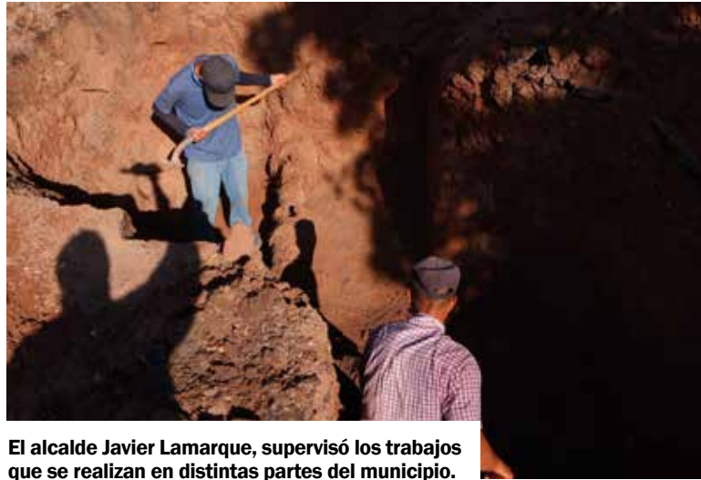
El alcalde Javier Lamarque, supervisó los trabajos que se realizan en distintas partes del municipio.

Durante este martes, Javier Lamarque, supervisó los trabajos que se realizan en el bulevar San Antonio, en su cruce con bulevar Casanova, del fraccionamiento San Juan Capistrano, donde informó que con anterioridad sólo existía un carril de circulación y terracería, en este punto se construyó un nuevo eje vial de más de 800 metros de longitud con pavimentación completa, asimismo, en el carril norte se llevan a cabo acciones de recarpe-