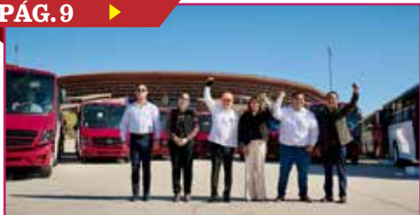
FORTALECE DURAZO MOVILIDAD URBANA