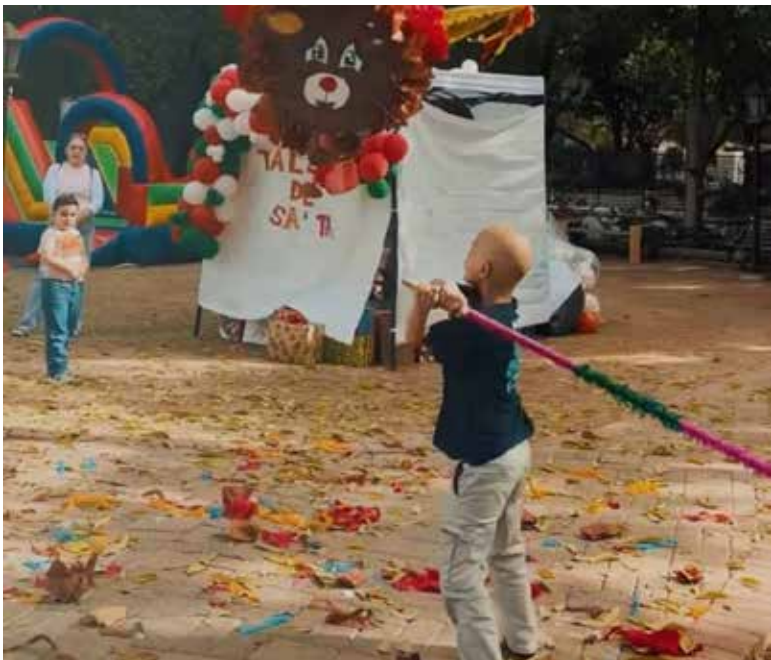
Niños con cáncer disfrutaron de su gran posada navideña, organizada por la Fundación Amar y Servir con el apoyo de la comunidad.

Entre las actividades de esta celebración decembrina hubo piñatas, juegos, una cabina foto-