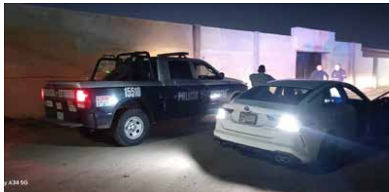
Una mujer que supuestamente se hallaba atada de manos y el rostro cubierto con tubo de tela elástica generó la movilización de cuerpos policiacos.

Igualmente han aparecido varias personas maniatadas sin signos vitales, debido a que hay varios lotes baldíos invadidos de maleza.