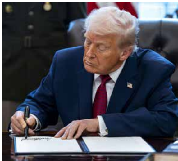
El presidente de EU firmó una orden ejecutiva que considera la fabricación, distribución y venta del opioide

El fentanilo ilícito se asemeja más a un arma química que a un narcótico”, declaró Trump al