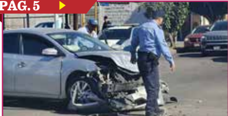
CADA VEZ MÁS FUERTES ACCIDENTES DE TRÁNSITO