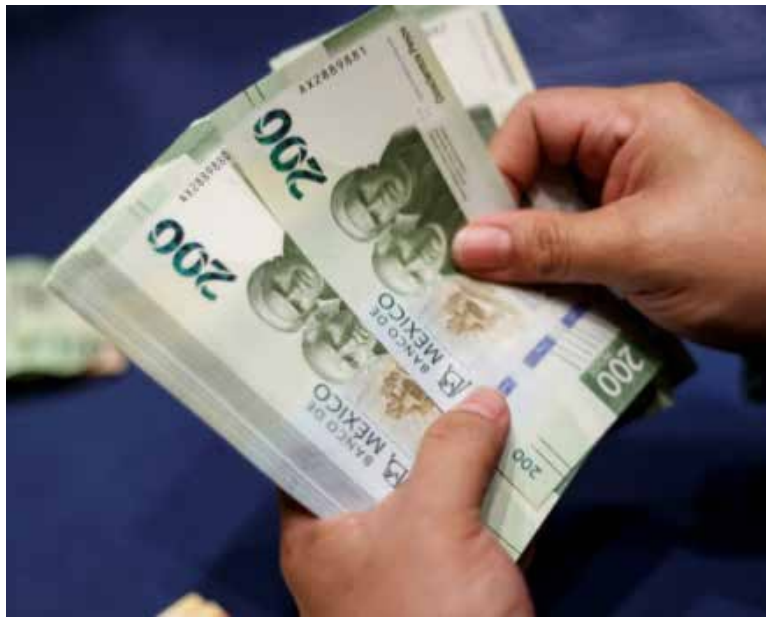
El organismo regional advirtió que el entorno internacional y la debilidad del mercado interno limitarán el desempeño en 2025.

En el "Balance Preliminar de las Economías de América Latina y el Caribe 2025", que es el último informe del año de la Cepal, el cual es presentado esta mañana por José Manuel Salazar-Xirinachs, secretario ejecutivo del organismo, destaca que en el 2026, la economía mexicana crecerá 1.3