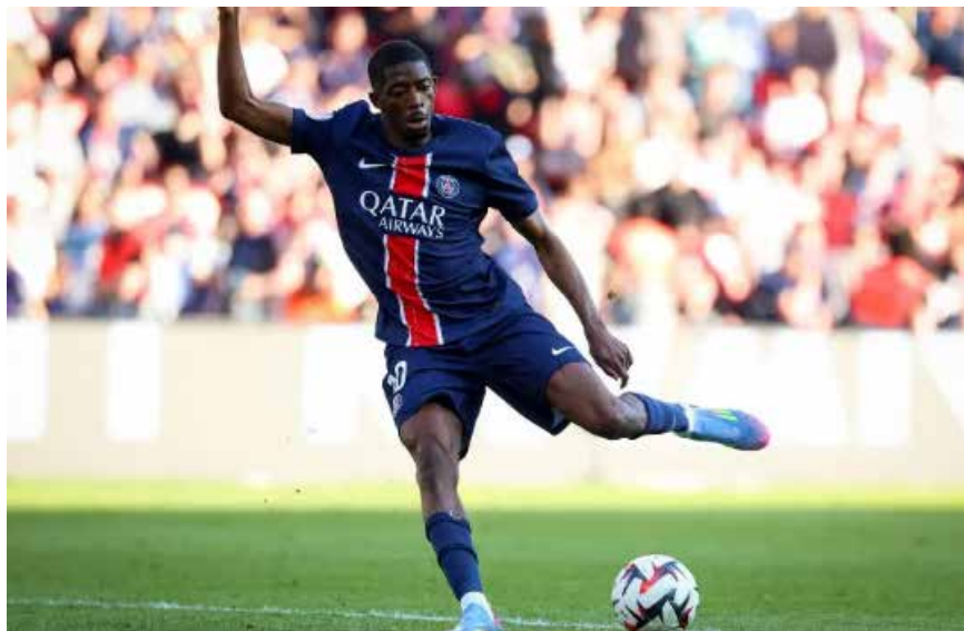
La gala se celebró en Doha, en vísperas de la final de la Copa Intercontinental que disputará el equipo parisino.

El galo, de 28 años, brilló con luz propia y fue determinante en la gran temporada pasada cuajada por el PSG,