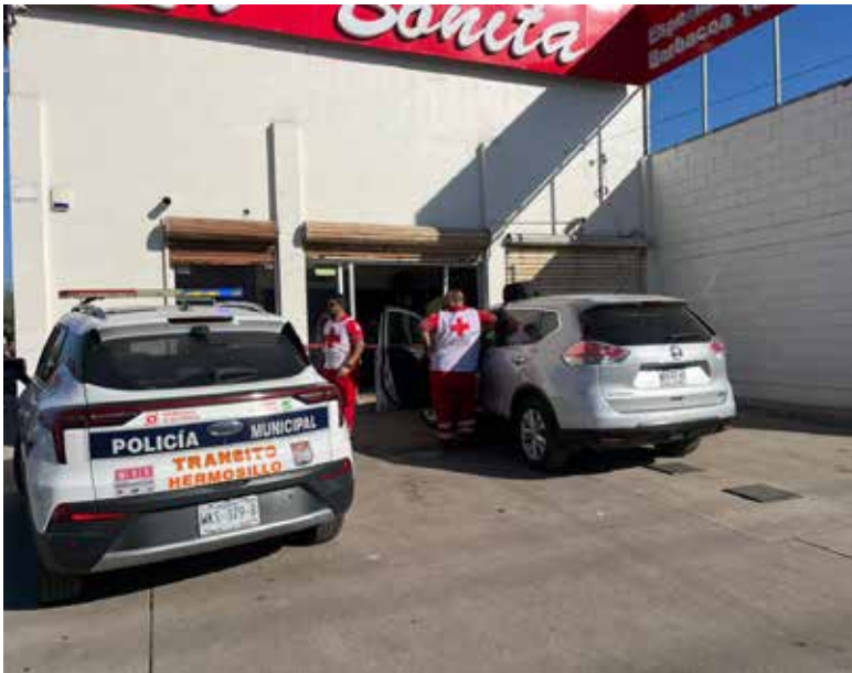
Bomberos y personal de tránsito acudieron al lugar para asegurar la zona y atender la emergencia.

contraba sin clientes al momento del incidente. Los hechos se registraron alrededor de las 09:15 horas, en la es-