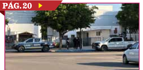
ATIENDEN AUTORIDADES AMENAZA DE TIROTEO