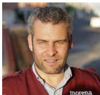
Alfredo Ramírez Bedolla