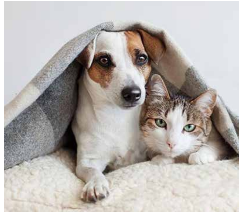
Salvando Lomitos y Michis Hermosillo supera los 100 rescates y consolida su labor en defensa animal.

"Cada rescate representa un reto constante, no solo por el estado en el que llegan muchos animales, sino también por los gastos médicos, de alimentación y