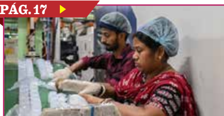
BUSCA INDIA ACUERDO COMERCIAL CON MÉXICO