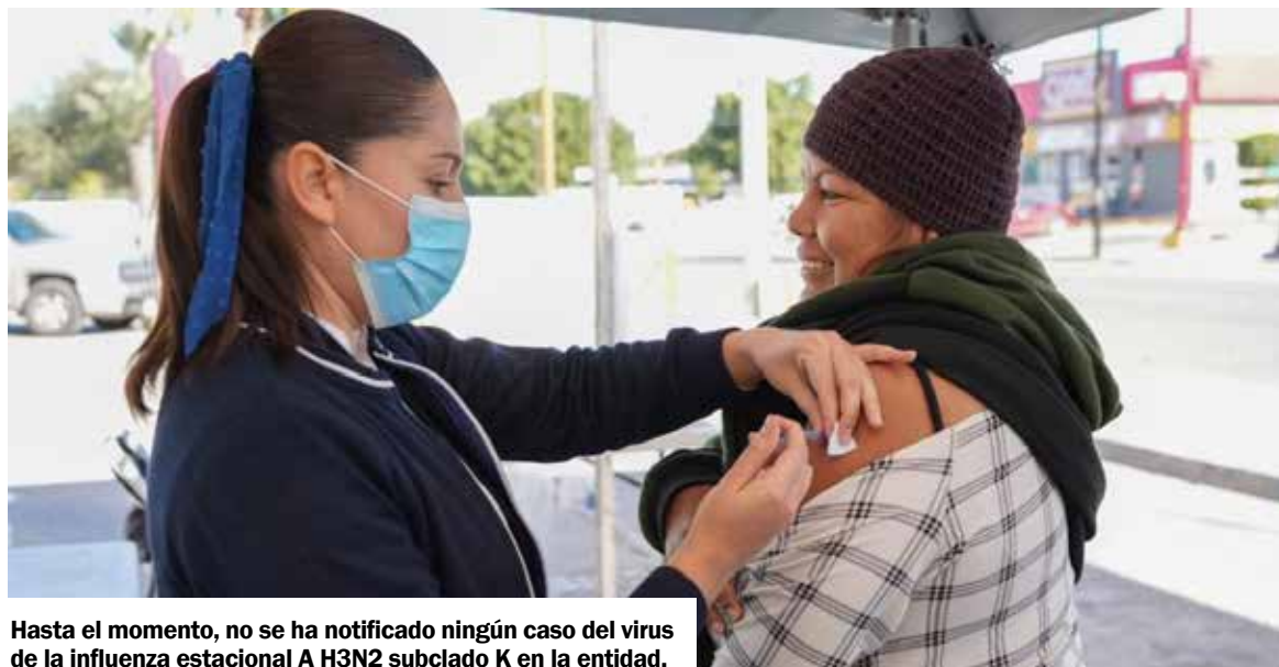
Hasta el momento, no se ha notificado ningún caso del virus de la influenza estacional A H3N2 subclado K en la entidad.

Las autoridades sanitarias del estado mantienen vigilancia epidemiológica permanente para la