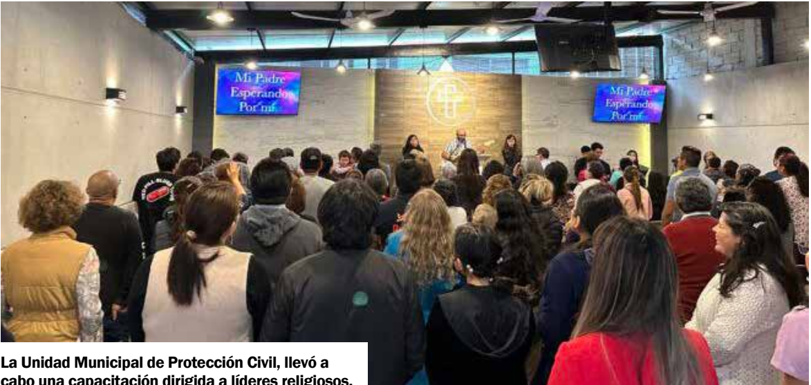
La Unidad Municipal de Protección Civil, llevó a cabo una capacitación dirigida a líderes religiosos.