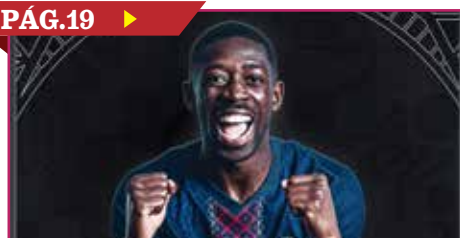
DEMBÉLÉ GANA EL PREMIO THE BEST