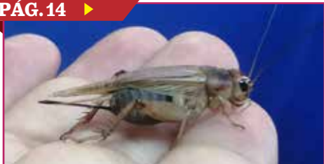
INCREMENTA PRESENCIA DE CHAPULINES Y GRILLOS