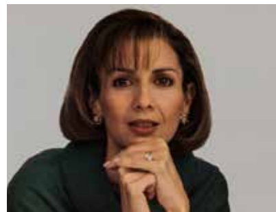
Diana Laura Riojas