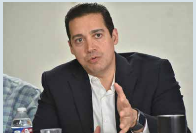
Aranceles a importaciones sin TLC podrían golpear comercio sonorense: Sonora Global.

sus productos resulta contraproducente para la economía estatal. Advertimos que esta