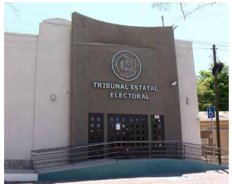
Tribunal Electoral de Sonora prevé casi 70 MDP para su operación en 2026.

resto de los recursos se canalizará a gastos operativos indispensables, como mantenimiento de inmuebles, rentas, servicios básicos, traslados y notificaciones ofi-