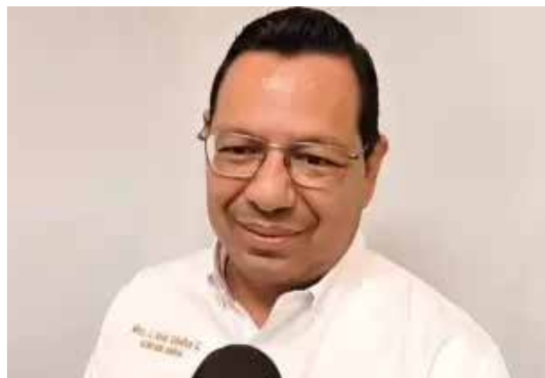
Medicamentos y vivienda, las dos prioridades del SNTE en Sonora.

suministro de medicamentos, así como las condiciones del próximo proceso de licitación, con la