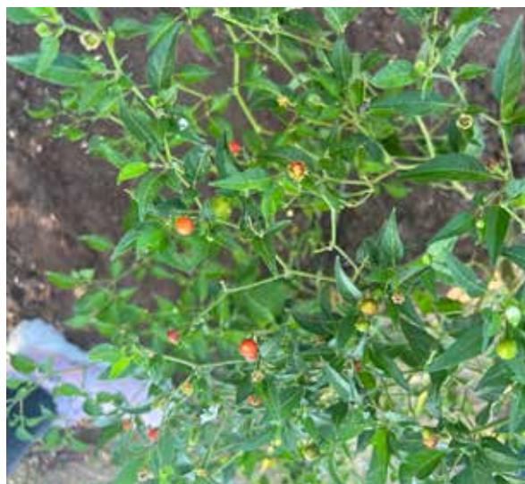
La demanda de mano de obra para el corte del chiltepín durante la temporada decembrina beneficia a comunidades rurales.

Este picante se ha establecido en diversos puntos del valle, donde su adaptación a las condiciones climáticas ha permitido