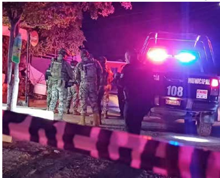
Vecinos reportaron detonaciones que alertaron a autoridades, quienes aseguraron evidencias balísticas en el lugar.

Al arribar elementos policíacos e inspeccionar el inmueble loca-