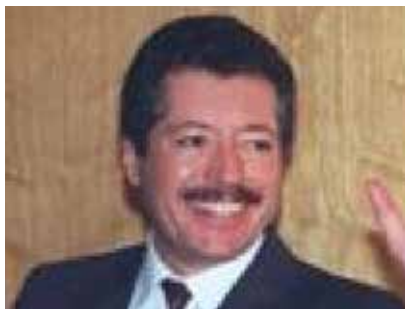
Luis Donald Colosio Murrieta