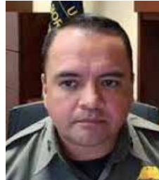
Roberto B. Domínguez

El anuncio del Gobierno de los Estados Unidos de América sobre apoyos de hasta mil dólares para quienes opten por la deportación voluntaria, expuesto por Roberto B. Domínguez, subjefe interino en la sede central de la Patrulla Fronteriza, refleja una estrategia que combina incentivos económicos con una política de control migratorio cada vez más estricta. En el discurso oficial, la medida busca ordenar los flujos migratorios y reducir la presión sobre los sistemas de detección mediante la entrega voluntaria de personas en situación irregular, especialmente ante los intensos operativos desplegados en todos los estados. Sin embargo, más allá del enfoque administrativo, esta política abre un debate profundo sobre la condición humana de la migración. Para miles de personas, mil dólares difícilmente compensan la pérdida de empleo, redes comunitarias y proyectos de vida contruidos en Estados Unidos, ni resuelven las causas estructurales que los obligaron a migrar. El incentivo económico, en este contexto,