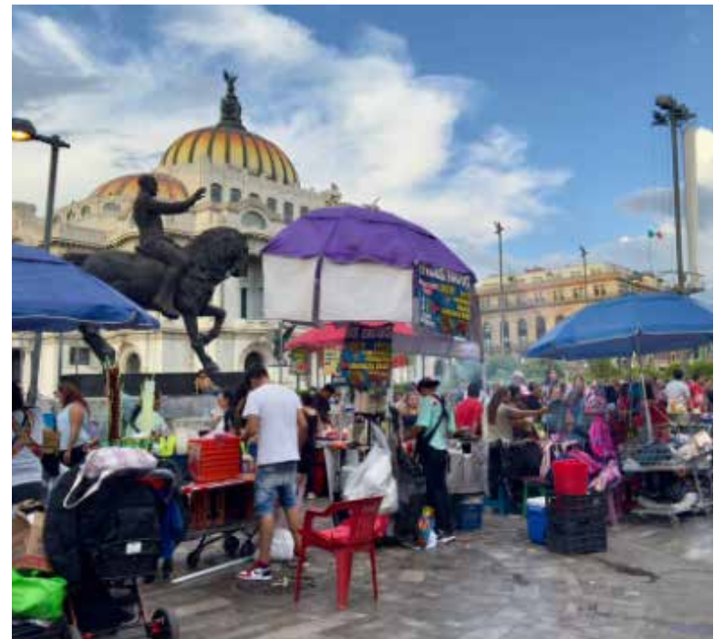
En 2024, más de una cuarta parte del producto interno bruto se generó fuera de la formalidad laboral, según datos del Inegi.

Por otra parte, el sector agropecuario disminuyó de 11.6 a 11.1 por ciento; industrias manufactureras, de 13.5 a 13 por ciento; y comercio al por mayor, de 7.1 a 6.8 por ciento.