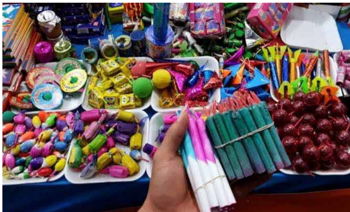
Prohíben totalmente la venta y uso de pirotecnia en Hermosillo: llaman a denunciar al 911.