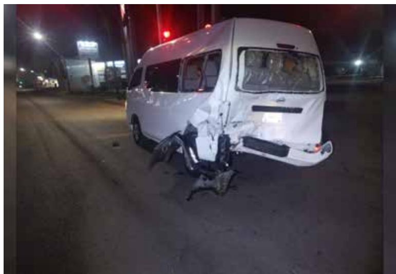
La colisión fue causada por un impacto trasero de un Nissan Sentra contra una Urvan, que se encontraba detenida correctamente.