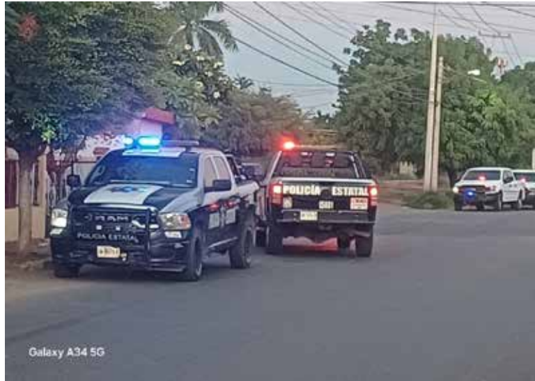
Sujetos no identificados intentaron privar de la vida a un viandante, luego de lesionarlo a tiros en la colonia Oscar Russo Vogel.

Como medida de seguridad personal de la benemérita institución fue custodiado por elementos policiacos.