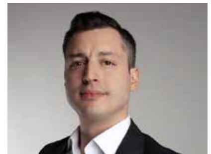
Luis Donald Colosio Riojas