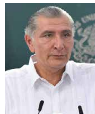
Adán Augusto López Hernández

La Confederación Autónoma de Trabajadores y Empleados de México (CATEM) en Sonora fue reprendida públicamente desde Nogales hasta la Ciudad de México.