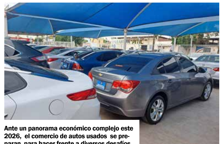
Ante un panorama económico complejo este 2026, el comercio de autos usados se preparan para hacer frente a diversos desafíos.

A este escenario se suma la presencia cada vez más fuerte