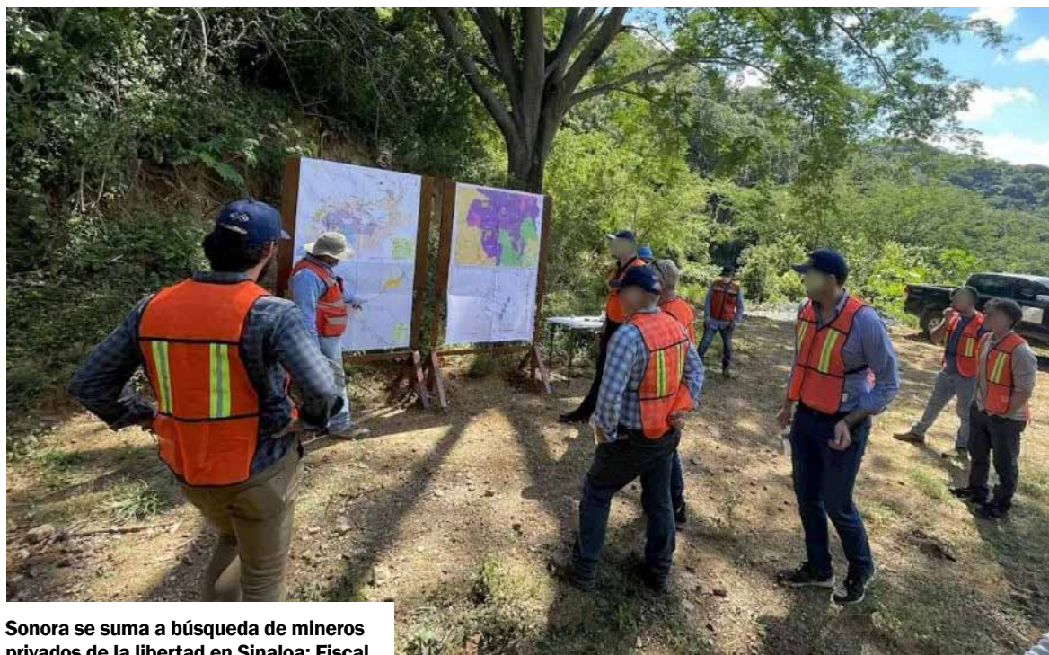
Sonora se suma a búsqueda de mineros privados de la libertad en Sinaloa: Fiscal.