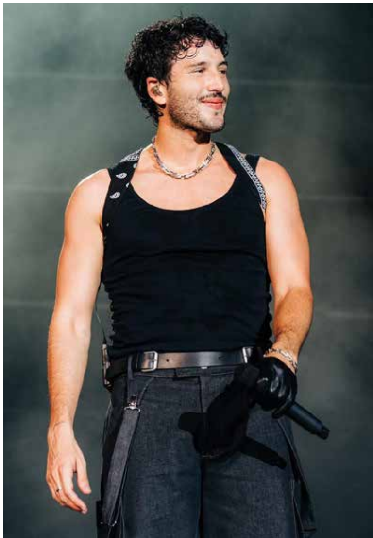
Sebastián Yatra regresa a México en una etapa más madura, enfocándose en la felicidad y la gratitud.

Para el intérprete de 'Traicionera' y 'Tacones rojos', la vida es un milagro cotidiano que depende totalmente de la perspectiva con la que se mire, su filosofía actual se centra en encontrar lo extraordinario en lo ordinario y en vivir con honestidad radical, especialmente en sus relaciones y salud mental.