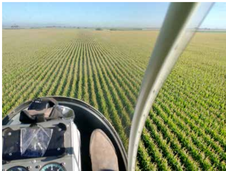
Los organizadores informaron que el evento podrá seguirse mediante transmisión en Facebook.

De acuerdo con la convocatoria difundida por la Pastoral de la Comunicación, el recorrido iniciará a las 10:00 de la mañana, cuando la aeronave sobrevuele las zonas agrícolas llevando al Santísimo para implorar prosperidad, lluvias oportunas y buenas cosechas para los productores del sur de Sonora.