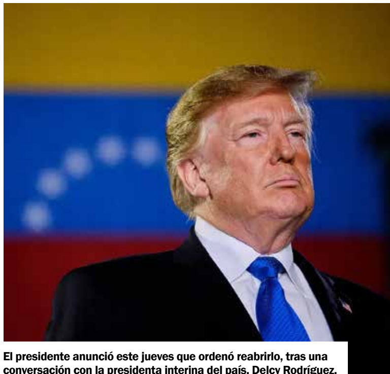
El presidente anunció este jueves que ordenó reabrirlo, tras una conversación con la presidenta interina del país, Delcy Rodríguez.

Las aerolíneas comerciales interrumpieron prácticamente todos los vuelos a Caracas tras una advertencia el pasado 21 de noviembre de la Administración Federal de Aviación (FAA), preludio del