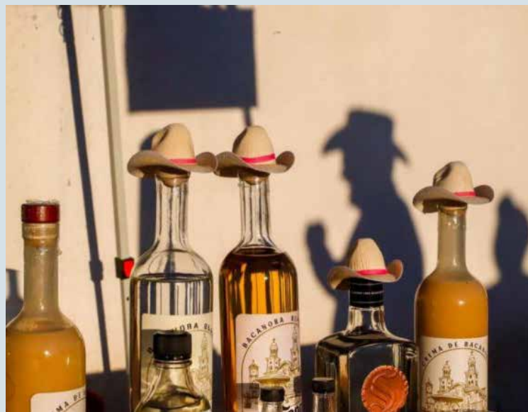
Fiesta en Sonora con el Bacanora celebrará su primera edición en Hermosillo.

“El evento contará con la participación de aproximadamente 20 marcas de bacanora, además de una amplia oferta de actividades culturales, gas-