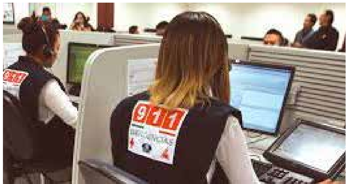
Un reporte falso impide atender reportes ciudadanos reales.

ción de Llamadas de Emergencia, explicó que para contrarrestar este comportamiento, dijo que se trabaja de forma permanente para impulsar la cultura del uso adecuado del número para reportar emergencias reales, haciendo