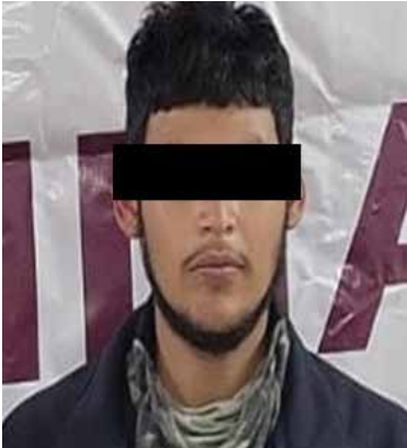
Fueron detenidos Sara “N” y Juan “N”, de 22 y 18 años de edad, durante acciones operativas en la colonia Las Misiones.

nicipio, incautaron un arma de fuego con cargador y cartuchos a Sara “N” y Juan “N”, de 22 y 18