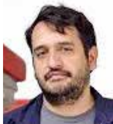
Andrés Manuel López

El anuncio del pago parcial de la deuda fiscal de Grupo Salinas, encabezado por Ricardo Salinas Pliego, abre más preguntas que certezas en el debate público sobre justicia tributaria y equidad fiscal. Si bien el Servicio de Administración Tributaria confirmó el ingreso de más de 10 mil 400 millones de pesos a la Tesorería de la Federación, el esquema de liquidación del resto —22 mil millones en 18 pagos— contrasta con el discurso del propio conglomerado, que asegura no deber ya “nada al Gobierno, por ningún concepto”. Esta diferencia de versiones revela la complejidad de un litigio que durante años simbolizó la tensión entre el poder económico y la autoridad fiscal. El pago, sin duda, representa un avance para las finanzas públicas y un mensaje de que el Estado puede cobrar adeudos históricos; sin embargo, la negociación en “abonos chiquitos” también alimenta la percepción de un trato flexible reservado a grandes contribuyentes, distante de la realidad que enfrentan pequeños empresarios y ciudadanos comunes. Más allá de los montos, el caso Salinas Pliego se convierte en un referente político y social: o bien marca un precedente de cumplimiento efectivo, o refuerza la idea de que en México la ley fiscal sigue aplicándose con distinto rasero según el tamaño del contribuyente.