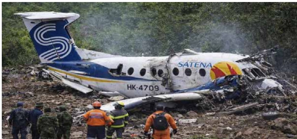
Una comisión de la Aeronáutica Civil iniciará la investigación de rigor para establecer las causas del siniestro, dijo el organismo rector de la aviación civil en el país sudamericano.

Imágenes difundidas por medios locales mostraron el avión accidentado, completamente