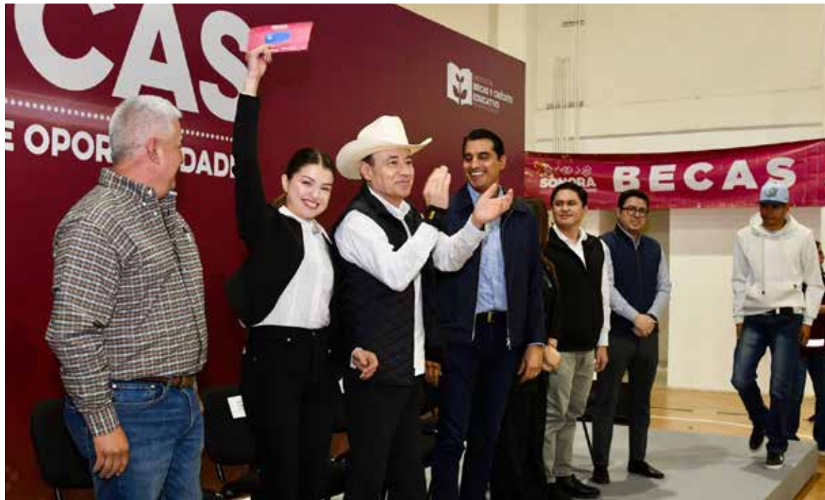
El gobernador Alfonso Durazo Montaño anunció el arranque del registro para la Beca Sonora de Oportunidades, dirigida a estudiantes de universidades públicas, correspondiente al periodo 2026-1, fortaleciendo el acceso a la educación superior.

HERMOSILLO. Para dar continuidad al programa de becas más grande de la historia de Sonora y ampliar las oportunidades para todos los jóvenes, el gobernador Alfonso Durazo Montaño anunció el arranque del registro para la Beca Sonora de Oportunidades, dirigida a estudiantes de universidades públicas, correspondiente al pe-