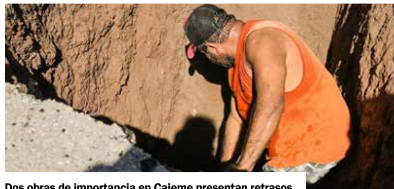
Dos obras de importancia en Cajeme presentan retrasos.

para cerrar ventas debido al presupuesto limitado de las familias.