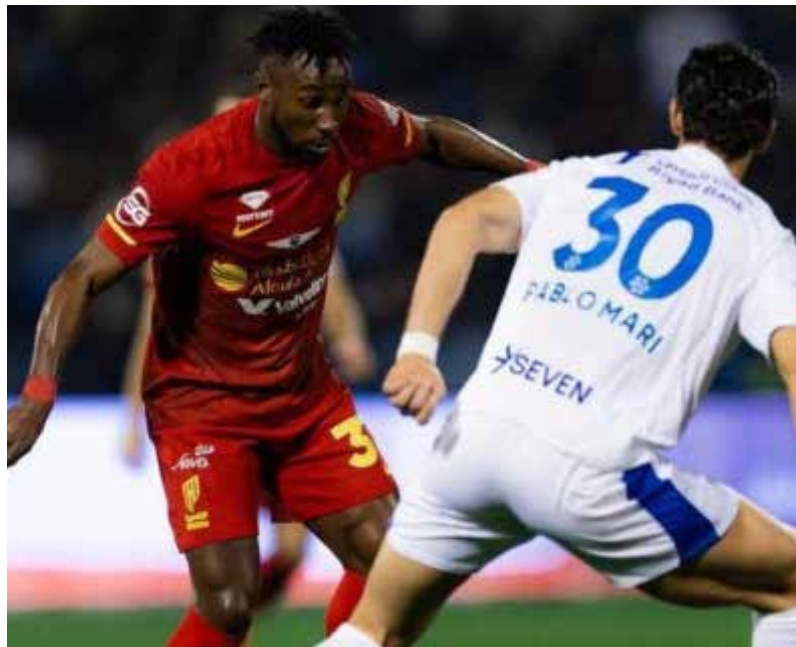
El delantero mexicano sigue sumando goles en el fútbol saudí.