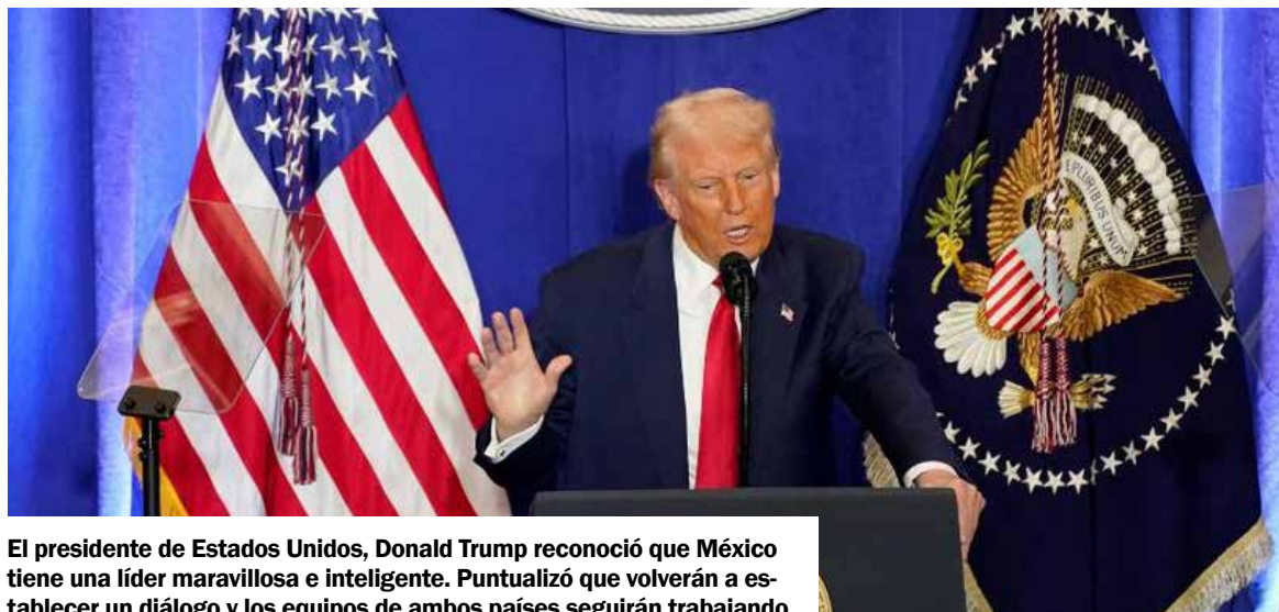
El presidente de Estados Unidos, Donald Trump reconoció que México tiene una líder maravillosa e inteligente. Puntualizó que volverán a establecer un diálogo y los equipos de ambos países seguirán trabajando.

ciones se reunieron en Washington. La presidenta Sheinbaum y el presidente Trump coincidieron en que el entendimiento sigue en progreso.