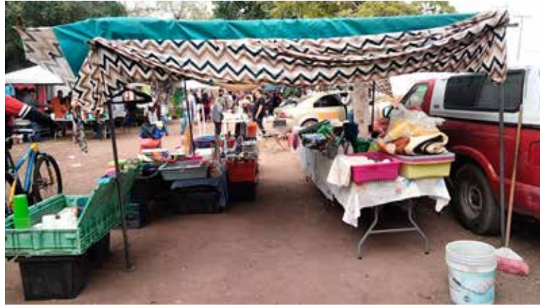
Lo que debería ser una jornada de intensa actividad en el tradicional tianguis de los jueves de la colonia México, se observó un escenario muy pésimo para los comerciantes locales.

A pesar del flujo constante de personas, las ventas han experimentado una baja considerable.