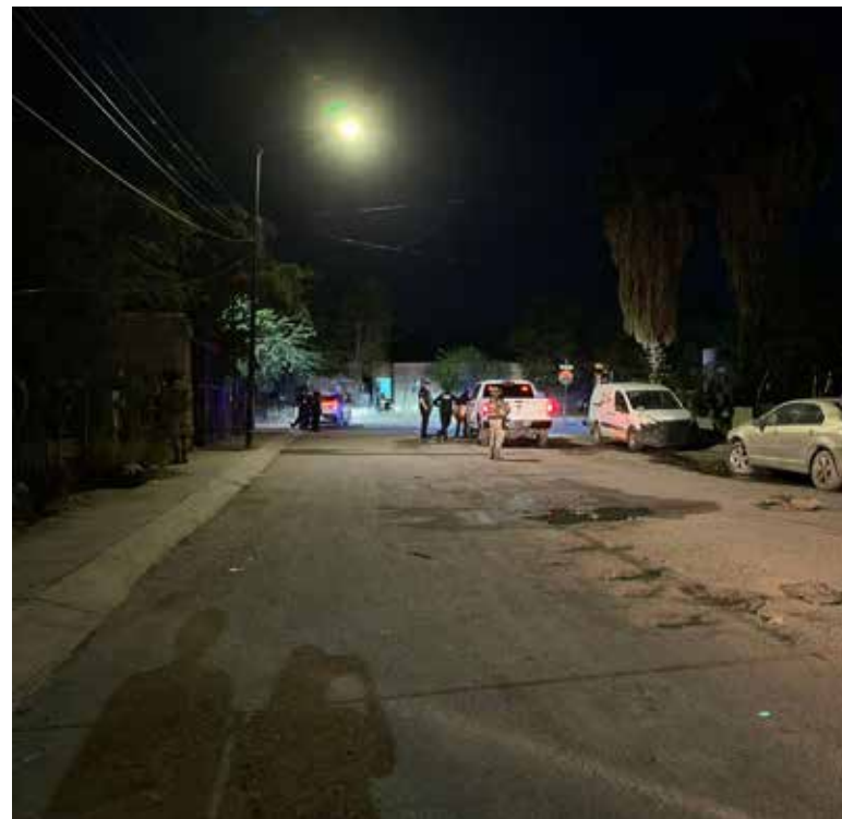
Autoridades desplegaron un operativo tras el ataque, sin lograr capturar al agresor.

En el lugar fueron asegurados como indicios cuatro casquillos percutidos y un cartucho útil calibre 9 milímetros.