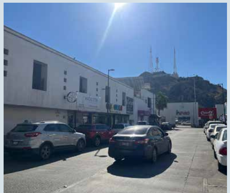
Se espera fin de semana con clima estable y sin lluvias en Sonora: Conagua.

que se esperan valores máximos de entre 25 y 32 grados centígrados en las zonas centro, sur y noroeste del estado. Por su parte, las temperaturas