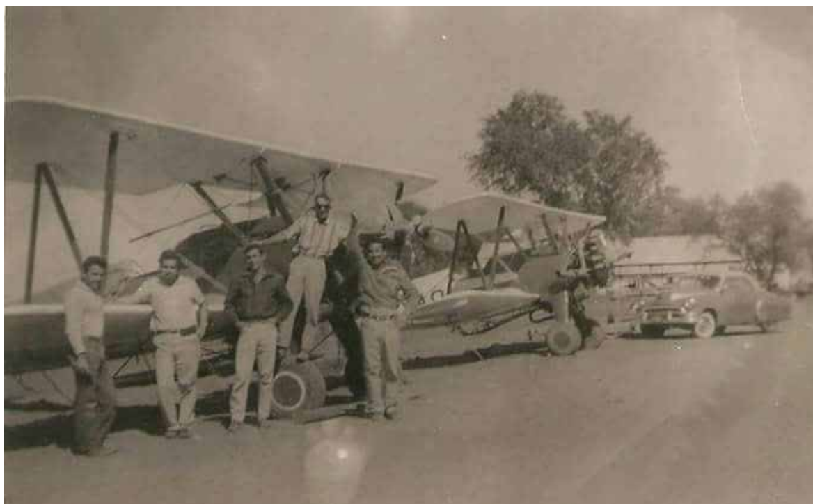
Políticos, artistas, reinas de bellezas e ídolos de la lucha libre como el Santo y Blue Demon llegaron desde el cielo, en lo que fue el primer aeropuerto de Ciudad Obregón.

gar que ofreció movilidad, dinamismo y crecimiento a la ciudad fue el sitio que se eligió para dar vida a la terminal área que abrió la ventana a la modernidad.