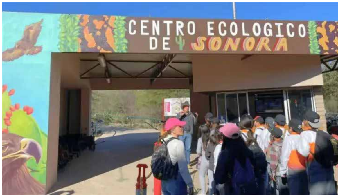
Reactivarán acuario del Centro Ecológico de Sonora tras más de 15 años cerrado.

acuario contará nuevamente con 14 peceras habilitadas para la exhibición de peces, tortugas y otras especies marinas propias