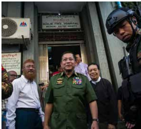
Los jueces determinaron que los sentenciados incumplieron leyes penales relacionadas con fraude, secuestro, homicidio y delincuencia organizada.

Los jueces determinaron que los sentenciados incumplieron leyes penales relacionadas con fraude, secuestro, homicidio y delincuencia organizada. Las reso-