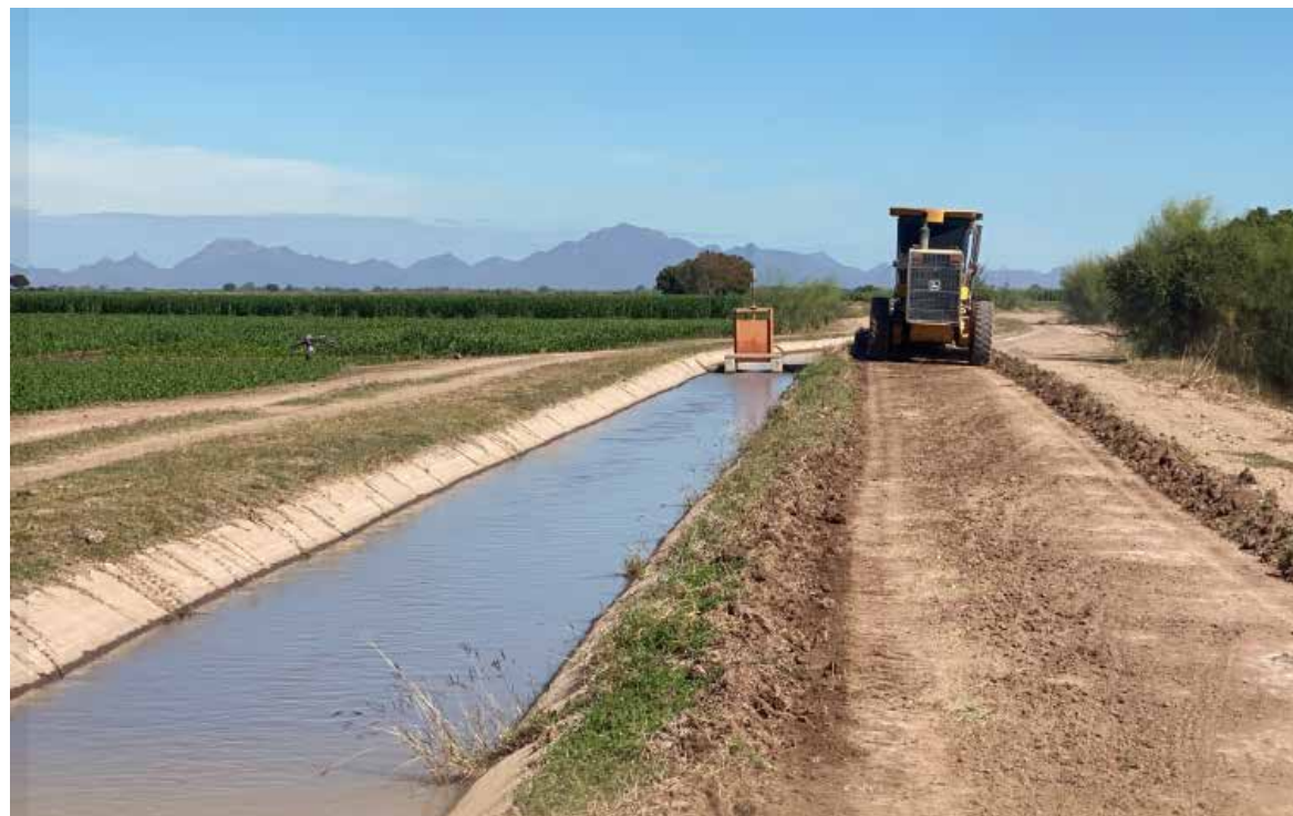
Especialistas prevén que el almacenamiento podría superar la barrera del 40% en el verano.

Con los pronósticos de precipitaciones para el próximo verano, especialistas prevén que el almacenamiento podría superar la barrera del 40%, lo que representaría un respiro significativo para la seguridad hídrica de la entidad.