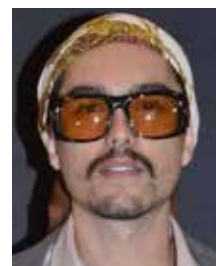
Sergio Mayer Mori.