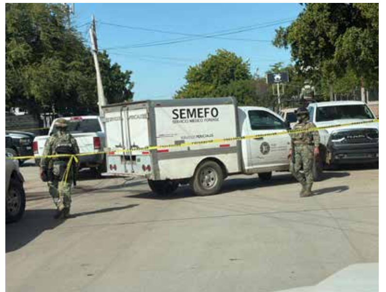
La víctima quedó tendida sobre la banqueta y fue reconocida por su apodo.