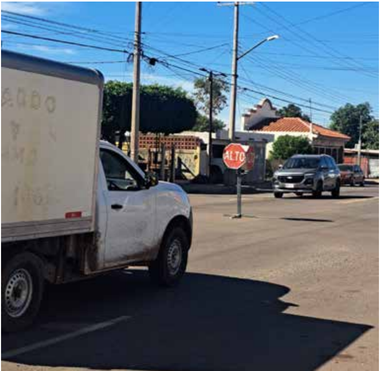
El señalamiento de alto de cortesía instalado desde hace varios meses en el cruce de las calles Otancahui y Allende continuará de manera provisional.

como no estaba el alto, muchos se iban de paso; sin embargo, poco a poco la gente se ha ido ajustando y se familiariza con los señalamientos’, comentó. Destacó que desde la implementación de este alto de cortesía se ha logrado reducir el número de accidentes en dicho cruce, sin que se haya registrado algún percance recientemente. Por otra parte, el Comandante de Tránsito hizo un llamado a la población a respetar los límites de velocidad, especialmente en zonas cercanas a instituciones educativas, con el fin de prevenir accidentes y proteger a peatones y estudiantes.