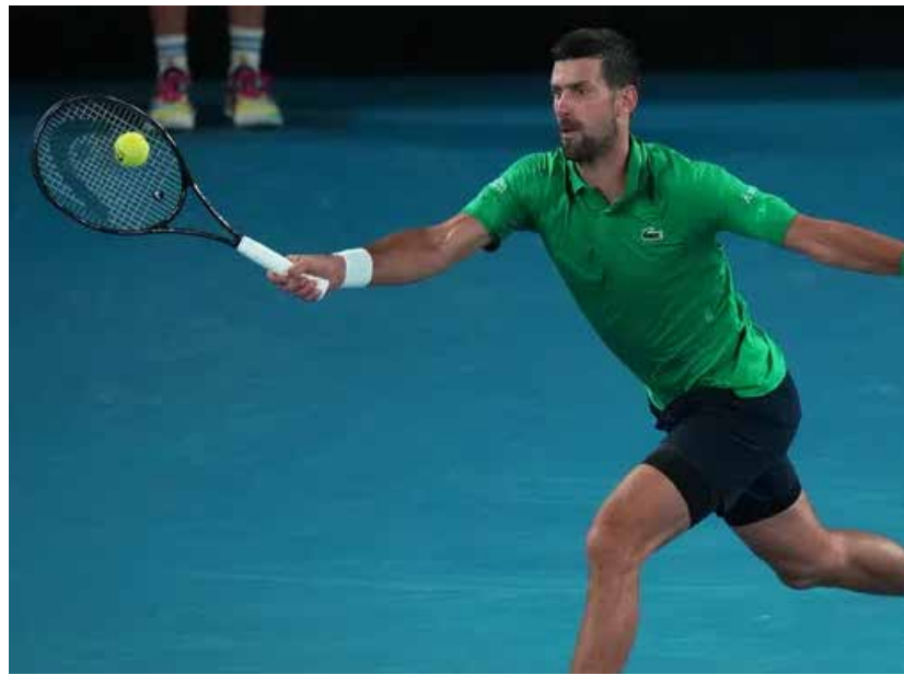
Después de una intensa batalla que incluyó reveses y remontadas, Djokovic logró imponerse y acceder a la final del certamen en Melbourne.

Novak Djokovic volverá a la Rod Laver Arena el próximo domingo para enfrentarse a Carlos Alcaraz en la Final del Australian Open, recordando que Alcaraz batalló por más de cuatro horas contra