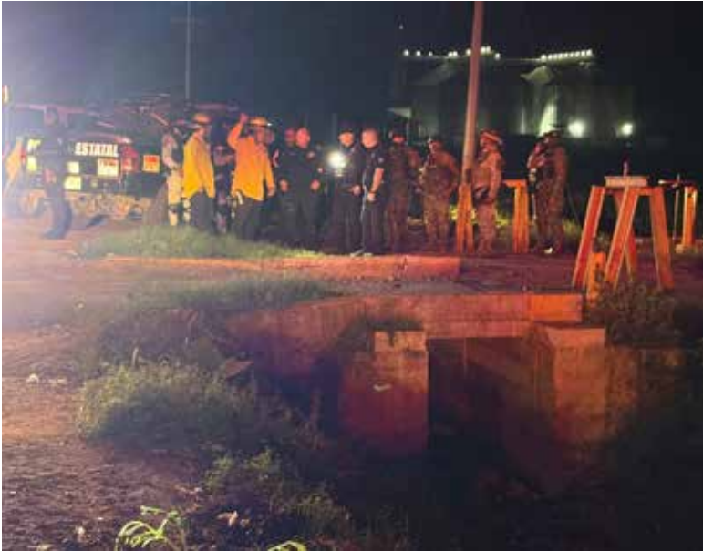
Dos cuerpos sin vida con impactos de bala fueron localizados durante la tarde y anochecer de este viernes en distintos puntos de la ciudad.

En esa parte del poniente de Ciudad Obregón, se encontró el cadáver de un hombre no identificado de aproximadamente 60 años. Era tez morena, delgado, calvo y sin bigote. Vestía camisa negra, pantalón de vestir color vino. A simple vista presentó un impacto de bala en el cuello con salida en el cráneo.