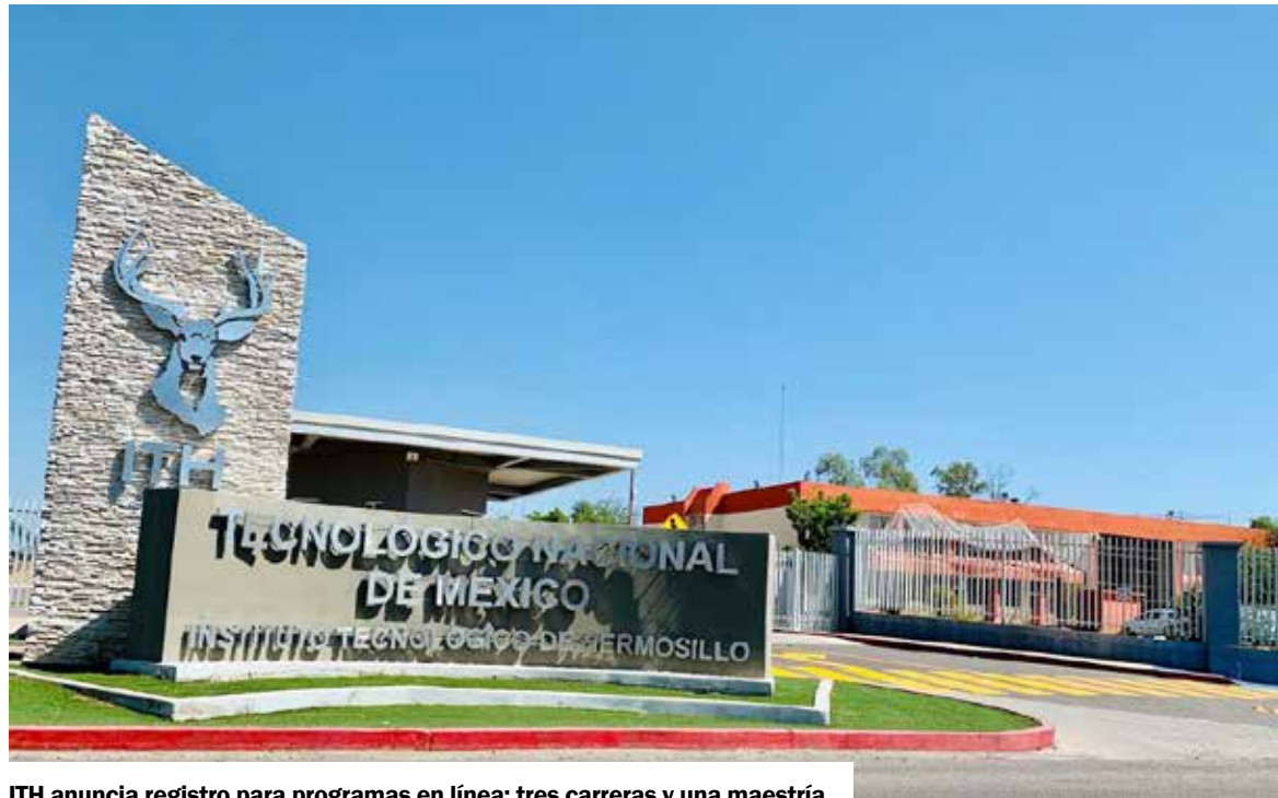
ITH anuncia registro para programas en línea: tres carreras y una maestría.