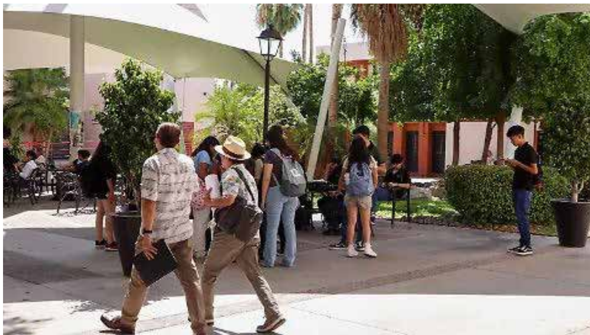
Universidad de Sonora anuncia convocatoria 2026 con más de 10 mil lugares para aspirantes.

De acuerdo con la información emitida, la publicación de resultados del proceso de selección está programada para el próximo 1 de junio, mientras que el periodo de inscripciones para los aspirantes aceptados se llevará a cabo del 2 al 4 de junio.