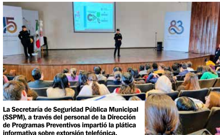
La Secretaría de Seguridad Pública Municipal (SSPM), a través del personal de la Dirección de Programas Preventivos impartió la plática informativa sobre extorsión telefónica.