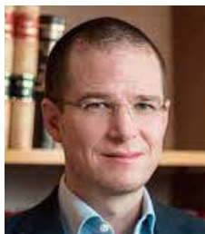
Ricardo Anaya Cortés