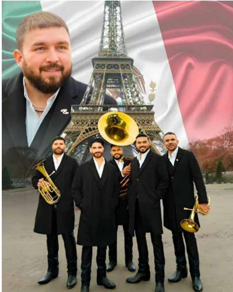
Una vez más la banda 'El Recodo' se mantiene como una de las agrupaciones favoritas de millones de mexicanos.

Lanzada el 31 de octubre de 2025 bajo El Recodo/FONO/UMLE, 'Solo tú' marca el segundo número 1 del año para FONO, la disquera de música regional mexicana se reemplaza a sí misma en el primer lugar; otra canción reimaginada, 'Una noche contigo' de 'La Arro-