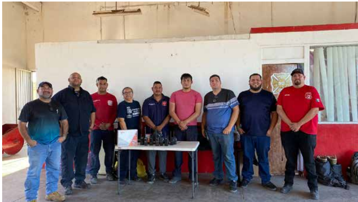
Radioaficionados fortalecen sistema de comunicación para atención de emergencias en la ruta del Río Sonora.

Como parte de estos trabajos, también fueron habilitados los radios móviles de las unidades operativas y se dio mantenimiento al equipo de cómputo, el cual