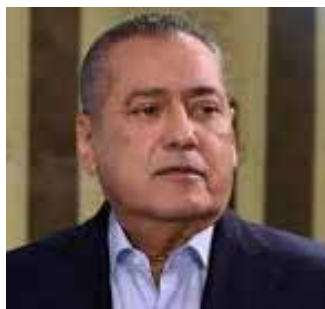
Manlio Fabio Beltrones