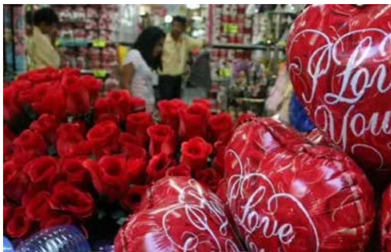
Ventas del comercio en Sonora crecerían hasta 10% por San Valentín: Fecanaco-Canacope.

“La derrama económica se concentra principalmente en giros como florerías, restaurantes, cafeterías, tiendas de regalos, joyerías,