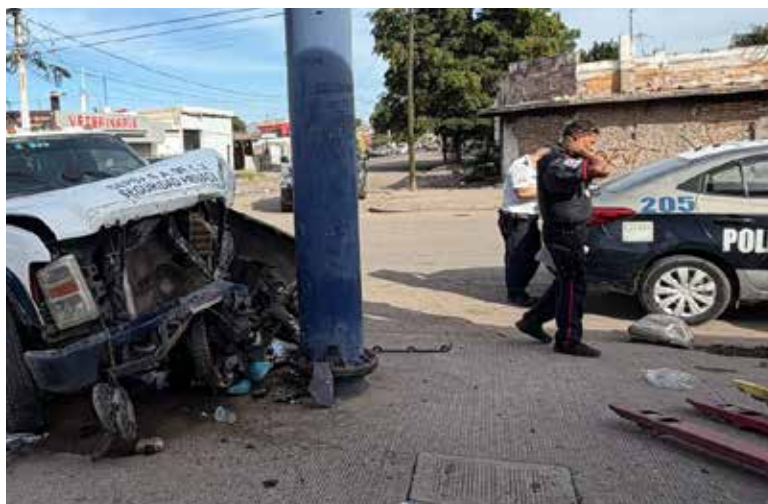
El hombre permaneció hospitalizado desde el viernes pasado tras sufrir graves lesiones.

médicos de Cruz Roja que lo auxiliaron en el lugar del percance.