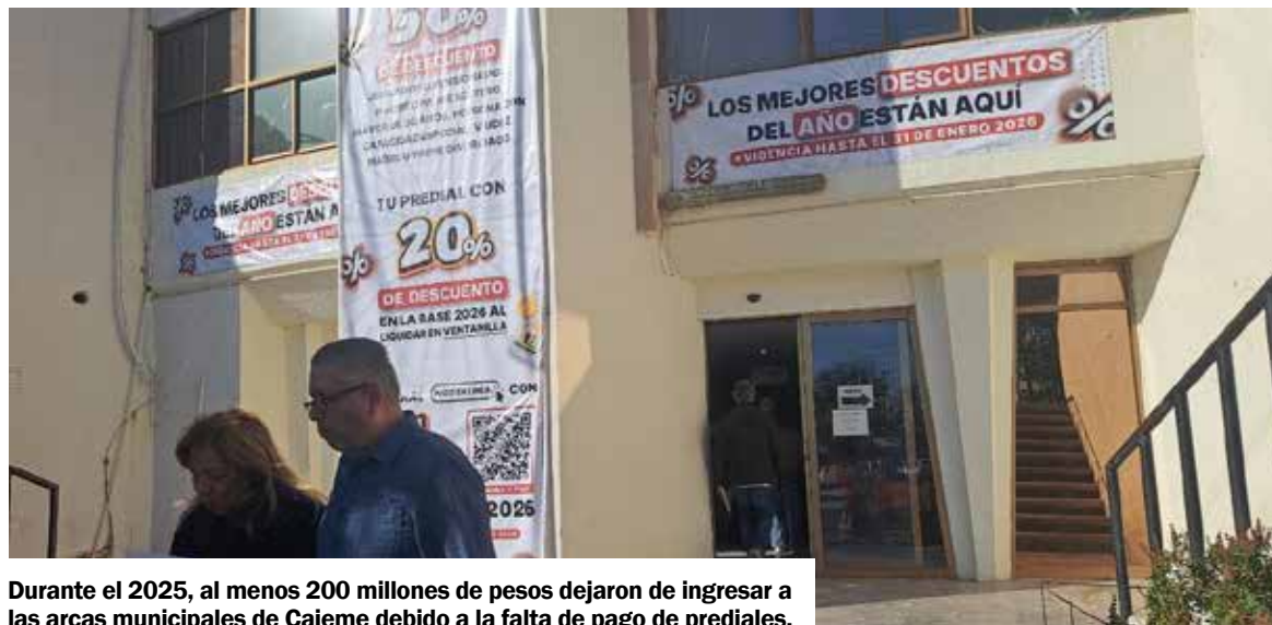
Durante el 2025, al menos 200 millones de pesos dejaron de ingresar a las arcas municipales de Cajeme debido a la falta de pago de prediales.

‘Solo alrededor del 50% de la gente paga el predial y si te plati-