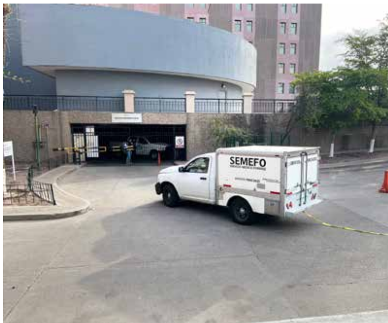
La víctima perdió la vida en el lugar tras una agresión con arma de fuego.

dió que la víctima habría recibido al menos un impacto de bala en la cabeza y que presuntamente laboraba en ISSSTE, dato que hasta el momento no ha sido confirmado por la autoridad, pero si por trabajadores del Centro de Gobierno.