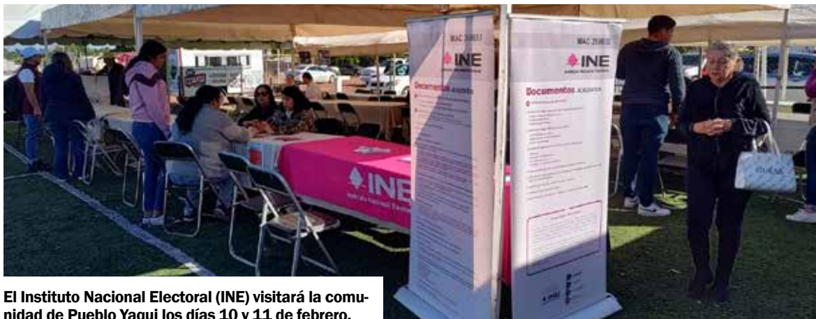
El Instituto Nacional Electoral (INE) visitará la comunidad de Pueblo Yaqui los días 10 y 11 de febrero.

Se recomiendan acudir a temprana hora, ya que la atención se brindará conforme vayan llegando.