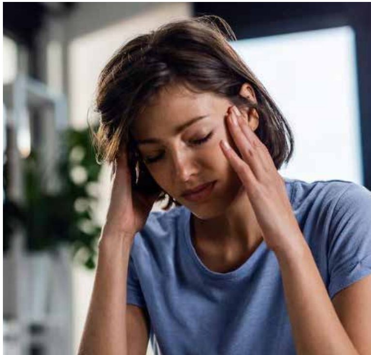
La falta de una prueba única y la variabilidad de síntomas hacen que la encefalitis autoinmune sea difícil de detectar, lo que impacta la vida laboral y social de los pacientes.

La variabilidad de estos síntomas, que muchas veces no se manifiestan de forma clara, contribuye a diagnósticos imprecisos o tardíos. Numerosos pacientes relatan que sus allegados perciben las dificultades como transitorias, utilizando expresiones como “más ansiosos, con menos confianza y con la mente nublada”, según testimonios recogidos por la experta.