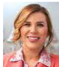
Marina del Pilar Ávila

no se quedan en el ámbito estatal, sino que impactan la percepción ciudadana a nivel nacional y erosionan la confianza en Morena como fuerza política. Con elecciones en 2027 en el horizonte, el caso Campeche se convierte en un llamado de alerta sobre los costos electorales de los conflictos internos no resueltos. La ciudadanía observa y juzga, y cuando percibe divisiones, castiga en las urnas. En ese contexto, el exhorto a cerrar filas no es solo un mensaje partidista, sino una estrategia política necesaria para preservar la cohesión del movimiento y garantizar gobernabilidad. Resolver diferencias mediante el diálogo institucional y evitar que los conflictos escalen públicamente será clave para que Morena mantenga credibilidad, fortaleza interna y capacidad de conducción política en los próximos procesos electorales.