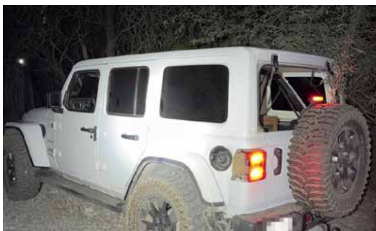
Agentes evitaron el saqueo de botellas de cerveza tras detectar a varios individuos en plena actividad delictiva.

“Al acudir a las instalaciones no se pudo lograr la detención