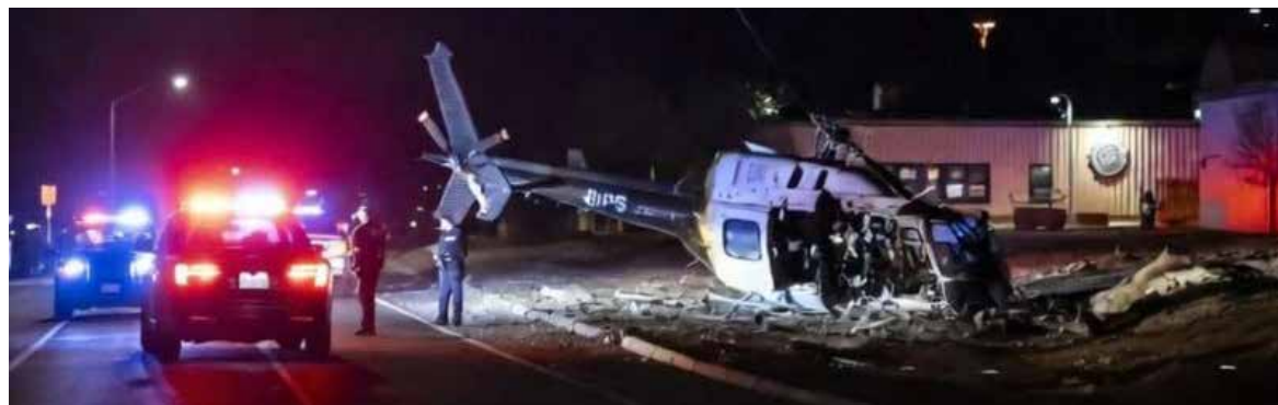
Antes del accidente se había enviado una alerta de emergencia a los celulares advirtiendo de un hombre armado por el área.

Antes del accidente se había enviado una alerta de emergencia a los celulares advirtiendo de un hombre armado por el área y