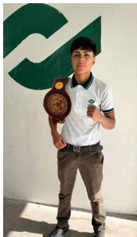
La directora del subsistema destacó la disciplina y dedicación de los jóvenes pugilistas.

fomentar valores como la constancia y el rendimiento de primer nivel, además de proyectar el talento juvenil sonorense en escenarios nacionales e internacionales.