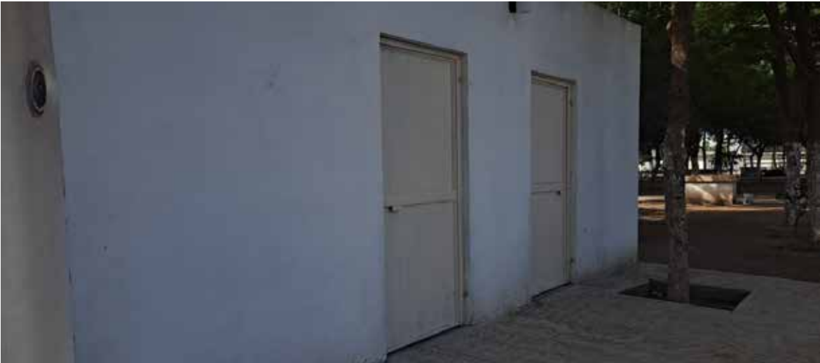
El comité de comerciantes y vecinos de la Plaza Constitución, al sur de Ciudad Obregón, recibió al alcalde Javier Lamarque Cano, quien hizo entrega de las llaves de los baños recién rehabilitados en esta área pública.

Lavacarros mantienen el orden mientras ofrecen un servicio ágil y cuidadoso, mientras que los boleros conservan el oficio tradicional, devolviendo el brillo al calzado de los vecinos. Más que un punto de paso, la plaza se consolida como un ejemplo de convivencia urbana, donde el mantenimiento del espacio público y el esfuerzo de sus trabajadores locales crean un ambiente de confianza y orgullo para la comunidad.