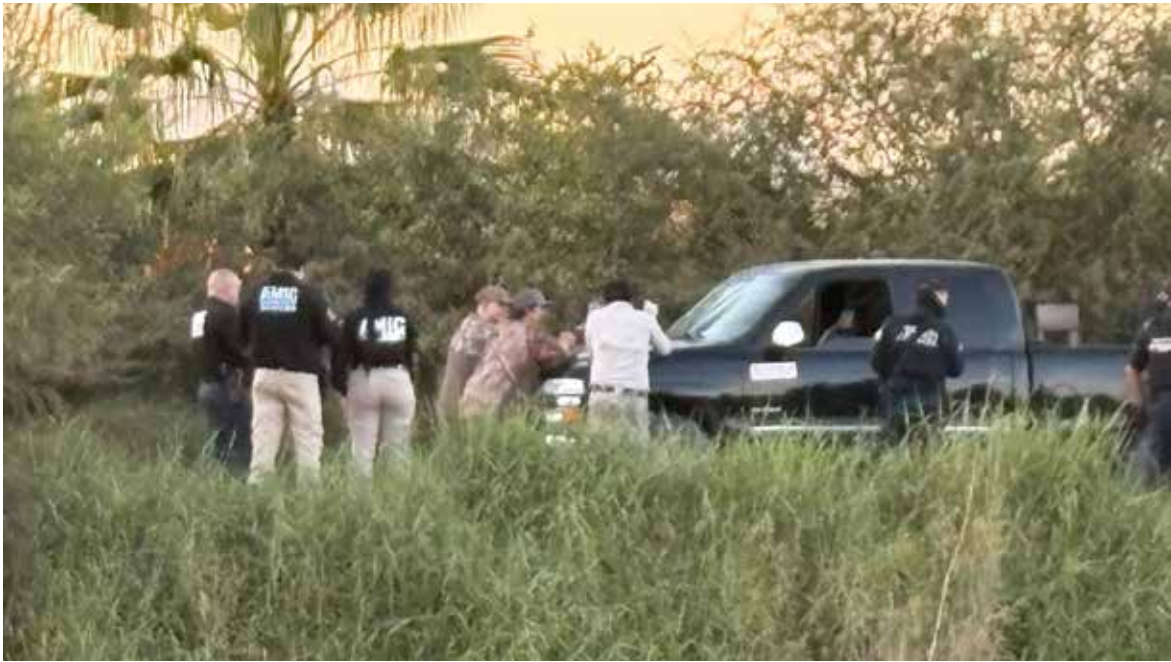
Seis miembros de un club de caza fueron detenidos tras hacer disparos sin contar con permiso de la Secretaría de la Defensa Nacional.

Fue frente a un lugar anteriormente conocido como “Arcos Alameda” donde los cazadores