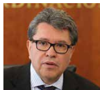
Ricardo Monreal Ávila