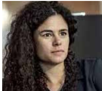
Luisa María Alcalde