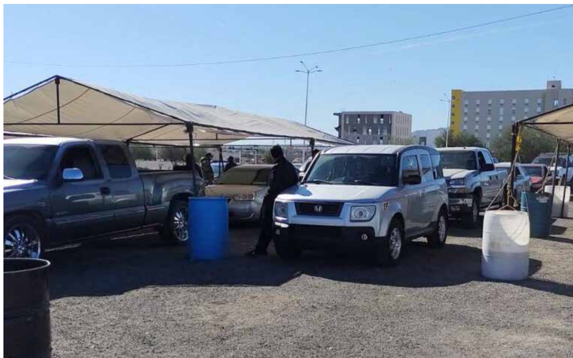
Repuve ampliará cobertura con nuevos módulos en el sur y norte de Sonora.

González Caballero señaló que, tras concluir el apoyo al decreto federal de regularización de vehículos de procedencia