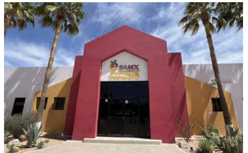
El Banco de Alimentos en Hermosillo proyecta un incremento en el número de personas beneficiadas para 2026, al pasar de 60 mil a 65 mil beneficiarios, como parte de su estrategia de crecimiento institucional.

'Banco de Alimentos no es para todas las personas, es para quien tiene una necesidad de ayuda ali-