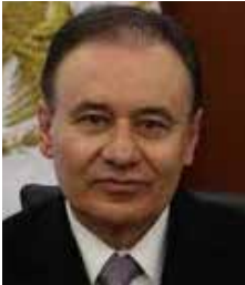
Alfonso Durazo Montaño