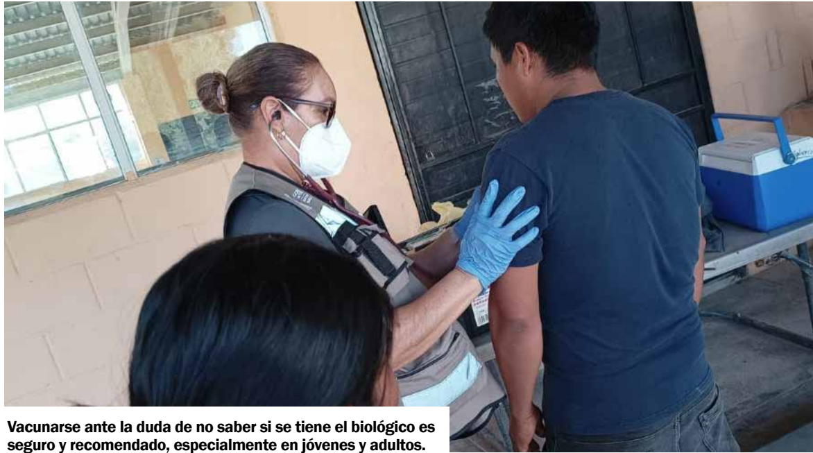
Vacunarse ante la duda de no saber si se tiene el biológico es seguro y recomendado, especialmente en jóvenes y adultos.

H ERMOSILLO. La Secretaría de Salud Pública (SSP) del Gobierno de Sonora aclara una de las dudas más comunes sobre la vacunación contra el sarampión: '¿puedo vacunarme si no estoy seguro de haberme vacunado?'. La respuesta es sí. Vacunarse ante la duda es