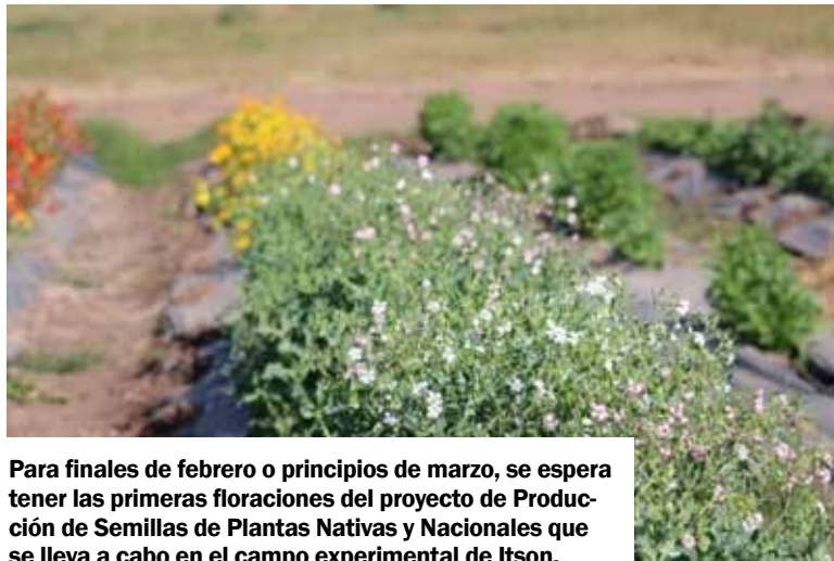
Para finales de febrero o principios de marzo, se espera tener las primeras floraciones del proyecto de Producción de Semillas de Plantas Nativas y Nacionales que se lleva a cabo en el campo experimental de Itson.