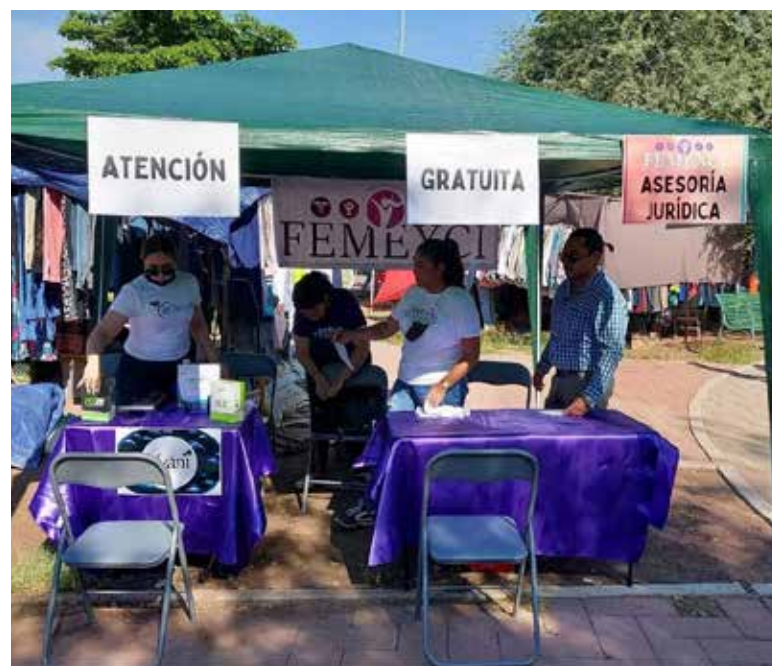
La Federación Mexicana de Mujeres por las Ciencias Forenses y Jurídicas (Femexi) realiza diversas actividades enfocadas en la atención y apoyo a niños, niñas y mujeres víctimas de cualquier tipo de violencia.

‘En las preparatorias hay ciertos factores que no ayudan mucho a que una persona pueda expresarse libremente y decir que fue víctima de violencia; entonces, en el momento no se acercan, sino que