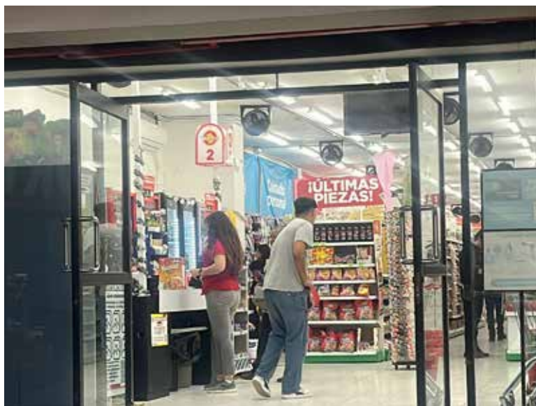
Tres tiendas Waldos de Ciudad Obregón reabrieron sus puertas el pasado sábado, recibiendo nuevamente al público tras permanecer cerradas durante casi tres meses.

De acuerdo con testimonios de trabajadores, los establecimientos que retomaron operaciones son la tienda ubicada en la calle Normal E, bulevar Bourlaug, entre CTM y 400, así como dos sucursales en el centro de la ciudad: una sobre No