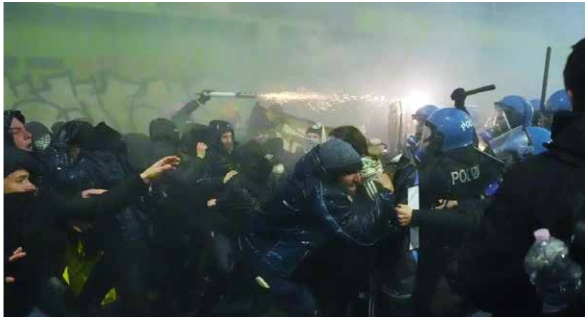
La marcha se tornó violenta cuando algunos manifestantes atacaron a la policía, por lo que las autoridades respondieron con gases lacrimógenos y cañones de agua.

La marcha fue organizada por una organización activista llamada el Comité Olímpico Insostenible, que movilizó una amplia coalición de grupos deportivos