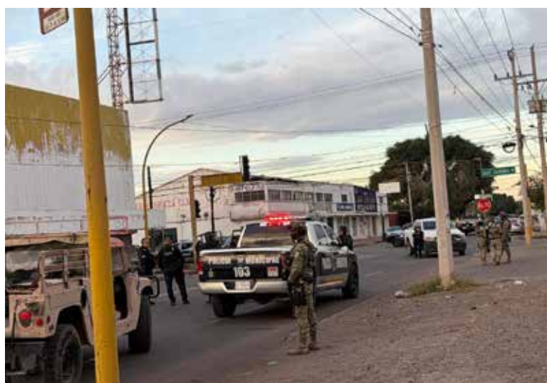
Intensa movilización generó el ataque armado.