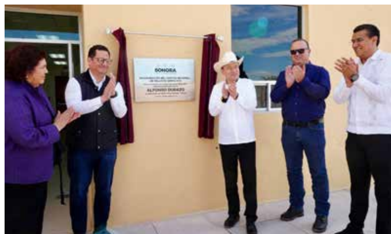
Como parte de una intensa gira de trabajo por la región norte del estado, el gobernador Alfonso Durazo Montaño encabezó acciones estratégicas en materia de salud, educación e infraestructura.

M AGDALENA DE KINO. Como parte de una intensa gira de trabajo por la región norte del estado, el gobernador Alfonso Durazo Montaño encabezó acciones estratégicas en materia de salud, educación e infraestructura, reafirmando el compromiso de su gobierno con el bienestar social, la equidad y el de-