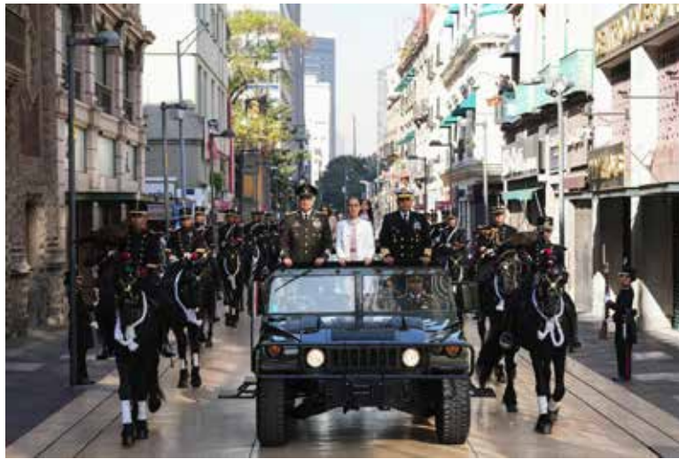
La presidenta y comandanta Suprema de las Fuerzas Armadas, Claudia Sheinbaum Pardo, encabezó la ceremonia por el 113 Aniversario de la Marcha de la Lealtad, en el Zócalo de la Ciudad de México.

El secretario de la Defensa Nacional, general Ricardo Trevilla Trejo, reiteró que las Fuerzas Armadas son siempre leales y seguirán caminando junto a la presidenta, respaldando a las instituciones y acompañando al pueblo de México