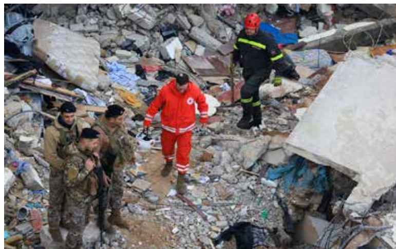
Las autoridades libanesas dijeron en ese momento que 105 inmuebles requerían “avisos de advertencia inmediata a sus residentes para evacuar”.