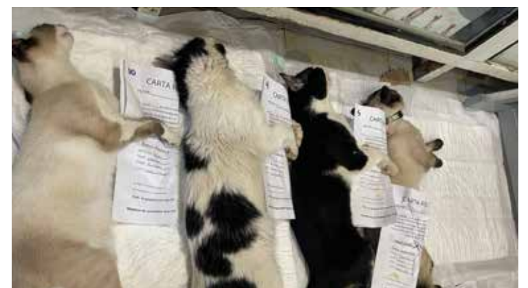
Un total de 163 esterilizaciones se realizaron durante la primera campaña de febrero que llevó a cabo la Fundación Captura, Esterilización y Suelta.

Puntualizó que Protección Civil busca garantizar que tanto empleados como clientes cuenten con las garantías necesarias ante cualquier emergencia, asegurando que los espacios comerciales cumplan con los dictámenes técnicos antes de abrir sus puertas nuevamente.