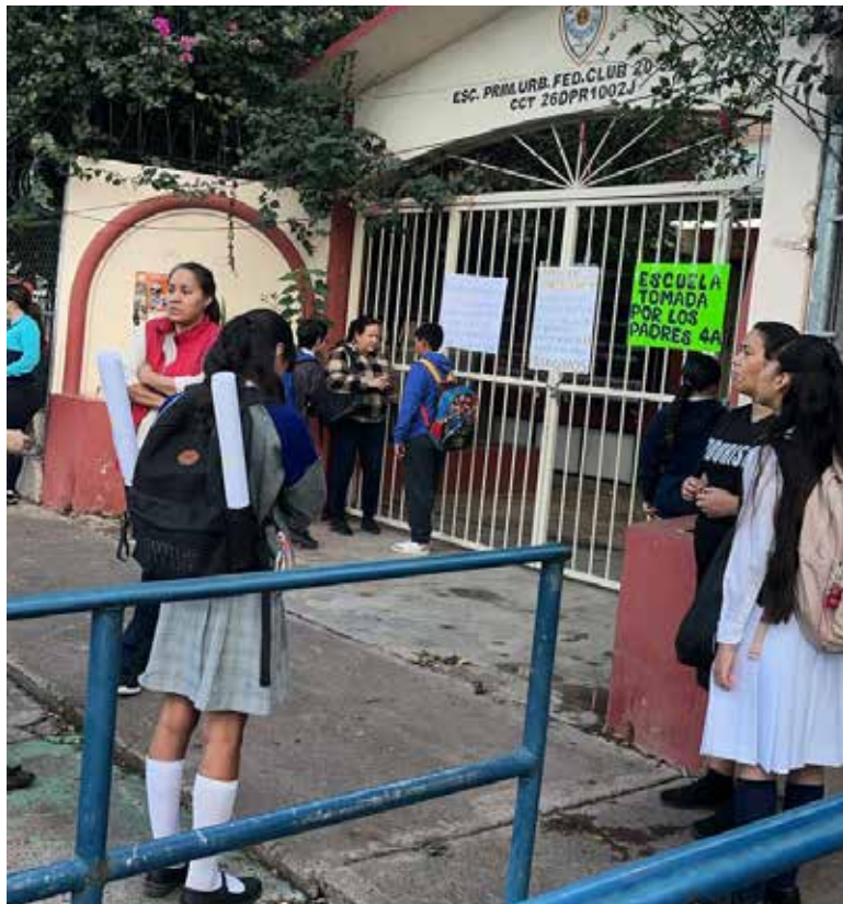
Las instalaciones de la Escuela Primaria 'Club 20-30' amanecieron con candados en sus accesos principales.

El grupo de cuarto grado no cuenta con un maestro asignado