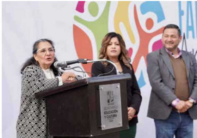
El Gobierno de Sonora en coordinación con la Secretaría de Gobernación, dio arranque oficial al programa Familias Fuertes: Amor y Límites.

El inicio del programa se llevó a cabo en la Escuela Secundaria General No. 7 "José María González", en Hermosillo, con la participación de autoridades del Sistema para el Desarrollo Integral de la Familia (DIF Sonora), Secretaría de Educación y Cultura (SEC Sonora), el Sistema de Protección Integral de Niñas, Niños y Adolescentes (Sippina)