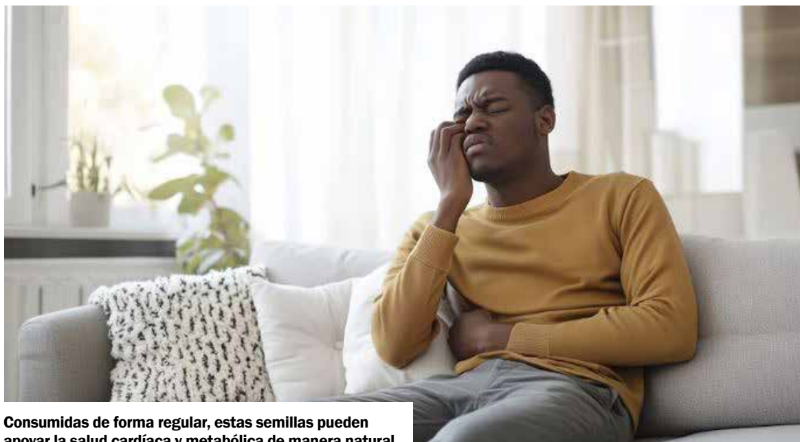
Consumidas de forma regular, estas semillas pueden apoyar la salud cardíaca y metabólica de manera natural.

Además, su efecto sobre la función tiroidea las hace especiales entre los alimentos de origen vegetal. Estos nutrientes contribu-