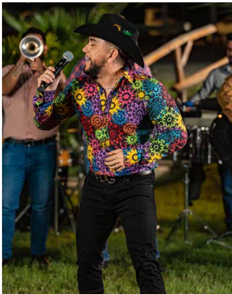
Regresa el Beбето a la escena musical no para cantar lo de siempre, sino para contar lo que cuesta volverse a armar cuando la vida te rompe en pedazos.

- "Un hombre de piedra que se traga su dolor y es que al recordarte me hago a prueba de balas... claro que extrañó, claro que me lastimó porque así lo quiso Dios", canta el Beбето con mucho sentimiento y dolor, video clip oficial que se grabó en Mazatlán, trabajo fílmico que lo-