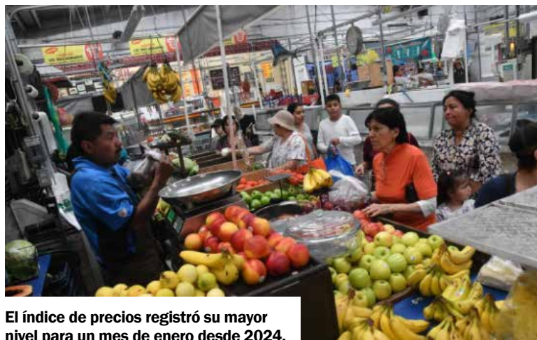
El índice de precios registró su mayor nivel para un mes de enero desde 2024.

En enero, el Índice Nacional de Precios al Consumidor (INPC) aumentó 0.38 por ciento mensual, para alcanzar una variación