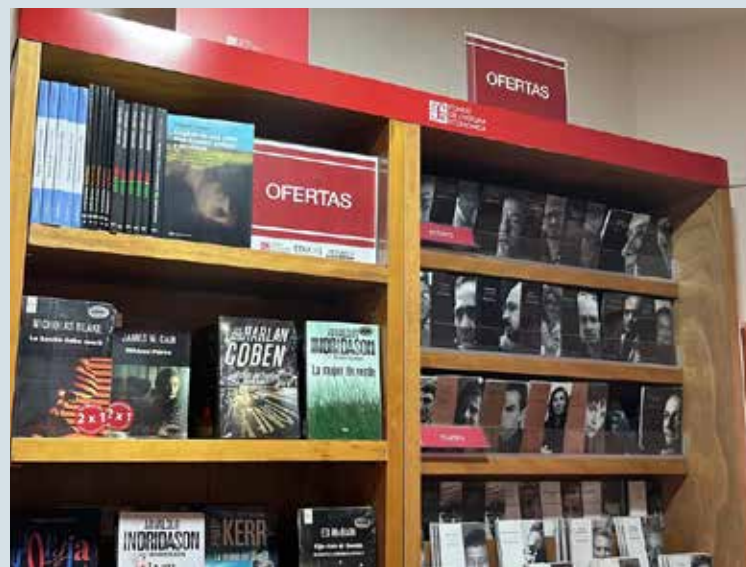
Libros desde poesía, novelas clásicas, hasta de economía y arquitectura se pueden encontrar en la librería Teresita Urrea del Fondo de Cultura Económica.

La inauguración oficial es el próximo 19 de marzo, sin embargo el establecimiento ya se encuentra operando sobre la calle 5 de Febrero entre Allende y Nánari.