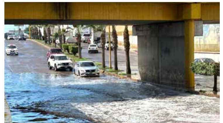
Un joven intentó cruzar el paso a desnivel ubicado por la calle 200 al oriente de la calle Sufragio Efectivo en Ciudad Obregón, el lugar presentaba agua acumulada.

Los vehículos siniestrados quedaron por minutos obstruyendo el carril del lado norte lo que generó caos vehicular en la zona, al ser la calle '200' una de las principales arterias viales de Ciudad Obregón. Al final ambas unidades fueron movidas del lugar percance.