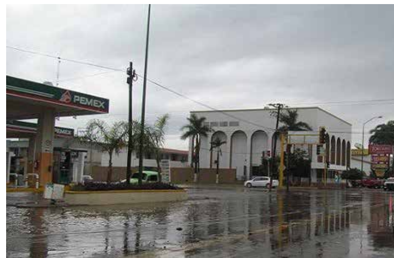
Inicio de semana con lluvias, viento y ligero descenso de temperatura en Sonora: Conagua.

“Estos fenómenos favorecerán la entrada de nubosidad sobre gran parte del territorio sono-