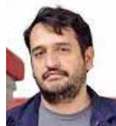
Andrés Manuel López

los trabajadores, una narrativa que resulta necesaria en un contexto donde el sindicalismo tradicional ha perdido presencia frente a nuevas formas de organización laboral y reformas que han modificado las reglas del juego, sin embargo, el desafío no será menor, ya que no basta con llamar a la unidad si no se acompaña de una agenda clara que reconecte a la CTM con las bases, con los jóvenes trabajadores y con los sectores productivos emergentes; el proceso que se avecina rumbo al 17º Congreso General Ordinario será determinante para saber si la Confederación logra una renovación real o si se limita a un relevo de nombres, porque más allá de quién encabece la dirigencia, lo que está en juego es la vigencia de la CTM como actor relevante en la defensa del trabajo organizado en México.