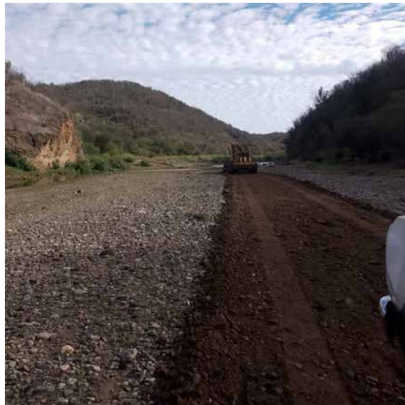
Las labores se realizan en vialidades que conectan rancherías y zonas productivas de la región.

En esta ocasión, las labores se concentraron en el camino que conduce a la comunidad de Te-