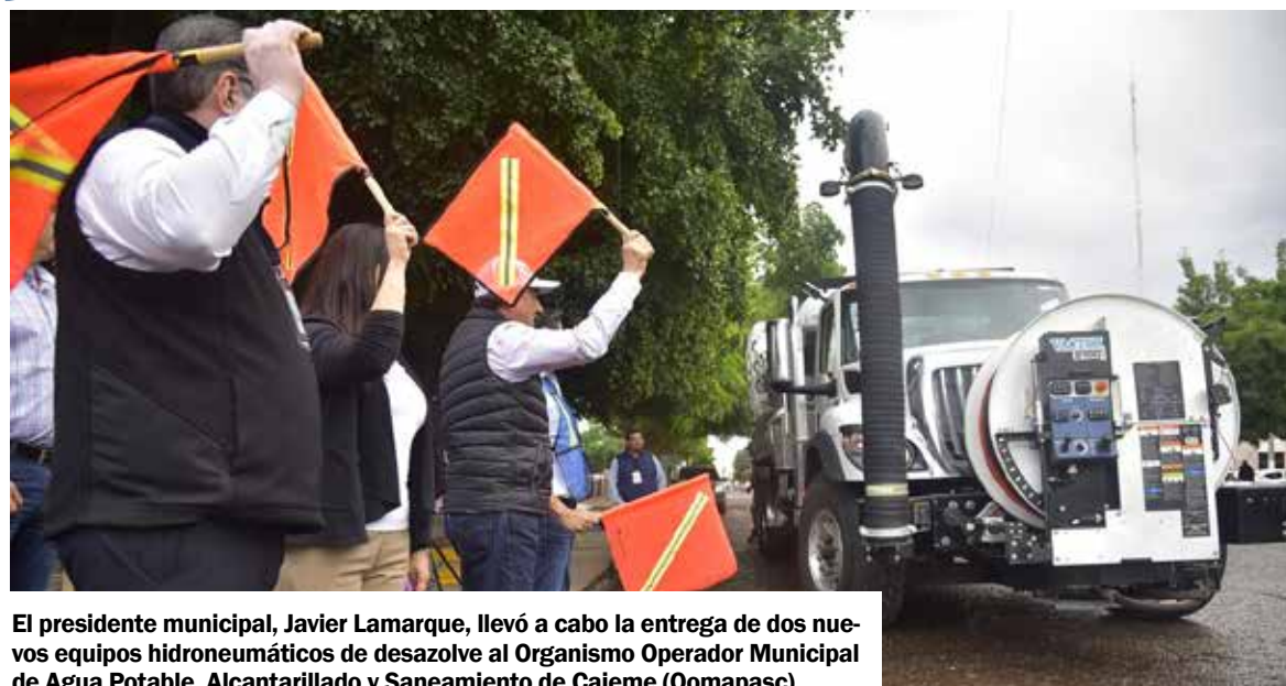
El presidente municipal, Javier Lamarque, llevó a cabo la entrega de dos nuevos equipos hidroneumáticos de desazolve al Organismo Operador Municipal de Agua Potable, Alcantarillado y Saneamiento de Cajeme (Oomapasc).

CIUDAD OBREGÓN. Para reforzar las acciones de mantenimiento y atención a la red de drenaje sanitario del municipio, el presidente municipal, Javier Lamarque, llevó a cabo la entrega de dos nuevos equipos hidroneumáticos de desazolve al Organismo Operador Municipal de Agua Potable, Alcantarillado y Saneamiento de Cajeme (Oomapasc), contribuyendo a mejorar la capacidad de respuesta ante reportes ciudadanos y prevenir afectaciones en diversos sectores