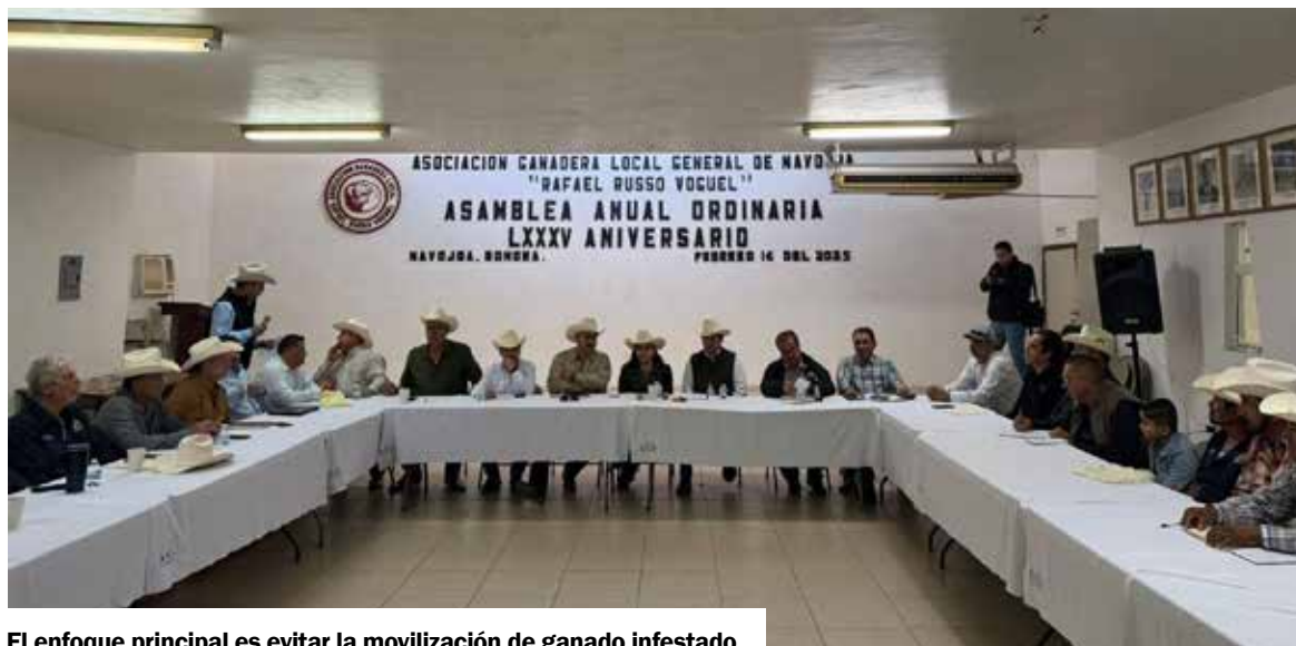
El enfoque principal es evitar la movilización de ganado infestado.

C UADRA OBREGÓN. Con el objetivo de mantener el estatus sanitario y proteger la economía de las familias productoras, la Secretaría de Agricultura, Ganadería, Recursos Hidráulicos,