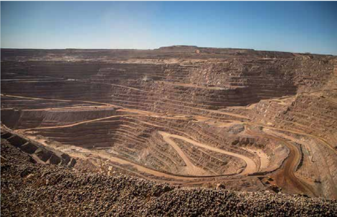
Mineros de Sonora marcharán por seguridad y mejores condiciones laborales en Hermosillo.

sábado 14 de febrero a las 11:00 horas, partiendo de las oficinas de la asociación en la colonia San Benito con destino a la Catedral Metropolitana. “El sábado 14 de febrero a las 11:00 horas, partiendo de las oficinas de la Asociación de Ingenieros de Minas, Metalurgistas y Geólogos de México, con destino a la Catedral Metropolitana, bajo el lema ‘Los mineros estamos de luto’”, dijo. Los organizadores pidieron a los asistentes portar casco y camisa blanca como símbolo de unidad, respeto, solidaridad y luto dentro de la comunidad minera. La manifestación será pacífi-