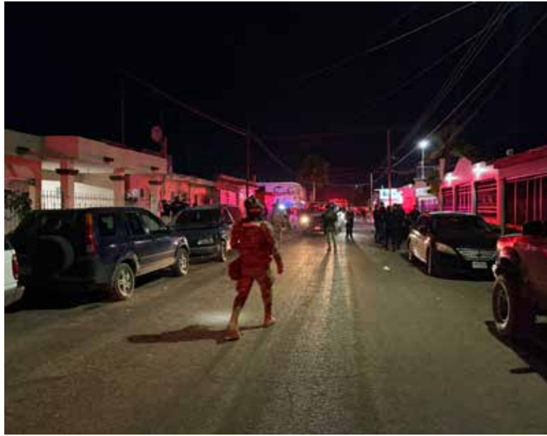
Un ataque armado dejó como saldo dos personas sin vida al interior de un taller de bicicletas ubicado en la colonia México.