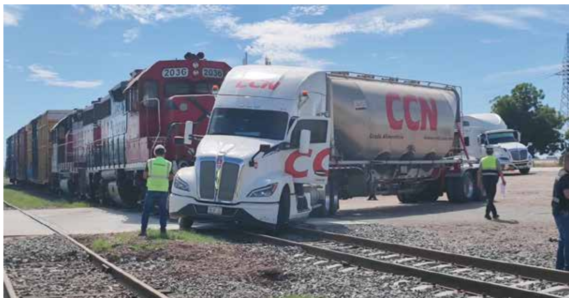
Un tráiler fue impactado por el ferrocarril la tarde del jueves en el sector sur de la ciudad.

El accidente ocurrió alrededor de las 12:30 horas sobre la carretera federal México 15, a la altura del kilómetro 150. De acuerdo con los primeros informes, la pesada unidad circulaba de sur a norte y al dar vuelta hacia la dere-