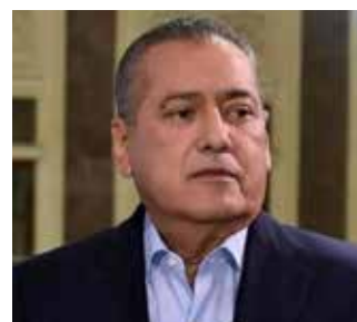
Manlio Fabio Beltrones