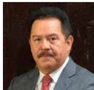
Ignacio Mier Velasco