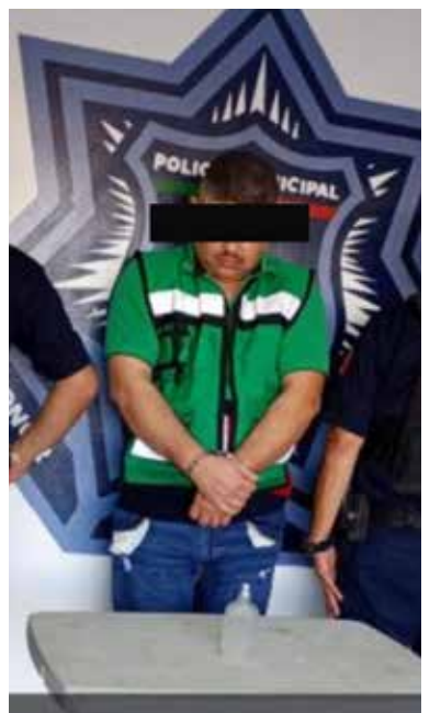
Se realizaron tres detenciones por la probable comisión del delito de robo en diferentes sectores del municipio.

cionaria ubicada en Boulevard Rodolfo Elías Calles y Jalisco, de la colonia Centro. Al arribar al sitio, los oficiales localizaron a un masculino que coincidía con las características proporcionadas, quien llevaba consigo tubería