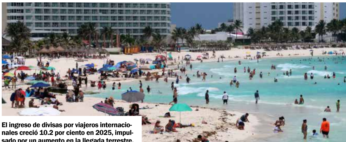
El ingreso de divisas por viajeros internacionales creció 10.2 por ciento en 2025, impulsado por un aumento en la llegada terrestre.