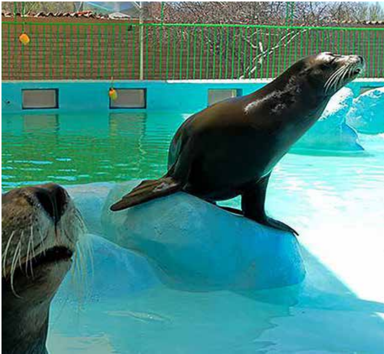
Preparan licitación del nuevo acuario tras 18 años de cierre en el Centro Ecológico en Hermosillo.