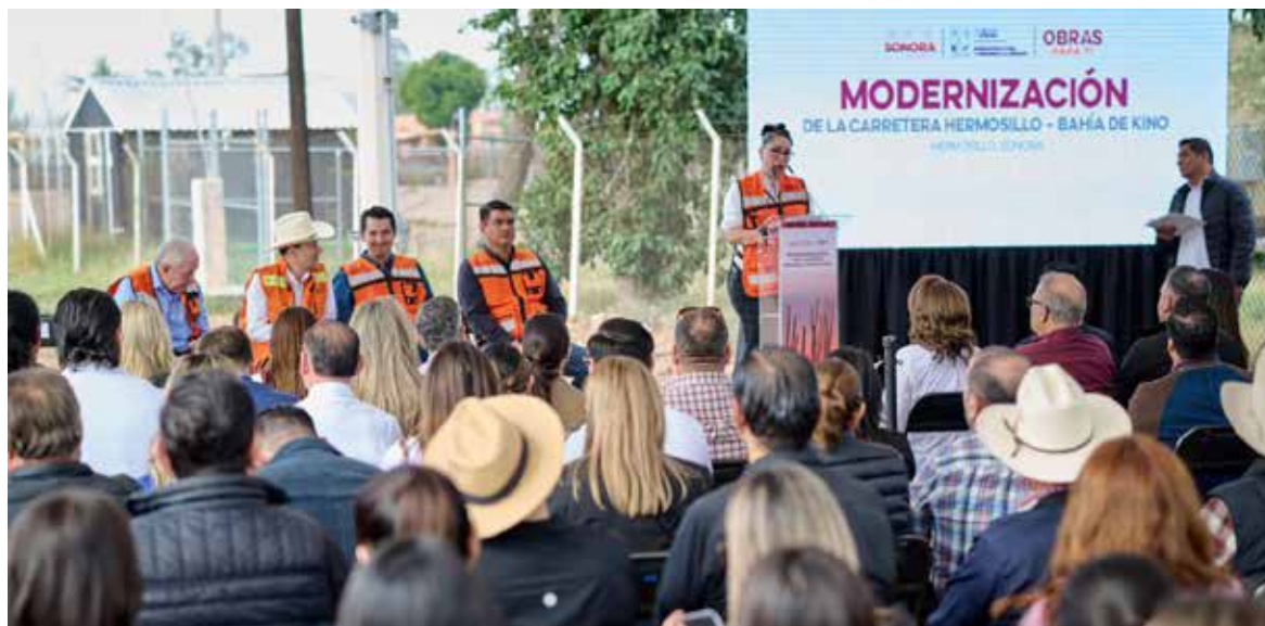
Con el arranque de la construcción de la carretera cuatro carriles Hermosillo-Bahía de Kino, es un compromiso cumplido por el gobernador Alfonso Durazo Montaño.