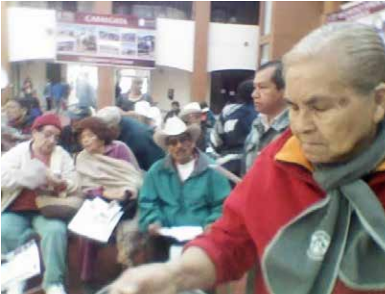
A partir del próximo lunes 16 de febrero iniciará el registro para nuevos beneficiarios en Ciudad Obregón y sus comisarias.

mamente corto del 16 al 22 de febrero, se espera una afluencia importante de ciudadanos en los puntos tradicionales de atención comúnmente el Cen-