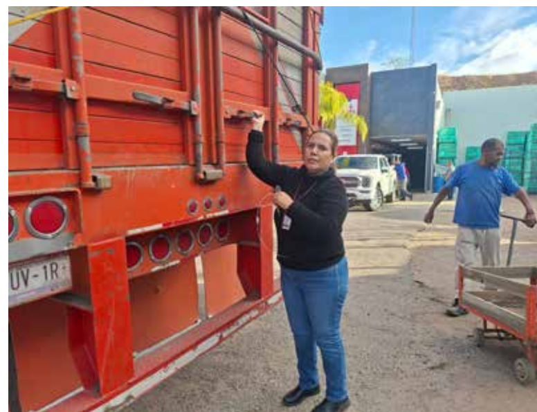
Las jornadas buscan evitar la movilización y venta de cítricos en establecimientos no autorizados, protegiendo la producción agrícola.

Con estas acciones, la Secretaría de Agricultura en Sonora reafirma su compromiso con la protección de la sanidad vegetal y la producción agrícola del estado, exhortando a productores, viveristas y comercializadores a cumplir con la normatividad vigente y a sumarse a las medidas preventivas que contribuyen a salvaguardar el patrimonio agrícola y fitosanitario de la entidad.