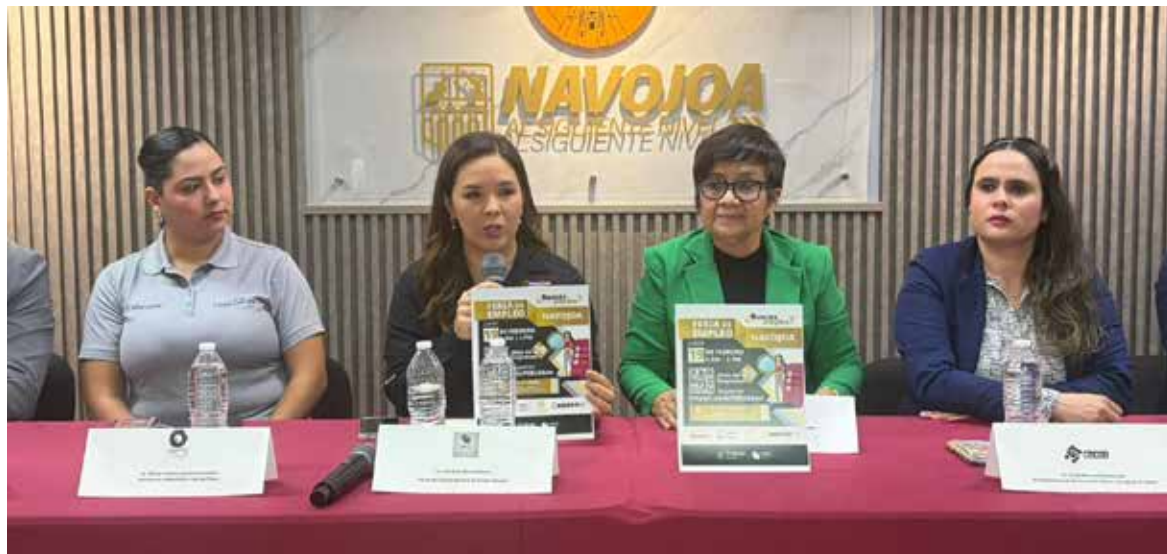
Anuncian Feria del Empleo con más de 400 vacantes en Navojoa.