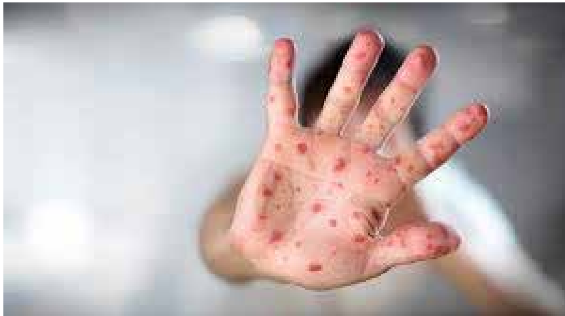
El Gobierno federal ha anunciado que parte de su estrategia nacional para frenar los contagios por sarampión será la jornada de vacunación para los siete Estados que concentran el 85% de los casos totales en el país.

C UADRAD DE MÉXICO. El Gobierno federal ha anunciado que parte de su estrategia nacional para frenar los contagios por sarampión será la jornada de vacunación para los siete Estados que concentran el 85% de los casos totales en el país. Además de que ya se han habilitado más de 21.154 centros de salud que aplican la vacuna, el subsecretario de Políticas de Salud y Bienestar Poblacional, Ramiro López Elizalde, confirmó este miércoles que a partir del 23 de febrero la población de entre 13 y 49 años podrá recibir la inyección en Jalisco, Chiapas, Sinaloa, Ciudad de México, Colima, Tabasco y Nayarit. Aunque en el informe nocturno de este miércoles ya se han añadido a la lista los Estados de Puebla y Estado de México. “El objetivo es cortar la cadena de transmisión al vacunar a esta población”, precisó López Elizalde.