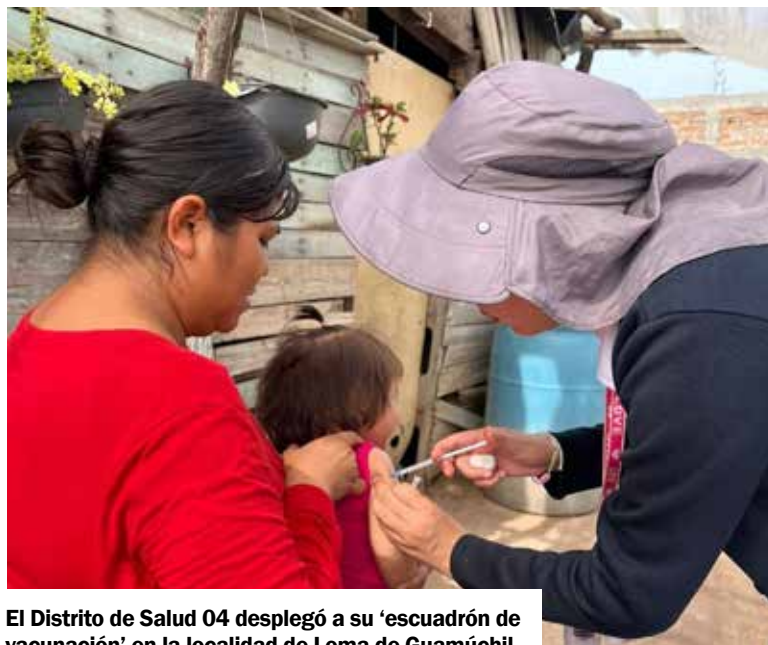
El Distrito de Salud 04 desplegó a su ‘escuadrón de vacunación’ en la localidad de Loma de Guamúchil.

te de las estrategias de Salud Sonora para asegurar que ninguna comunidad quede fuera