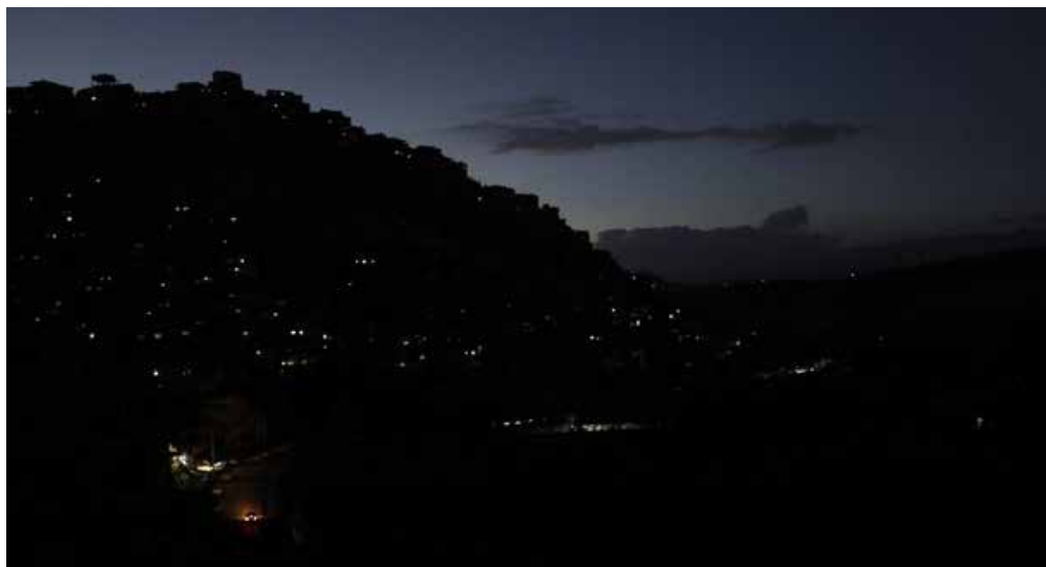
El instituto meteorológico colocó además a una treintena de departamentos en alerta naranja este jueves ante los “vientos tempestuosos” y las “crecidas importantes”.

El servicio meteorológico francés Météo France registró durante la noche ráfagas de 162 km/h en Biscarrosse, 145 km/h en Pau, 136 km/h en Mont-de-Marsan, 125 km/h en Toulouse, 124 km/h en Burdeos y 120 km/h en Auch.