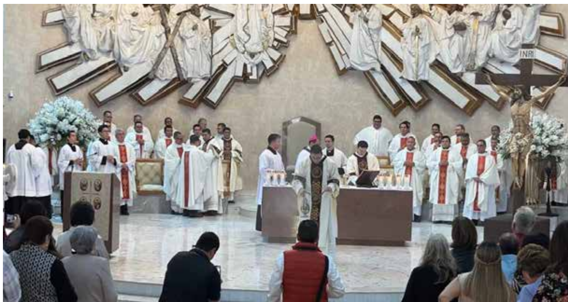
El próximo miércoles 18 de febrero da inicio la Cuaresma con la imposición de la ceniza.