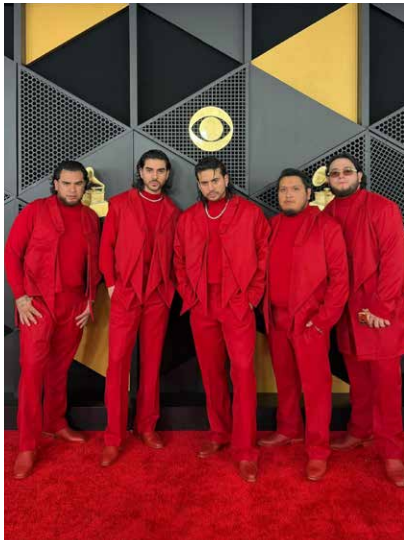
Las redes sociales se encendieron luego de confirmarse que 'Tristón', - canción escrita por Edgar Barrera, Jorge Jiménez y JOP, - fue retirada de plataformas digitales.

'Tristón' es una fusión de cumbia-norteño con elementos de corrido, a diferencia de los temas más energéticos de 'Fuerza Regida', esta canción tiene un tono lento, emocional y melancólico, la letra explora sentimientos de desamor, nostalgia y dolor tras una ruptura, con frases clave como: 'Yo soy el mismo, pero solo más tristón' y '¿Por qué me duele si tú