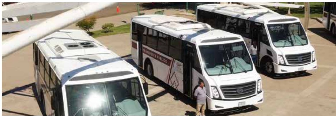
Las unidades de la llamada Ruta Cajeme, o Línea 9, que pertenece al municipio, brindan servicio de transporte a más de 2 mil estudiantes diariamente.

unidades, una de ellas de respaldo, con el objetivo de mejorar la conectividad y fortalecer el servicio de transporte público. Estas unidades cuentan con monitoreo permanente, GPS en tiempo real y nueve cámaras de vigilancia.