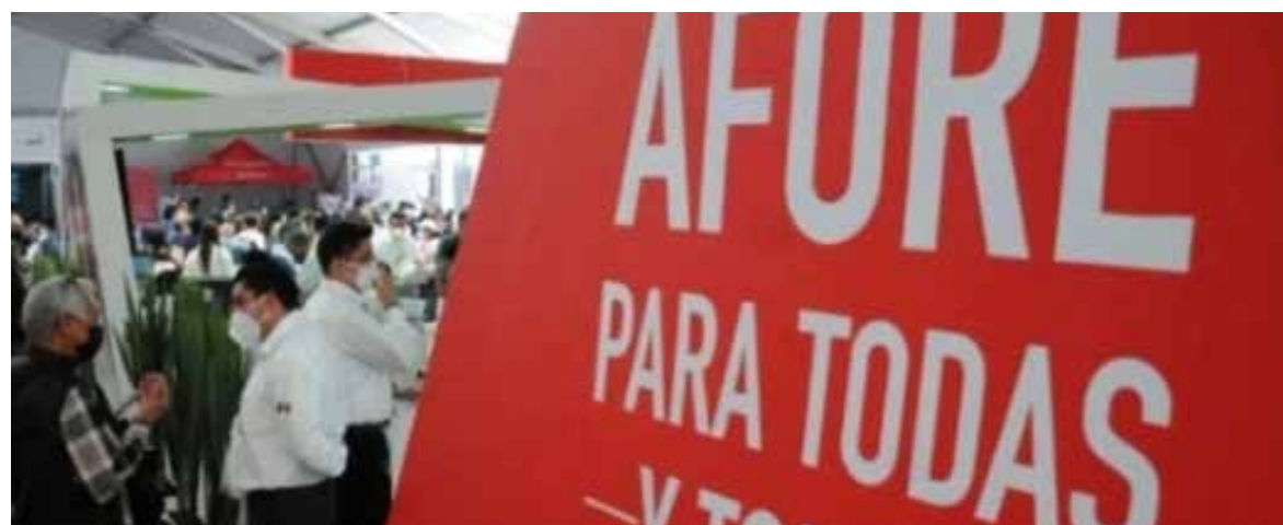
La Comisión Nacional del Sistema de Ahorro para el Retiro informó que las ganancias acumuladas alcanzan cifras históricas para los trabajadores.

Una plusvalía es un aumento en el valor de un activo, en este caso los ahorros administrados por las