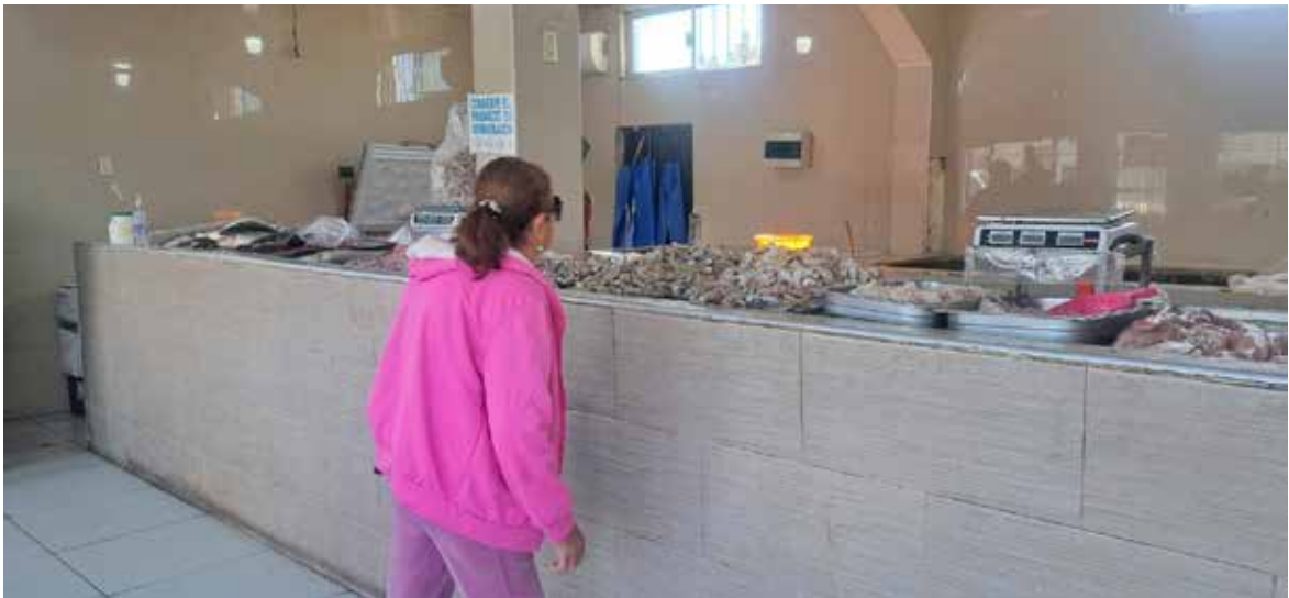
Este miércoles 18 de febrero da inicio la Cuaresma, temporada en la que se espera un incremento en las ventas de pescaderías de entre un 50 y hasta un 70 por ciento.

‘Lo que más consume la gente siempre es la tilapia, cazón, curvina; el lenguado también lo consumen. Hasta el momento no han subido los precios y no creo que suban. Hay poca producción, pero estamos mante-