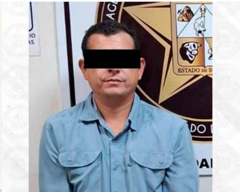
Horlando “N”, de 38 años de edad.

El imputado se desempeñó como agente de tránsito de la Policía Municipal de Cajeme del 26 de octubre de 2015 al 28 de noviembre de 2025, fecha en que causó baja al no acreditar evalua-