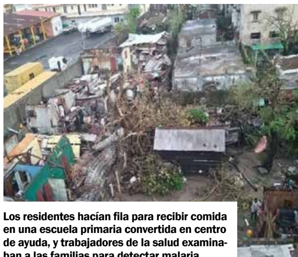
Los residentes hacían fila para recibir comida en una escuela primaria convertida en centro de ayuda, y trabajadores de la salud examinaban a las familias para detectar malaria.

Unas 25.000 casas quedaron destruidas, otras 27.000 inundadas y más de 200 aulas parciales o completamente arrasadas, indicó el organismo.