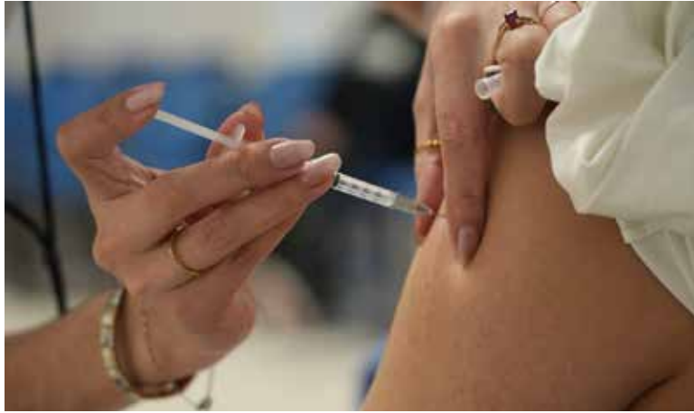
En Cajeme se han confirmado al menos tres casos de sarampión, los cuales ya se encuentran controlados y aislados para prevenir más contagios.

El funcionario señaló que la prevención de esta enfermedad es de gran interés para el muni-