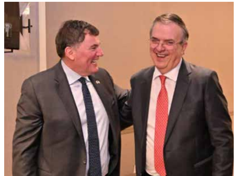
México y Canadá están fortaleciendo su relación comercial como precaución ante los vaivenes geopolíticos.

La delegación ha sido recibida en México por el secretario de Economía, Marcelo Ebrard, quien ha adelantado que una