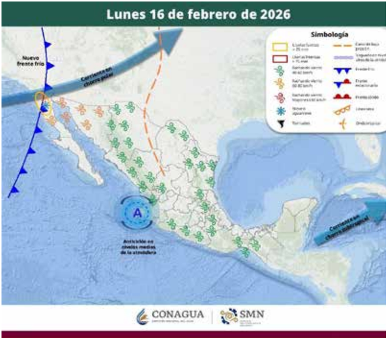
Nuevo frente frío provocará lluvias y rachas de hasta 80 km/h en Sonora.

el ambiente frío, con temperaturas cercanas a los 0 grados Celsius durante el amanecer y la noche en los próximos tres días. Mientras tanto, en el centro, sur y noroeste se mantendrán mañanas frescas. Para el fin de semana se proyecta un ascenso en las temperaturas máximas, con valores estimados entre los 30 y 35 grados Celsius en el centro y sur del estado.