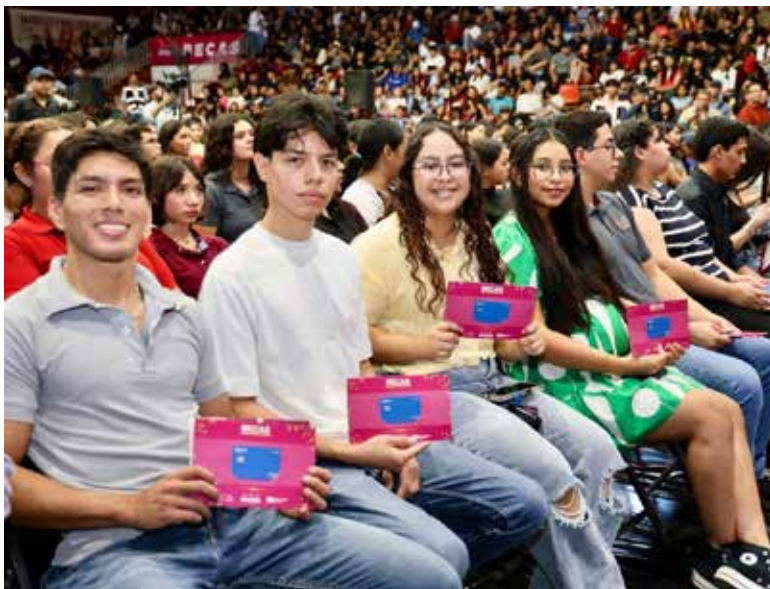
La convocatoria se amplió hasta el 20 de febrero, con el apoyo de la SEC, y el Instituto de Becas y Crédito Educativo.