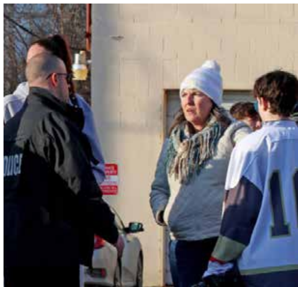
Apuntan a que el atentado tenía un “objetivo” y pudo deberse a una “disputa familiar”, pero no se declaró si las víctimas están emparentadas con el agresor.

Goncalves corroboró las versiones iniciales que apuntan a que el tiroteo tenía un “objetivo” y pudo deberse a una “disputa familiar”,