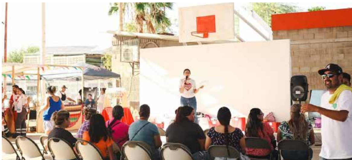
Maratón Corazón llevará servicios gratuitos a Solidaridad IV.