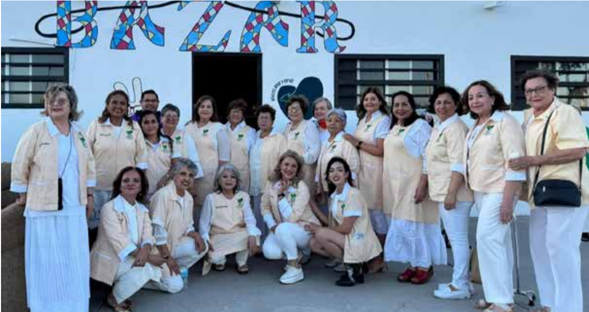
El Club de Leones llevó a cabo la donación de ropa, zapatos, ropa de cama y juegos de mesa al Albergue Santa María de Guadalupe, con el propósito de apoyar a personas en situación vulnerable.

Y reiteraron el llamado a la ciudadanía de Ciudad Obregón a sumarse a estas iniciativas solidarias que generan un impacto positivo en quienes más lo necesitan.