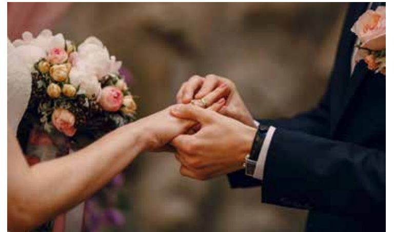
El Gobierno de Sonora, a través del Sistema DIF Municipal en coordinación con la Dirección General del Registro Civil, invita a todas las parejas a participar en la campaña Matrimonios Colectivos Sonora 2026.

cobertura médica continua en el área de urgencias menores, a fin de evitar que pacientes, especialmente niños y adultos mayores, permanezcan sin atención en situaciones que requieren valoración inmediata.