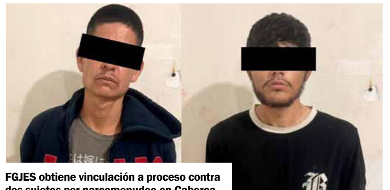
FGJES obtiene vinculación a proceso contra dos sujetos por narcomenudeo en Caborca.