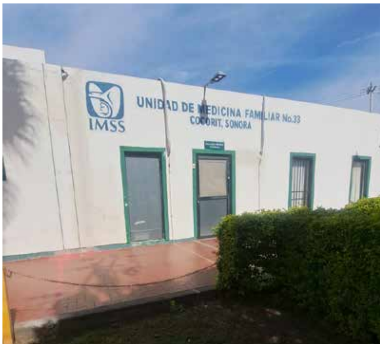
Derechohabientes de la Unidad de Medicina Familiar (UMF) del Instituto Mexicano del Seguro Social (IMSS), ubicada en la comisaría de Cócorit, denunciaron fallas en la atención del área de urgencias médicas menores.

Una derechohabiente relató que su nieto de cinco años sufrió una caída mientras jugaba, lesionándose el brazo. Debido al fuerte dolor, el menor comenzó a vomitar. Al acudir a la unidad médica, el guardia de seguridad