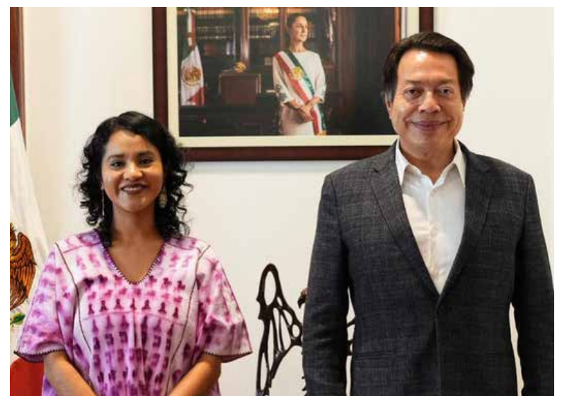
La SEP destaca la trayectoria académica, literaria y cultural de la nueva titular de la Dirección General de Materiales Educativos.

Hija de jornaleros agrícolas oaxaqueños y hablante de lengua mixteca (Nuu Savi), realizó sus estudios en contextos bilingües