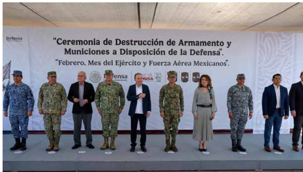
Se refrenda el compromiso del Gobierno de Sonora para seguir con la coordinación interinstitucional y avanzar en el proceso de debilitamiento de las organizaciones criminales.

H ERMOSILLO. Como resultado de acciones firmes de inteligencia intrinstitucional para fortalecer la integridad de las y los sonorenses a través de la Mesa Estatal de Seguridad, el gobernador Alfonso Durazo Montaña encabezó la ceremonia de destrucción de armamento y municiones a disposición de la Secretaría de la Defensa Nacional (Sedena).