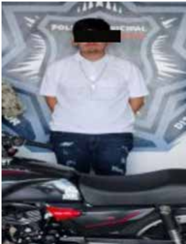
La Secretaría de Seguridad Pública Municipal (SSPM) en recorridos de vigilancia y coordinación con Marina y Policía Estatal, logró la detención de tres personas en hechos distintos ocurridos durante este fin de semana en Cajeme.