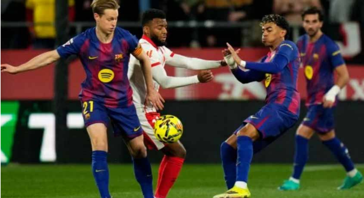
Un penal errado en la recta final del primer tiempo marcó el rumbo del encuentro disputado en Montilivi.

Luego de caer 4-0 en las Semifinales de ida de Copa del Rey frente al Atlético de Madrid, Barcelona regresó a LaLiga para medirse en el Estadio Montilivi al Girona, conjunto que marcha por debajo de la mitad de la tabla en el fútbol