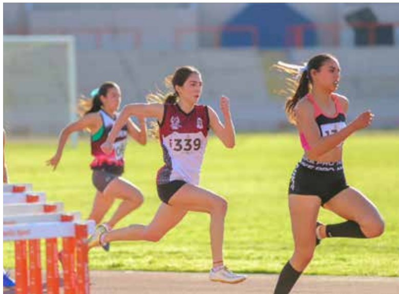
El certamen de tres días permitió a atletas de categorías Sub 16, 18, 20 y 23 buscar marcas para la fase regional en Mexicali.

Según el programa de competencias, en la primera jornada hubo eliminatorias de velocidad en los 80, 100, 300 y 400 metros planos, así como carreras de fondo en 1,500, 2,000 y 5,000 lisos,