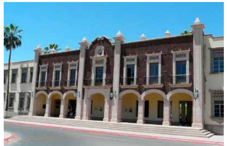
Steus plantea alza salarial y reestructura de tabulador en la Unison.

“Si bien el gremio respalda la política de fortalecimiento al in-