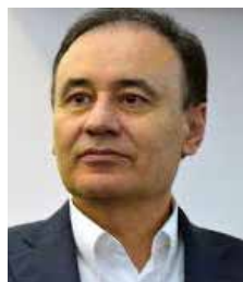
Alfonso Durazo Montaño