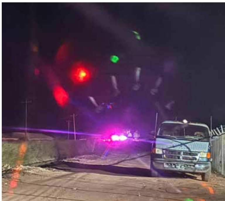
Dos accidentes se registraron en el Valle del Yaqui, dejando varias personas heridas.

Una vez estabilizadas, las víctimas fueron trasladadas a hospitales cercanos para su valoración médica, mientras que la circulación vehicular se vio parcialmente afectada durante las labores de auxilio y el retiro de los vehículos siniestrados.