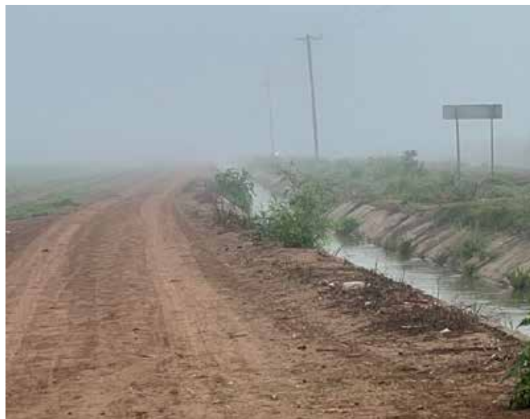
Comparado con ciclos anteriores, el registro de bajas temperaturas es significativamente menor, alertando a productores y técnicos.

Estaciones como Corral (San Salvador), que en 2024-2025 acumulaban 898 horas frío y en 2023-2024 sumaban 634, actual-