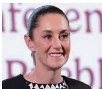
Claudia Sheinbaum Pardo