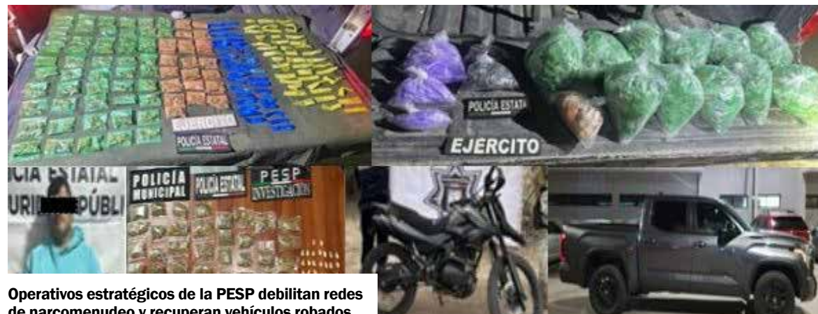
Operativos estratégicos de la PESP debilitan redes de narcomenudeo y recuperan vehículos robados.

En Caborca, durante acciones contra delitos contra la salud, en conjunto con la Policía Municipal, se aprehendió a Horacio "N", de 56 años, a quien se le encontraron 49 envoltorios de marihuana y 51 envoltorios de cristal, hechos registrados en la