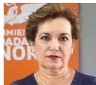
Dolores del Río Sánchez