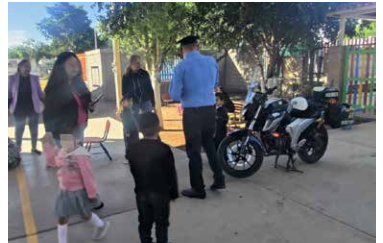
Para fortalecer la cultura de la prevención desde temprana edad, se llevaron a cabo pláticas de vialidad dirigidas a alumnos del Jardín de Niños 'Petra Estrada Martínez'.

Aunado a esto, recientemente sesionó la Mesa de Seguridad, encuentro en el que se acordó continuar con programas preventivos, intensificar la coordinación, mejorar el equipamiento y fortalecer valores, entre otras acciones que no son de orden público.