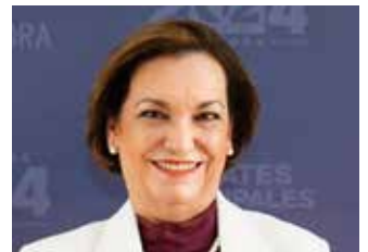
Maria Dolores del Río