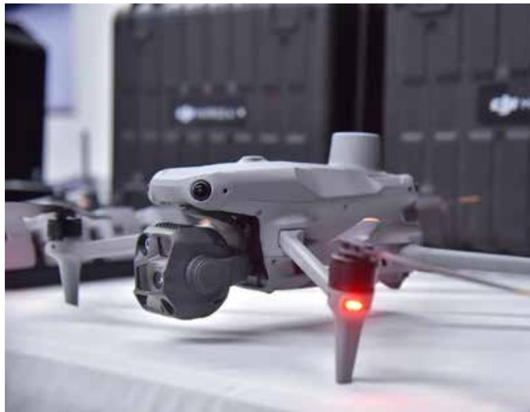
En el municipio de Cajeme se continúa trabajando con el Fideicomiso para la Competitividad con Seguridad.

El presidente municipal mencionó que en los próximos días se espera tener respuesta a la solicitud, ya que con el apoyo se