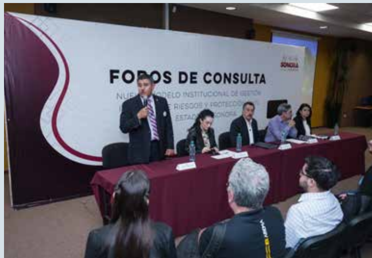
El Instituto Tecnológico de Sonora (Itson) fue sede del segundo Foro de Consulta "Nuevo Modelo Institucional de Gestión Integral de Riesgos y Protección Civil del Estado de Sonora."

Reconoció que, además de los avances normativos, uno de los