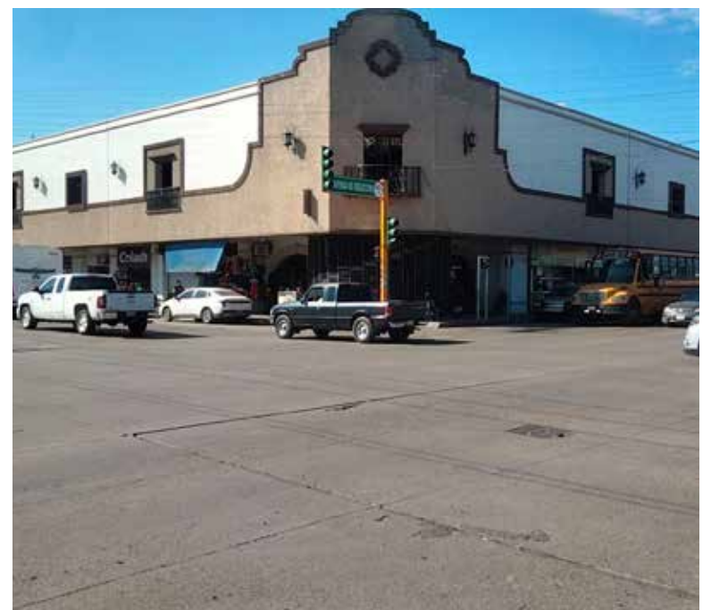
Al 300 mil pesos se requieren para realizar reparaciones en transformadores eléctricos, impermeabilización, rehabilitar el estacionamiento y cambiar focos.

nes, sin embargo, el dar mantenimiento constante es necesario para evitar daños.