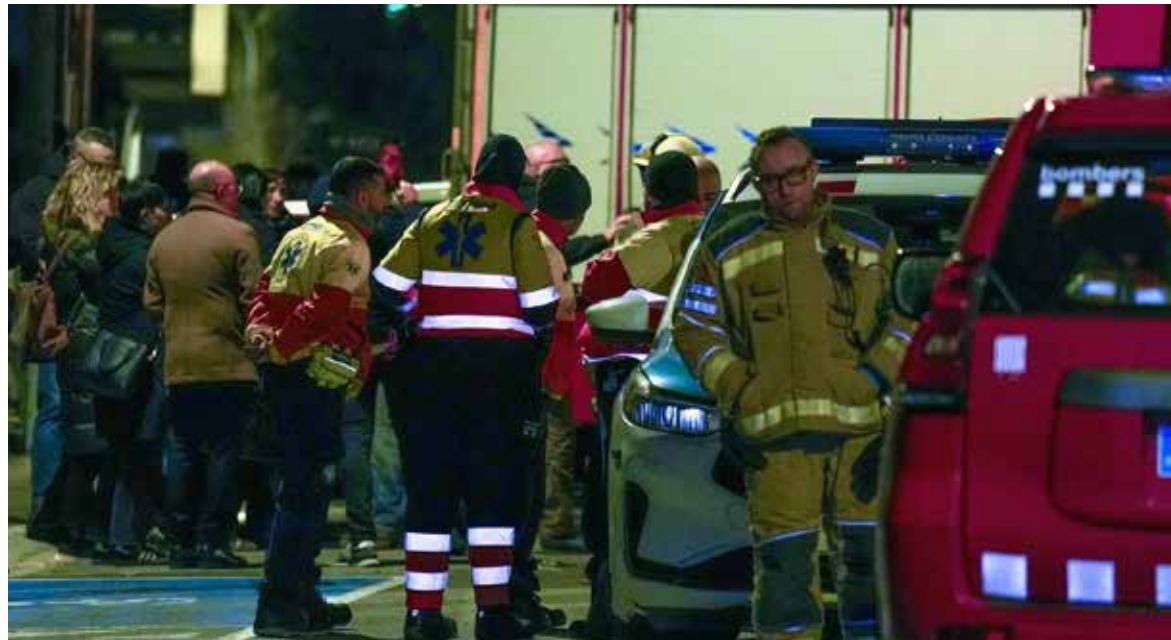
A pesar de los esfuerzos de los equipos, que desplegaron once ambulancias y dos de apoyo psicológico, no ha sido posible salvar la vida de las víctimas.

La tragedia ha quedado al descubierto después de que los Bomberos de la Generalitat recibieran, a las 21:10 horas, varios avisos de vecinos al 112. Según las mismas informaciones difundidas por la cadena de radio, estos alertaban de la presencia de fuego en el piso más alto y de humo en la escalera. La llegada de las dotaciones de