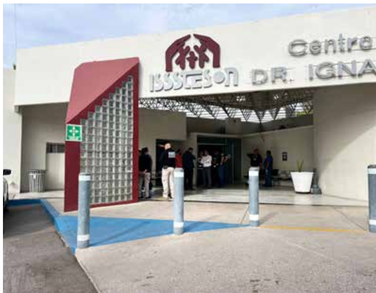
Dos movilizaciones de cuerpos de emergencia se registraron el martes en inmuebles que albergan servicios de salud en la capital sonorense.