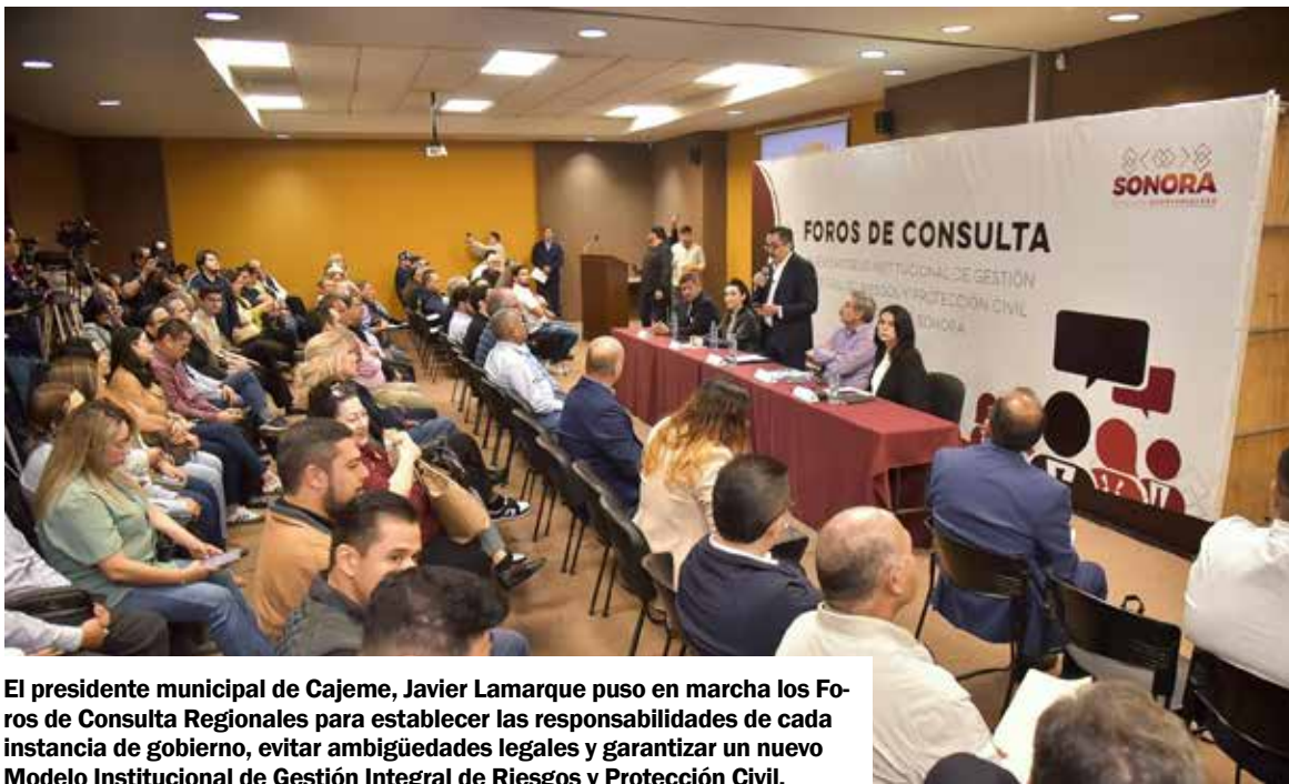
El presidente municipal de Cajeme, Javier Lamarque puso en marcha los Foros de Consulta Regionales para establecer las responsabilidades de cada instancia de gobierno, evitar ambigüedades legales y garantizar un nuevo Modelo Institucional de Gestión Integral de Riesgos y Protección Civil.