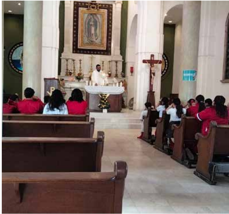
La Diócesis de Ciudad Obregón, hizo un llamado a la comunidad católica a vivir la Cuaresma más allá de simples sacrificios externos.

tido profundo de este periodo no radica solo en la renuncia, sino en una auténtica conversión del corazón.