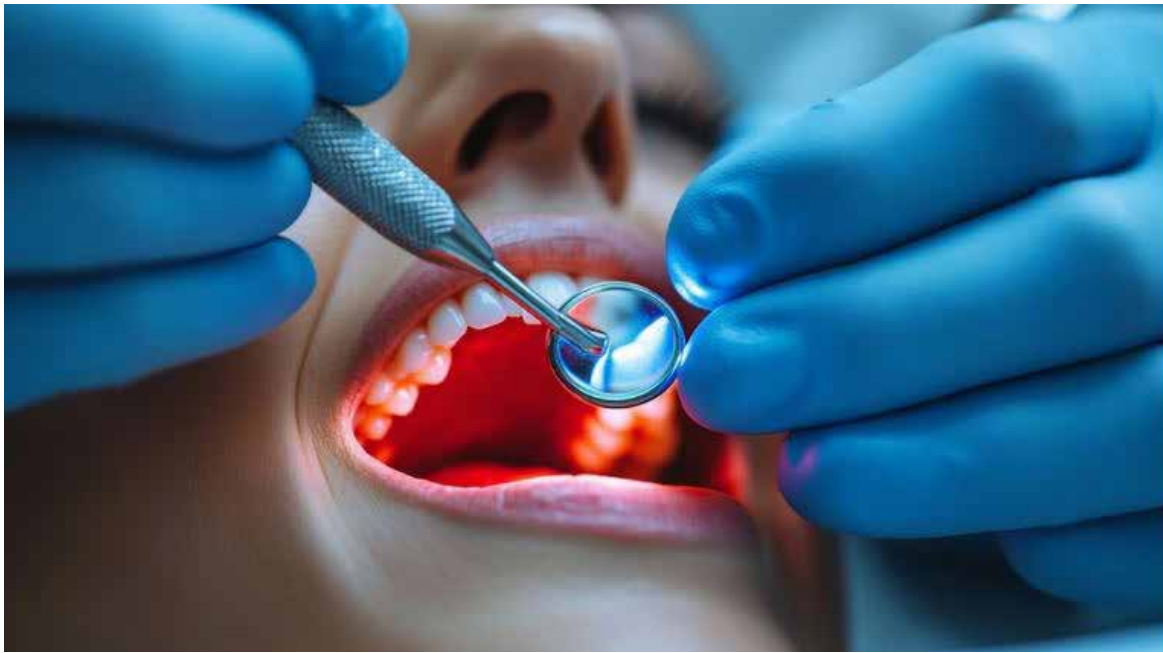
La edad, enfermedades, medicamentos y hábitos como el tabaco pueden modificar la percepción de los sabores.