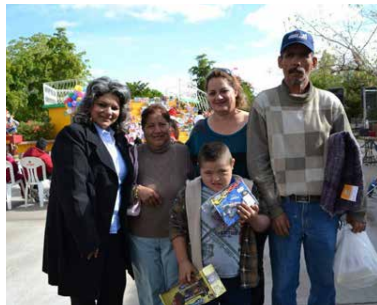
Buscan construir en Hermosillo nuevo albergue para atender a niños con cáncer.

Detalló, que la organización ofrece desde hace más de una