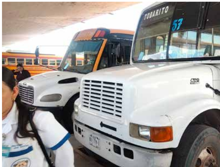
Continúan las gestiones ante el Instituto de Movilidad y Transporte para el Estado de Sonora para solicitar un ajuste a la tarifa del servicio.

El dirigente explicó que la petición se mantiene activa debido a que el último incremento autorizado se otorgó en diciembre de 2020, por lo que consideran necesario actualizar los costos ante el