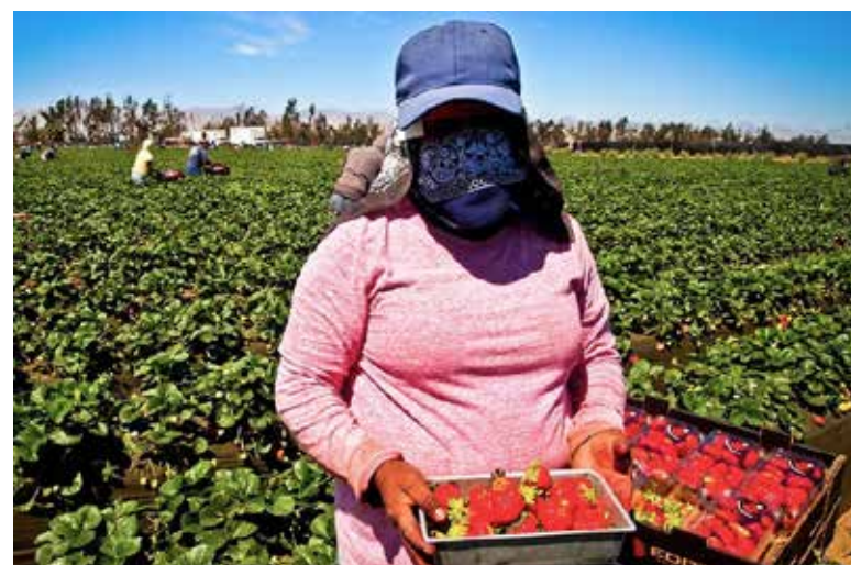
Este día se realizará la cuarta sesión del seminario permanente Población Jornalera Agrícola: Condiciones de Vida, Trabajo y Salud.

Añadió que el objetivo es generar conocimiento académico, pero también fortalecer la vinculación con las comunidades y promover espacios de diálogo donde la audiencia pueda parti-