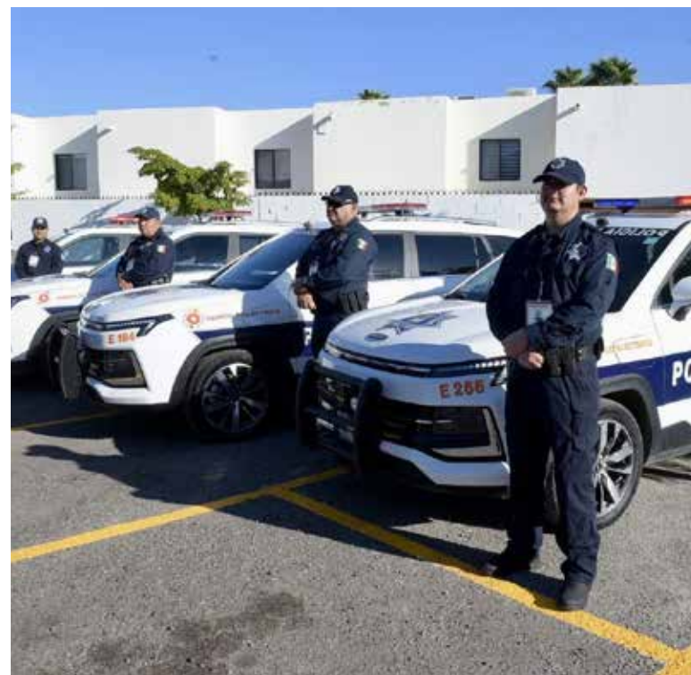
Un sistema de videovigilancia inteligente del Gobierno de Hermosillo que cubrirá tanto la zona urbana de Hermosillo como Bahía de Kino, el Poblado Miguel Alemán, El Tazajal, San Pedro y La Victoria.

El proyecto incluye la instalación de cámaras con analíticos de video que generarán alertas ante patrones de riesgo, así como ron-