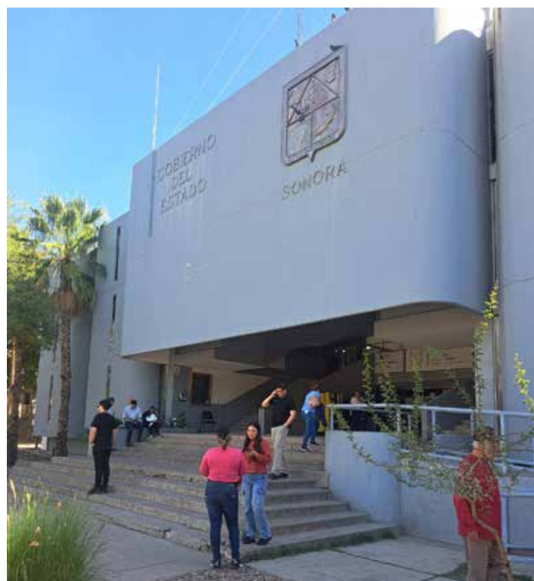
Diariamente, miles de personas acuden a las distintas dependencias instaladas en el inmueble, entre ellas la Agencia Fiscal, el Servicio Nacional del Empleo, la Dirección del Transporte y los Juzgados Cívicos de lo Familiar.