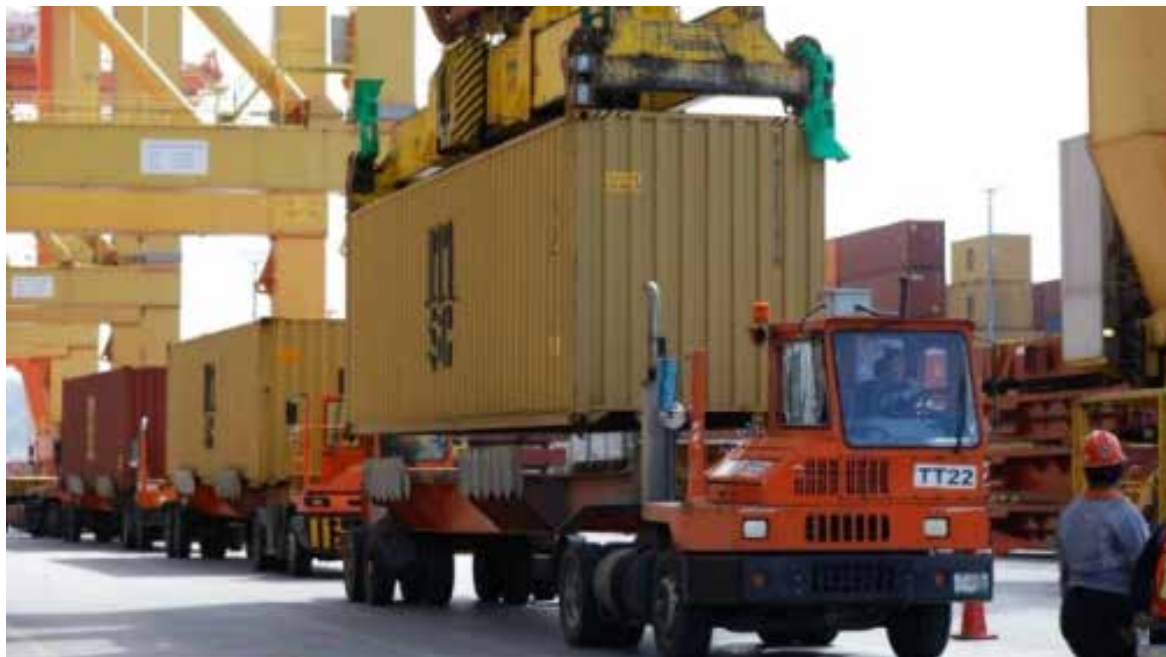
México exportó principalmente vehículos, autopartes y equipos electrónicos a su socio comercial de mayor crecimiento.

de México (BdeM), en 2025 el valor del intercambio comercial con