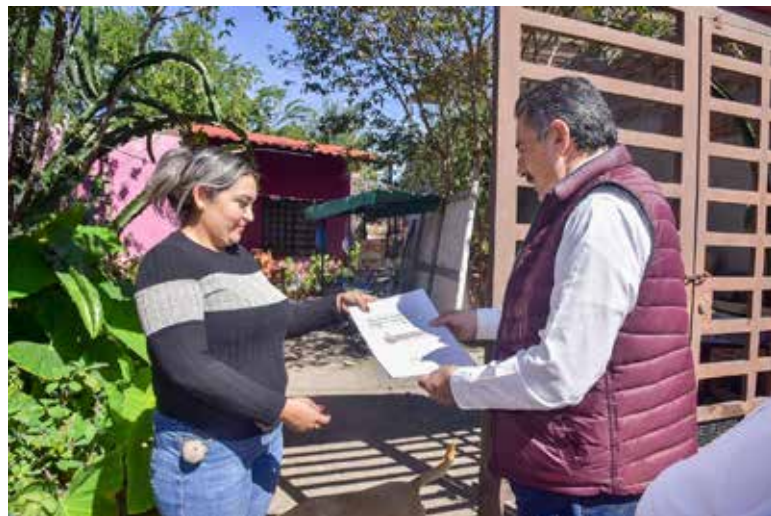
El presidente municipal Javier Lamarque realizó la entrega de escrituras a beneficiarias del programa de regularización que impulsa el Ayuntamiento.

Las entregas se efectuaron en las colonias Los Presidentes y Esperanza Tiznado, al sur de Ciudad Obregón, donde el Alcalde acudió personalmente a los domicilios para hacer entrega de los documentos oficiales que acreditan la propiedad de los inmuebles, brindando con ello certeza jurídica y tranquilidad a las familias