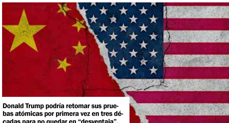
Donald Trump podría retomar sus pruebas atómicas por primera vez en tres décadas para no quedar en “desventaja”.

para “esconder sus actividades del mundo”, Pekín recurrió a técnicas de “desacoplamiento”, como detonar dispositivos a gran profundidad bajo tierra, para que no lo detectaran los sistemas de vigilancia internacionales.