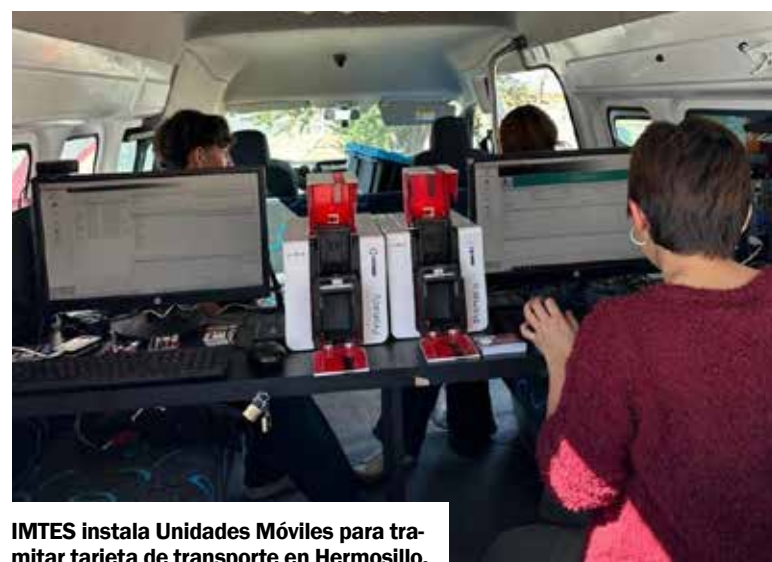
IMTES instala Unidades Móviles para tramitar tarjeta de transporte en Hermosillo.

Sosa Castañeda señaló que las personas que todavía no cuenten con la nueva tarjeta pueden gestionarla también en los Centros