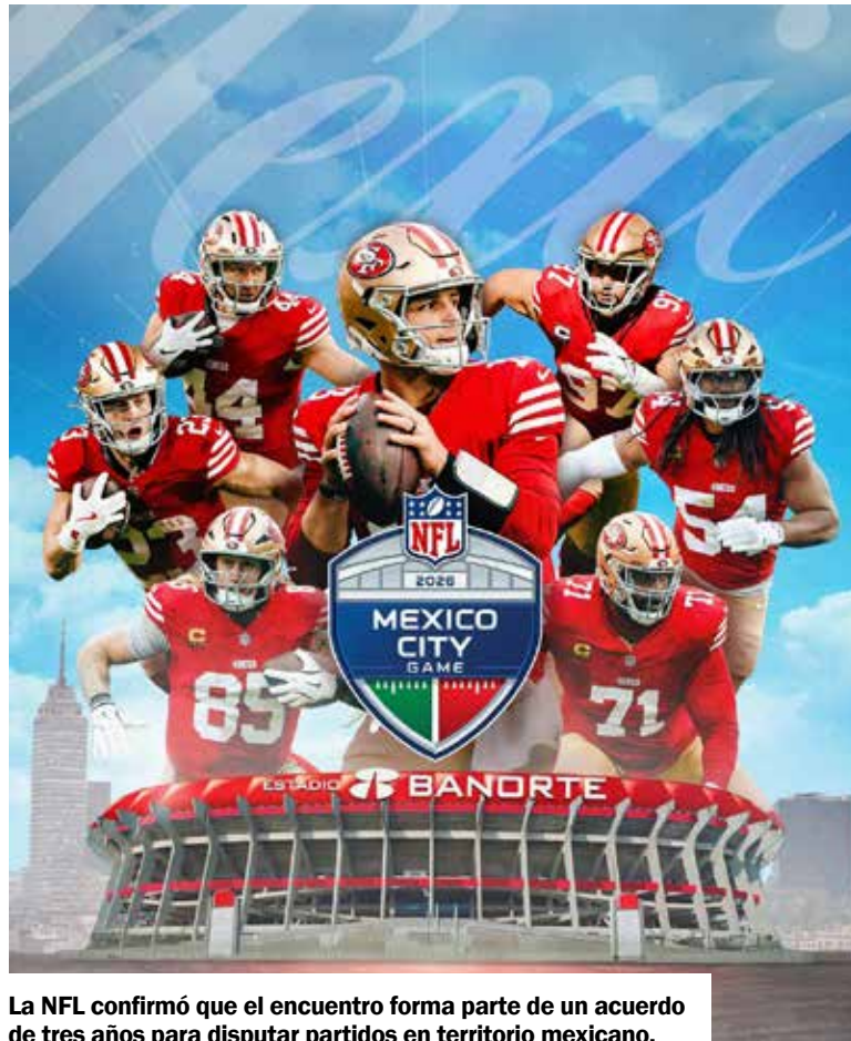
La NFL confirmó que el encuentro forma parte de un acuerdo de tres años para disputar partidos en territorio mexicano.

La NFL ha organizado seis partidos de temporada regular en México desde 2005, cuando San Francisco se enfrentó a los Cardinals en la capital mexicana, en el primer partido internacional de