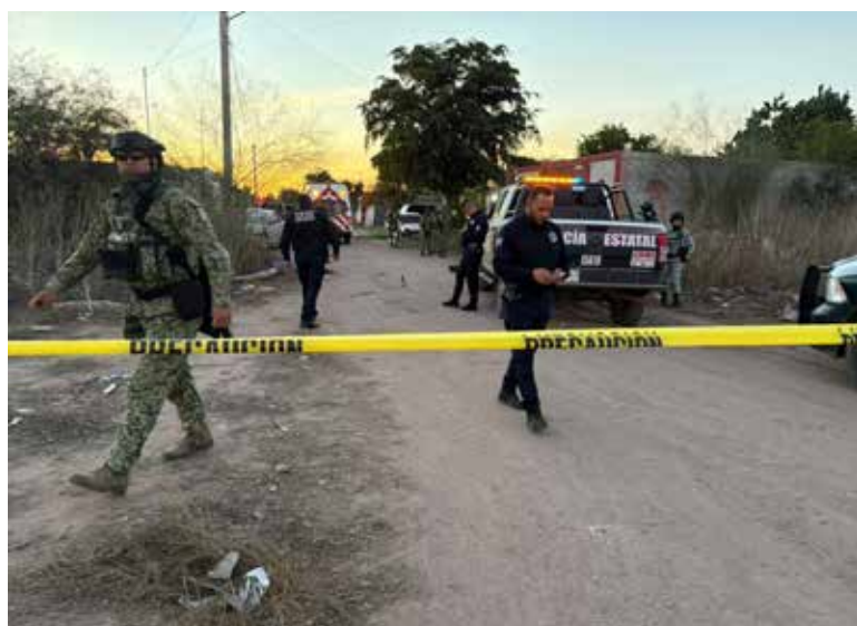
Un joven fue privado de la vida a balazos alrededor de las 17:50 horas del miércoles en la colonia Blanca Ramos, al norte de Ciudad Obregón.

ciones policiacas acudieron al sitio tras el reporte de detonaciones y procedieron a acordonar el área, mientras personal de la Fiscalía