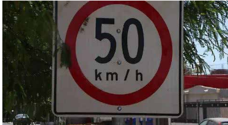
Autoridades municipales reiteraron la necesidad de respetar el límite de velocidad de 50 kilómetros por hora.

‘Pueden provocar hechos irreversibles, un segundo de