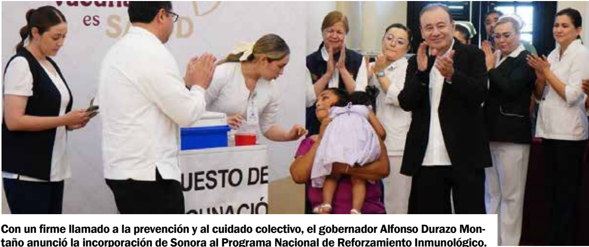
Con un firme llamado a la prevención y al cuidado colectivo, el gobernador Alfonso Durazo Montaño anunció la incorporación de Sonora al Programa Nacional de Reforzamiento Inmunológico.