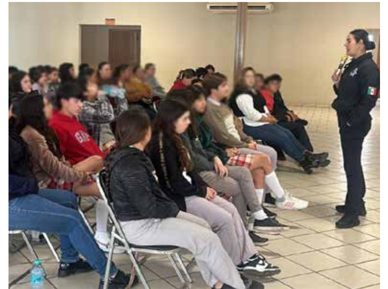
Con el programa Educando SALVA, la Policía Estatal busca concientizar a la población para identificar los tipos de violencia y proteger a las víctimas.

En esta semana, son alrededor de 500 niñas y niños beneficiados con los temas de violencia familiar, fomento a la denuncia a la línea anónima 089 y 9-1-1 de emergencias, acoso, delitos cibernéticos, entre otros temas preventivos.