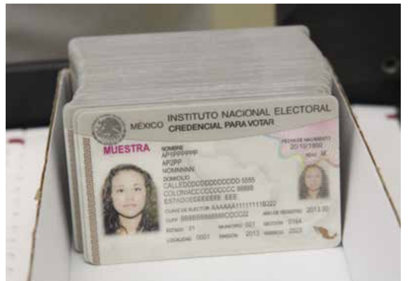
INE Sonora insta a ciudadanos para recoger credenciales del 2024.

manecen sin recoger menos de 1200 credenciales en los Módulos