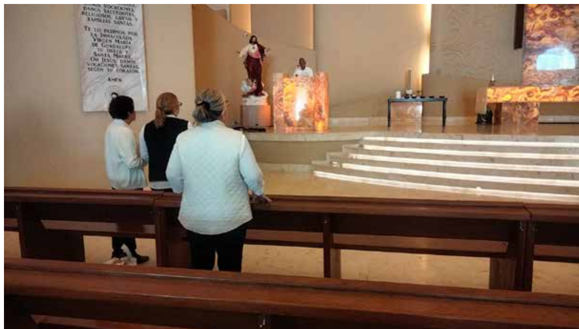
Cajemenses acudieron al Templo de Nuestra Señora de Guadalupe para recibir la tradicional imposición de ceniza.

Desde temprana hora, familias completas, jóvenes y adultos mayores se congregaron en el recinto