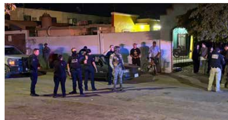
Un ataque armado, en la colonia Nueva Palmira, dejó como saldo un menor de edad lesionado por proyectil de arma de fuego.