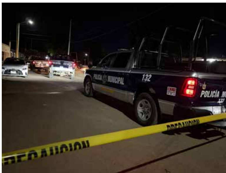
Un ataque armado registrado alrededor de las 20:00 horas del martes dejó como saldo un hombre sin vida en la colonia Villa Bonita.

Elementos de distintas corporaciones policiacas acordonaron