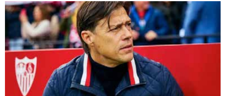
El técnico del Sevilla, Matías Almeyda, fue castigado con siete partidos tras su tarjeta roja en el duelo ante el Alavés en la jornada 24 de LaLiga