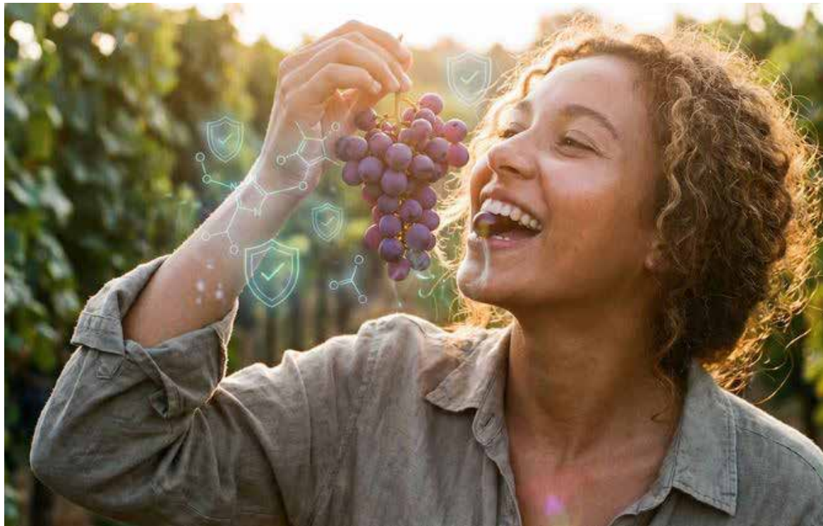
El estudio reveló modificaciones en mecanismos biológicos vinculados con la protección celular y la respuesta ante radiación ultravioleta.

Uno de los focos principales de investigación es el resveratrol,