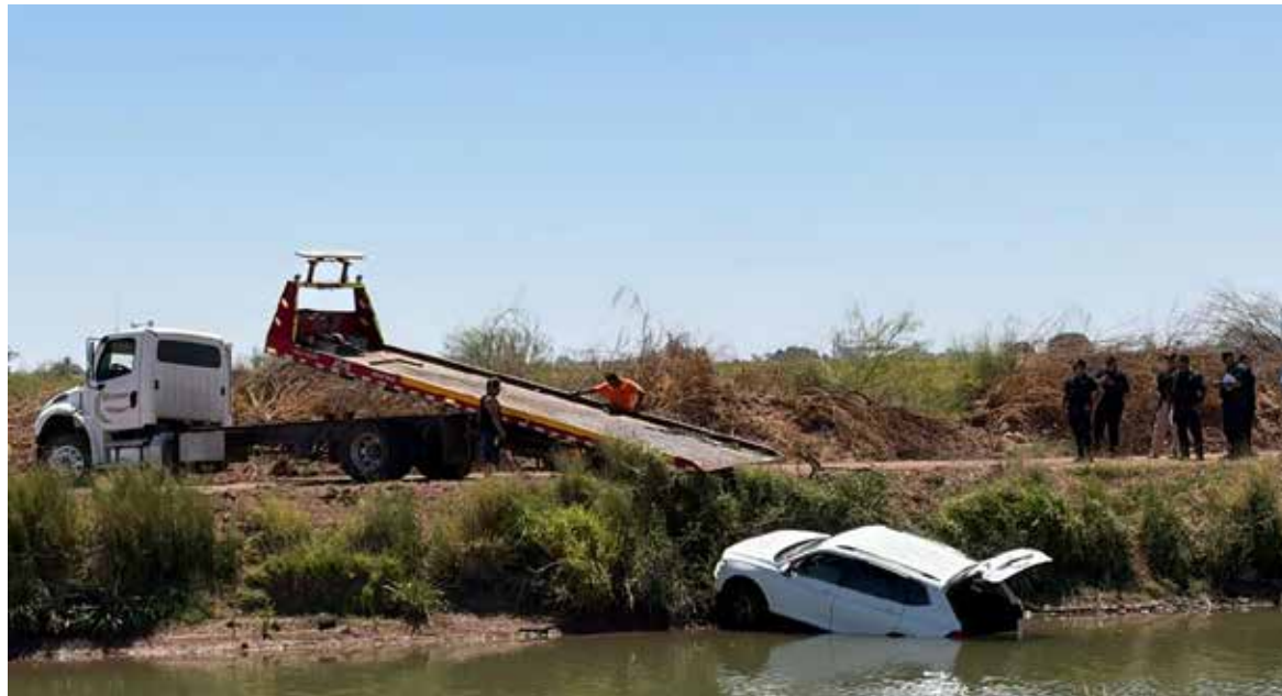
Elementos de Bomberos acuáticos extrajeron un vehículo con una persona fallecida en su interior.

Era una mujer de tez blanca, cabello negro largo. Vestía shorts negro, camiseta blanca con rayas negras y rojas.