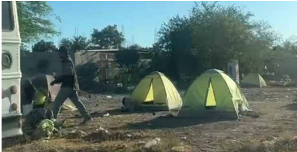
Jornaleros agrícolas sobreviven en campamentos improvisados a las afueras de Pueblo Yaqui.

A simple vista, el lugar muestra casas de campaña levantadas sobre un terreno baldío, algunas cubiertas con sábanas y lonas utilizadas como techumbre para protegerse del sol y el clima. Entre los campamentos también se observan lavaderos