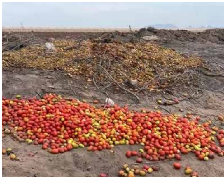
El tomate que se tira es rezaga en el Valle del Yaqui, no es apto para el consumo mucho menos para entregar en donación al Banco de Alimentos.

Expuso que, aunque este caro, se realizan estas acciones por salubridad y porque es justamente la cosecha que no esta buena, por lo que no se puede regalar.