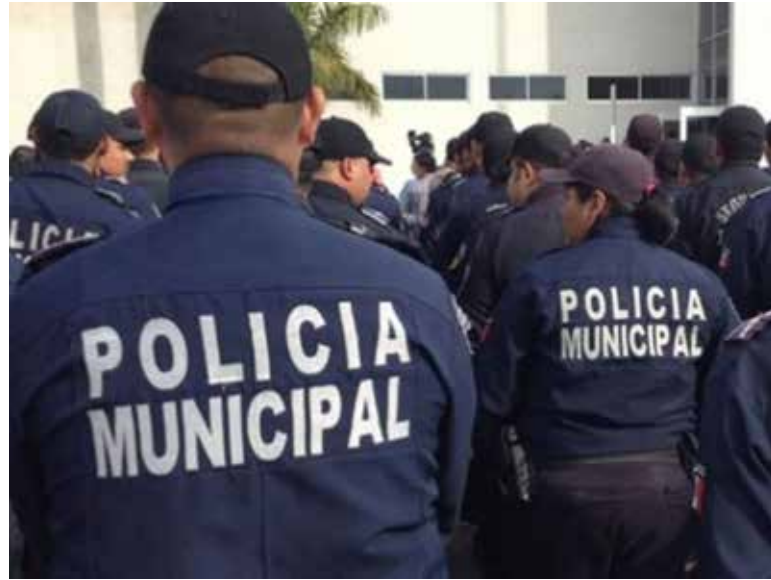
Hasta 30 elementos más de la Secretaría de Seguridad Pública Municipal de Cajeme podrían ser despedidos.

El presidente municipal explicó que este año se proyecta iniciar con 20 despidos, con el propósito de llegar a 30, todo ello con base en la revisión de expedientes y las