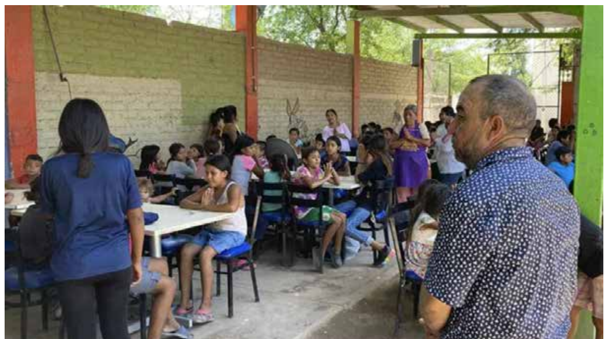
Invitan a apoyar proyecto alimentario para niños en Miguel Alemán Comedor Don Chemo.

un concurso de votaciones de Soluciones de Mi Gente por parte de SEMPRA y pedimos votos, solamente es entrar a la página de Facebook, Soluciones de Mi