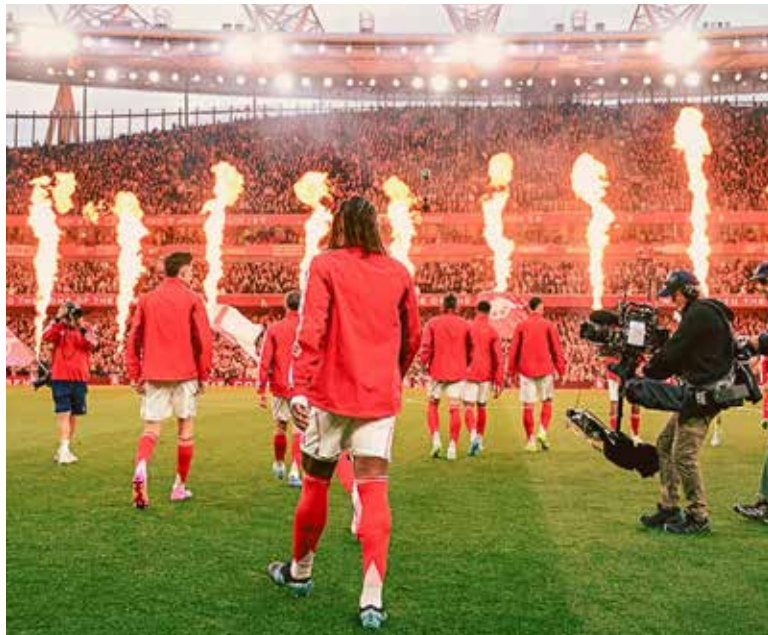
El equipo dirigido por Mikel Arteta rompió una sequía de más de dos décadas sin levantar el trofeo ligero.

El City amenazó con dar otro giro a la situación cuando Erling Haaland marcó en el tiempo de descuento para igualar el gol de