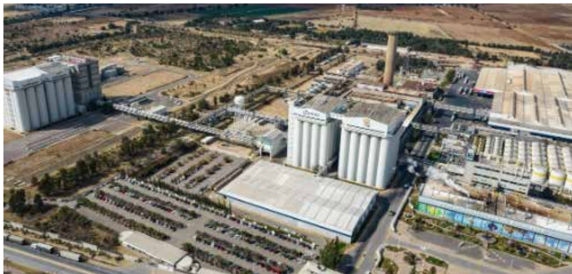
Datos del Inegi anticipan un repunte mensual en la economía durante abril.

El IOAE, un indicador adelantado de la actividad económica de México, anticipó un avance mensual de 0.1 por ciento en marzo y 0.3 por ciento en abril, apoyado de un mejor compor-