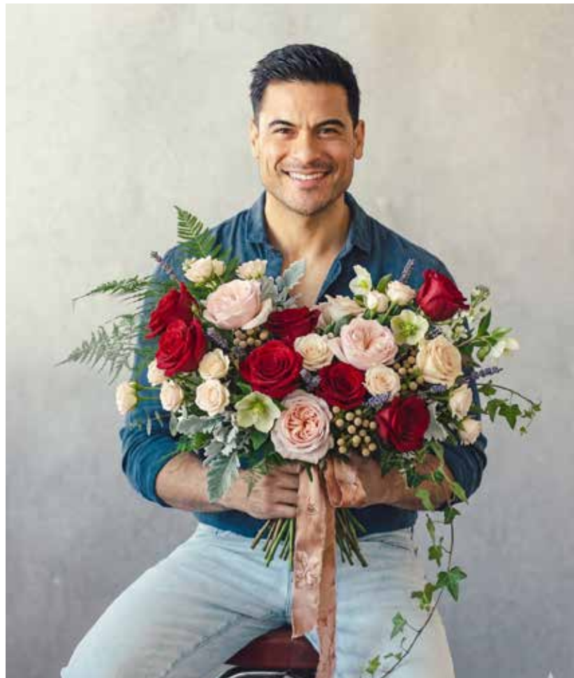
Durante la segunda jornada de las 'Fiestas del Pític 2026' Carlos Rivera engalanará con su romanticismo el 'Foro Rosales'.

Mientras que en la 'Plaza Alonso Vidal' estarán Mau y Ricky, 'Piso 21', 'Gipsy Kings' by André Reyes y 'Ska-rock' de 'El Gran Silencio', en la 'Plaza Bicentenario' se ofrecerá una propuesta alternativa y folclórica encabezada por la renombrada cantante Lila Downs, quien compartirá escenario junto a Nikki Clan, Chetes y diversos ensambles orquestales de gran formato.