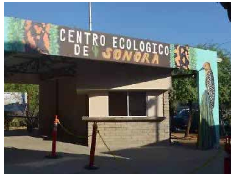
Centro Ecológico de Sonora celebrará 41 años; rehabilitación del acuario concluiría este 2026.

Indicó que los trabajos incluyen adecuaciones en infraestructura hidráulica, mantenimiento de sistemas de filtración, mejoras en áreas de exhibición y renovación de diversos espacios interiores, buscando ofrecer una experiencia más atractiva y funcional para el público.