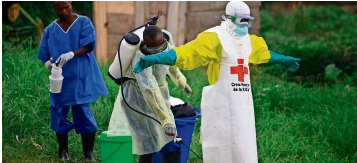
"Ante la ausencia de una vacuna, existen muchas medidas que los países pueden adoptar para detener la propagación de este virus y salvar vidas" mencionaba el director de la OMS.

"Estas cifras cambiarán a medida que se amplían las operaciones sobre el terreno, lo que incluye el refuerzo de la vigilancia, el rastreo de contactos y las pruebas de laboratorio", ha dicho, antes de alertar de que "se han notificado casos en