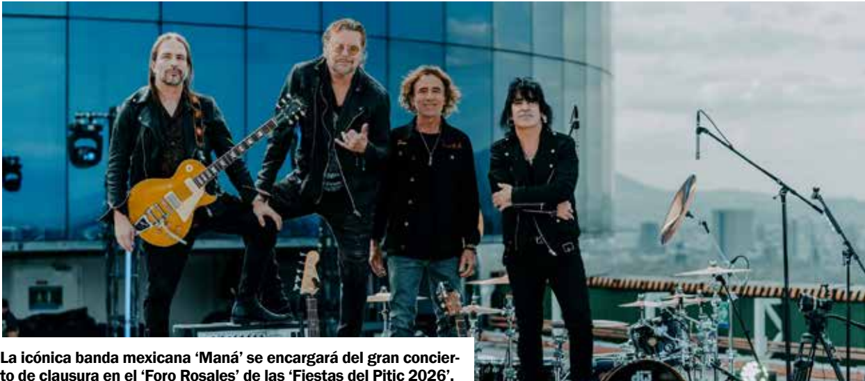
La icónica banda mexicana 'Maná' se encargará del gran concierto de clausura en el 'Foro Rosales' de las 'Fiestas del Pític 2026'.