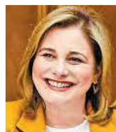
María Eugenia Campos