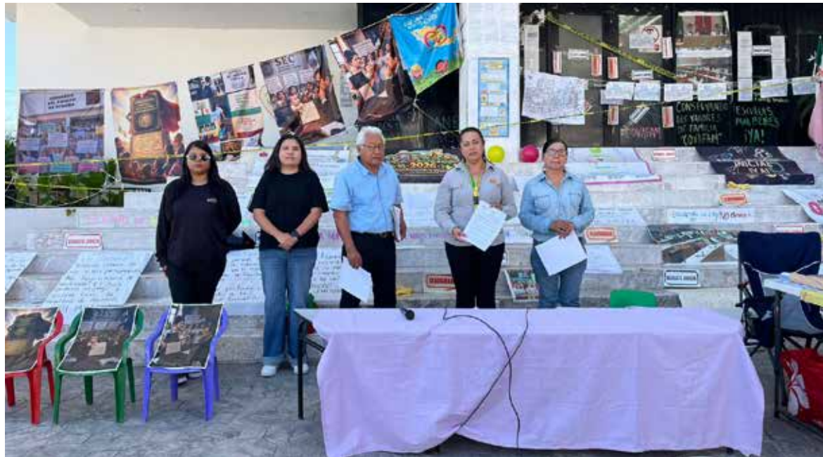
Inician maestras de estancias infantiles huelga de hambre por omisiones en educación inicial en Sonora.

En un manifiesto leído en plaza pública, la representante de la Sistema Estatal de Educación Inicial "SISEIN" y del colectivo "Conservando los Valores de Familia", señaló que la decisión surge tras agotar —sin resultados— mesas