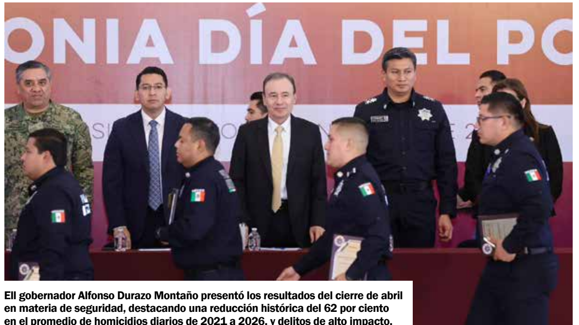
El gobernador Alfonso Durazo Montaño presentó los resultados del cierre de abril en materia de seguridad, destacando una reducción histórica del 62 por ciento en el promedio de homicidios diarios de 2021 a 2026, y delitos de alto impacto.