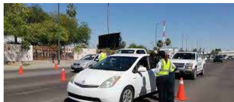
El Gobierno de Hermosillo se encuentra listo con el operativo que incluye un despliegue en materia de seguridad, protección civil, limpieza, emergencias y esparcimiento en Fiestas del Pitic 2026 del 21 al 24 de mayo.

meros auxilios la Dirección General de Salud Municipal trabajará en coordinación con Cruz Roja Mexicana y asociaciones civiles con 117 elementos entre personal médico, enfermería y 13 ambulancias, así como dos clínicas móviles equipadas con consultorios.