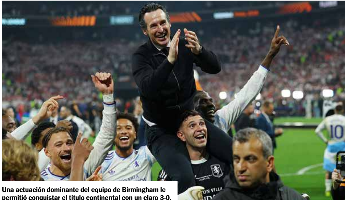
Una actuación dominante del equipo de Birmingham le permitió conquistar el título continental con un claro 3-0.

El partido comenzó con un ritmo intenso, aunque con cierta cautela inicial por parte de ambos equipos. Sin embargo, el Villa fue ganando metros con el paso de los minutos y encontró premio en el tramo final del primer tiempo. Al minuto 41, Yuri Tielemans abrió el marcador