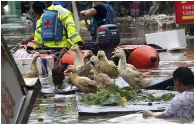
Las autoridades gubernamentales asignaron 120 millones de yuanes (17,6 millones de dólares) en fondos de ayuda para desastres a cinco regiones afectadas.

Se reportaron cinco muertos y otros 11 desaparecidos en la provincia central de Hunan, informó el miércoles la agencia estatal de noticias Xinhua.