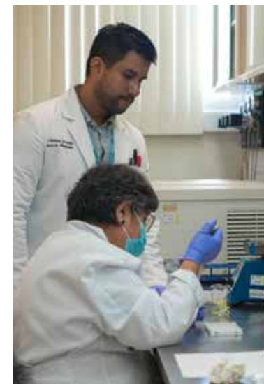
La SSP señaló que mantiene vigilancia epidemiológica permanente y revisa todos los días la información emitida por organismos internacionales de salud.

se propague fuera de esa región se considera bajo.