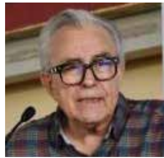
Rubén Rocha Moya