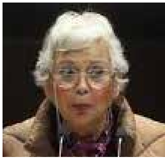
Olga Sánchez Cordero