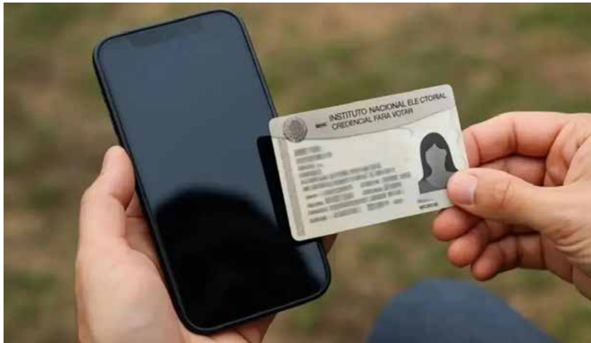
Advierten suspensión de líneas celulares no registradas a partir del 1 de julio.

La funcionaria explicó que la medida busca combatir delitos como extorsiones, fraudes y suplantación de identidad, princi-