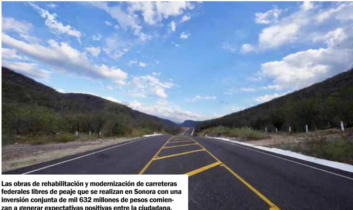
Las obras de rehabilitación y modernización de carreteras federales libres de peaje que se realizan en Sonora con una inversión conjunta de mil 632 millones de pesos comienzan a generar expectativas positivas entre la ciudadanía.