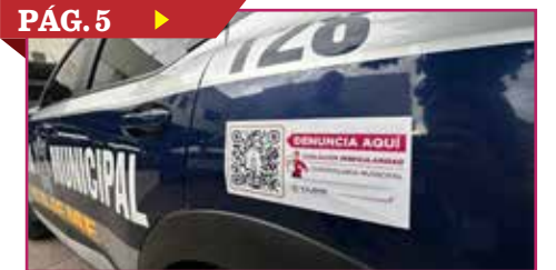
COLOCAN CÓDIGOS QR EN PATRULLAS