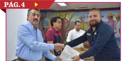
ENTREGAN PERMISOS Y PLACAS A TRANSPORTISTAS