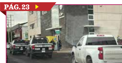
CAE RAYO CERCA DE UNA ESCUELA