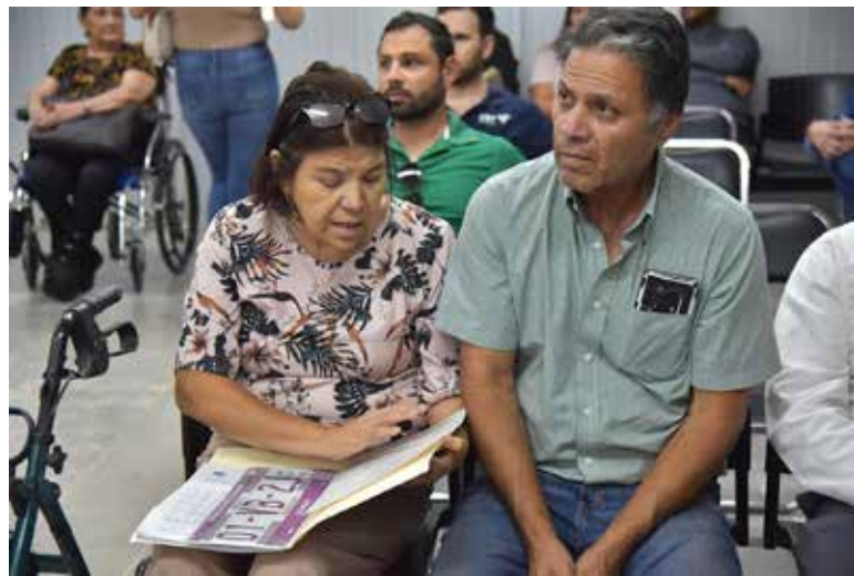
El presidente municipal Javier Lamarque, en compañía del Delegado de la Secretaría de Infraestructura, Comunicación y Transporte (SICT), Máximo Moscoso, entregaron en Cajeme 28 permisos para diversos servicios de autotransporte federal.

Previo a la entrega de la documentación, el Alcalde Javier Lamarque reconoció la voluntad de servicio y la disposición para atender los requerimientos de las