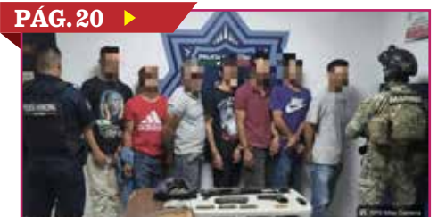
CAE CÉLULA ARMADA EN LA COLONIA BELTRONES