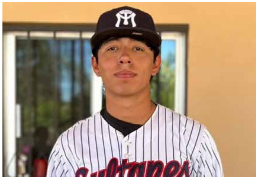
El pitcher de 17 años avanza en su carrera deportiva al integrarse a una academia de desarrollo de talento de alto rendimiento.