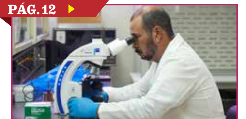
REFUERZAN VIGILANCIA POR BROTE DE ÉBOLA