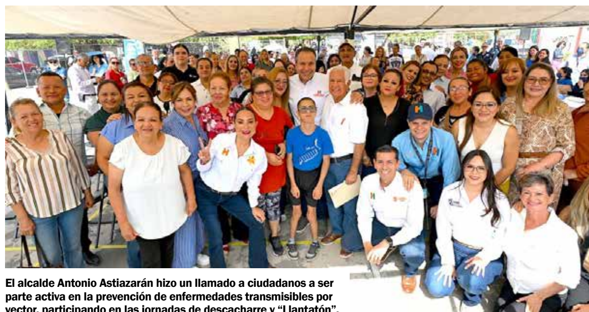
El alcalde Antonio Astiazarán hizo un llamado a ciudadanos a ser parte activa en la prevención de enfermedades transmisibles por vector, participando en las jornadas de descacharre y "Llantatón".

y atención psicológica, por parte de personal de Salud Pública Municipal.