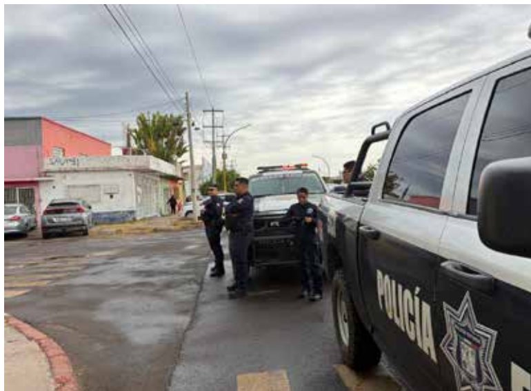
La caída de un rayo sobre un transformador subterráneo de la Comisión Federal de Electricidad provocó un apagón que dejó sin energía eléctrica diversos sectores de la ciudad, generando evacuaciones, afectaciones en negocios y caos vehicular.

cuerpos de emergencia, entre ellos personal de Protección Civil, paramédicos de Cruz Roja Mexicana y elementos del Departamento de Bomberos de Cajeme.