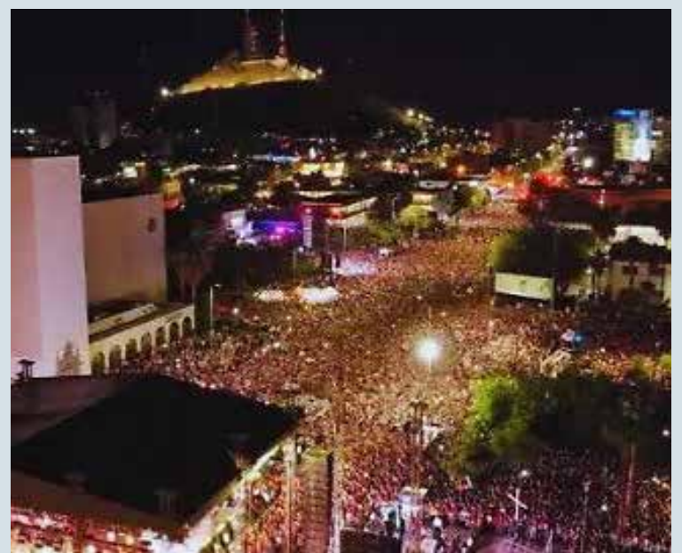
Policía de Hermosillo desplegará operativo especial para las Fiestas del Pitic 2026.

Asimismo, recomendó a los asistentes no dejar objetos de valor visibles dentro de los vehículos, asegurarse de cerrarlos correctamente, utilizar bastón