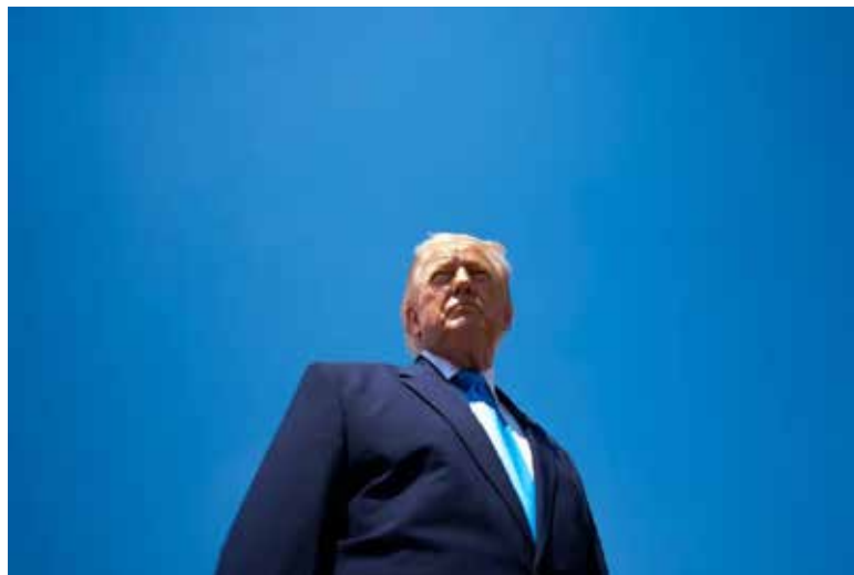
El Ministerio de Relaciones Exteriores de China declaró el jueves que “se opone firmemente a los intercambios oficiales” entre Estados Unidos y Taiwán.

Si se produjera esa conversación, sería la primera vez que los presidentes en ejercicio de Taiwán y Estados Unidos hablan entre sí desde que Washington cam-