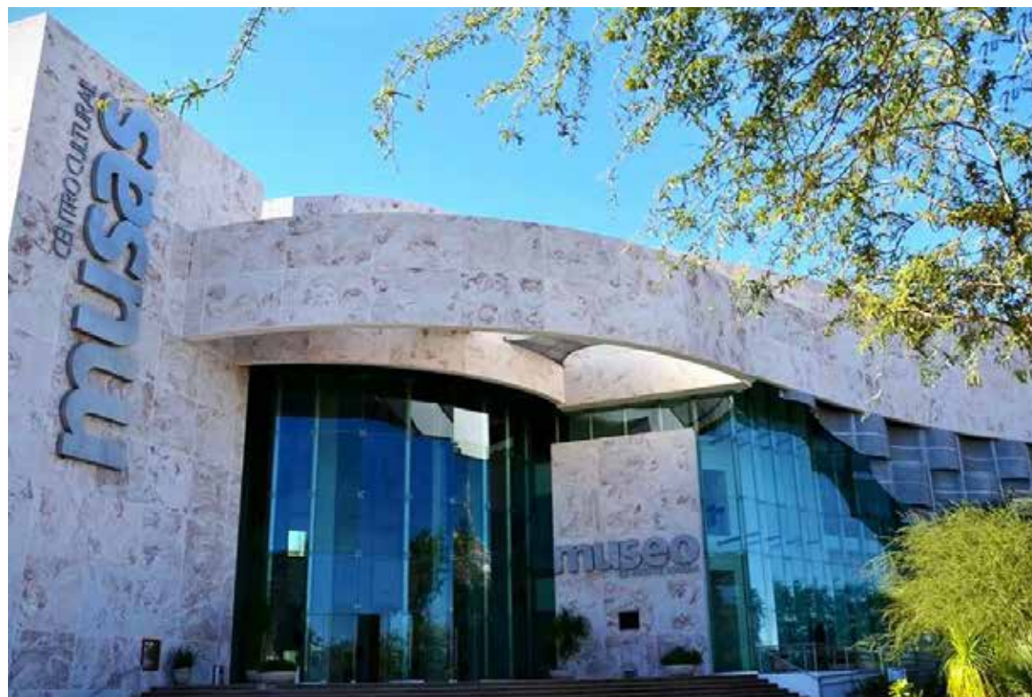
Museos de Hermosillo ofrecerán actividades gratuitas por el Día Internacional de los Museos.

Entre las actividades destaca el recorrido guiado por la exposición "Otra manera de ser hu-