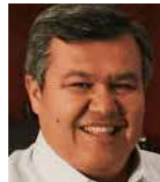
Octavio Almada Palafox

aspecto administrativo, la conducción del Poder Judicial se ha convertido en una posición estratégicamente sensible frente al nuevo modelo judicial que se perfila en el país. También será importante observar cómo se reacomodan los grupos internos dentro del tribunal, especialmente en un contexto donde las futuras elecciones judiciales podrían modificar dinámicas históricas de operación y poder. Por lo pronto, el anuncio de Acuña Griego adelanta que el proceso sucesorio dentro del Poder Judicial sonoreño ya comenzó, aunque todavía se maneja con discreción.