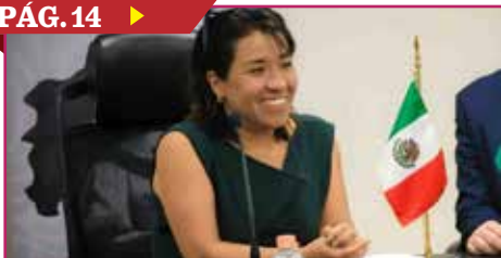
TITULAR DE SADER VISITARÁ SONORA