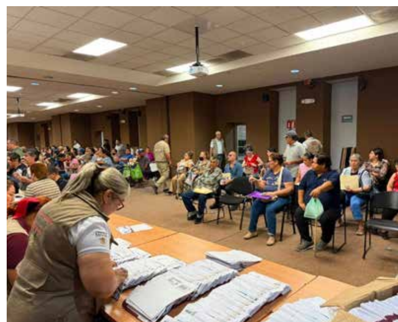
Culminó la entrega de tarjetas bancarias, para las personas que realizaron el trámite de la Pensión para el Bienestar de las Personas con Discapacidad.

más para brindar oportunidad a las y los beneficiarios que no pudieron acudir durante la semana.