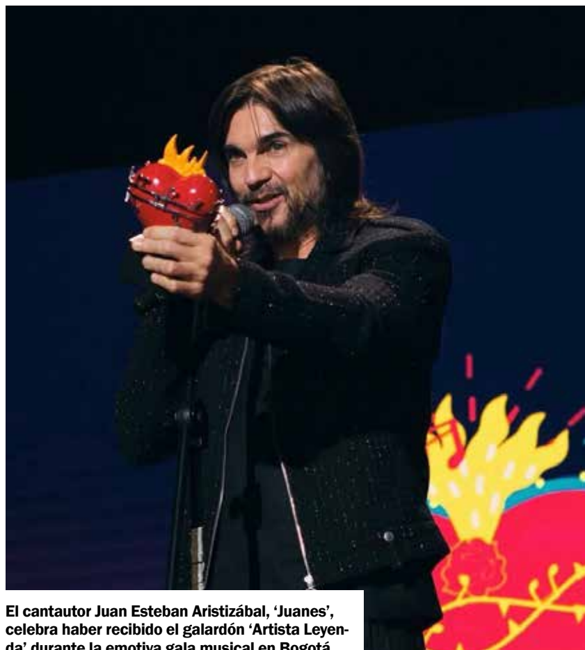
El cantautor Juan Esteban Aristizábal, 'Juanes', celebra haber recibido el galardón 'Artista Leyenda' durante la emotiva gala musical en Bogotá.