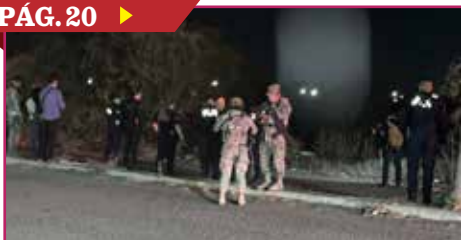
HALLAN UN 'ENCOBIJADO' EN URBI VILLA DEL REAL