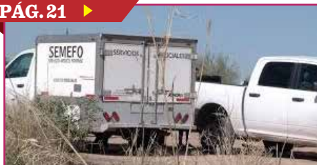
LOCALIZAN HOMBRE SIN VIDA EN BALDÍO