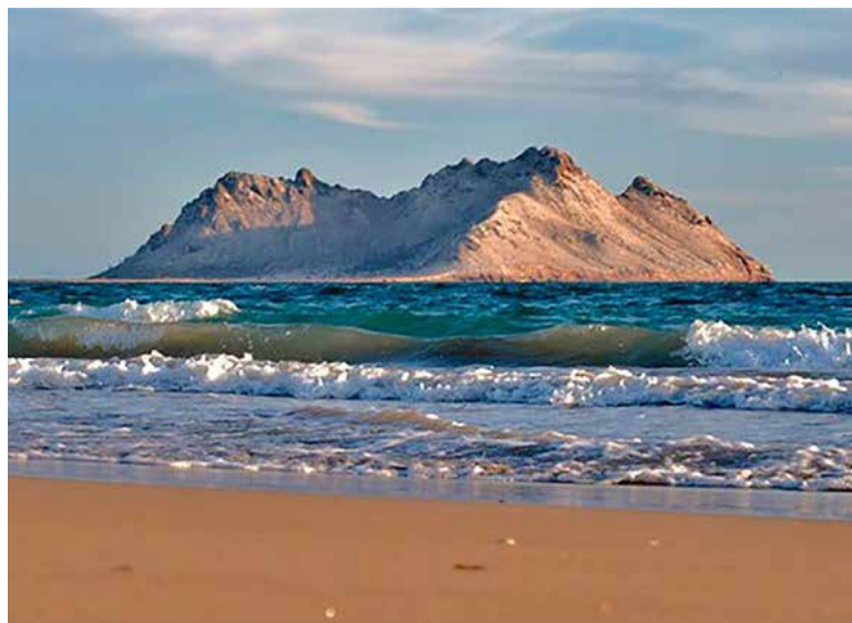
Invitan a votar por Kino 360 para fortalecer Bahía de Kino.

“La iniciativa contempla promover mejores condiciones para residentes y visitantes, además de fortalecer la imagen turística de Bahía de Kino como uno de los principales destinos de Sonora. Para participar, las personas deben ingresar al portal oficial del