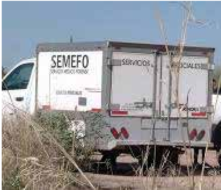
El cuerpo sin vida de un hombre fue localizado por integrantes del colectivo Buscadoras por la Paz Sonora en un terreno baldío, del surponiente de Hermosillo.

Vestía pantalón oscuro, cinturón negro y camiseta de manga corta en tonos gris y café. Como señas particulares, portaba una pulsera de cuentas claras en la muñeca derecha y un collar o rosario de color verde. El abdomen se encontraba parcialmen-