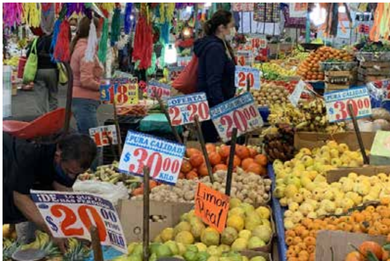
Insumos agrícolas como fertilizantes y granos muestran tendencia al alza en mercados internacionales.

las minutas no identifican con nombre al miembro que hace los comentarios, precisó que los fertilizantes nitrogenados, que representan más de la mitad del total utilizado en el país, se encuentran entre los insumos más expuestos al choque geopolítico, aunque los calendarios agrícolas apuntan a que un eventual impacto sobre la inflación no se observaría en el corto plazo.