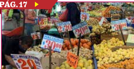
PREVEN ALZA EN LOS PRECIOS DE ALIMENTOS