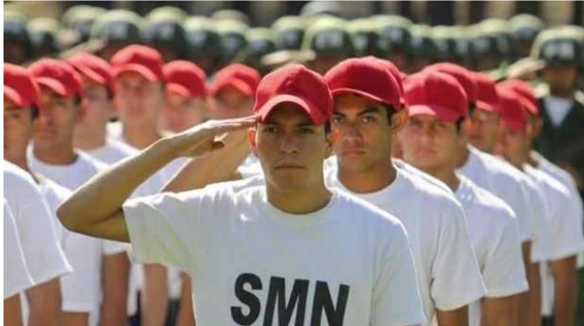
Invitan a jóvenes a liberar su cartilla militar en tres meses en modalidad encuadrado.

HERMOSILLO. La Comandancia de la 4/a Zona Militar, a través del 73/o Batallón de Infantería, lanzó una invitación dirigida a jóvenes que aún no han liberado su cartilla militar para incorporarse al Servicio Militar Nacional en la modalidad encuadrado, la cual se realiza en la ciudad de Tijuana, Baja Ca-