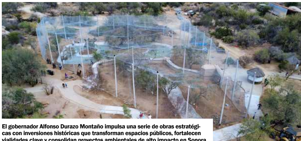
El gobernador Alfonso Durazo Montaña impulsa una serie de obras estratégicas con inversiones históricas que transforman espacios públicos, fortalecen vialidades clave y consolidan proyectos ambientales de alto impacto en Sonora.