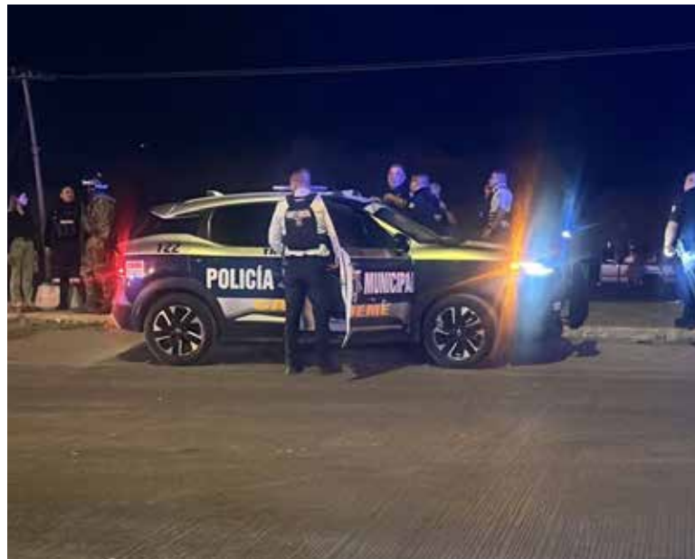
De manera extraoficial comenzaron a circular los nombres de los presuntos internos lesionados durante la riña registrada al interior del Cereso de Ciudad Obregón.

oficiales, el saldo preliminar fue de un interno sin vida y al menos cinco personas lesionadas, aunque algunas versiones periodísticas hablan de hasta seis o siete heridos.