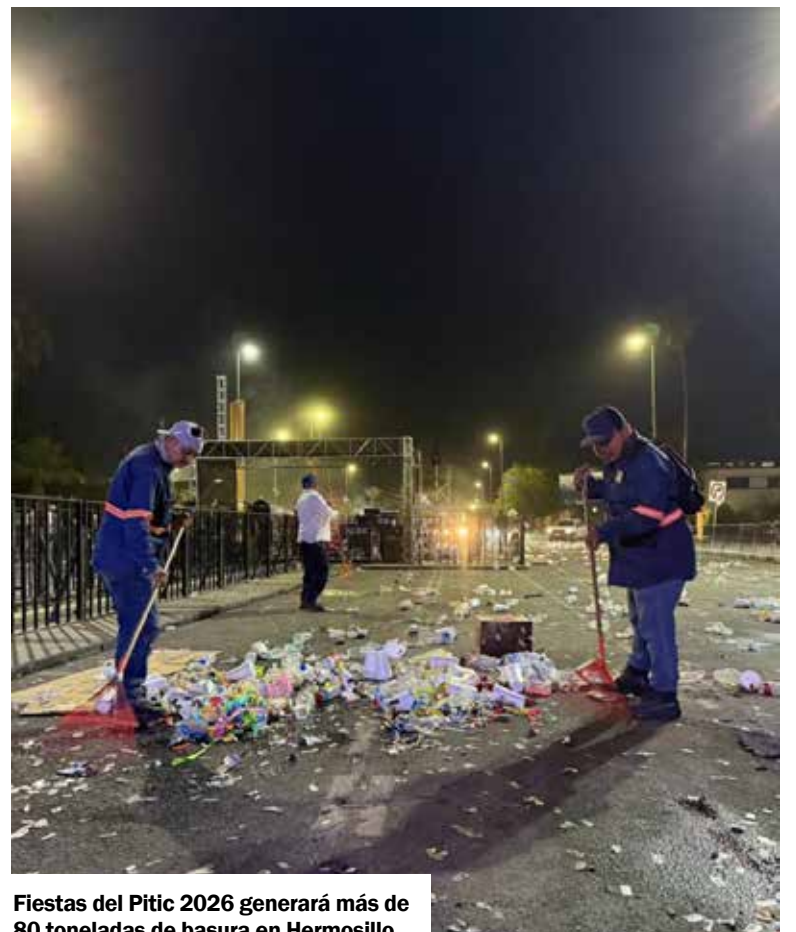
Fiestas del Pitic 2026 generará más de 80 toneladas de basura en Hermosillo.

De acuerdo con Pavlovich Escalante, los residuos que más se generan durante las celebraciones son vasos desechables, botellas