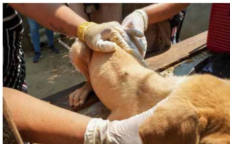
El Gobierno de Sonora, a través de la Secretaría de Salud (SSP), continúa fortaleciendo las acciones integrales y territoriales para la prevención y combate de la Fiebre Manchada por Rickettsia rickettsii .

La Secretaría de Salud también fortaleció la promoción de la salud a través de la distribución de 10 mil 939 materiales impresos con información preventiva so-