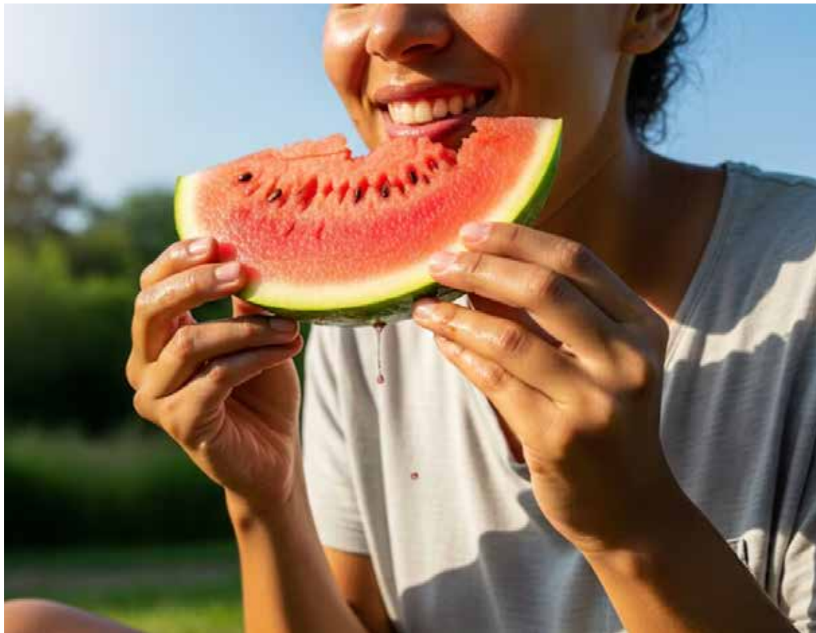
Investigaciones sugieren que esta fruta puede contribuir a una dieta más completa y al cuidado del corazón.

El estudio también sugiere que incorporar esta fruta puede ser una estrategia útil para acercarse a las recomendaciones oficiales de consumo de fruta, que oscilan entre una y media y dos