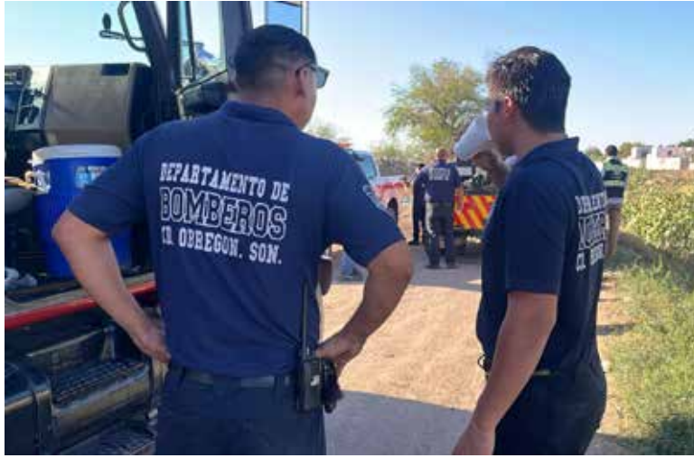
Elementos del cuerpo de Bomberos especializados en el manejo y retiro de materiales químicos acudieron la tarde del domingo a un reporte sobre varios sobres que, al parecer, contenían plaguicidas.

C UADRA OBREGÓN. Elementos del cuerpo de Bomberos especializados en el manejo y retiro de materiales químicos acudieron la tarde del domingo a un reporte sobre varios sobres que, al parecer, contenían plaguicidas y que se encontraban esparcidos sobre la calle 10, entre la calzada y la calle No Reelección.