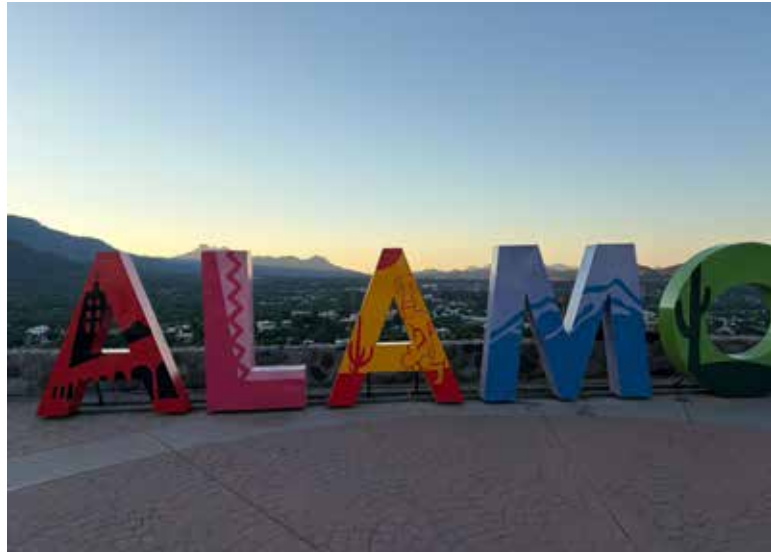
El turismo en Álamos comenzó a resentir los efectos de la temporada cálida, con fines de semana más 'flojos' y menor movimiento de visitantes.

La directora de Turismo en Álamos explicó que el cambio radical en el clima suele provocar una baja temporal en la afluencia turística, aunque confían en una