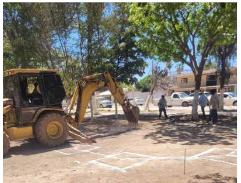
La comunidad del Campo 5 contará con su propio kiosco.

Asimismo, se reconoció la participación de Lolita Castro por las