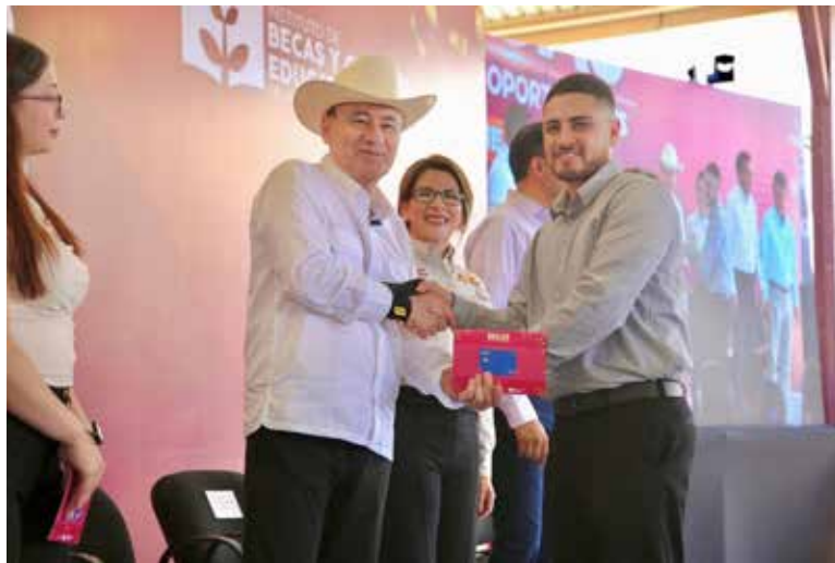
El Gobierno de Sonora puso en marcha el proceso “Prepason 2026-2027”, mediante el cual se garantizarán más de 44 mil espacios en preparatorias públicas bajo criterios de inclusión, equidad y cercanía.

El mandatario estatal señaló que con una inversión histórica de 328.5 millones de pesos, respaldada por la presidenta Sheinbaum, Sonora ampliará la cobertura educativa con nuevos planteles, más espacios y un modelo de asignación más justo