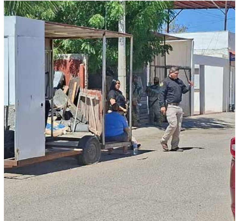
Un hombre resultó lesionado por arma de fuego y fue trasladado a recibir atención médica el mediodía del domingo.

La zona fue asegurada por las autoridades mientras personal de investigación realiza las diligencias correspondientes para esclarecer la agresión y dar con los responsables.