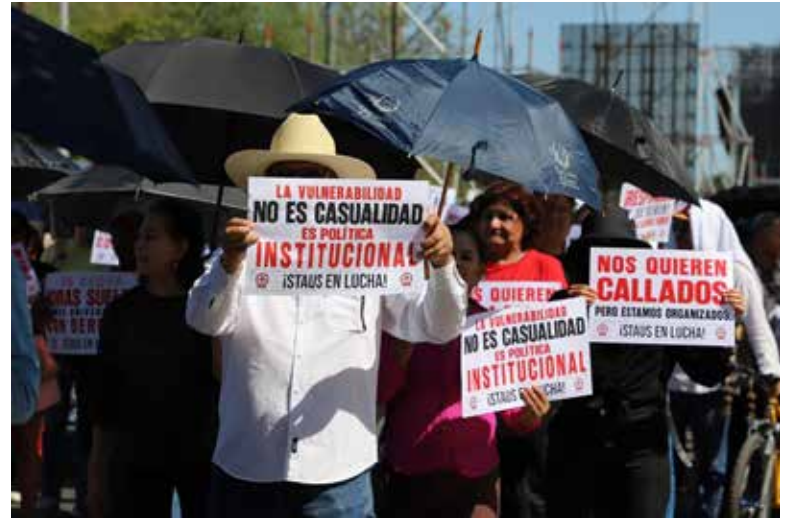
Universidad de Sonora presenta nueva propuesta salarial 2026 al STAU.

El paquete económico también contempla mejoras en diversas prestaciones, entre ellas apoyos médicos, fortale-