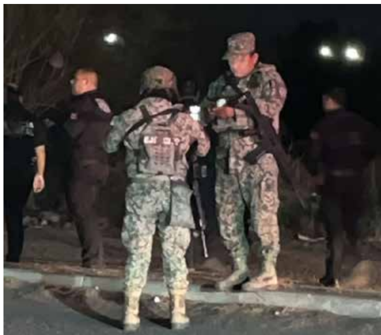
Autoridades atendieron un reporte por detonaciones de arma de fuego en el sector Villas del Rey 2 durante la madrugada de este lunes.

De manera extraoficial se informó que la mujer no ha sido identificada hasta el momento. La escena fue acordonada mientras