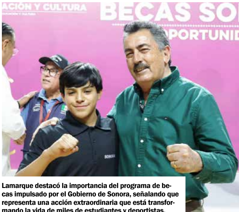
Lamarque destacó la importancia del programa de becas impulsado por el Gobierno de Sonora, señalando que representa una acción extraordinaria que está transformando la vida de miles de estudiantes y deportistas.

El alcalde reconoció que este esquema de apoyos es uno de los