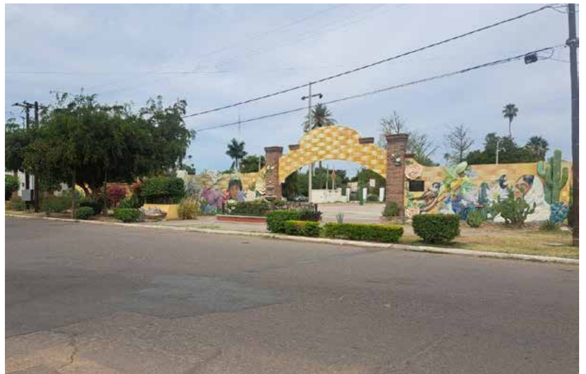
Actualmente las labores se realizan en colonias de nueva creación, así como en la colonia Campestre, San José, Doctores, La Huerta y Tajimaroa.

En cuanto a los problemas de drenaje y fugas de agua potable, comentó que actualmente son mínimos, debido a que la red hidráulica de la comunidad se encuentra funcionando en un 90 por ciento, lo que ha permitido disminuir las afectaciones a los habitantes.