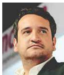
Andrés Manuel López

Morena sigue siendo la principal fuerza política en el estado, también crecen las tensiones internas entre grupos, aspirantes y liderazgos que ya comienzan a moverse rumbo a la sucesión estatal.