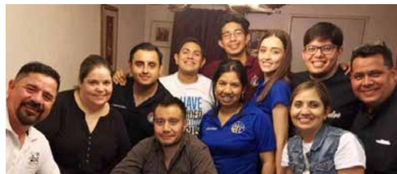
Invitan a bazar con causa para apoyar a personas con discapacidad auditiva en Hermosillo.

obtenidos serán destinados al mantenimiento del templo y a los gastos de operación de la Pastoral de Sordos, agrupación que desde hace 25 años brinda atención especializada en Hermosillo.