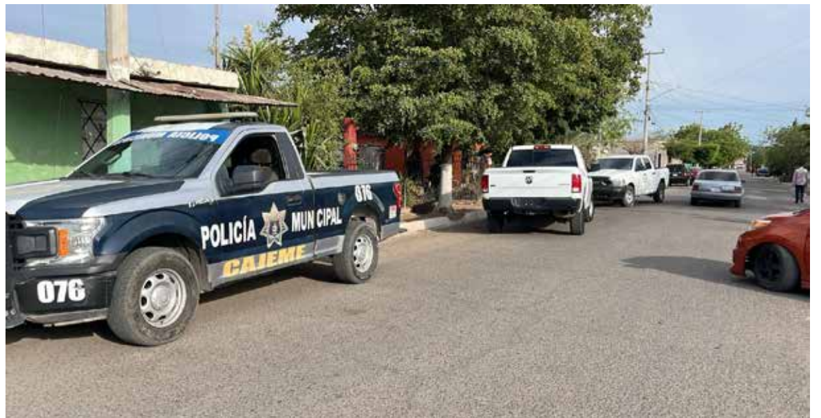
Una persona fue trasladada al hospital general tras sufrir herida en el cuello en la Luis Echeverría.

Hasta el momento se desconoce la identidad de la víctima, así como las circunstancias en las que resultó con la lesión en el cuello. Autoridades iniciaron las investigaciones correspondientes para esclarecer lo ocurrido.