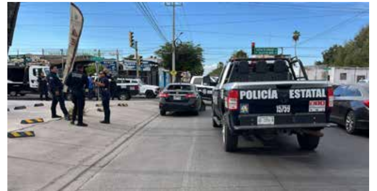
Una intensa movilización encabezada por elementos de la Marina se registró la tarde de este lunes en el cruce de las calles 6 de Abril y Coahuila