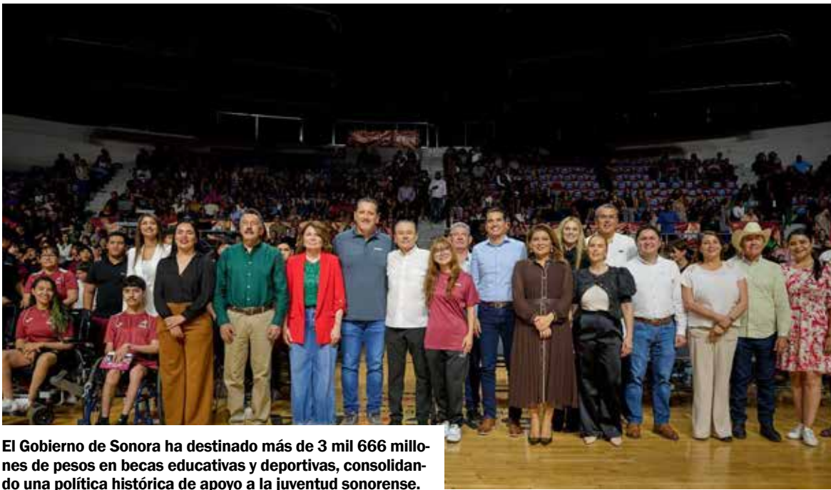
El Gobierno de Sonora ha destinado más de 3 mil 666 millones de pesos en becas educativas y deportivas, consolidando una política histórica de apoyo a la juventud sonorenses.