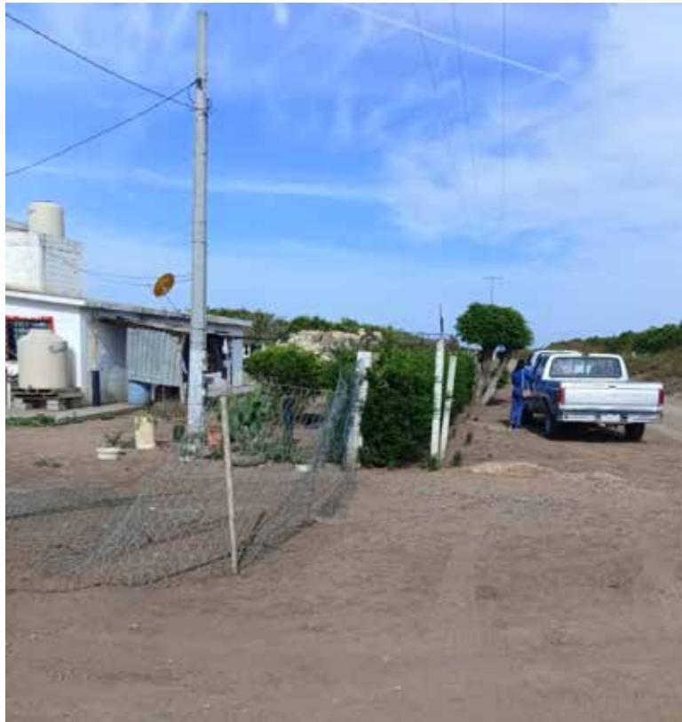
Con heridas provocadas con arma blanca y sin vida fue localizado un velador de un campo agrícola.

Tenía sus ropas ensangrentadas y al pedir la intervención de para-