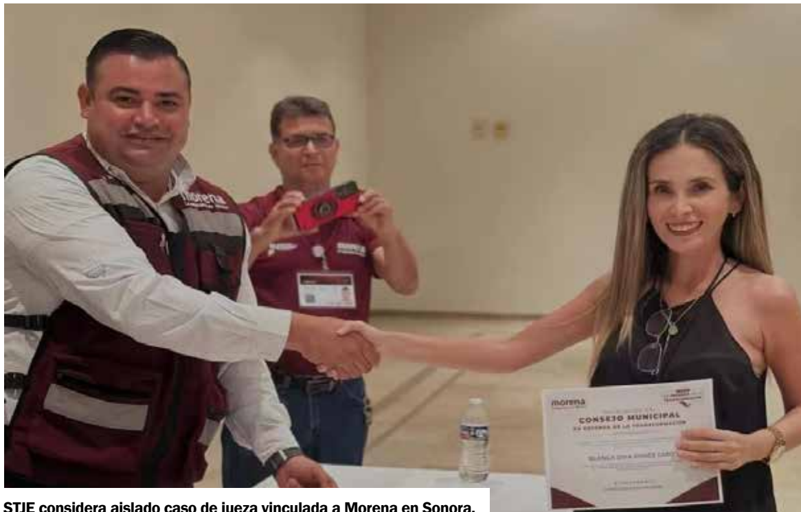
STJE considera aislado caso de jueza vinculada a Morena en Sonora.

Por ello, indicó que no considera necesario emitir exhortos o llamados especiales a jueces y magistrados sobre este tema, ya que las restricciones forman par-