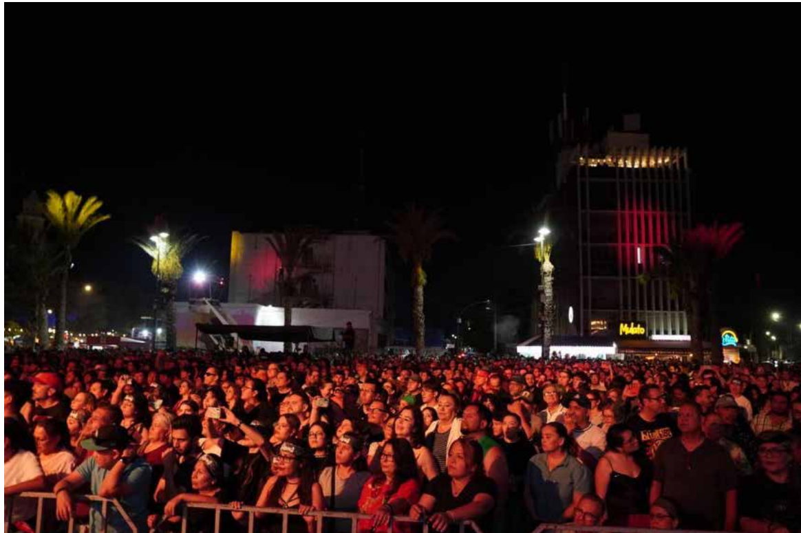
El evento concluyó con saldo blanco, una importante derrama económica y la participación coordinada de más de mil personas en labores de seguridad, logística, salud y limpieza.

El alcalde reconoció el trabajo realizado por más de mil 178 personas que participaron en labores de vigilancia, atención médica, limpieza, logística, protección ci-