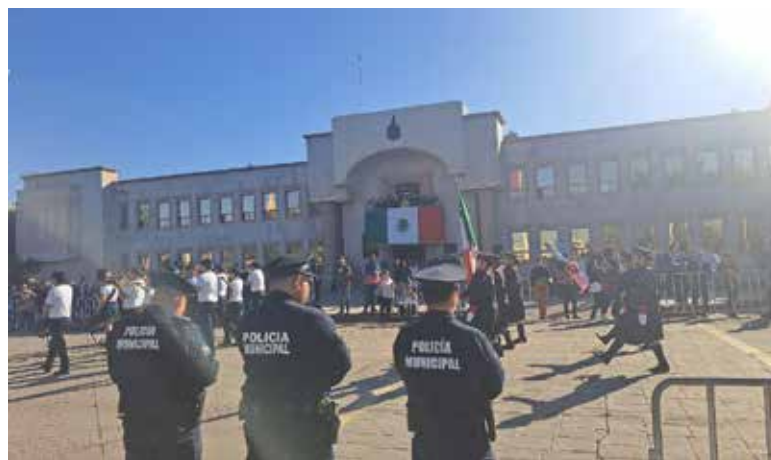
Por turno operan alrededor de 100 elementos de la Policía Municipal de Cajeme, en coordinación con corporaciones de otros órdenes de gobierno; sin embargo, esta cifra es considerada insuficiente.

CIUDAD OBREGÓN. Por turno operan alrededor de 100 elementos de la Policía Municipal de Cajeme, en