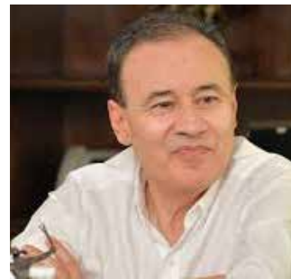
Alfonso Durazo Montaño