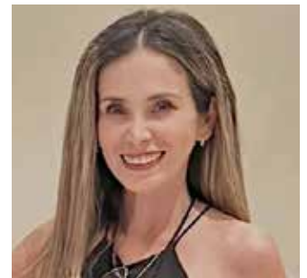
Blanca Diva Ponce Caro

El próximo primero de junio del presente año, cumplirá la mandataria nacional sus primeros dos años de que el pueblo de México se pronunció en las urnas por ella en las urnas y la convirtieron en la primera mujer, que asumiría la presidencia de este país, pero será este domingo 31 del presente mes, cuando la presidenta pronuncie a la ciudadanía de todo el país, un informe de gobierno.