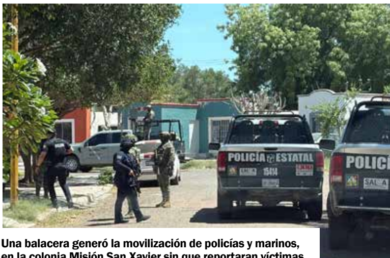
Una balacera generó la movilización de policías y marinos, en la colonia Misión San Xavier sin que reportaran víctimas.

El inmueble se localiza en la acera oriente de la Pimeria Alta,