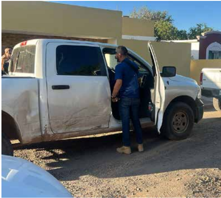
Cuando el mes de mayo está prácticamente en sus últimos días, la violencia volvió y ahora fue el fraccionamiento Urbi Villa del Rey el escenario de otro ataque armado.