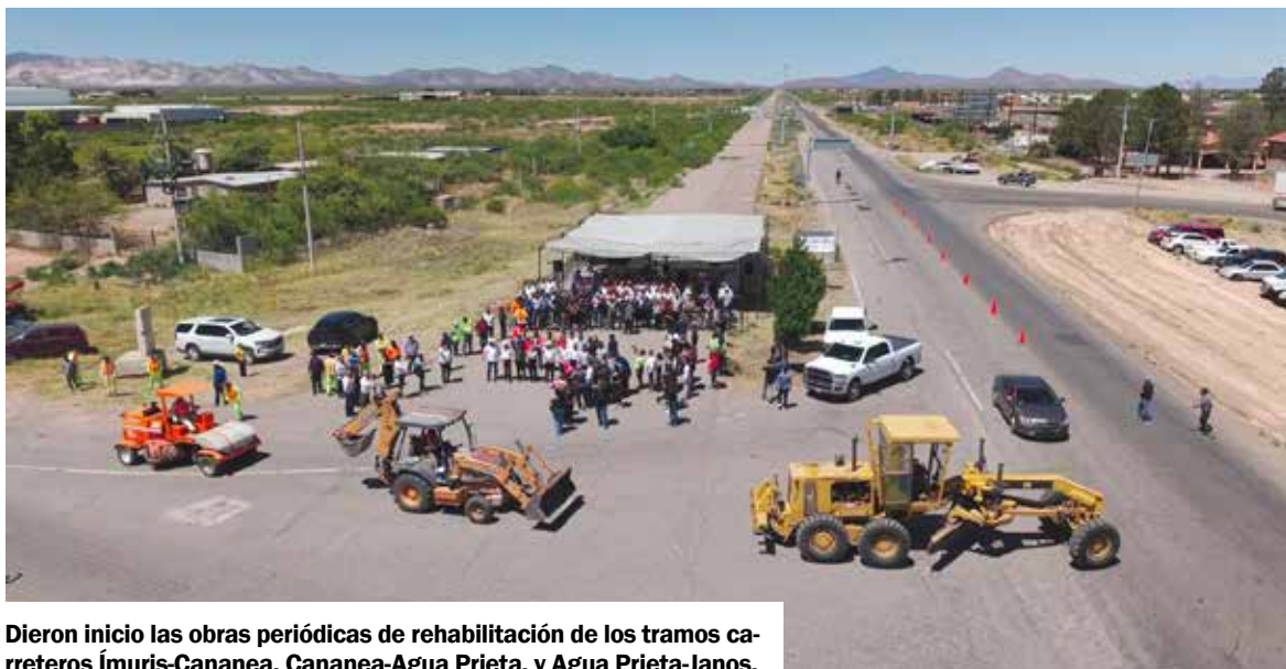
Dieron inicio las obras periódicas de rehabilitación de los tramos carreteros Ímuris-Cananea, Cananea-Agua Prieta, y Agua Prieta-Janos.