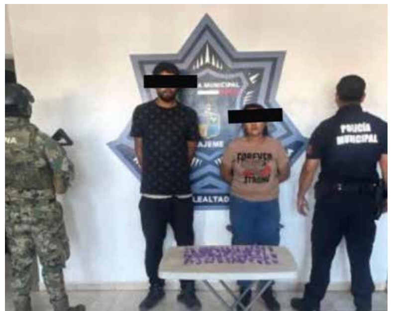
Se realizó la detención de tres personas por su probable responsabilidad en delitos contra la salud, derivado de acciones de vigilancia y prevención del delito en Cajeme.

durante recorridos de vigilancia, se detuvo a un sujeto de nombre