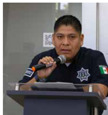
El secretario de Seguridad Pública Municipal, Alfonso Tenango Vázquez, hizo el llamado a la ciudadanía para fortalecer la cultura de la denuncia.

Entre los datos expuestos se informó una disminución del 39 por ciento en robo a comercio, reducción del 14 por ciento en robo