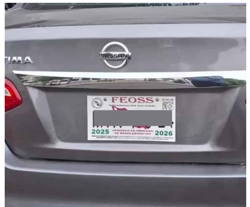
Alertan a sonorenses sobre afiliación de vehículos extranjeros.

“Recordar que los conductores deben portar licencia, seguro y afiliación vigente para evitar contratiempos durante revisiones”, culminó.