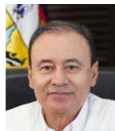
Alfonso Durazo Montaña

La información y artículos en el contenido no necesariamente refleja el criterio y sentir de esta casa editorial. Prohibida la reproducción parcial o total del contenido editorial o gráfico sin el previo consentimiento por escrito de la Dirección General. Certificado de licitud y certificación del Instituto Mexicano de la Propiedad Industrial NO. 0203830