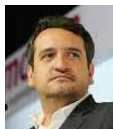
Andrés Manuel López

Aunque en varias entidades del país ya comenzaron a adelantar el cierre del ciclo escolar por las altas temperaturas, en Sonora el calendario educativo permanece oficialmente sin cambios y las clases concluirán el próximo 15 de julio. La postura del gobierno estatal, a través del secretario de Educación Froylán Gámez Gamboa, parece apostar por mantener el curso normal mientras las condiciones climáticas lo permitan, aunque dejando abierta la puerta a medidas flexibles en caso de un incremento extremo en el calor. La decisión no es menor en un estado donde las temperaturas durante junio y julio suelen convertirse en un factor de riesgo para estudiantes y personal educativo, especialmente en planteles con problemas de infraestructura o falta de refrigeración adecuada. Por ahora, los pronósticos ofrecen cierto margen de tranquilidad, pero conforme avance el verano la presión seguramente crecerá para ajustar horarios o incluso reconsiderar la permanencia en aulas. El debate también refleja las diferencias regionales del país: mientras algunas entidades optaron por priorizar la prevención ante el calor, Sonora mantiene una posición de cautela y seguimiento diario.