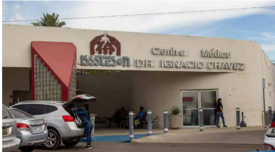
Mantiene ISSSTESON diálogo con jubilados y pensionados para mejorar servicios.

El director general del organismo, Héctor Manuel Esparza Ledezma, informó que por instrucciones del gobernador Alfonso Durazo Montañón se trabaja en distintas acciones orientadas a mejorar la calidad de la atención médica, optimizar la infraestructura hospitalaria, agilizar el acceso a consultas con especialistas y