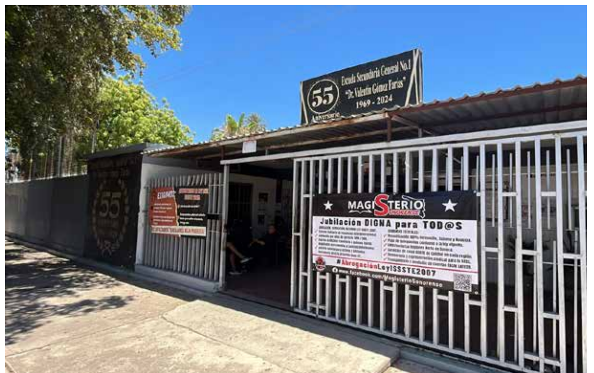
Alrededor de 30 escuelas en la región yaqui se han sumado a las movilizaciones para exigir la abrogación de la Ley del Issste.