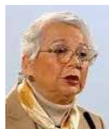
Olga Sánchez Cordero

condiciones de las instalaciones mantienen una valoración positiva entre miles de ciudadanos. Este tipo de evaluaciones no solo permiten identificar áreas de mejora, sino también fortalecer la credibilidad institucional en un organismo que desempeña un papel esencial en la vida democrática del país. La cercanía con la ciudadanía y la calidad en la atención cotidiana suelen ser tan importantes como la organización de los procesos electorales. En un contexto donde las instituciones frecuentemente enfrentan cuestionamientos y desafíos de confianza pública, contar con mecanismos de evaluación permanentes y transparentes contribuye a reforzar la legitimidad de su trabajo.