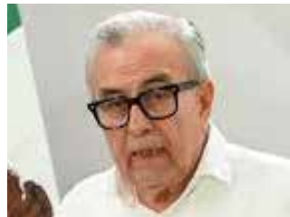
Rubén Rocha Moya