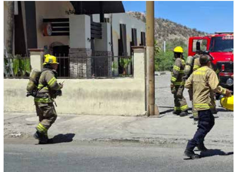
Un cortocircuito en un transformador generó un incendio la mañana del martes en el table dance conocido como 'La Habana'.

cuchillas del transformador, el cual pertenece al propio establecimiento.