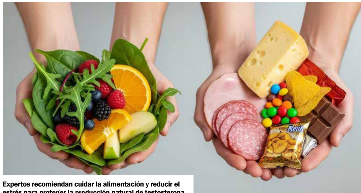
Expertos recomiendan cuidar la alimentación y reducir el estrés para proteger la producción natural de testosterona.

Expertos señalan que la comida rápida, los refrescos, la bollería industrial y otros productos con altos niveles de azúcar refinada no solo favorecen el aumento de