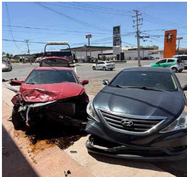
Cuantiosas pérdidas materiales dejó el choque de tres vehículos, cuando el conductor de una vagoneta no hizo, en calles Jalisco y Cajeme

se proyectó hacia la esquina sur oriente y subió a la misma para con su ángulo delantero izquierdo en el ángulo delantero derecho del Hyundai Sonata que se hallaba debidamente estacionado.