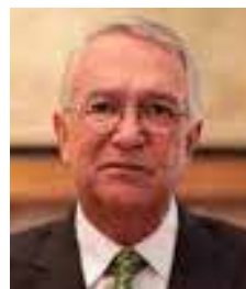
Ricardo Salinas Pliego

coincidencias o diferencias que distintos sectores puedan tener con sus posiciones, resulta innegable que su trayectoria estuvo vinculada a procesos de transformación jurídica, derechos humanos y participación de las mujeres en espacios históricamente dominados por hombres. También llama la atención que su despedida ocurra en un contexto de profundos cambios en el Poder Judicial, una reforma sobre la cual ella misma expresó reservas y planteó propuestas alternativas. Su decisión parece responder no solo a una cuestión personal, sino también al reconocimiento de que una nueva generación de liderazgos comienza a ocupar los principales espacios de decisión. La salida de figuras con experiencia acumulada siempre abre un debate sobre la importancia de preservar la memoria institucional y el conocimiento adquirido. Con su retiro concluye una etapa, pero también queda un legado que seguirá siendo referencia en la discusión pública y jurídica de México.