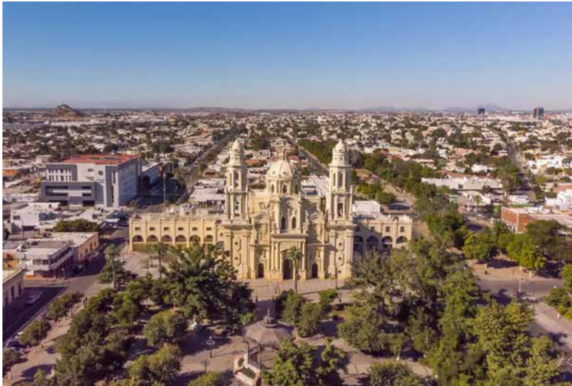
Ubican a Hermosillo en la élite de la competitividad urbana en México.

De acuerdo con los resultados del estudio, la capital sonorenses únicamente fue superada por Querétaro y Guadalajara dentro de la categoría de ciudades con más de un millón de habitantes, posicionándose por encima de importantes centros urbanos