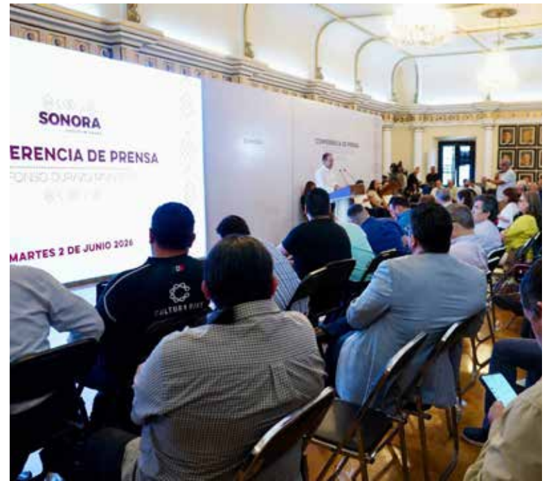
El gobernador Alfonso Durazo Montaña presentará al Congreso del Estado la iniciativa del Nuevo Modelo Institucional de Gestión Integral de Riesgos y Protección Civil.

Los foros regionales celebrados en Hermosillo, Cajeme, Nogales y San Luis Río Colorado, así como un foro estatal de conclusiones, reunieron a 656 participantes, 33 ponentes y 41 organizaciones de los sectores público, privado y social, en un ejercicio de diálogo que puso en el centro las experiencias y necesidades de las comunidades