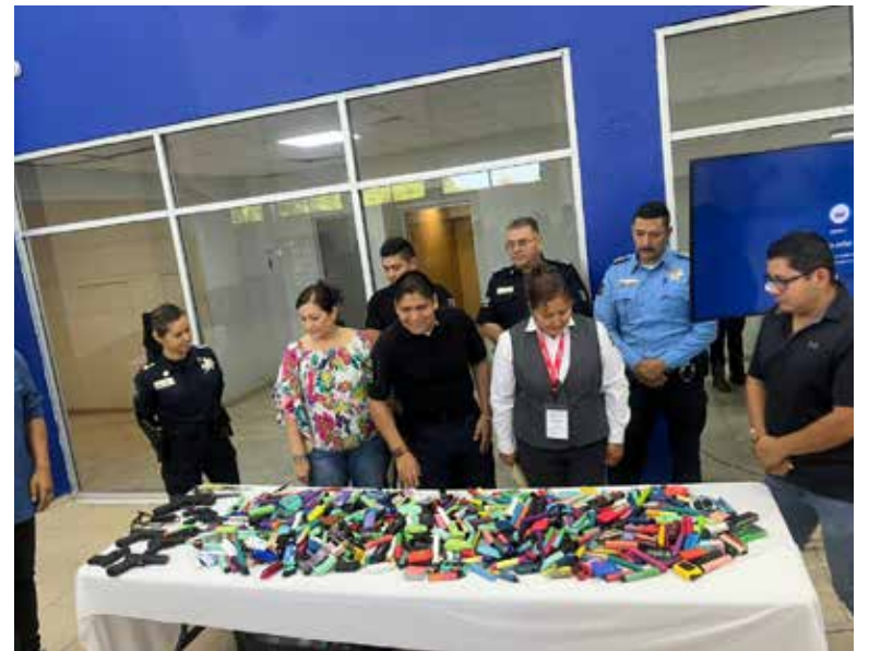
La Secretaría de Seguridad Pública Municipal informó que de enero a la fecha se han retirado 649 vapeadores y diversos objetos considerados de riesgo.

El material asegurado será entregado a la Unidad Municipal de Protección Civil y posteriormente canalizado, a través de Ecología Municipal, a centros de reciclaje especializados, con el fin de dar una disposición adecuada y responsable a los materiales con los que están elaborados estos dispositivos.