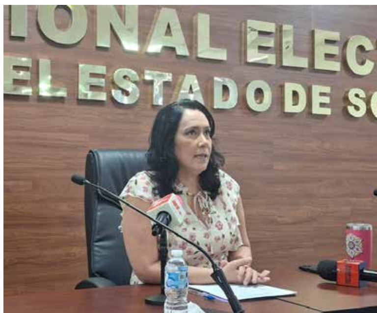
Ciudadanía avala con alta calificación atención del INE en Sonora.

“Entre los principales resultados destaca que el 97.7 por ciento de las personas encuestadas consideró mínimo el tiempo de espera para ser atendidas,