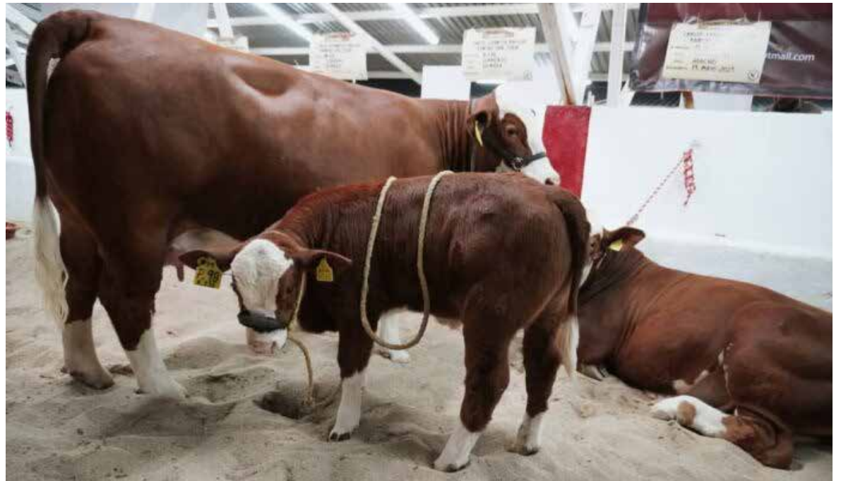
Con financiamientos accesibles, pequeños y medianos productores reciben respaldo para mejorar su producción y crecimiento.

Con estas acciones, Sidegan reafirma su papel como un instrumento clave para impulsar la productividad del campo sonorense, facilitando el acceso a financiamiento en condiciones competitivas y contribuyendo al fortalecimiento de las actividades agropecuarias en la entidad.