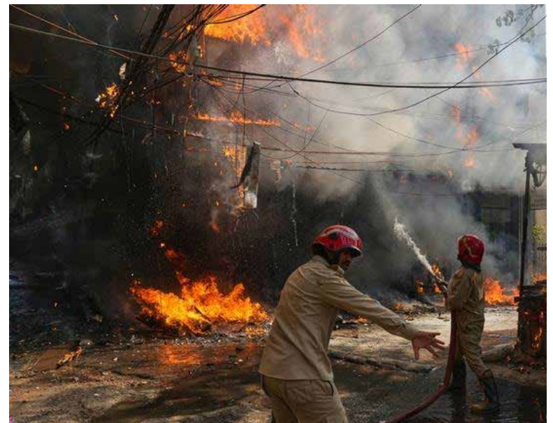
“La gente esparció colchones y una mujer del tercer piso saltó sobre ellos con un niño pequeño”, dijo un testigo.

El incendio se declaró poco antes de las 9 de la mañana hora local y se enviaron ocho camiones