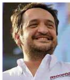
Andrés Manuel López

La participación de empresarios de Ciudad Obregón en la Comisión Arizona-México representa una oportunidad estratégica para reposicionar a Cajeme dentro de los principales circuitos de atracción de inversiones del noroeste del país. En un contexto donde diversas regiones tradicionalmente receptoras de empresas comienzan a enfrentar problemas de saturación en infraestructura, servicios y disponibilidad de espacios, municipios como Cajeme buscan aprovechar sus ventajas competitivas para captar nuevos proyectos productivos. La iniciativa impulsada por Francisco Fernández Jaramillo y otros organismos empresariales parte de una realidad evidente: la promoción económica requiere presencia constante en los foros donde se toman decisiones y se construyen relaciones entre inversionistas, autoridades y empresarios. Ciudad Obregón cuenta con fortalezas importantes como mano de obra calificada, disponibilidad de terrenos, infraestructura industrial y una ubicación estratégica para el comercio con Estados Unidos. Sin embargo, estas ventajas deben ser comunicadas de manera efectiva para competir con otras regiones que también buscan atraer capital. La plenaria de la Comisión Arizona-México ofrece precisamente ese espacio para mostrar el potencial de la región y generar contactos que puedan traducirse en inversiones futuras.