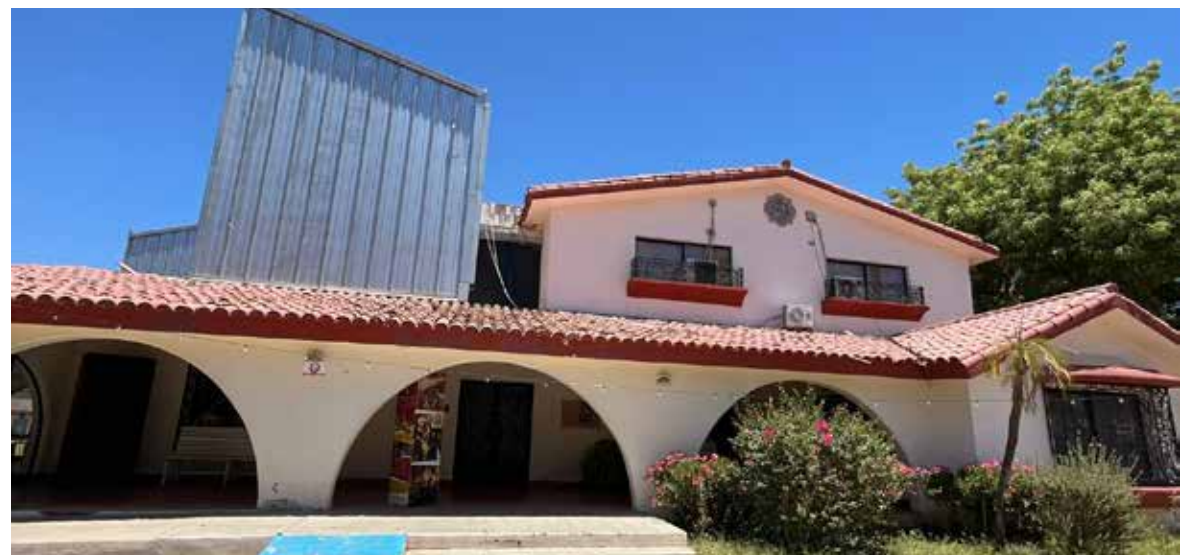
El Festival de Cortometrajes Hispanohablantes 'Generación Maldita' busca ser un espacio para nuevos creadores del cine independiente y fomentar la comunidad cinematográfica.

'De aquí de Sonora hay alrededor de cinco cortometrajes y otras personas de España... de Obregón ya hay unos y que chilo