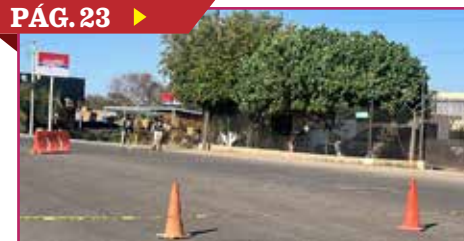
HALLAN EN LA EJIDAL UN NARCOLABORATORIO