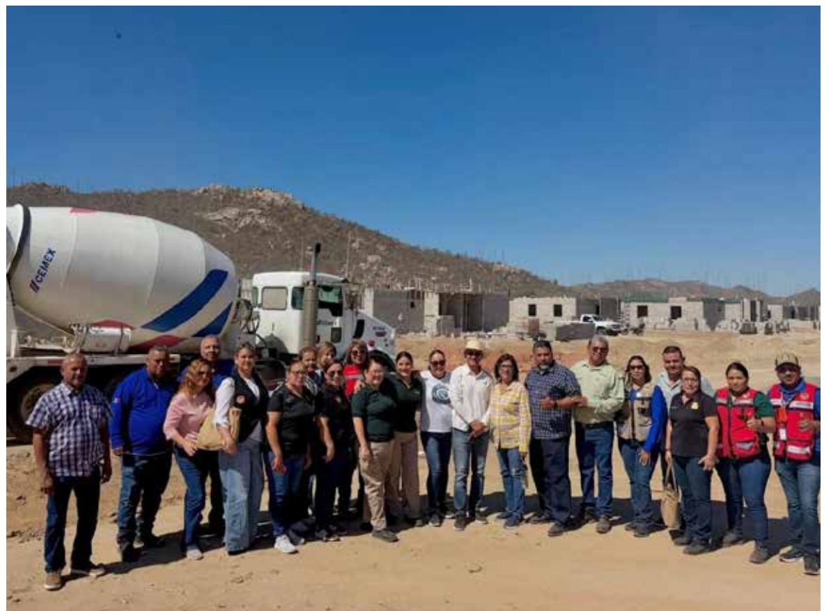
Supervisan cetemistas avance de viviendas para trabajadores en Hermosillo.

presentan una oportunidad para mejorar la calidad de vida de miles de trabajadores, al facilitar el acceso a un patrimonio propio mediante esquemas de vivienda