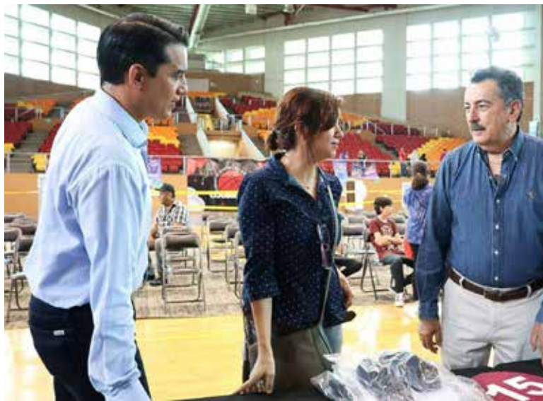
La entrega se realizará del 8 al 13 de junio en el Gimnasio Municipal ubicado por la calle 200 entre Colima y Coahuila.

El delegado de la SEC, Fausto Flores Guerrero, señaló que para el municipio se destinarán entre 70 a 100 mil paquetes conforma-