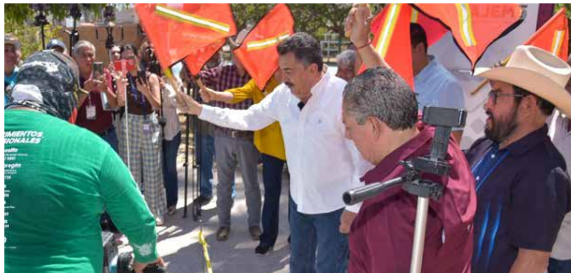
El presidente municipal, Javier Lamarque dio banderazo de inicio de obra para la rehabilitación y remodelación de la alberca del módulo deportivo de la Plaza Constitución, misma que por varias generaciones ha servido a la comunidad.

Previo al arranque de obra, Javier Lamarque señaló que el rescate de la infraestructura deportiva municipal es uno de los objetivos primordiales de su administración y del compromiso que tiene para promover el bien-