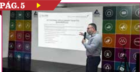
FACILITAN LICENCIA A COMERCIANTES