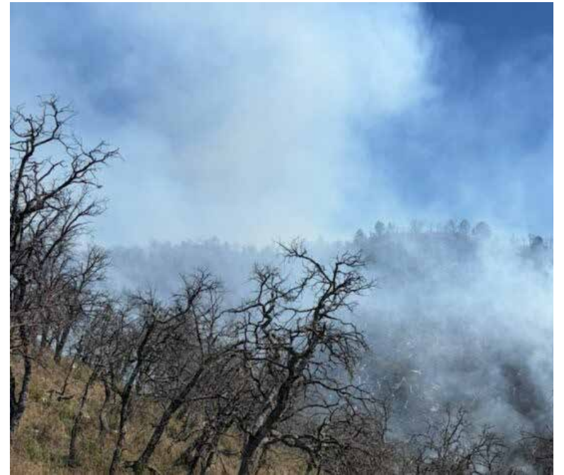
Instala San Pedro de la Cueva centro de acopio para apoyar combate de incendio forestal en la región.

“Las primeras unidades con ayuda partieron desde el día anterior y ya se encuentran en