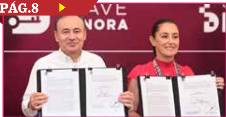
SONORA ES LÍDER EN DIGITALIZACIÓN