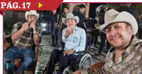
ENCIENDEN LOS ELIZALDE EL REGIONAL MEXICANO