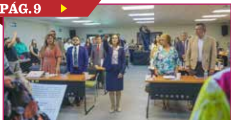
APRUEBAN CAMBIO AL CALENDARIO ELECTORAL