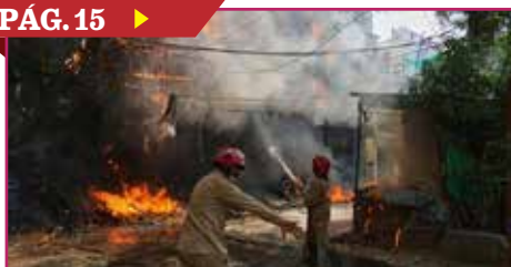
INCENDIO EN HOTEL DEJÓ 21 FALLECIDOS