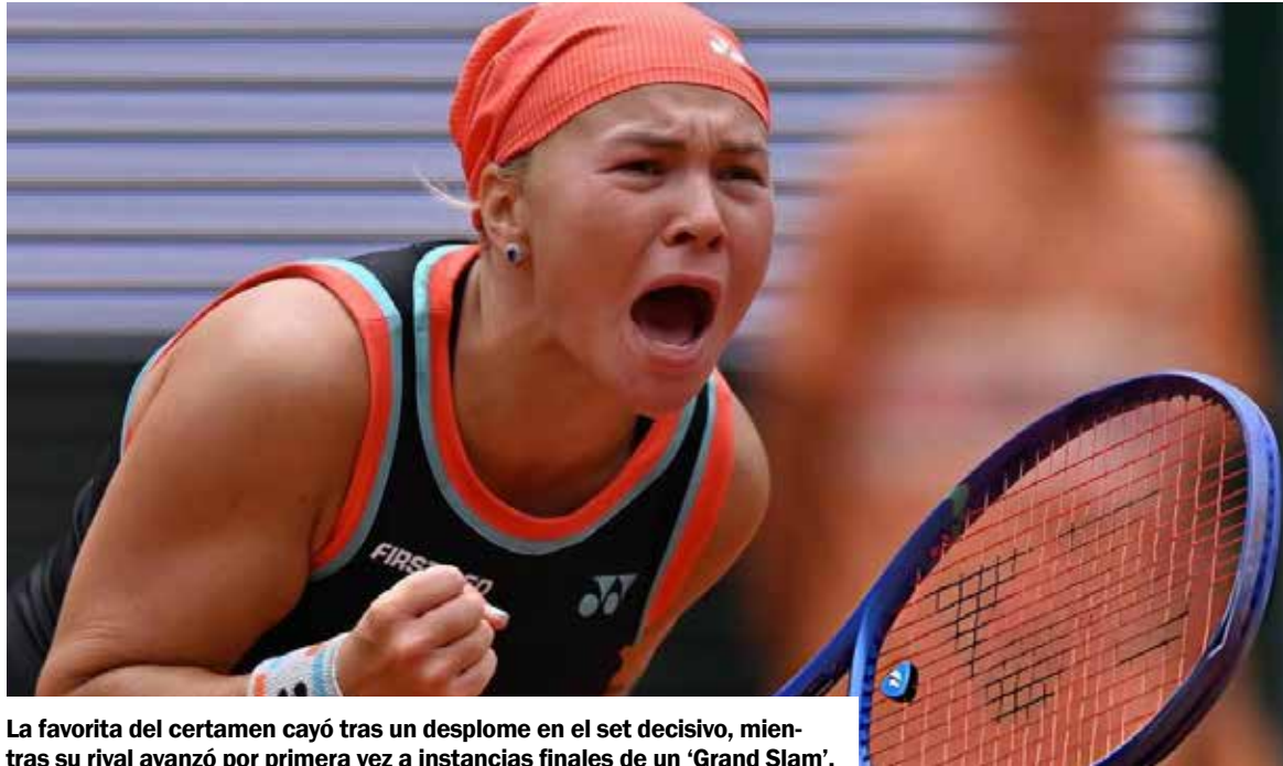
La favorita del certamen cayó tras un desplome en el set decisivo, mientras su rival avanzó por primera vez a instancias finales de un 'Grand Slam'.

La zurda número 23 del ranking se medirá por un puesto en la final a la 114, la polaca, también zurda, Maja Chwalinska, que desde la fase previa alcanzó las semifinales tras derrotar a la rusa Anna Kalinskaya, 25 del