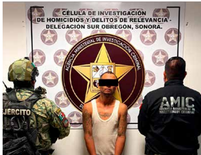
Autoridades estatales y federales cumplieron un mandato judicial contra un hombre señalado por un ataque armado ocurrido en abril.

De acuerdo con la carpeta de investigación, los hechos se suscitaron el pasado 24 de abril, cuando la víctima se encontraba en el interior de su domicilio y fue abor-