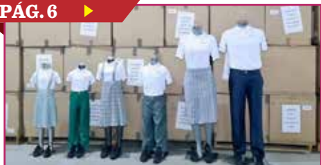
INICIA LA ENTREGA DE VALES PARA UNIFORMES