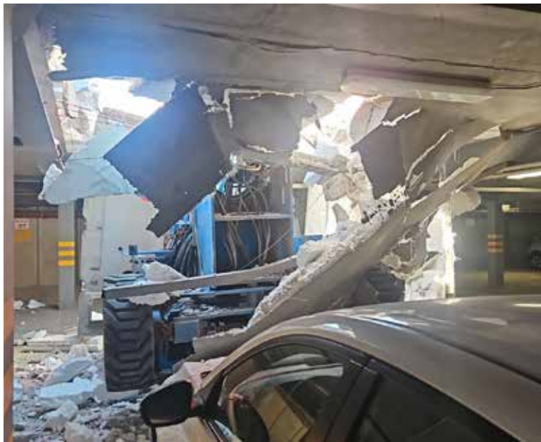
Una grúa tipo tijera utilizada en trabajos de impermeabilización se hundió repentinamente al ceder el concreto bajo su peso, provocando un aparatoso accidente que dejó a tres trabajadores lesionados.

En el exterior del inmueble, cuerpos de emergencia y paramédicos de la Cruz Roja atendie-