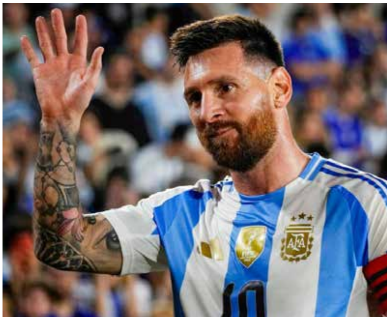
El Premio Princesa de Asturias de los Deportes para Messi es apenas el cuarto que se entrega al fútbol en la historia.

Además, resaltó que Messi se ha ganado "el respeto y admiración de todos por su ejemplar comportamiento dentro del campo y por su