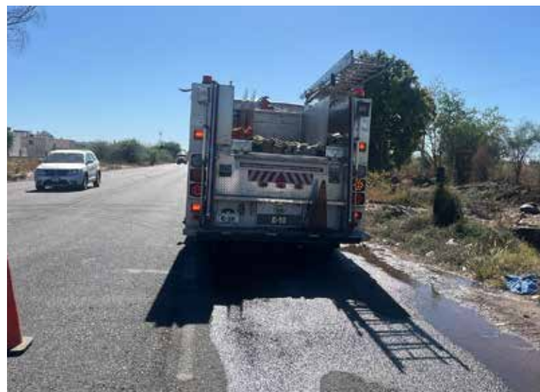
Casi de manera simultánea elementos del Departamento de Bomberos sofocaron el fuego en dos quema de basura en el poniente y sur oriente de la ciudad.

Se estableció que alguna persona no identificada le prendió fuego a una basura y este se extendió