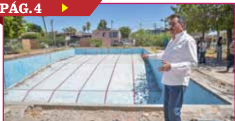
REHABILITARÁN ALBERCA PÚBLICA