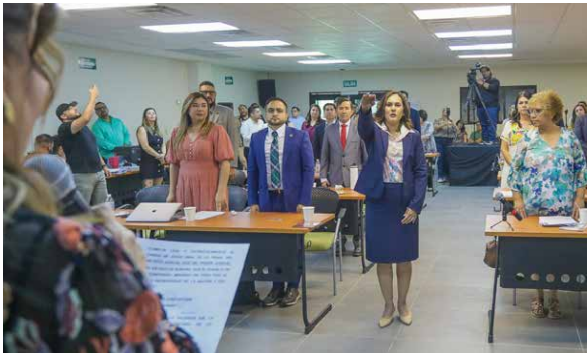
El Congreso del Estado de Sonora aprobó, por mayoría, una reforma electoral para modificar la fecha de inicio del proceso electoral ordinario y tomó protesta a una nueva jueza penal del Poder Judicial del Estado.