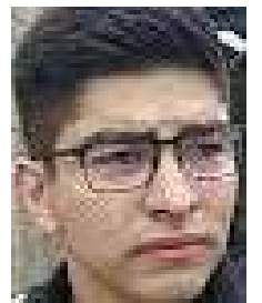
Dante Noel Talavera